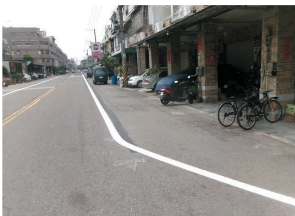
仁武區文學路一段（文南街以北） 單向一快車道配置（路面邊線收邊處理）