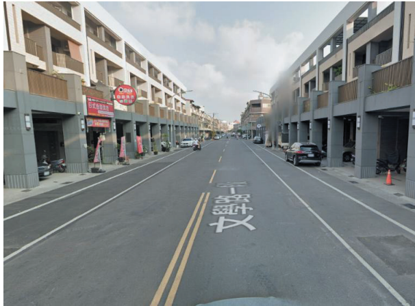
仁武區文學路一段(文南街以南) 單向一快一慢及路肩(車輛可停於路肩)