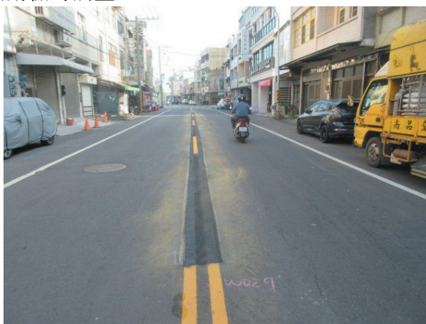
大社區三民路雙黃線調整後狀況