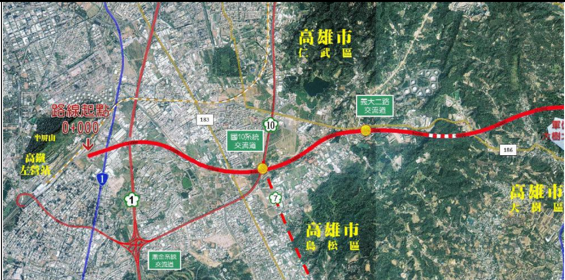
高屏第二快速公路路線圖(高雄起點端)