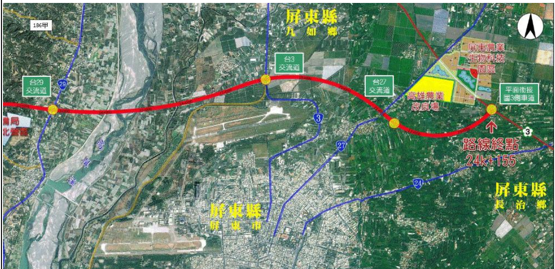
高屏第二快速公路路線圖(屏東終點端)