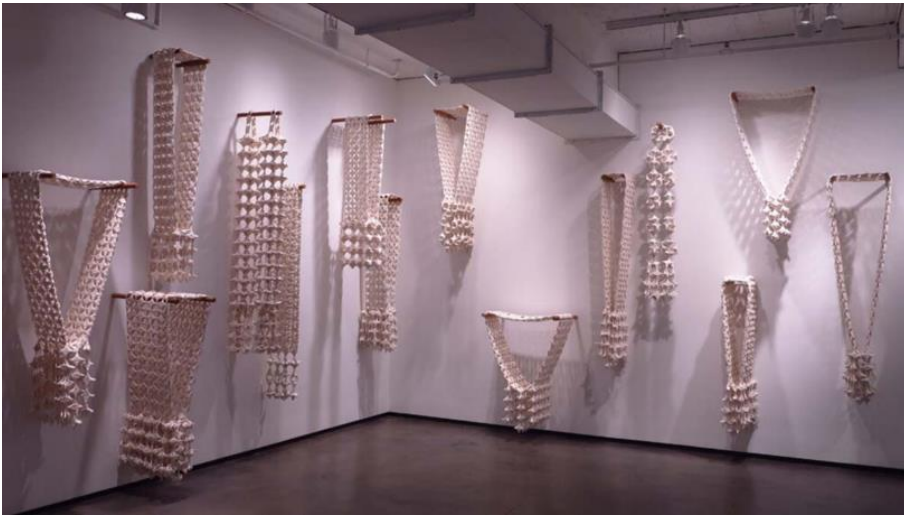
Pinaree Sanpitak Ma-lai: Mentally Secured

Installation 142.0 x 47.0 x 15.0 cm Collection of SAM