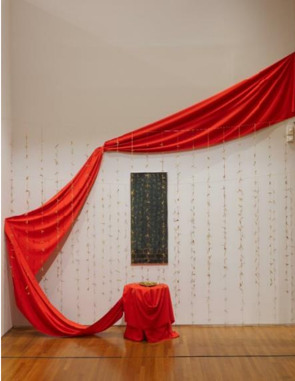
Chng Seok Tin Man Eat Man (人吃人) Installation 2006 Collection of SAM

Chng Seok Tin 擁有美國新墨西哥州立大學和愛荷華大學兩個碩士學位，主修版畫。她的作品包括素描、油畫、拼貼畫、混合媒體、紡織品、攝影、陶瓷、雕塑和裝置。1988 年 Chng Seok Tin 因外科手術而失去了大部分視力(是法律上認定的盲人)，此後她更聚焦於複合媒材和雕塑創作。她的作品涉及自然現象和人類狀況。由於她的勇氣和對藝術的貢獻，被《她的世界》雜誌評為 2001 年度女性。此件裝置作品的標題是對魯迅的里程碑式文本《狂人日記》中使用同類相食作為隱喻的致敬。