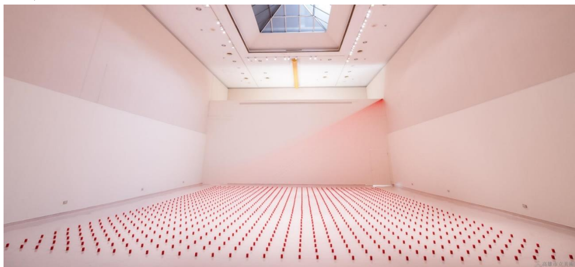
洪素珍 紅源(高美限定版) 縫衣紅線軸 2015 尺寸依空間而定 高美館典藏

創作以多媒體裝置為主，藉光、空間、聲音、影像及表演，表現出個人成長經歷及多元文化的相互影響。1976 年移居美國舊金山後，即長時間旅居於外，作品中亦能見藝術家自身感受多重文化下身份認同的複雜。洪素珍於 1980 年代即使用錄像作為創作材料，表現出在創作上的前衛與不羈，而創作的題材卻有著具東方色彩的冥想與沉思。長時間旅居於外的洪素珍，如同象徵物般的「紅」不斷地出現在藝術家的作品中，以布、線、玻璃、或是糖漿等等，藉由「紅色」象徵著自我出現在作品中，同時連結著外界或接受著外物，表現了自身不斷浸潤於文化、社會下的種種改變。裝置作品〈紅源〉，觀眾在迴環往復這些紅線間，將察覺這千百條紅線是來，也是去。這些紅線仿若是載著旅居海外多年的洪素珍往返海內外的各條航線，紅線集結的點是她的故鄉的象徵。高雄是她的歸處，也是她出發的點。