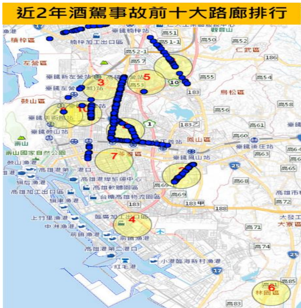
圖 2 本市近 2 年酒駕事故前十大路廊排行

本市酒駕事故高發路段集中於仁武區鳳仁路、鳳山區五甲一路、左營區華夏路等路段，都為當地主要幹道，且沿線熱炒、餐廳聚集處。