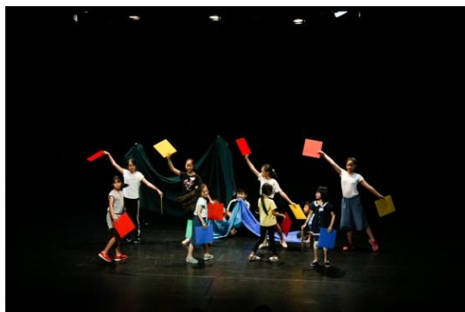
夜宿總圖-閱讀結合戲劇元素，成為閱讀劇場

夜宿活動結合總館美麗的綠建築設計與豐富藏書，與快樂鳥故事劇場聯手打造結合「知識/歡樂/新奇」，共計 27 小時的閱讀劇場初體驗。透過劇場獨特元素，帶領學員們主動探索、真實閱讀、創造思考、整合知識，並以互動戲劇為架構，透過尋找盲書、樓層闖關、戲劇排演以及肢體互動等遊戲，引導孩子天馬行空的想像，讓孩子感受「圖書館就是我家」的生活體驗，並於第二天晚上與家長分享孩子們的精采劇作。