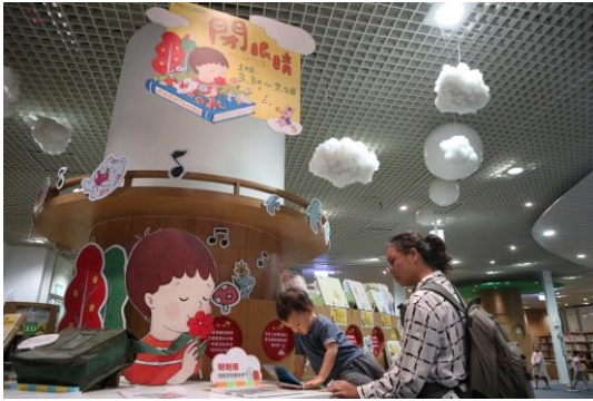
閉眼睛-跨視覺閱讀繪本主題書展