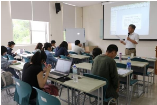
工作坊-台灣文學館蘇碩斌館長場次