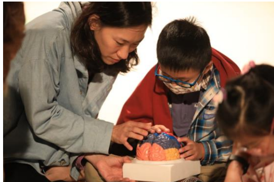
跨視覺兒童藝術創作坊-盲生場次