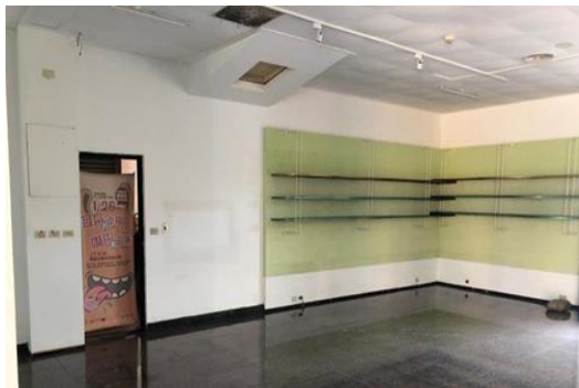
兒童美術館閒置空間改造前

召開選書會議，邀請專業委員進行兒童藝術教育選書，續進行徵集及採購，提供藝術相關主題書、圖像繪本等計1,000冊供親子閱讀。本空間配合兒美館活動開放，進館人數統計4,106人次(自9月25日啟用至12月底)。