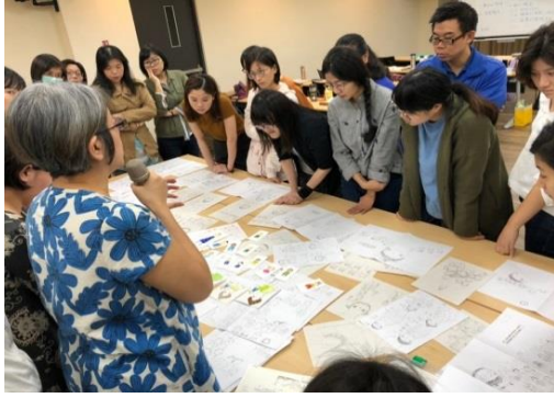
繪本創作班-上課過程