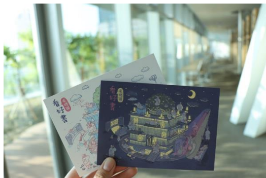
總圖日夜景商品圖