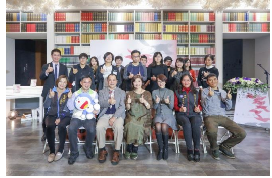
【108 年青年文學獎頒獎典禮】