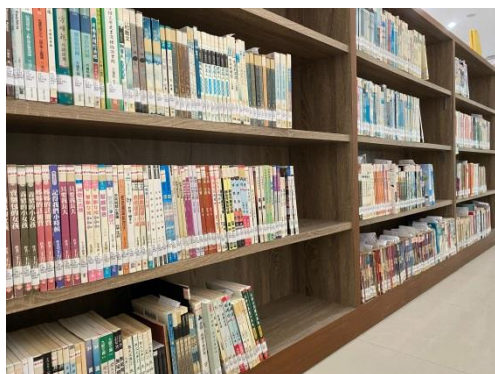
典藏室空間已安置好主題書櫃

(二) 工作計畫二：進行在地文學作品整理、收藏、徵集、展示及出版 本館之高雄文學典藏脈絡缺乏系統性整合，因此相關藏書、手稿、數位系統保存狀況不佳、資料對應混亂、難以檢索；且自2005年出版《高雄文學小百科》一書後即未再更新。因此文學館於108年初重新啟動盤點、比對並補缺資料。預計109年階段性尋求專業典藏顧問協助、逐步建置完整典藏機制及系統，以利未來高雄文學長程推廣及建置。策略包含盤點現況、建置典藏室空間、公開徵集及合作機制、典藏轉譯及推廣。