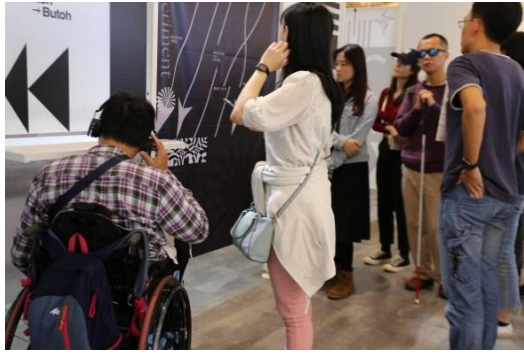
展覽期間提供免費預約口述導覽