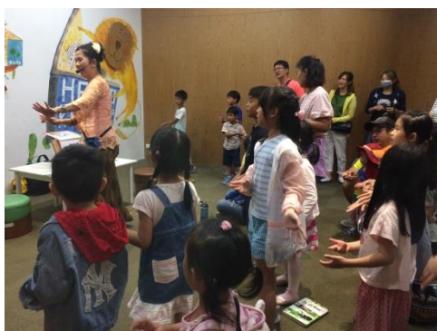
印尼故事時間活動-「學唱媽媽歌」