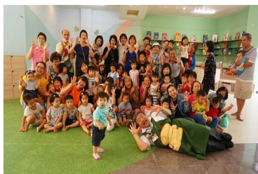
搭配胖叔叔說故事活動