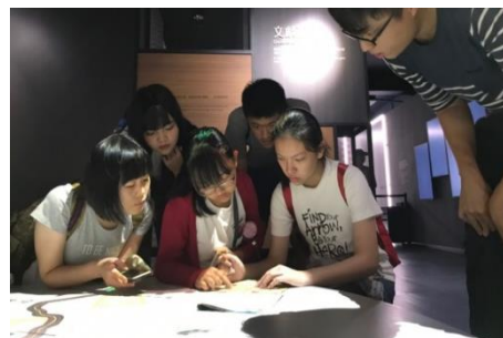
青春逗陣學堂-實境解謎