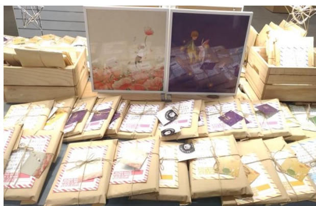
108 年度「與書的盲目約會」