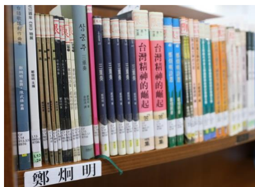
未來典藏室書籍將依照作家姓名排列，方便讀者檢索閱讀