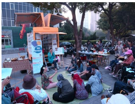
東南亞書車書車基地講座

此外，本館閱讀東南亞行動書車受邀參與高苑科技大學「悅讀家鄉的書」系列活動，藉由國際沉浸書香的時節，讓東南亞行動書車到校服務，開啟全校師生與外籍生的閱讀界線，讓留學在外的異國遊子，透過閱讀解開鄉愁，計 65 人參加。