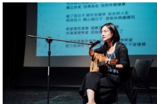
熟年好時光-創齡音樂治療之旅