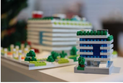
總館微型積木商品圖