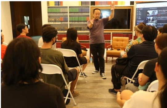
中國知名聲音藝術家顏峻以文學館場地為靈感現場演出

以文學跨領域結合當代聲音藝術熱點，透過感官記憶、實驗文學新的可能性。由文學館和高雄在地聲音藝術創作團體——耳蝸共同企劃系列活動，含有展覽、線上直播、線上專欄、座談演出等，邀集亞洲當代具代表性的聲音藝術家共襄盛舉。