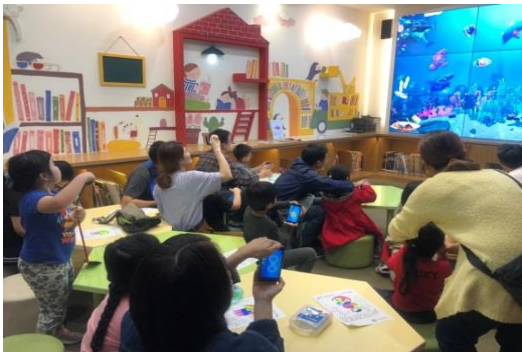
「海洋環保大作戰」AR 體驗坊

108 年度 10-12 月於國際繪本中心設置 AR 小間並引進「AR 擴增實境」，讓讀者身歷其境走入奇幻的繪本世界。透過「海洋環保大作戰」AR 體驗坊，讀者可利用行動裝置將手繪的魚「2D 轉 3D」滑入大螢幕的海洋中，透過操控 3D 的海洋動物清除海底垃圾的趣味競賽，理解海洋保育的重要性。另外還提供「互動導覽」功能，利用尋寶的概念讓讀者認識國際繪本中心內的設施，瞭解館內的各項服務。