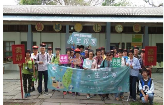
人生銀家-左營舊城慢慢遊