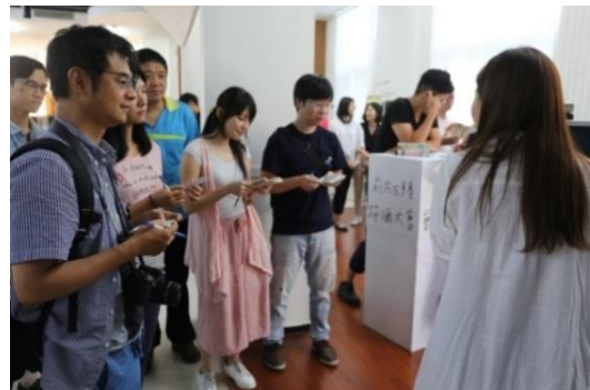
高應大文創系學生，將高雄推理作家既晴作品改編成線上文字互動遊戲