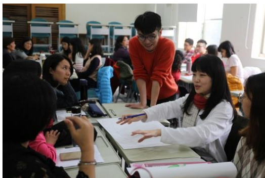
文學種子教師初階培訓營現場照

108 年新課綱讓喜愛文學的教師，有機會跳脫傳統國文教學邏輯，進入真正的「文學教育」，為了加強與學校的資源連結，文學館培訓首批「文學種子教師」，初階課程注重觸發教師的「文學感知」，進階課程則進入跨領域協作的實戰。