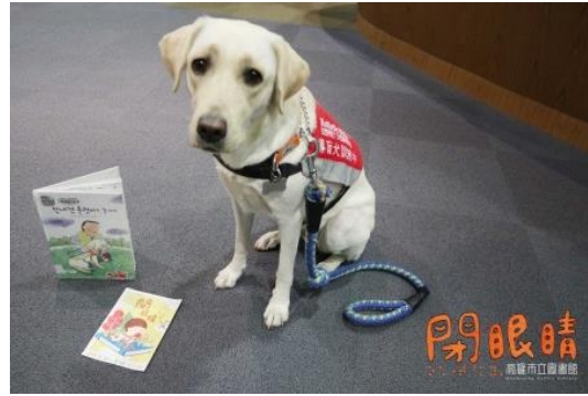
主題書展-導盲犬寄養家庭帶著實習導盲犬一起參觀