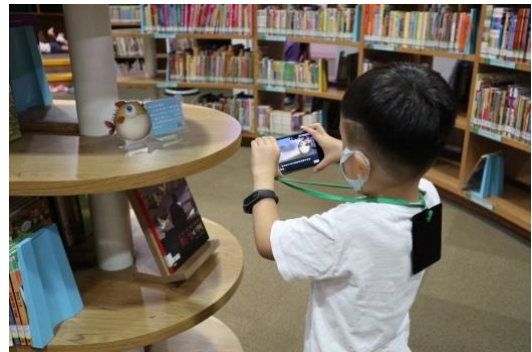
聆聽關於國際繪本中心的設施介紹