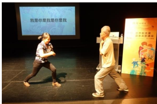
熟年好時光-世界新浪潮 創意高齡講座

共 35 間分館亦同步針對在地社區特色開辦樂齡課程，如講座、主題書展、說故事、藝術創作、桌遊、電影欣賞、讀書會、科技學習、健身活動等，共辦理 68 場次活動，總計 20,576 人次參加。