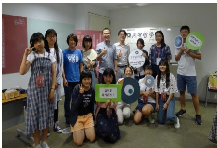
青春逗陣學堂-哲學桌遊

108 年度活動以「思辨的探險」為主題，培養學生批判思考的能力，以理性分析資訊真實性，從不同的角度看待公共議題，進而提升社會實踐的使命。本館期望藉由領域專家講授學科知識，並透過問題討論、戶外走讀及團隊合作等方式，讓學員領略各學科的深度與意涵，增強對在地城市社會關懷、實踐與連結。共吸引 101 位學生報名、審核後參加人數 60 人。