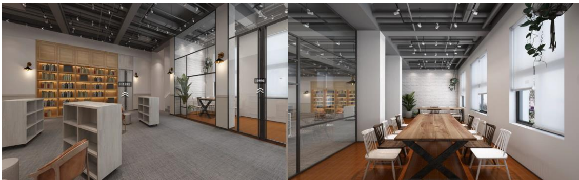
文學沙龍-設計示意圖

文學館獲補助執行108-109年博物館及地方文化館提升計畫（資本門），為符合未來更多元型態的活動辦理、及典藏和企劃展示功能，將改造原有一樓書櫃空間為主題展覽室、一樓大廳中間設立文學情報站；二樓原書櫃空間改為文學沙龍，原高雄文學專區改為文學播映室；原專區則配合典藏業務的擴展，移轉至原多功能教室空間。