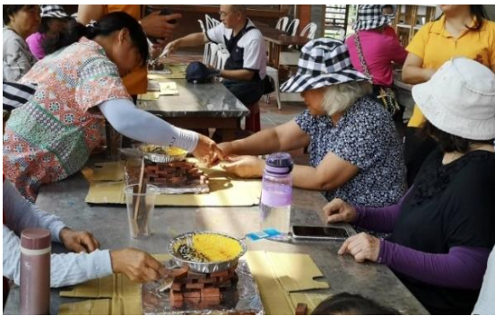
大樹二館走訪百年瓦窯銀光窯藝風雲起

共辦理 115 場，含走讀活動 9 場、書展 43 場、手作研習活動 63 場，總計 23,672 人參加。