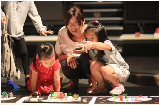
跨視覺兒童藝術創作坊-一般生場次