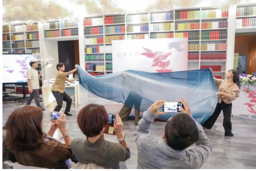
【108 年青年文學獎頒獎典禮】