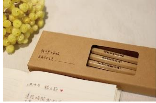
圖書館悄悄話系列秘書筆商品圖