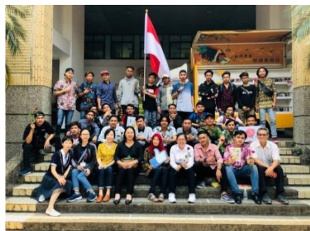
高苑科大「悅讀家鄉的書」活動