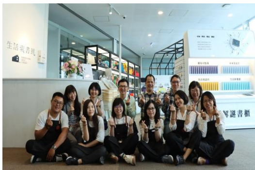
108 年 12 月 21 日開幕照

有別於傳統委外的經營模式，108 年集結跨閱覽、多元、推廣及研發等部門的同仁成立品牌小組，並邀請品牌、策展、展售等領域之顧問進行討論。《生活索書號》於 108 年 12 月 21 日試營運，販售自製品：「總圖日夜景」、「考生系列」、「圖書館悄悄話」、「總館積木」等多達 14 項商品，並進行生活創意選物，展現「閱讀高雄」與「高雄閱讀」的精神。截至 109 年 1 月底止，共計消費客數近 900 位，銷售品項數達兩千件，銷售淨額近 26 萬元，媒體露出計 8 則(統計自 12 月 21 日至 1 月底)。