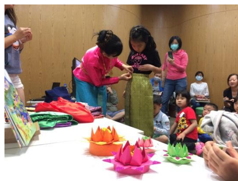
11月泰國故事時間搭配水燈節活動