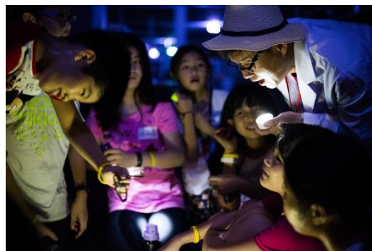
夜宿總圖-小朋友們在館中書架間探險，在閱讀裡解開謎題。