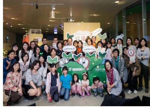
好繪芽萌芽紀錄展開幕大合照