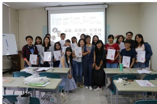
進階培訓課程頒予文學種子教師認證