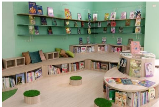
兒童美術館閱讀樹書屋