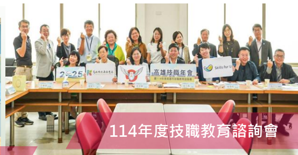
114年度技職教育諮詢會