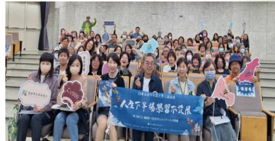
辦理「人生下半場·學習不設限」論壇 促進中高齡者透過社大課程實踐公共參與