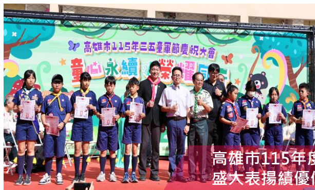
高雄市115年度三五童軍節大會 盛大表揚績優個人與團體