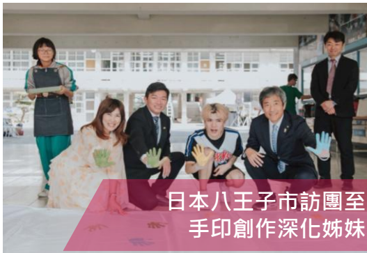
日本八王子市訪團至壽山國中交流 手印創作深化姊妹市友好情誼