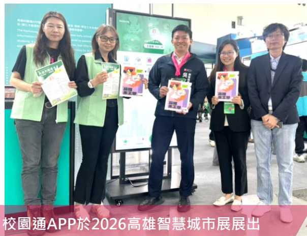
校園通APP於2026高雄智慧城市展展出