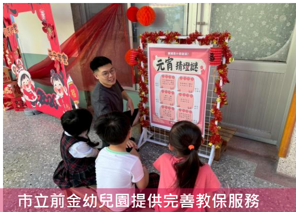
市立前金幼兒園提供完善教保服務 引導幼兒發展