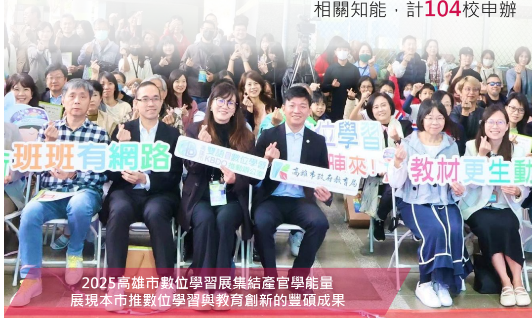
2025高雄市數位學習展集結產官學能量 展現本市推數位學習與教育創新的豐碩成果

生成式AI技術與發展趨勢、 AI技術在教學中應用實例、 AI倫理與責任，提升教師AI 相關知能，計 104 校申辦