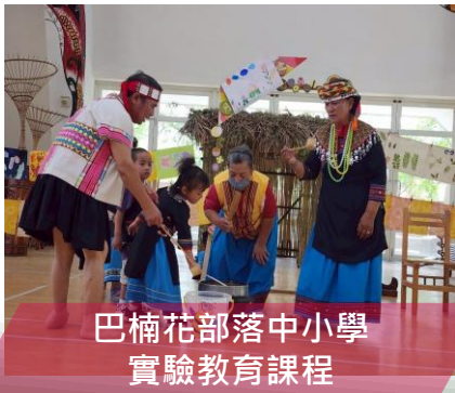
巴楠花部落中小學 實驗教育課程