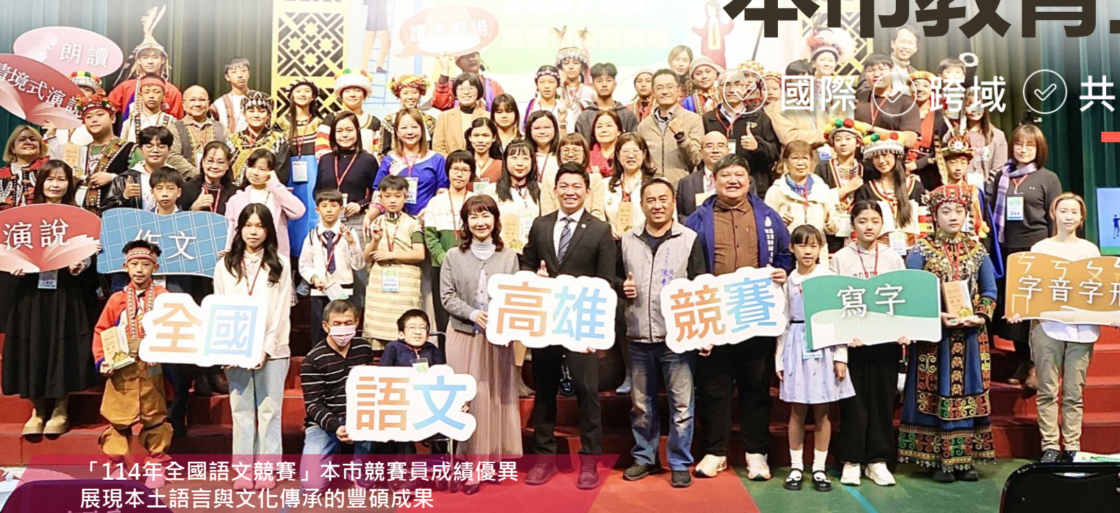
「114年全國語文競賽」本市競賽員成績優異 展現本土語言與文化傳承的豐碩成果