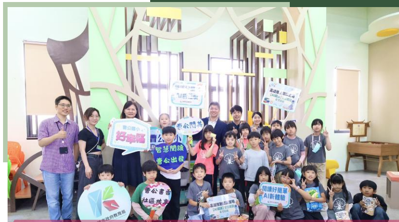
曹公國小打造智慧閱讀環境 AI 智慧閱讀機開啟學童閱讀新體驗