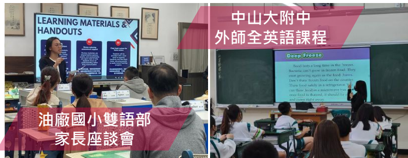
中山大附中 外師全英語課程