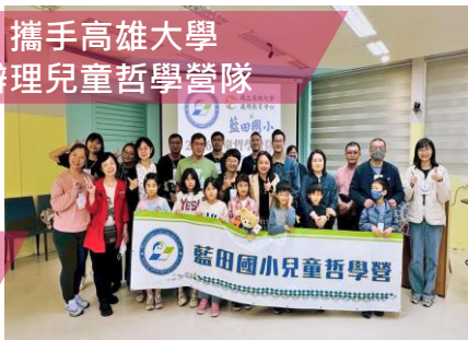
攜手高雄大學 辦理兒童哲學營隊