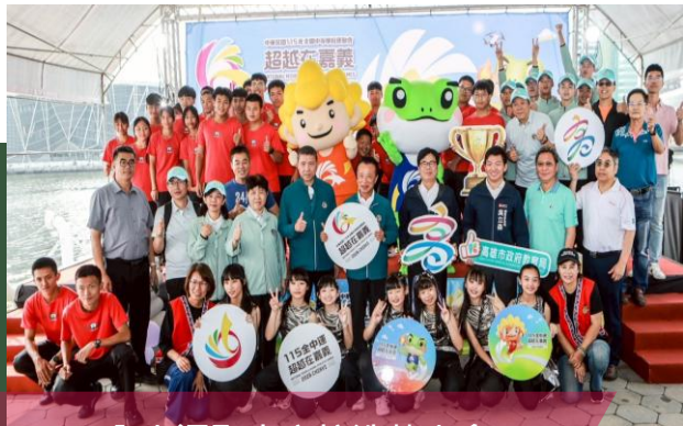
115全中運聖火交接造勢大會