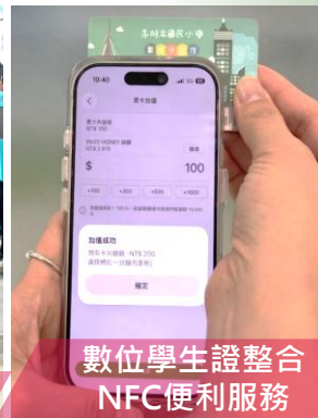
數位學生證整合 NFC便利服務