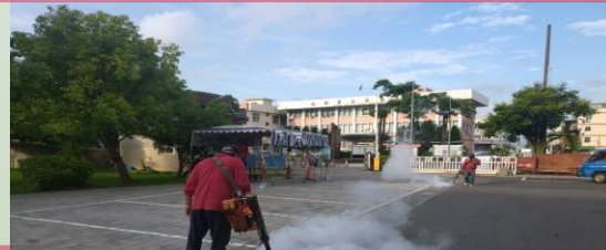
快速掌握疫情資訊 開口契約緊急噴藥