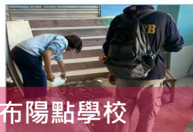
公布陽點學校 追蹤輔導改善

高雄市政府環境保護局 Environmental Protection Bureau Kaohsiung City Government