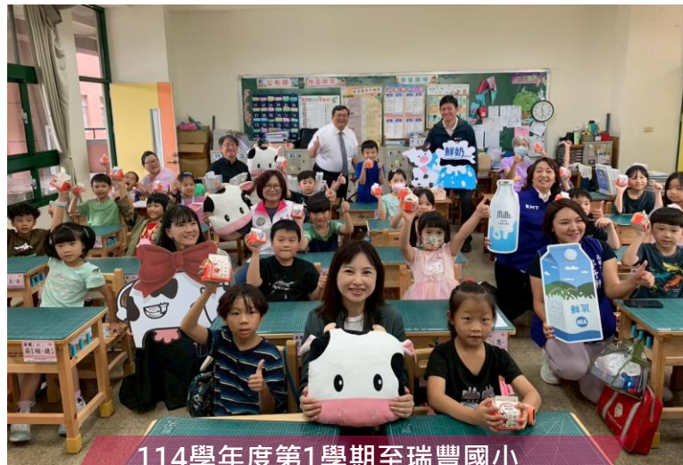
114學年度第1學期至瑞豐國小 關心學童午餐及乳品飲用情形