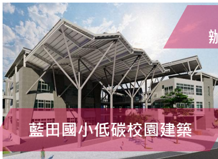
藍田國小低碳校園建築