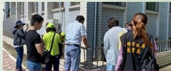
與教育部國教署合作、市府跨局處共同防堵疫情