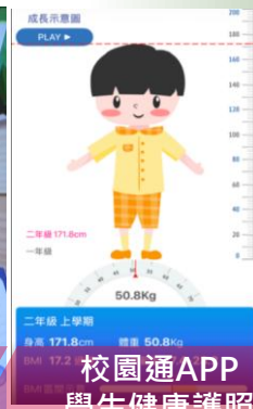
校園通APP 學生健康護照