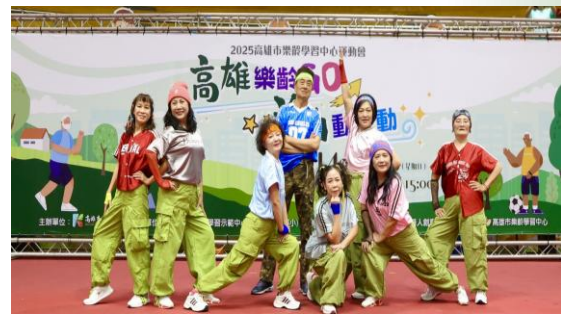
辦理「高雄樂齡運動會」 鼓勵長輩培養規律運動習慣