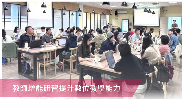
教師增能研習提升數位教學能力