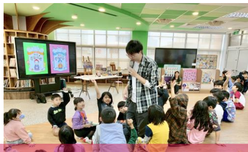
鹽埕區忠孝國小邀請繪本作家及說故事達人帶領學童感受閱讀魅力