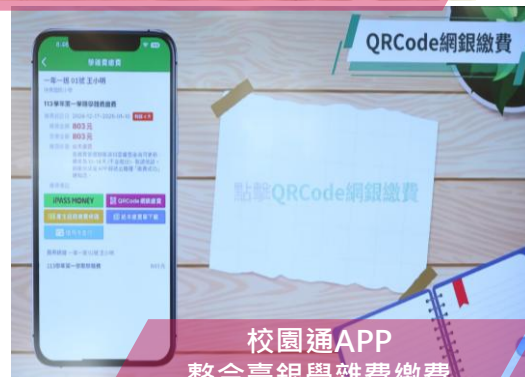
校園通APP 整合臺銀學雜費繳費