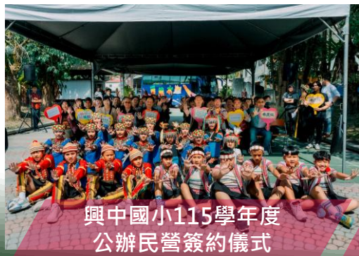
興中國小115學年度 公辦民營簽約儀式