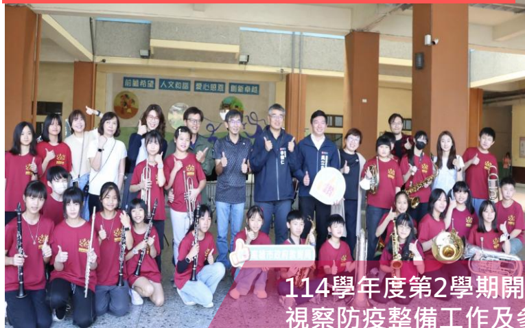
114學年度第2學期開學首日至瑞興國小視察防疫整備工作及參與傳染病防治宣導