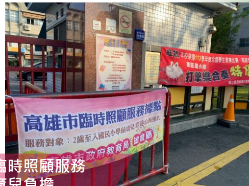
定點辦理臨時照顧服務 減輕家長育兒負擔