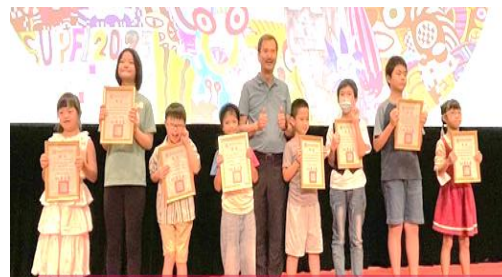
高雄市特教生藝術創作聯展 在藝術中學習相互尊重、包容、欣賞彼此的美好與特別