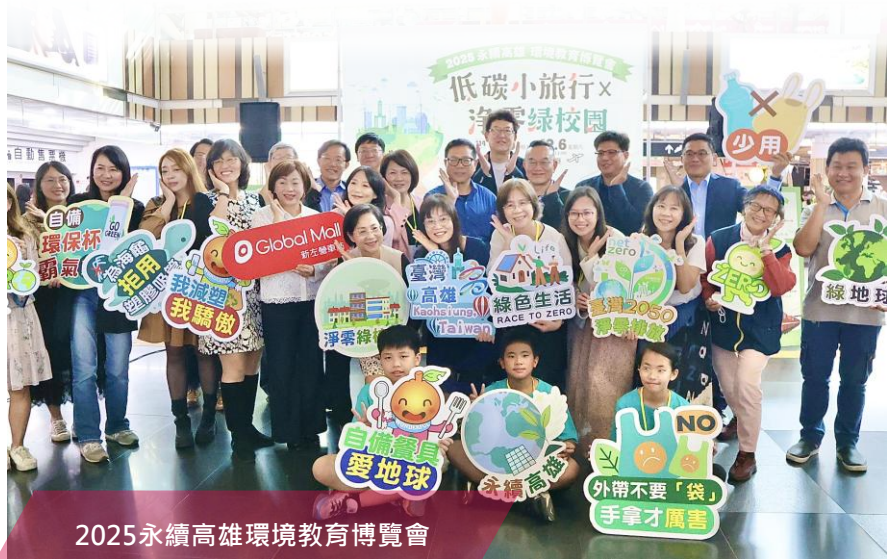
2025永續高雄環境教育博覽會