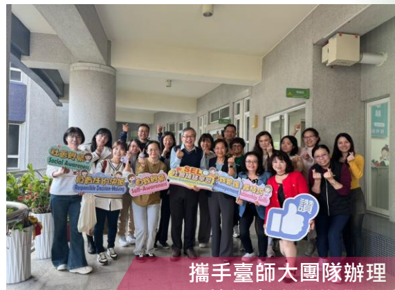
攜手臺師大團隊辦理 SEL教師在職進修學分班