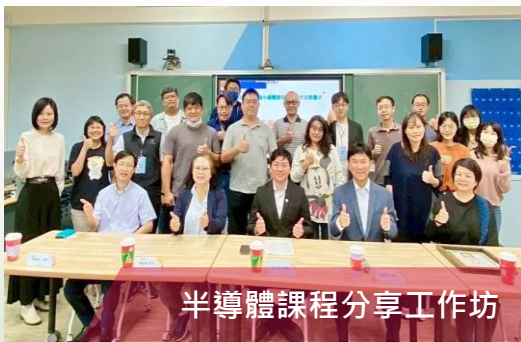
半導體課程分享工作坊