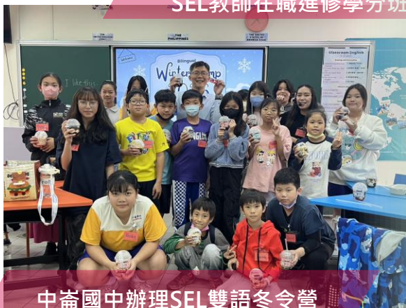
中崙國中辦理SEL雙語冬令營