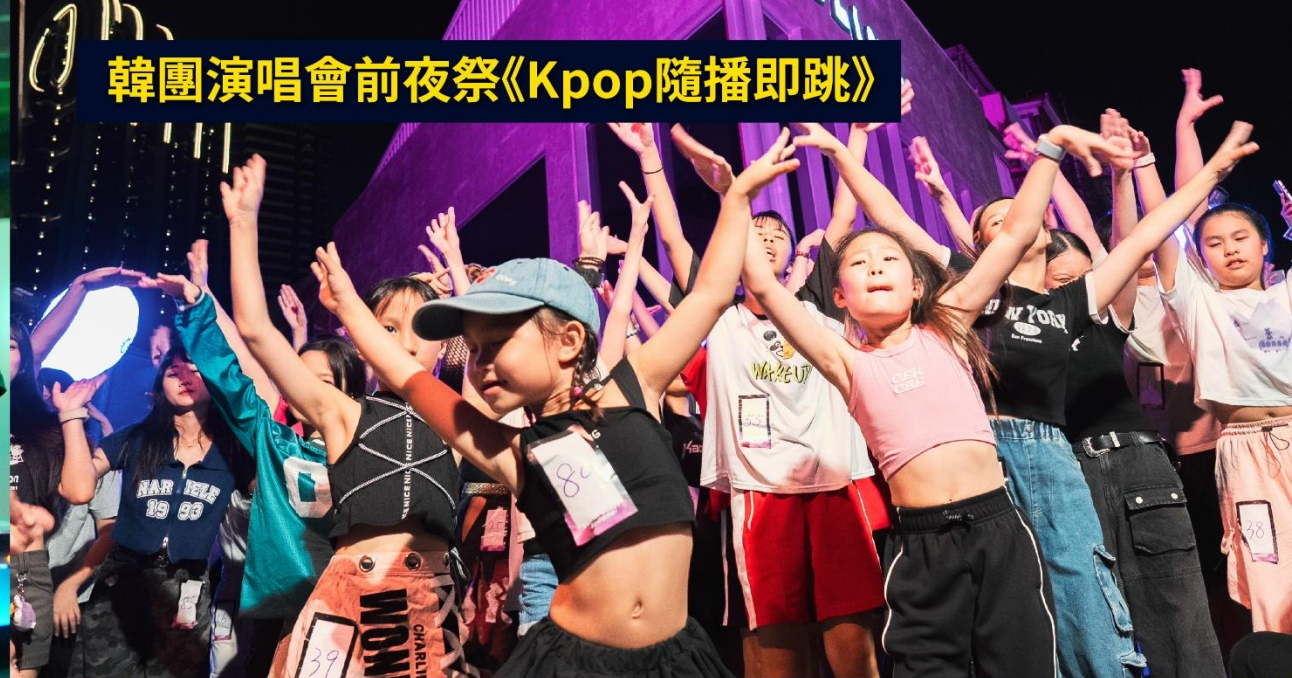
韓團演唱會前夜祭《Kpop隨播即跳》