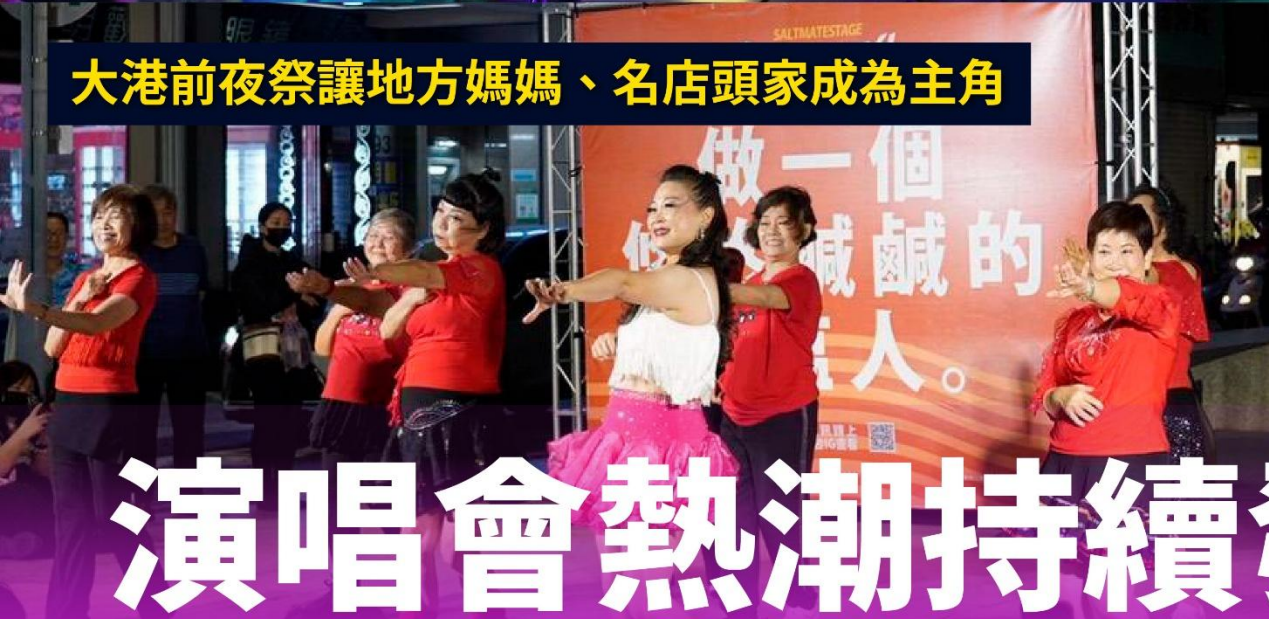
大港前夜祭讓地方媽媽、名店頭家成為主角