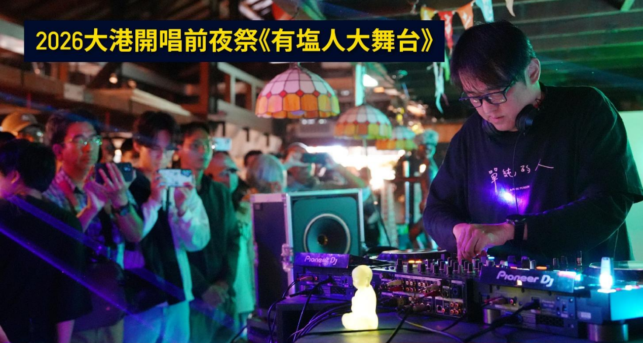
2026大港開唱前夜祭《有塩人大舞台》