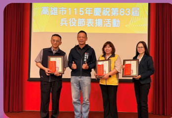
表彰基層績優役政單位