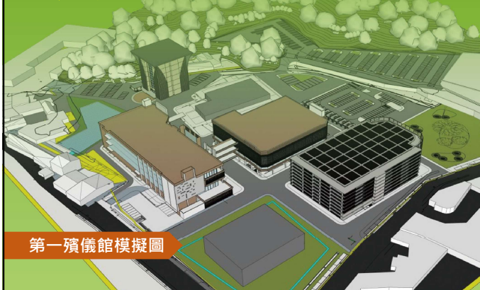
第一殯儀館模擬圖