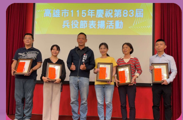
表彰基層績優役政人員