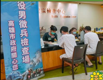
落實役男兵役體檢