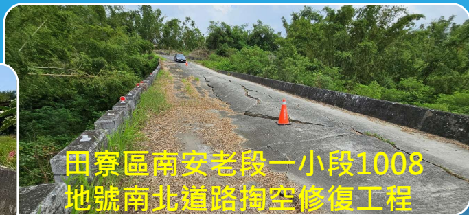
田寮區南安老段一小段1008 地號南北道路掏空修復工程

114年丹娜絲颱風及0728豪雨C2類工程已協助 燕巢等6區公所爭取國土署核准災後復建工程經費 計33件，約5,677.9萬