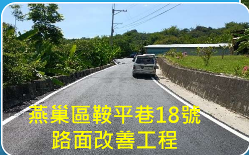
燕巢區鞍平巷18號 路面改善工程