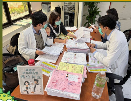
嚴謹役男體位判等