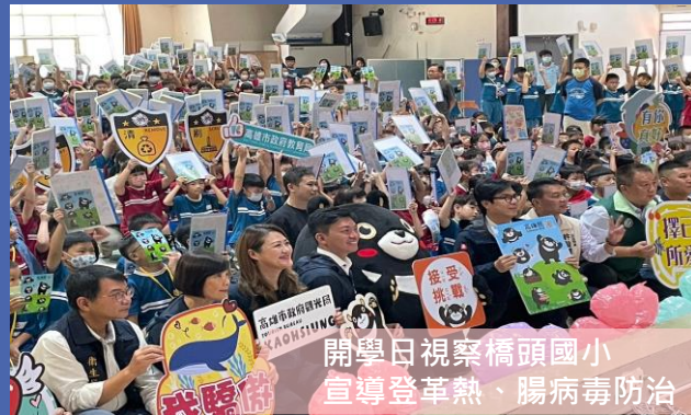
開學日視察橋頭國小 宣導登革熱、腸病毒防治