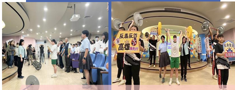
與鼓山高中舉重隊選手，共同宣示啟動「友善校園」