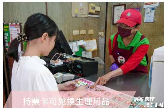
持票卡可兌換生理用品