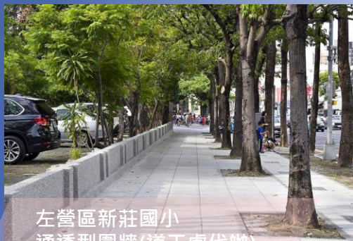
左營區新莊國小 通透型圍牆(道工處代辦)