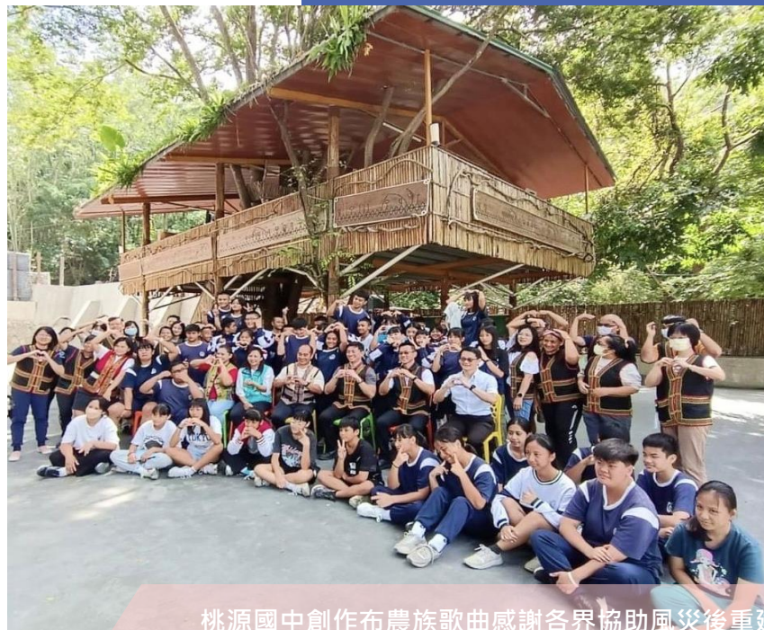
桃源國中創作布農族歌曲感謝各界協助風災後重建