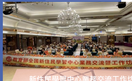
新住民學習中心業務交流工作坊