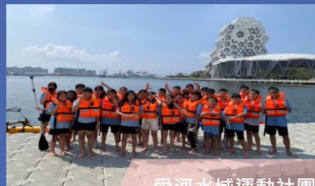
愛河水域運動社團