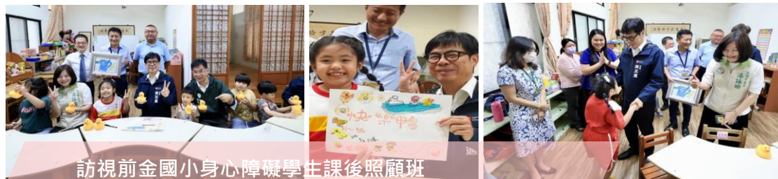
訪視前金國小身心障礙學生課後照顧班