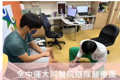
全中運大同醫院隨隊醫療團