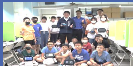
一甲國中AI機器人暑期營隊