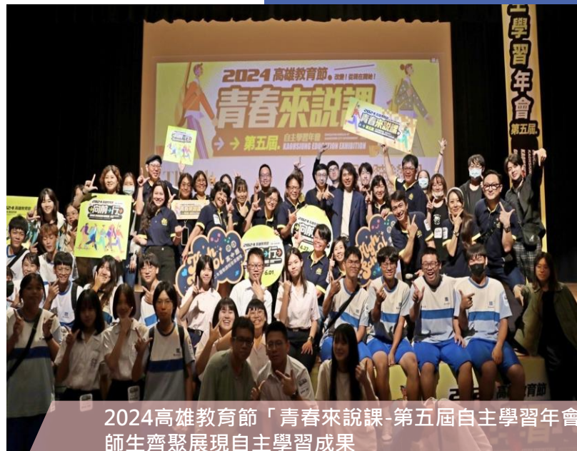
2024高雄教育節「青春來說課-第五屆自主學習年會」 師生齊聚展現自主學習成果