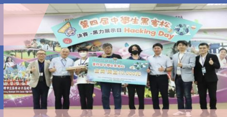
第4屆中學生黑客松競賽頒獎