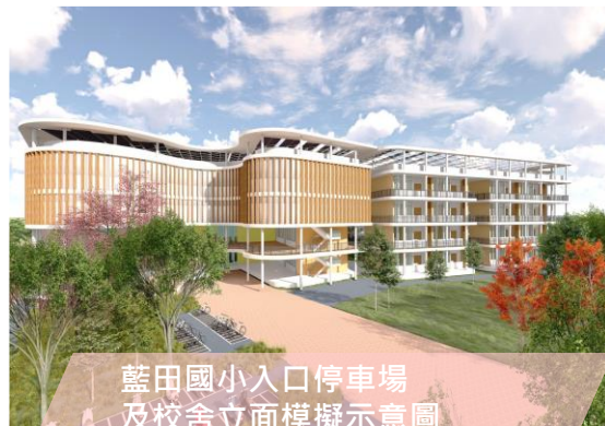
藍田國小入口停車場 及校舍立面模擬示意圖

已滿足在地就學需求 以本市為單位採 免試 就學區 ，113學年度 高雄區招生名額總數 大於報名總人數