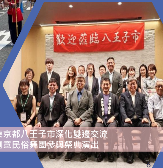
本市訪問東京都八王子市深化雙邊交流 中華藝校創意民俗舞團參與祭典演出