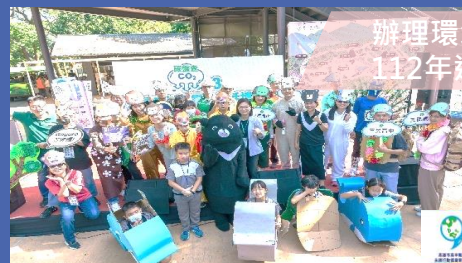
辦理環境教育成果展， 112年達1.2萬人次參與