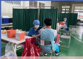
鳳山國中流感疫苗接種工作