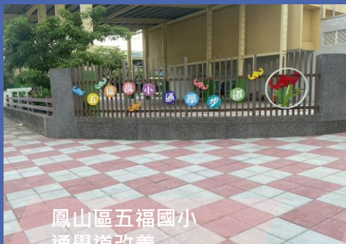
鳳山區五福國小 通學道改善