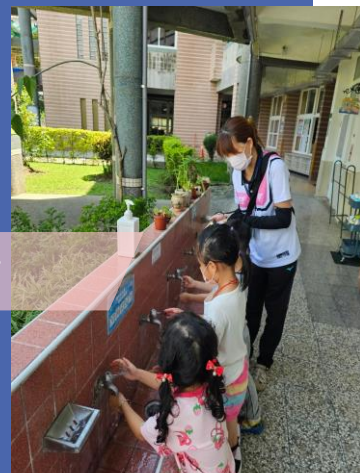
偕同衛生局查察腸病毒防治工作