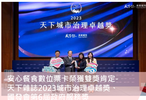
安心餐食數位票卡榮獲雙獎肯定- 天下雜誌2023城市治理卓越獎、 國發會第6屆政府服務獎