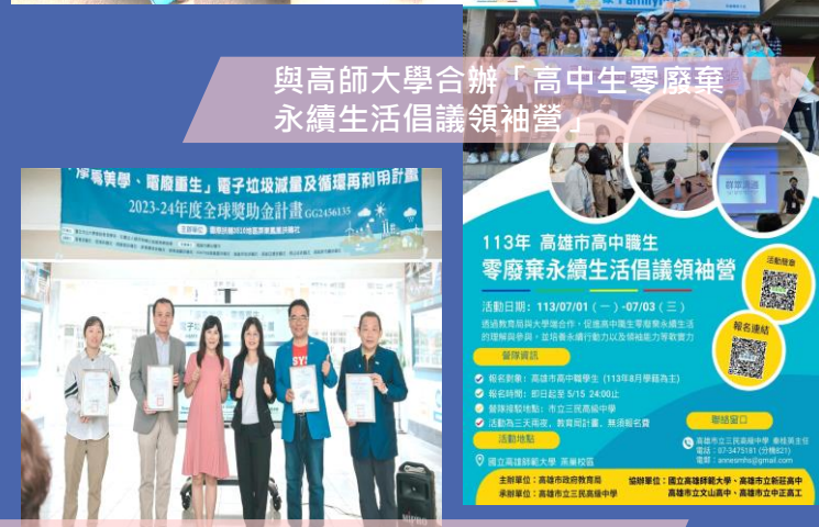
與高師大學合辦「高中生零廢棄 永續生活倡議領袖營」