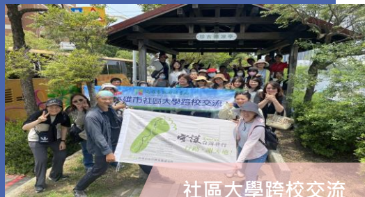
社區大學跨校交流