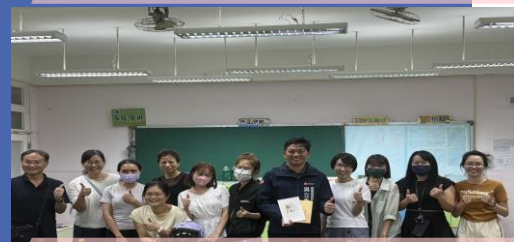
開學走訪補校肯定長者努力向學