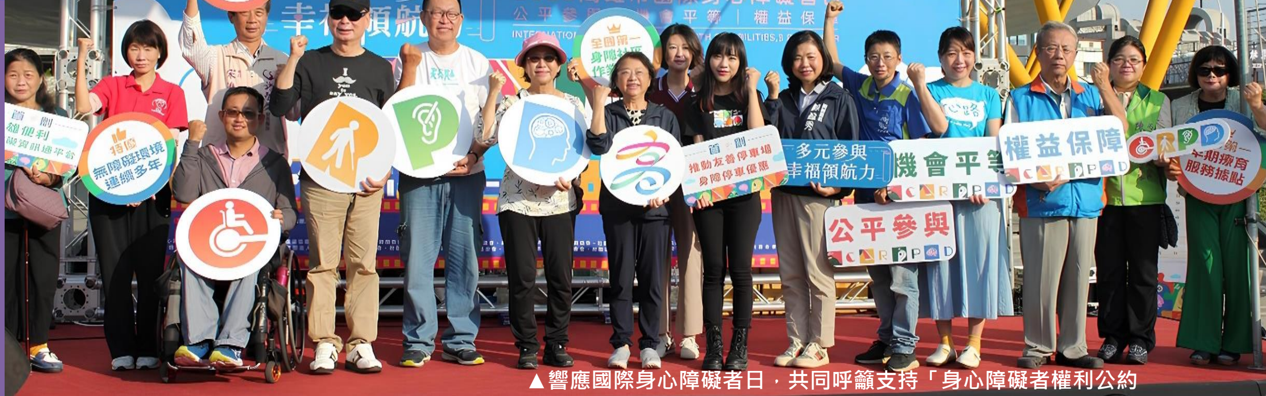
▲響應國際身心障礙者日，共同呼籲支持「身心障礙者權利公約 (C.R.P.D)」