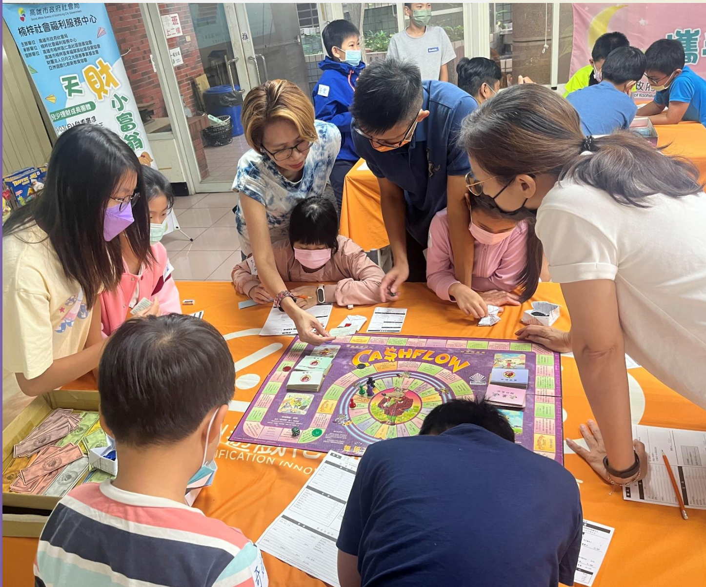
▲兒少理財成長團體