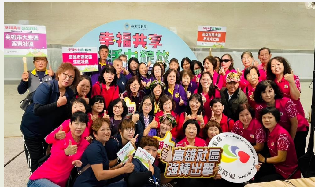
▲ 本市6個績優社區榮獲衛生福利部金卓越社區選拔獎項