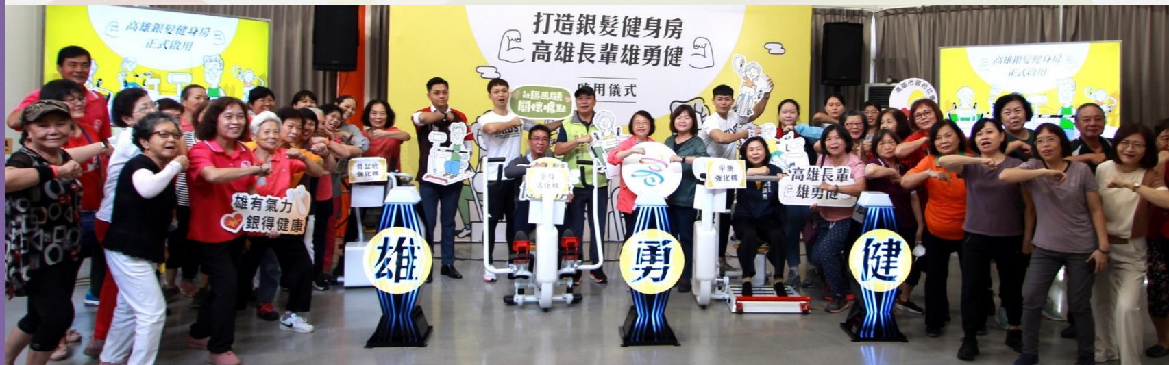
▲引進智能運動健康設備開辦10處銀髮健身房