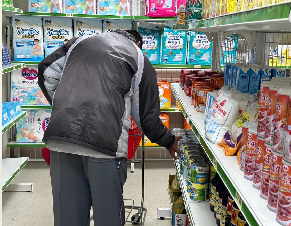
▲實物銀行彌陀店開幕啟用，嘉惠當地弱勢民眾

以15歲以上至未滿65歲之低(中低)收入戶、領身障生活補助(輕、中度)及弱勢單親家庭子女生活補助之弱勢市民為納保對象，提供保額最高30萬元意外事故保障