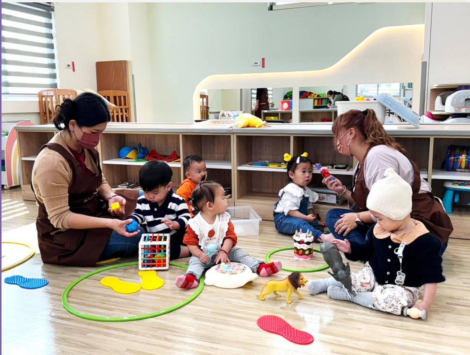
▲燕巢社區公共托育家園