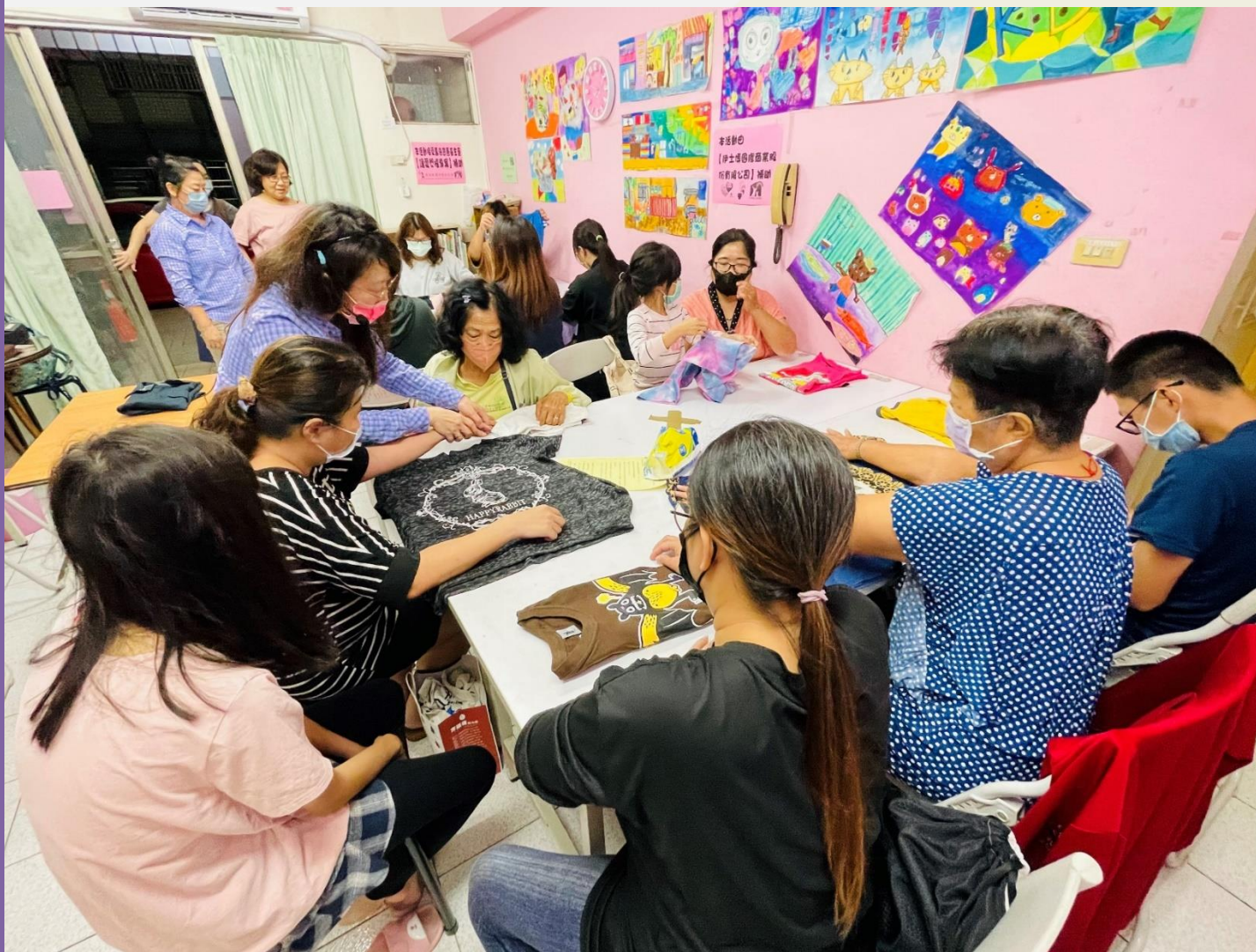
▲單親家庭服務據點辦理家事收納活動