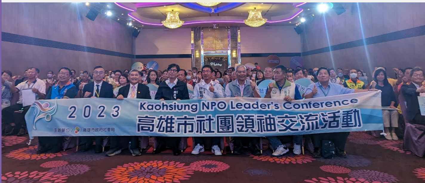
▲ 高雄市社團領袖交流活動