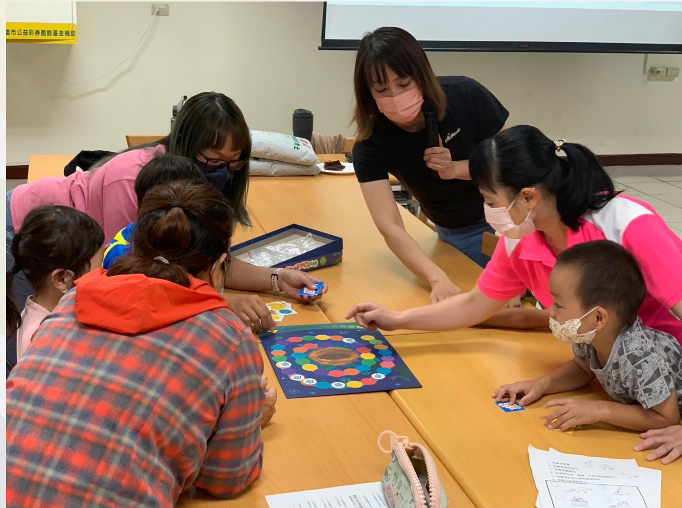
▲兒少發展帳戶理財教育活動