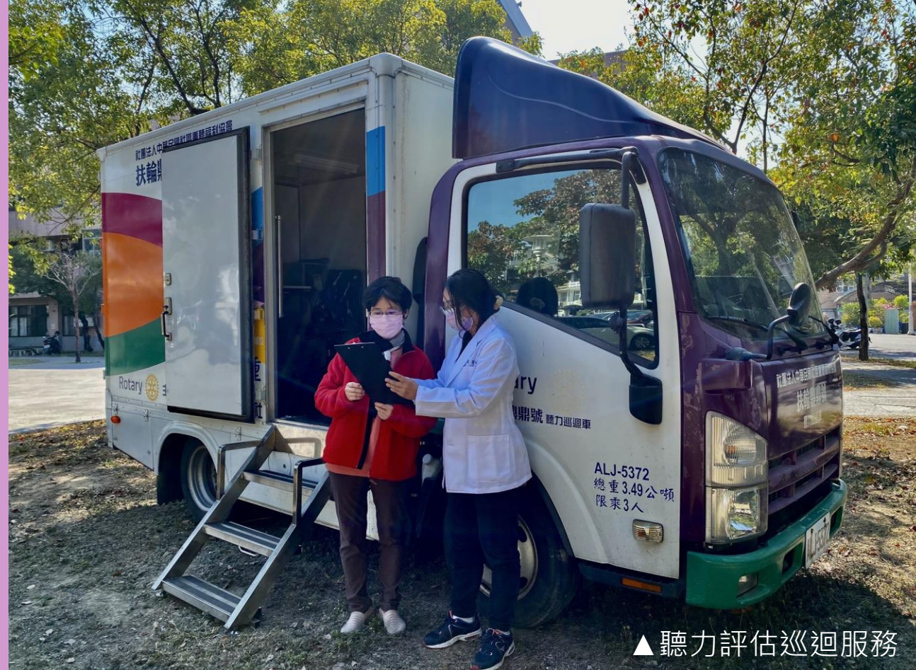
▲聽力評估巡迴服務