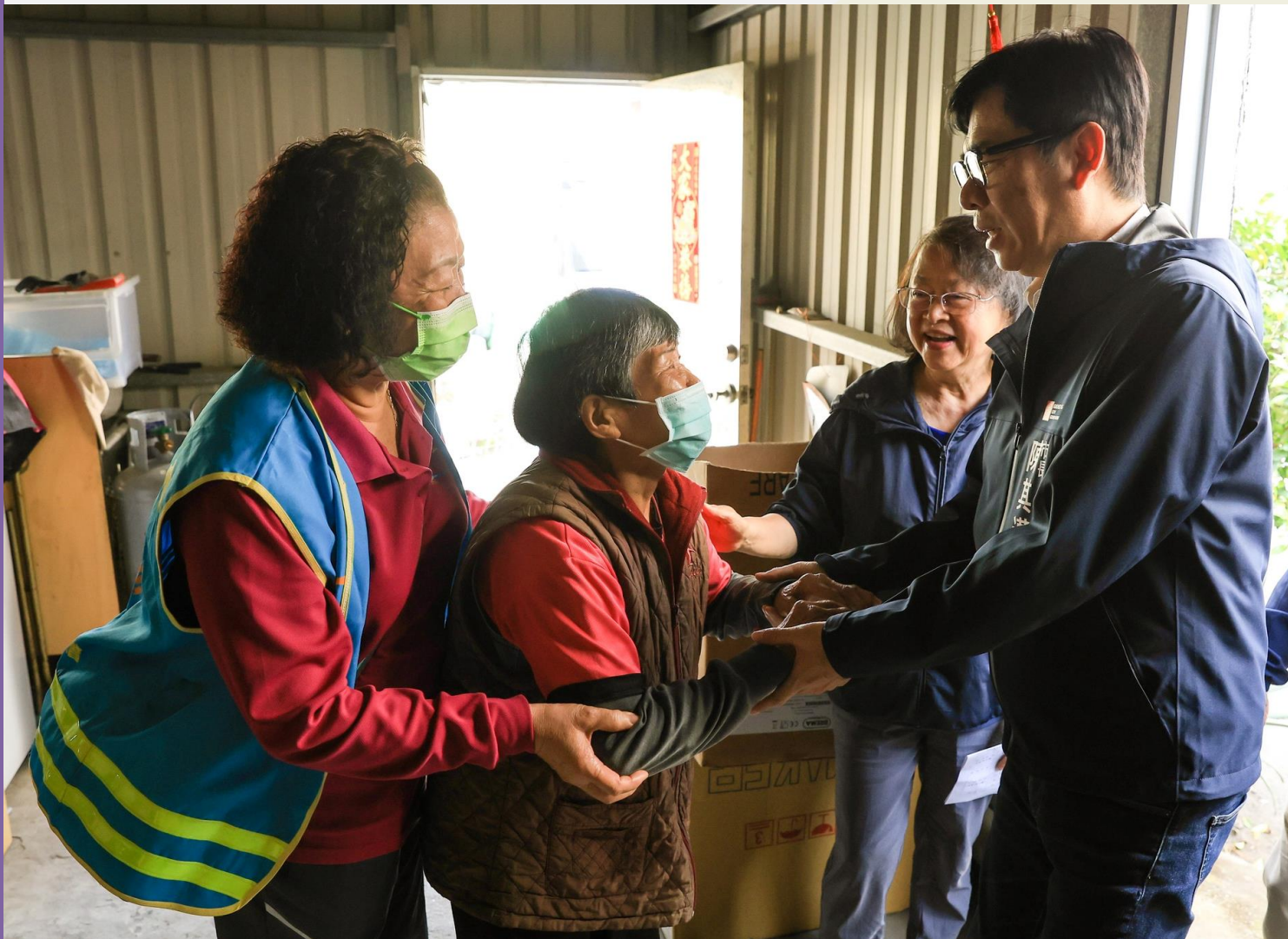
▲春節前夕市長慰訪獨居長輩賀年話家常