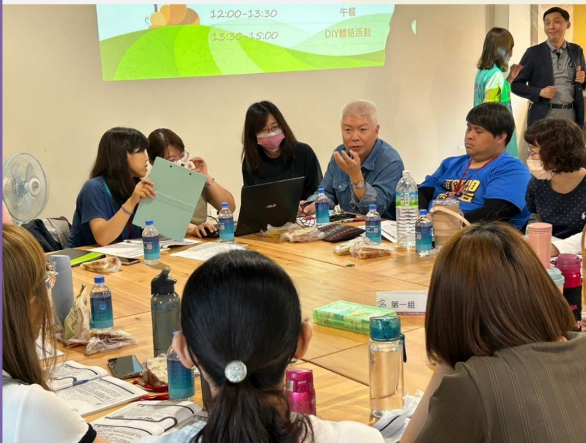
▲強化社會安全網跨網絡共識營，藉由分組討論增進交流對話，強化協力網絡合作共同成長