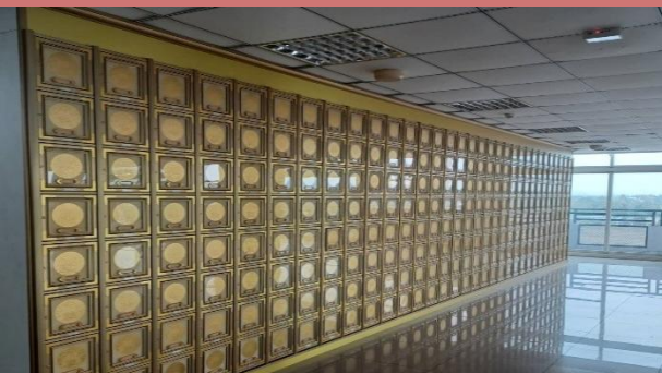
旗山區增設櫃位照片