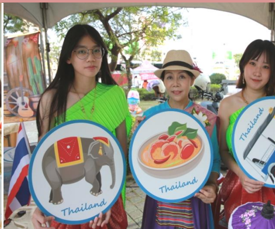
新住民多元文化市集