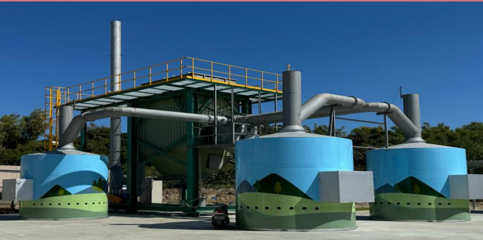
大社分館環保金爐