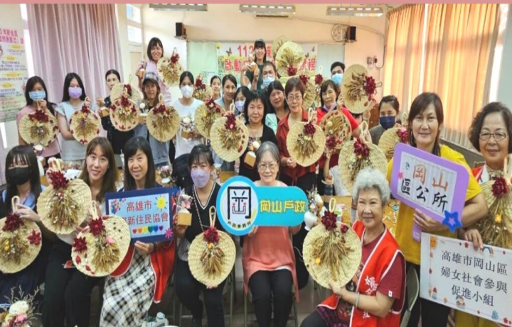
新住民「啟動自然療癒力」課程

112年度結合NGO團體及區公所辦理31場新住民課程及活動，逾3,000人參與。 113年度預計辦理41場新住民課程及活動。