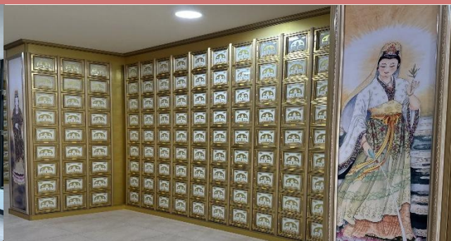
旗津區增設櫃位照片