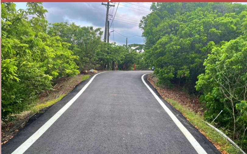
田寮區七星路63-1號旁路面改善工程