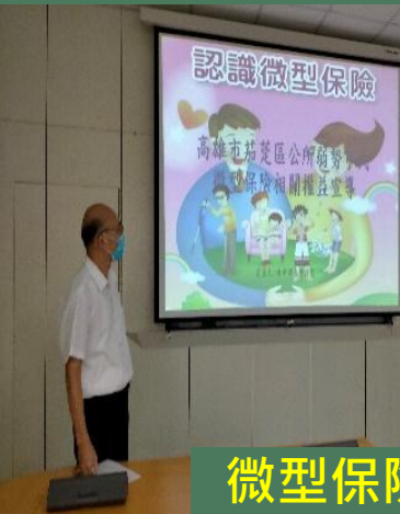
微型保險媒合專案