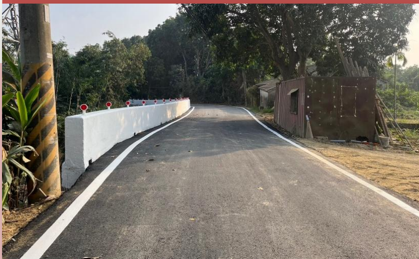
燕巢區深中路89-3號前擋土牆復建工程