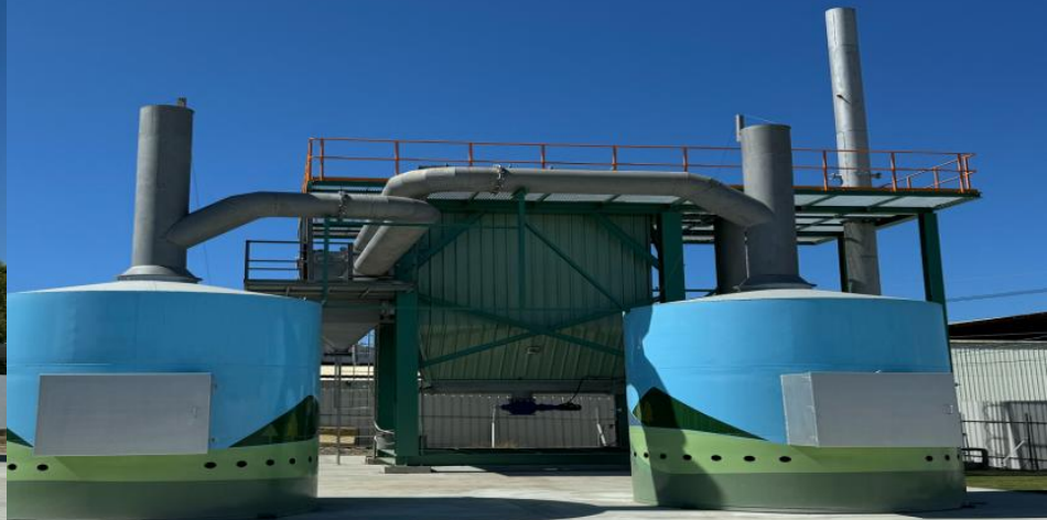
橋頭分館環保金爐