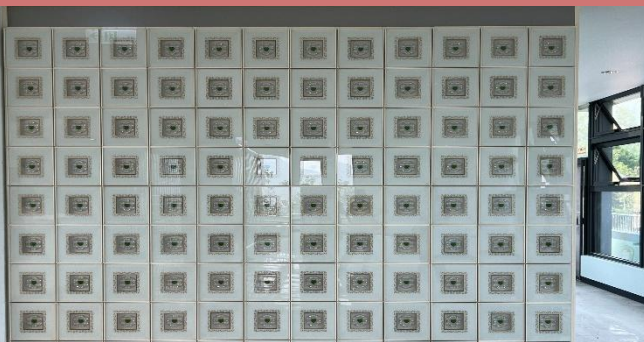
杉林區增設櫃位照片