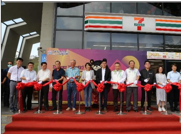
月世界遊客中心開幕