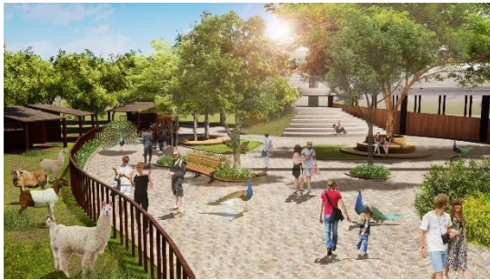
推動內門觀光休閒園區示意圖