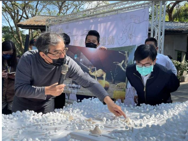
新動物園運動啟動