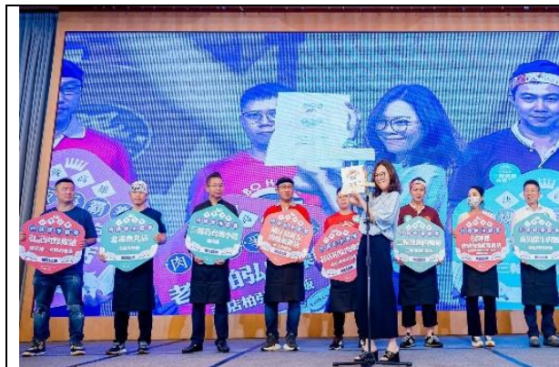
高雄肉燥飯爭霸賽