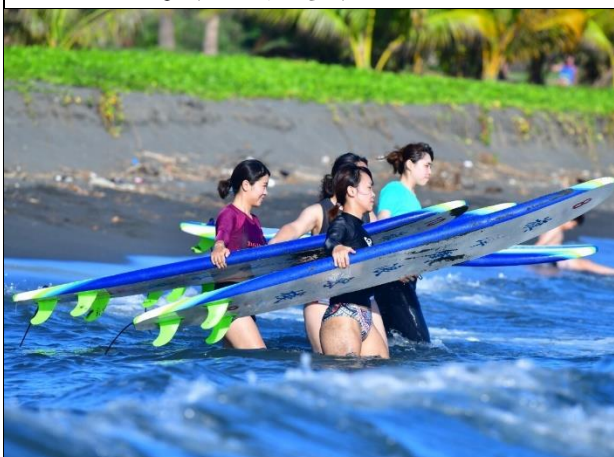
旗津開放水域遊憩活動