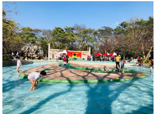
親水廣場整建完成重新開放