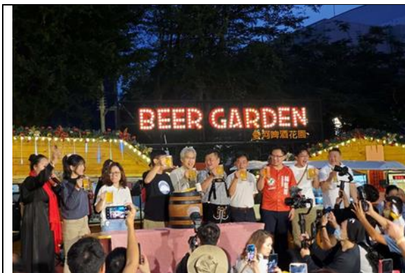
愛河啤酒花園開幕

為落實智慧旅遊專案中之智慧交通，本局於 109 年 5 月 7 日與其易電動車科技股份有限公司簽約試辦計畫，合作期間為 2 年，於本局景區建置悠達共享機車租用站點，目前於蓮池潭、旗津、愛河及動物園等重要景區皆有建站，後續將陸續於其他重要交通節點建站，以推廣低碳旅遊。