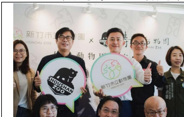
壽山動物園與新竹動物園締結姊妹園