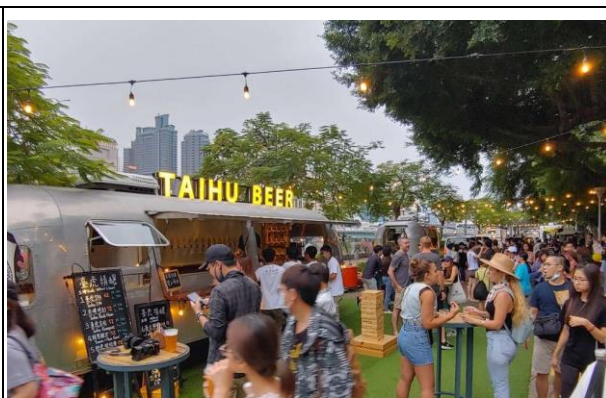
愛河假日主題市集