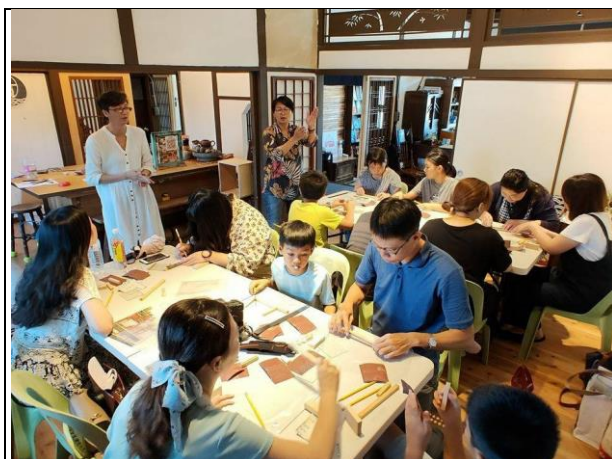
鳳山城市博物館-百工百藝遊鳳山

經市府團隊爭取2022台灣燈會在高雄舉行，經評估選定亞洲新灣區及衛武營都會公園二處作為主要燈區。透過便捷的交通網絡、豐富的自然人文、山海河港兼具等元素，搭配衛武營國家藝術文化中心及高雄流行音樂中心等二座國際級廳院，打造前所未見的國際級燈會，期盼在疫後復甦新的一年，讓高雄代表台灣迎接全世界。