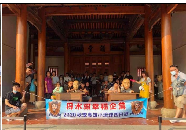
獎勵企業團體來高雄旅遊