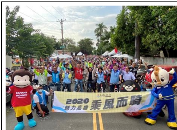
單車旅遊-2020 乘風而騎