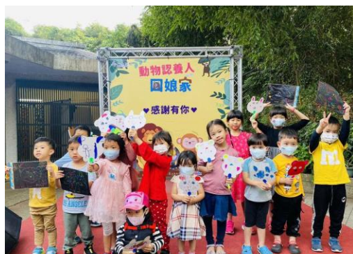
動物認養人回娘家活動