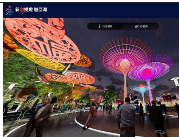
線上虛擬實境「新春提燈遊亞灣」