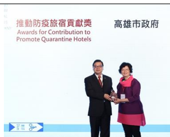
本府榮獲「推動防疫旅宿貢獻獎」