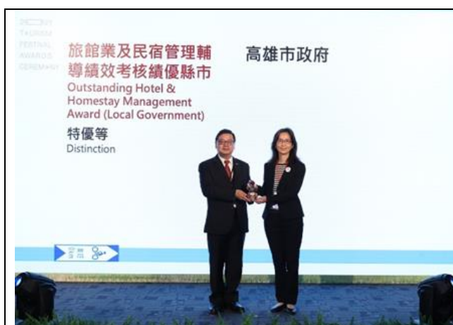
本府連續 5 年獲「城市好旅宿評比」特優

依據「交通部觀光局獎助直轄市及縣(市)政府推動安心旅遊自由行旅客住宿優惠實施要點」，自 109 年 7 至 10 月提供自由行旅客住宿優惠補助。共 344 家旅宿業者參加。每 1 房補助 1 千元，本局已向交通部觀光局申請補助經費共 3 億 7,500 萬元(約 37 萬 5,000 間房間)。