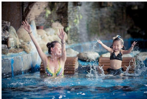
溫泉取供事業計畫-提供業者溫泉用水