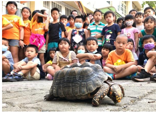
動物園前進校園巡迴活動