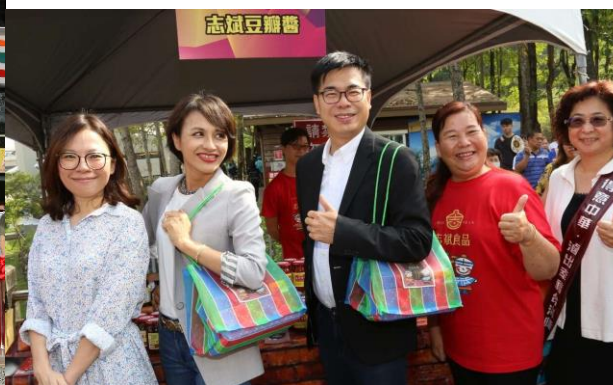
月世界遊客中心-農特產品展售中心