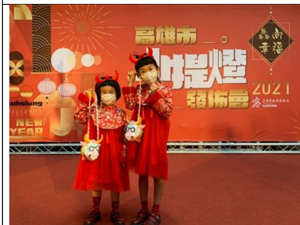
「牛擗擗」小提燈發布會