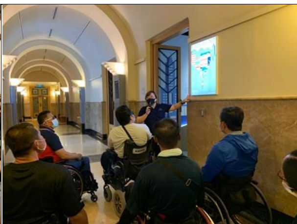
無障礙旅遊成果發布