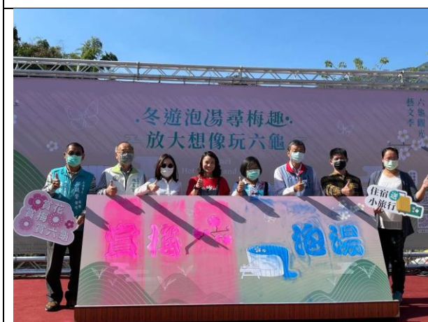
戴資穎出席六龜觀光推廣活動