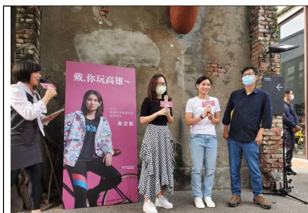
邀請戴資穎擔任高雄秋冬旅遊大使

為振興國旅市場搶先布局，於 110 年 1 月 13 至 15 日邀請中北部 19 家知名旅行社來高雄踩線，深度探訪亞洲新灣區及東高雄美食、新興景點、溫泉、豪華旅宿等資源，後續將借助旅行業的專業及市場敏銳度，期能創造讓旅客有偽出國感的高品質旅遊產品，並結合市府、業者資源及通路，共同推廣高雄觀光。目前推出超過 8 條高雄高端遊程，已帶入約 3,000 名旅客。