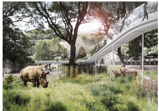
動物園升級計畫(示意圖)