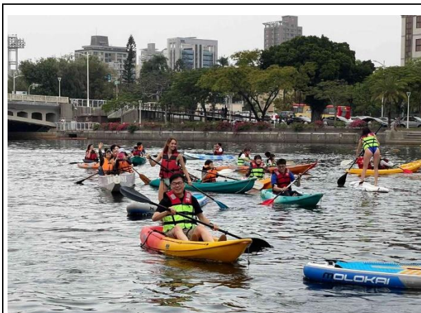
還河於民-愛河親水活動