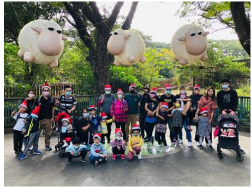
公共藝術打卡點行銷活動