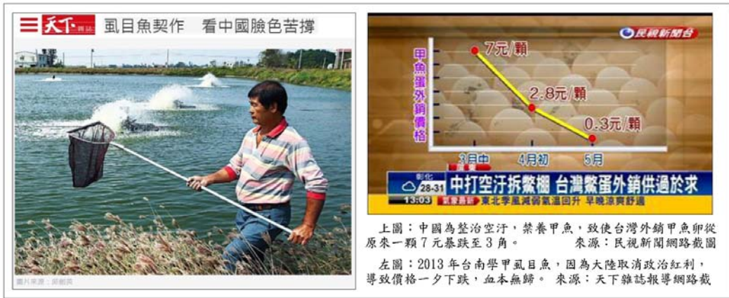
上圖：中國為整治空汙，禁養甲魚，致使台灣外銷甲魚卵從原來一顆 7 元暴跌至 3 角。

養，從一顆 7 元暴跌到 3 角，及台南學甲虱目魚，因兩岸政治紅利消逝滯銷，讓數百戶甲魚與虱目魚漁民血本無歸，欲哭無淚的情景。