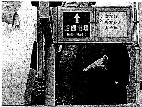
指示牌面 2：空格新設指示牌