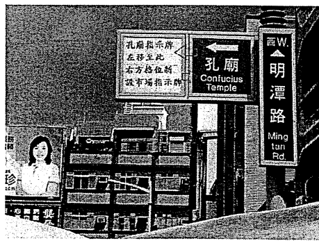
指示牌面 4：更正箭頭方向、顏色