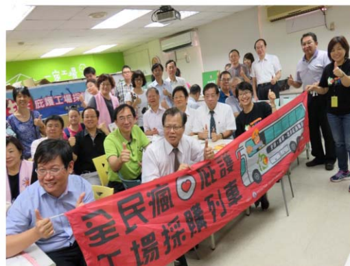
協助身障團體及庇護工場商品行銷