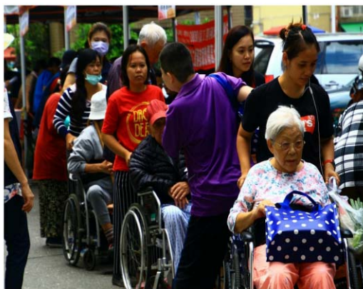
推辦外展關懷服務試辦計畫