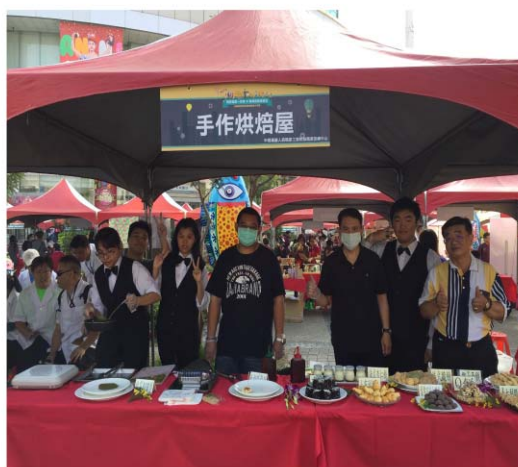
開辦身障多元職訓課程