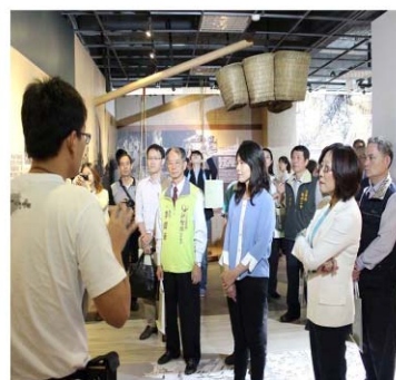
「汗水的印記—高雄ㄟ勞工」常設展開展記者會