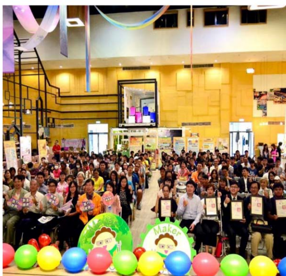
「青年三創講座暨創業輔導育成計畫成果發表會」