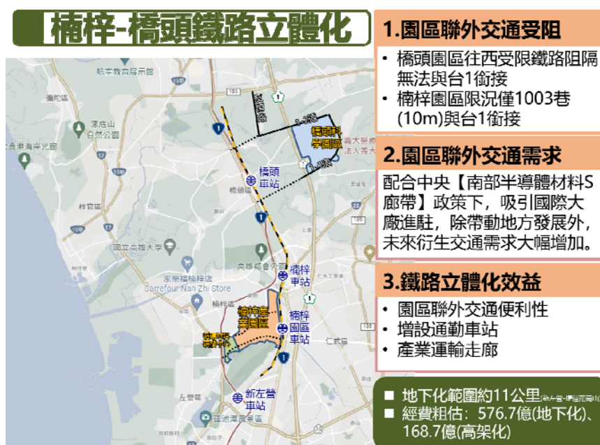
附圖 楠梓至橋頭鐵路立體化路線示意圖