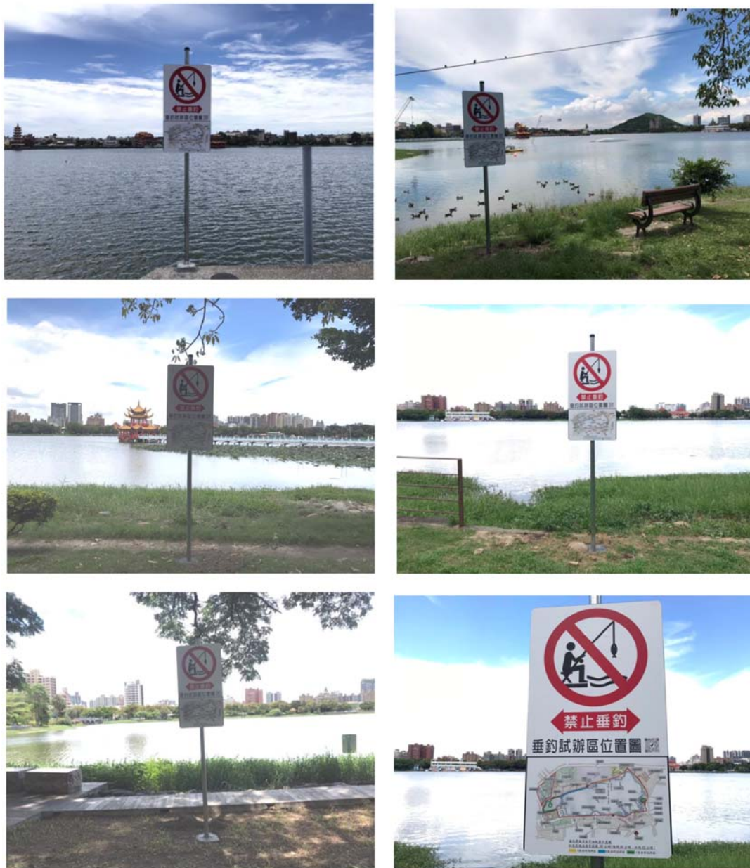
附圖一 「非垂釣區」之宣導牌面