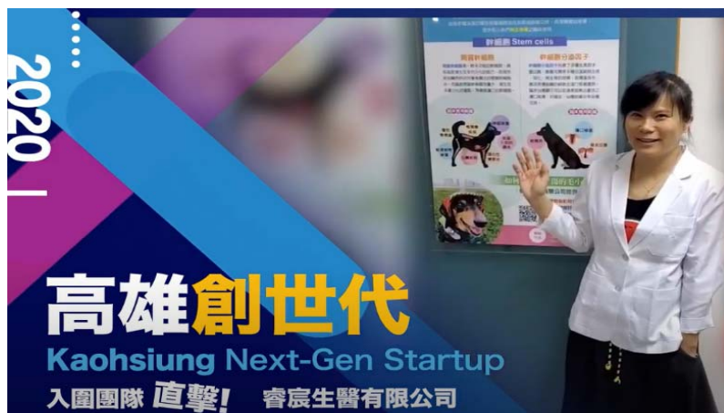
圖 6 「高雄創世代」採訪影片