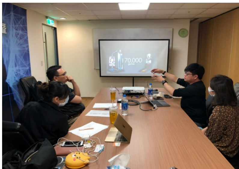
圖 5 「高雄創世代」培訓課程簡報實戰演練