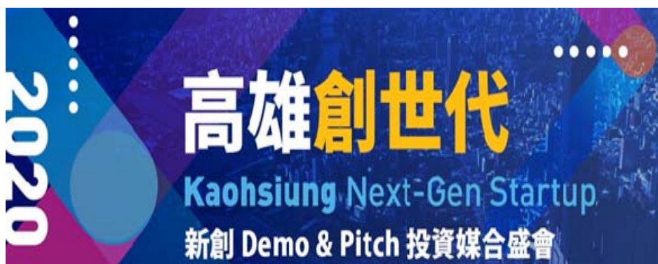
圖 4「高雄創世代」宣傳素材