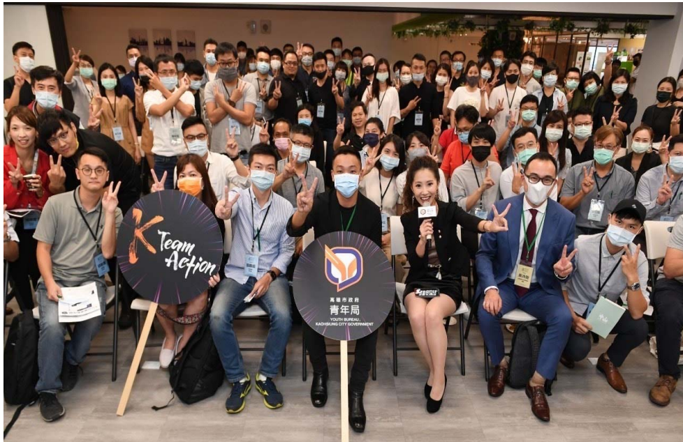
圖 2 邀集高雄青創團隊辦理青創之夜交流聚會