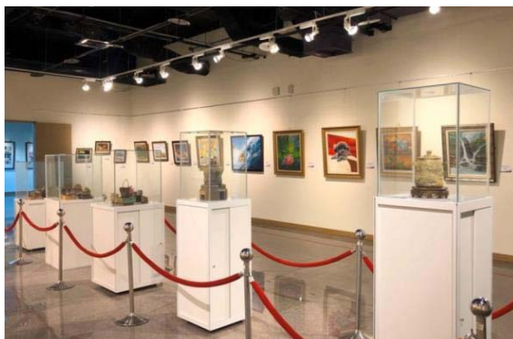
圖 15、2020 嶺南藝術學會會員聯展

展期自 109 年 3 月 4 日至 3 月 31 日止，由嶺南藝術學會 37 位成員展出平面及立體作品共計 60 件，創作內容以水彩、水墨、油畫、陶藝等表現自然的景緻、城市景觀的變遷及社會的關愛，吸引 1,219 人次參觀。（如圖 15）