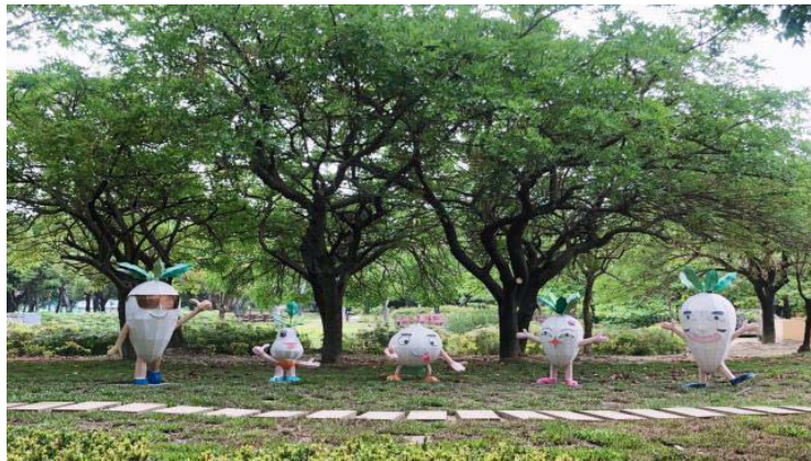
圖 22、蘿蔔五福匠藝術裝置