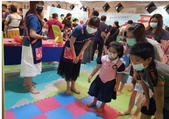
圖 3、幼兒客語闖關活動

4.108 學年度幼教客語沉浸教學計畫經輔導訪視，評選出 6 位特優推動教師、4 位績優教師，並於期末辦理教學成果發表及幼兒客語闖關活動。「客華雙語教學模式發展計畫」於期初及期末針對三至六年級參與計畫 16 班進行客語聽力、閱讀及口語等項目前後測，以瞭解學習成效，結果顯示整體總平均較前測時提高約 13%，其中聽力平均提升約 7%，閱讀能力增加約 24%，口語能力平均則增加約 10%。另外，透過客華雙語班及對照班的教學驗證，三至六年級進行客華雙語教學的學生，其在客語聽力、閱讀及口語三方面的能力總平均高出對照班約 10%；並有 80% 實驗班學生喜歡老師用客語或客華雙語作為課堂媒介語；90% 學生表示客語能力進步，也認為是增強語言使用的機會；87.7% 學生認為自己比一般非實驗班學生的客語能力更強。（如圖 3）