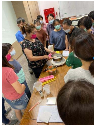
圖 5、客家花香手工皂班

(1) 109 年 5 月起於本市新客家文化園區開辦「客家學苑」，針對不同需求民眾規劃各項有趣的客家語言、文化技藝培訓課程，計有「四縣腔初級客語」、「四縣腔中級暨中高級客語」、「創客葫蘆小夜燈」、「客家花香創皂班」、「客家藍染」、「客家速寫」等 42 門課程，透過不同主題，讓民眾以寓教於樂的方式學習客語，展現客家多元豐富的文化藝術，計 493 人次參與。（如圖 5、6）