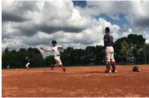
圖 8、客語音樂 MV－野球路

104 年起陸續發行《x+y 係幾多》、《青春个該兜事》、《係毋係罇擺》3 張青少年客語專輯，為讓更多人欣賞、傳唱，藉由輕鬆愉悅的音樂，傳承客家語言文化，特將 3 張專輯中〈野球路〉、〈旋律〉等 8 首主打曲目製成數位影音，完成後上傳至 YouTube 行銷。(如圖 8)