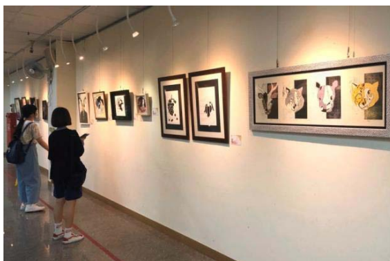
圖 16、高雄市立壽山國中美術班畢業美展

109 年 6 月 13 日至 6 月 28 日展出高雄市立壽山國中美術班 28 位學生版畫、水墨、書法、油畫及立體作品共 85 件，展現學生豐沛才華及創意，吸引 985 人次參觀。（如圖 16）