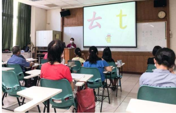
圖 7、客語初級認證課程