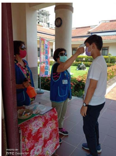
圖 9、防疫期間志工協助量測額溫