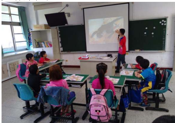
圖 1、客語教學上課情形