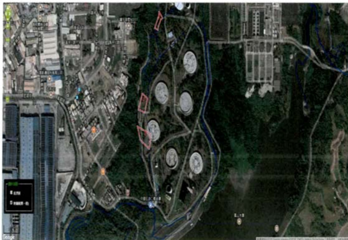
圖 1 空照圖

本標的土地位於臨海工業區東側，緊鄰台灣自來水公司鳳山給水廠，現況為台灣中油股份有限公司油庫 R-01 油槽之基地、周遭綠地與維修及消防道路用地等使用。