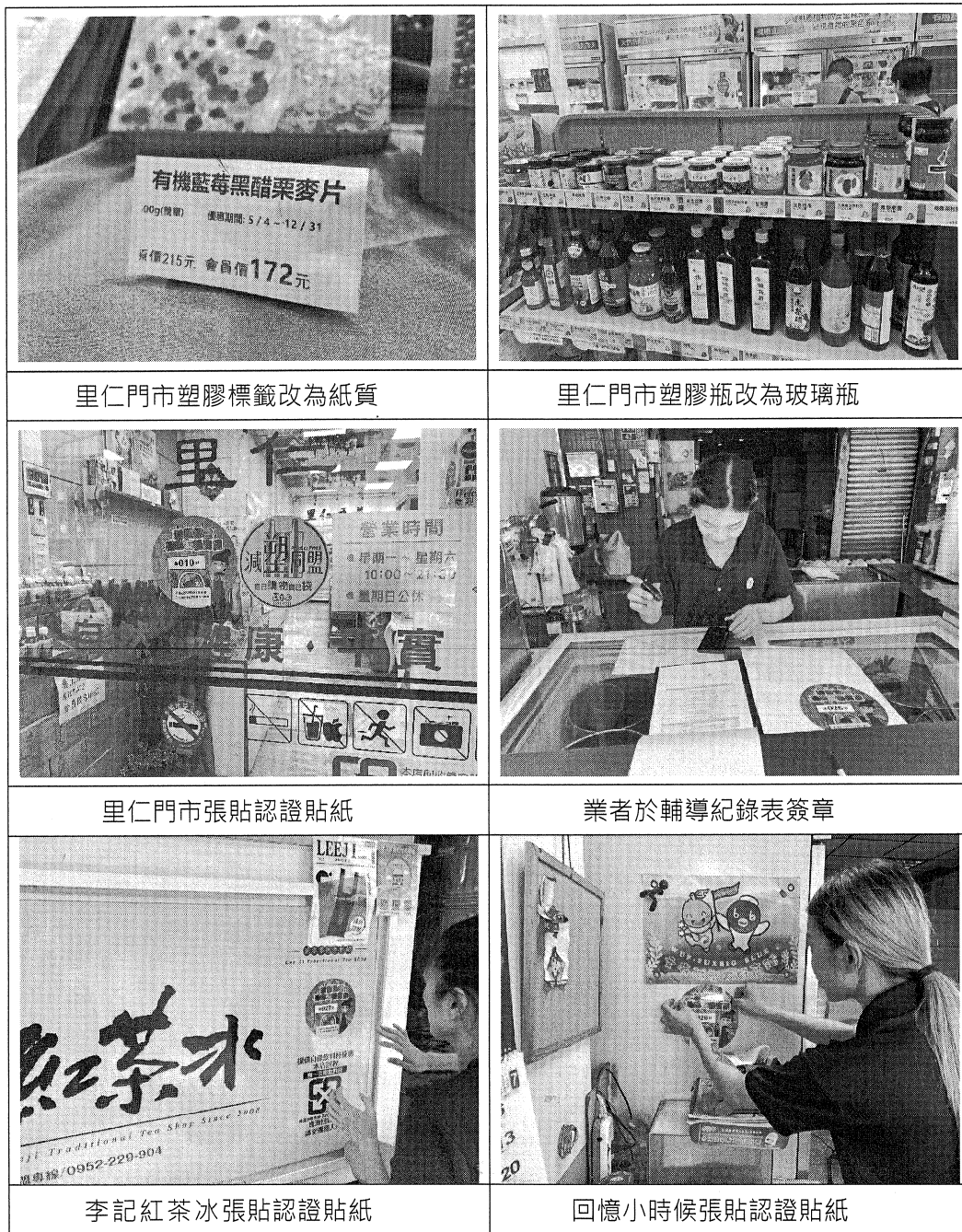
圖 2、減塑認證綠友善商店現場輔導情形(2/2)