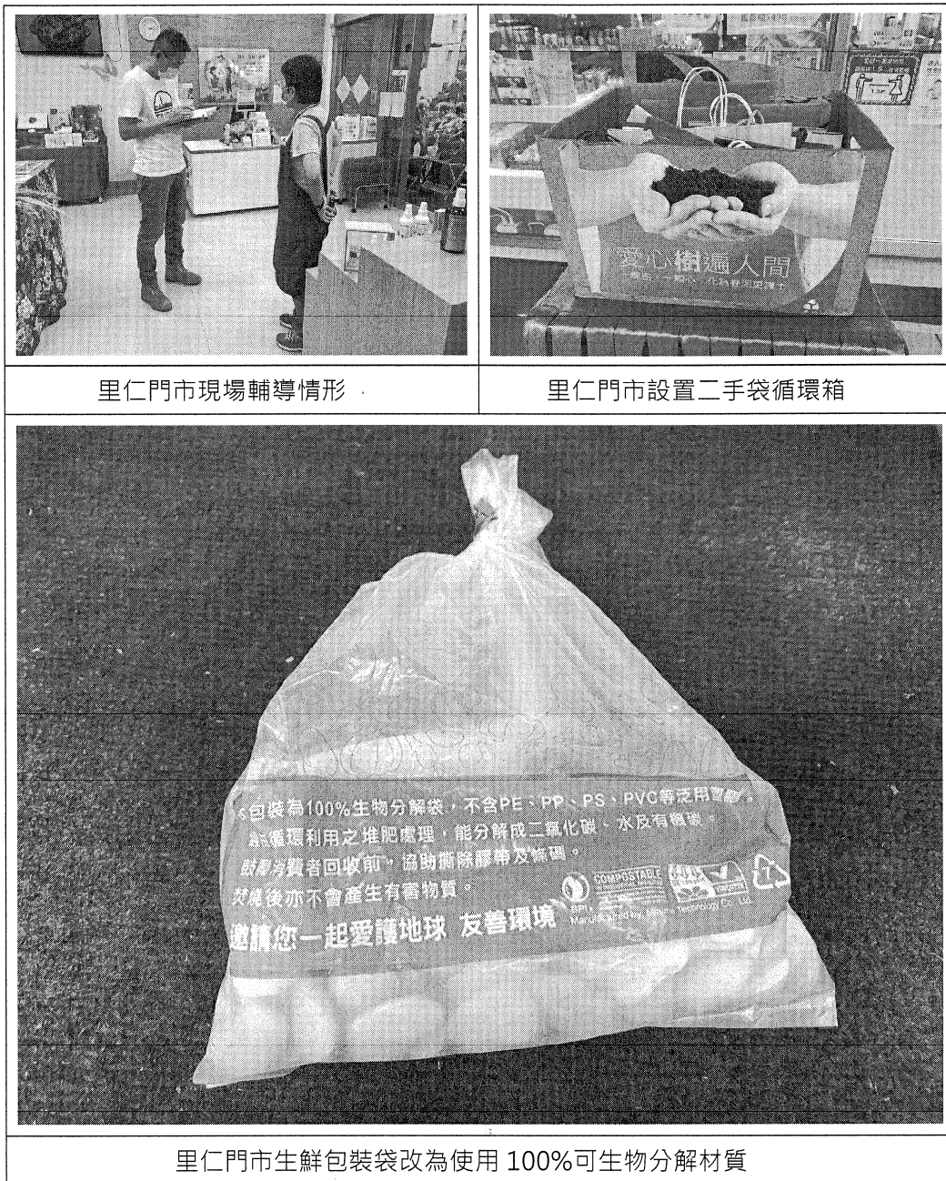
圖 2、減塑認證綠友善商店現場輔導情形(1/2)