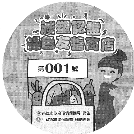
圖 1、高雄市減塑認證綠色友善商店標誌貼紙