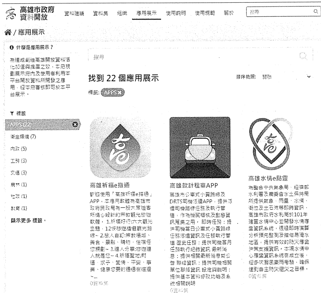
圖 3 高雄市政府 APP 專頁