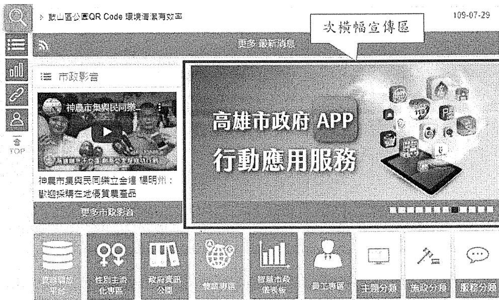
圖 1 高雄市政府全球資訊網首頁次橫幅宣傳區