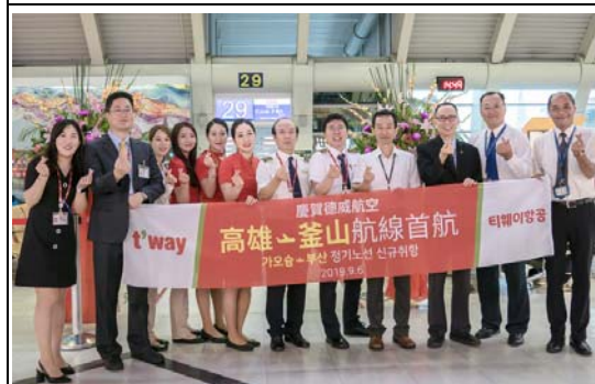
德威航空「高雄－釜山」首航