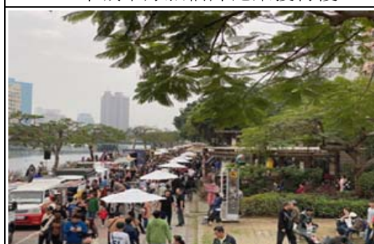
愛河三輪餐車市集