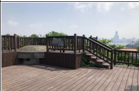
新完成哨船頭山碉堡