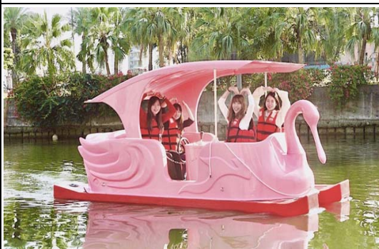
愛河特色水域活動