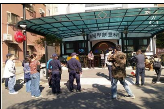
非法旅宿強力執法