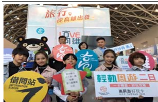
高雄冬季國際旅展