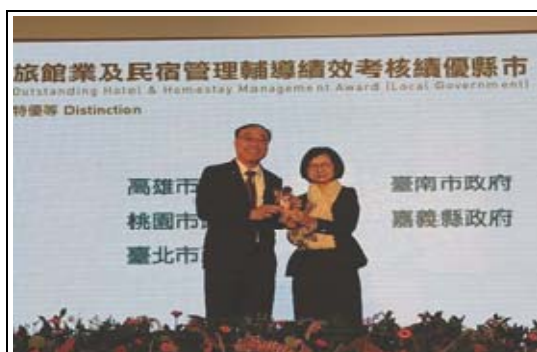
108年城市好旅宿評比榮獲特優