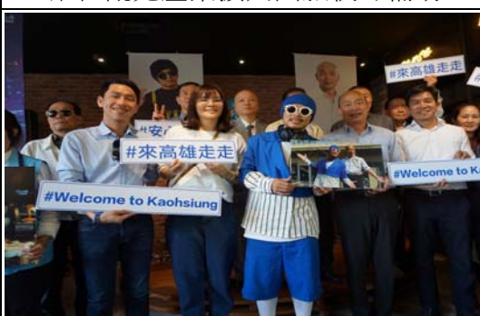
高雄安心旅遊宣傳