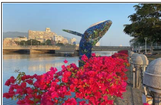
愛河·愛之鯨地景裝置藝術