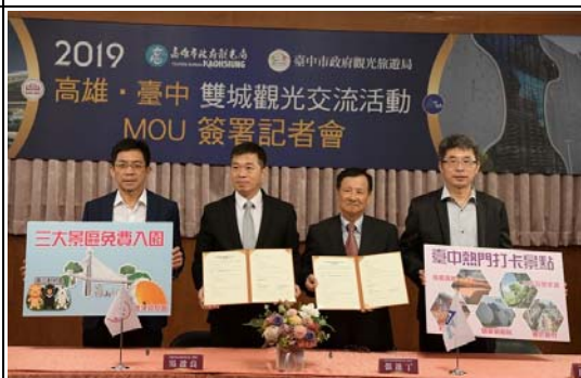
高雄·台中雙城觀光交流－簽署MOU