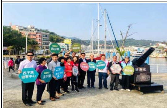
嘻哈漫遊巷弄觀光