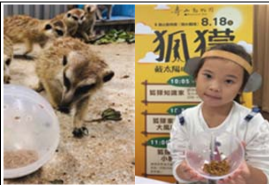
「狐獴」主題月教育推廣活動