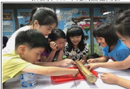
動物園暑期夜宿營活動