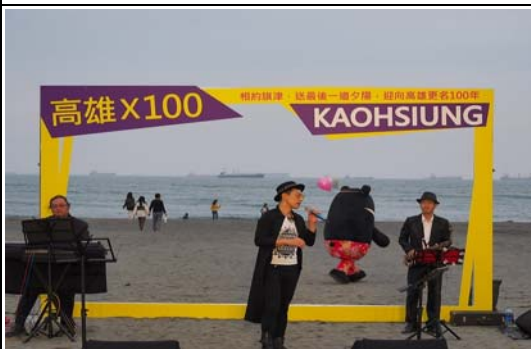
2019送夕陽－相約旗津沙灘音樂會