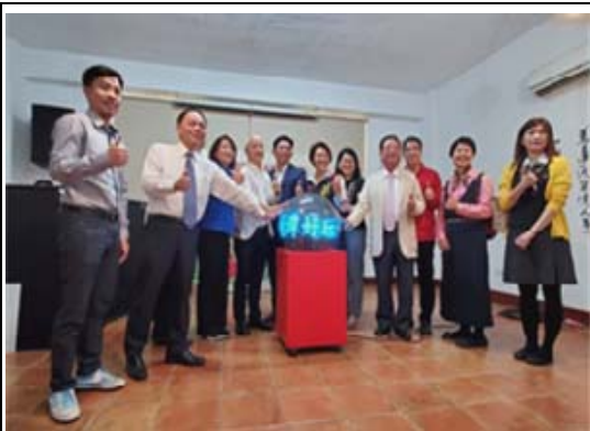
蓮潭好玩卡低碳輕旅啟動