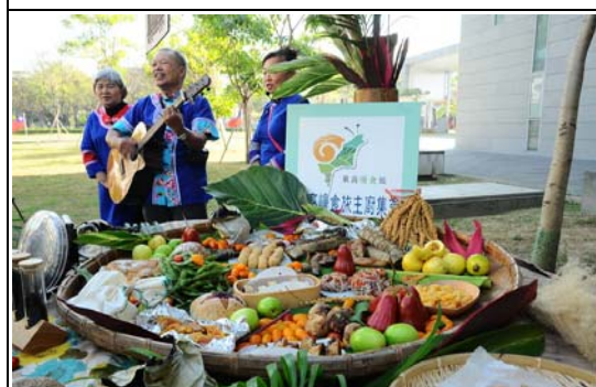
一心三線成果發表