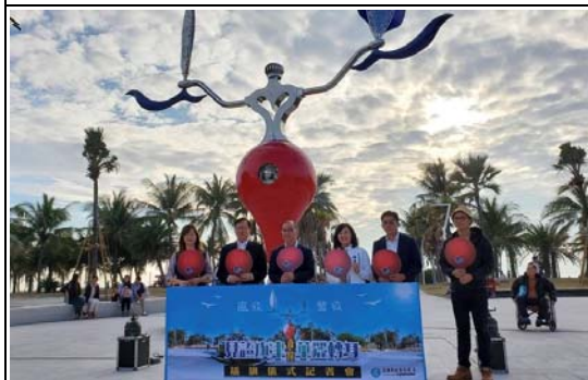
旗津公共藝術新地標