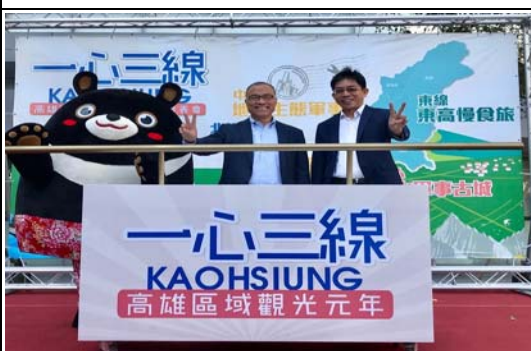
區域觀光元年啟動