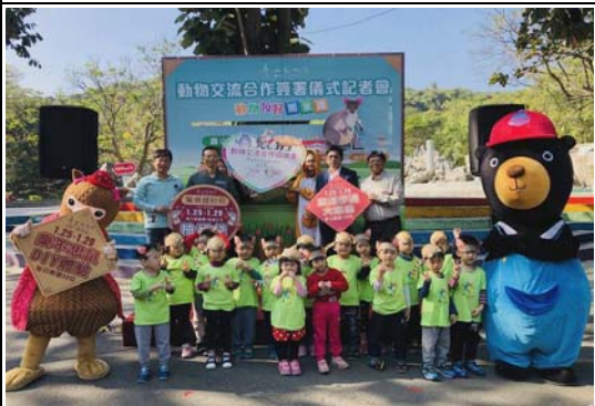
與新竹動物園及兆豐農場簽署保育協定