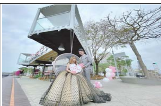
高雄愛情月－白色情人節