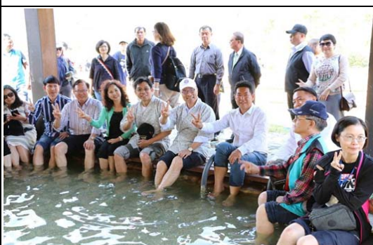
六龜泡湯賞花品慢食