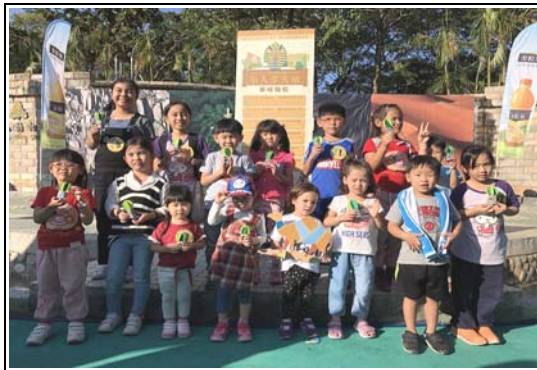
「駱駝」主題月教育推廣活動