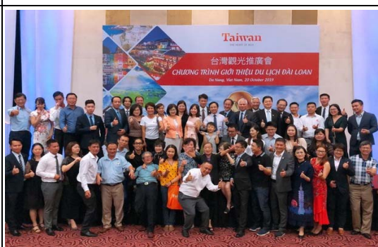
參加台越觀光會議及觀光推廣會