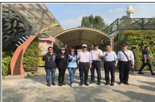
金獅湖蝴蝶園生態園區