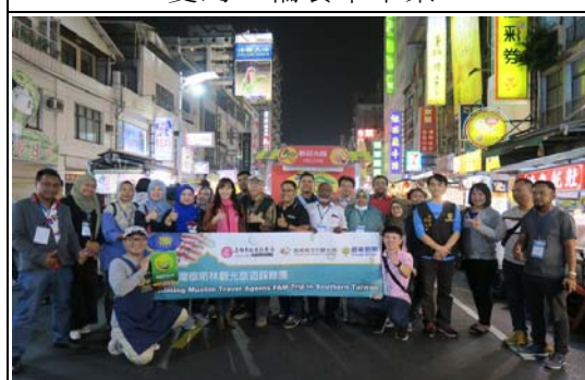
穆斯林踩線團走訪六合夜市