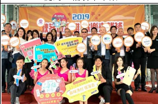
結合觀光產業擴大國旅秋冬補助