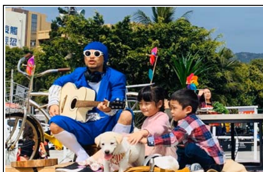
創作高雄觀光主題曲「出去走走」