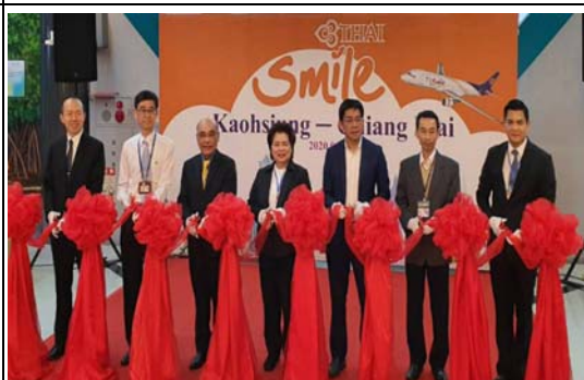
泰微笑航空「高雄－清邁」首航