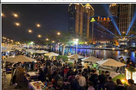
愛河三輪餐車市集