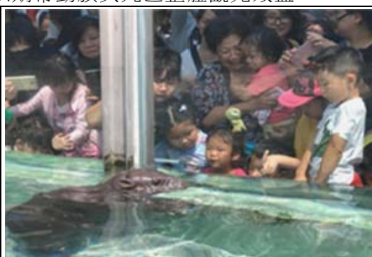
侏儒河馬收涎派對