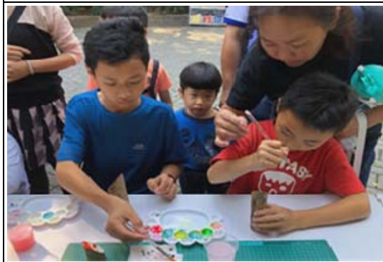
壽山森林小教室DIY活動