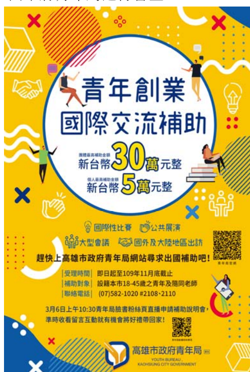
圖 1 國際交流補助海報圖

108 年 12 月 24 日訂定「高雄市政府青年局促進青年創業國際交流補助要點」，109 年 1 月 30 日開始受理申請，補助設籍本市 18-45 歲青年參加國際性比賽、公共展演、大型會議及國外出訪，亦補助隨同指導老師。補助金額：個人最高 5 萬元，團體最高 30 萬元；補助國際機票、活動期間保險、膳宿、講師費及場地費等項目。申請補助金額 10 萬元以上者提送高雄市青年局國際交流補助審查會審查，申請補助金額未逾 10 萬元之案件由本府青年局進行審查。