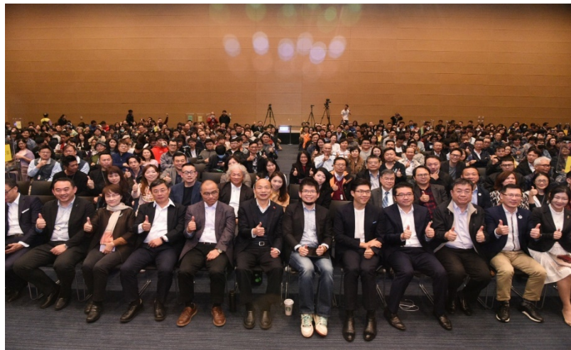
圖3 109年1月20日青年對談破千人報名參加