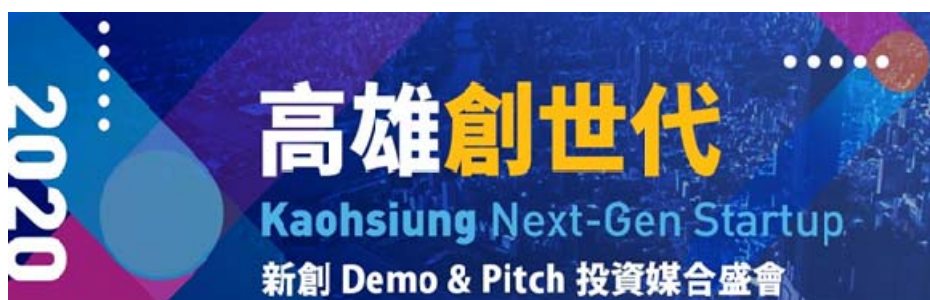
圖 10 109 年大型路演暨創投媒合活動「高雄創世代」