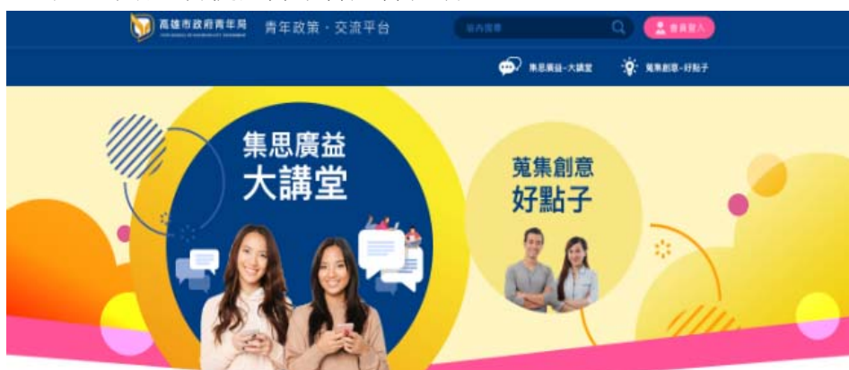
圖 4 青年政策交流平台網站示意圖