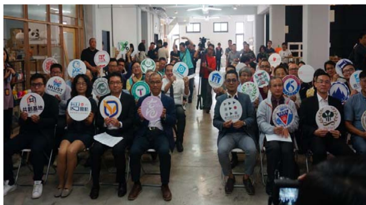
圖 5 高雄青年創業推動聯盟成立