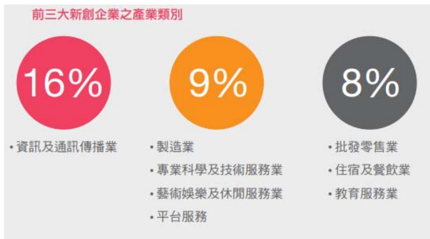
圖 8 《2019 台灣新創生態圈大調查報告》前 3 大新創企業之產業類別