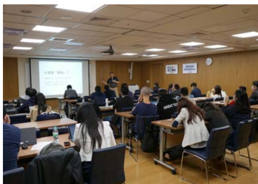
圖 11 「高雄創世代」培訓課程簡報實戰演練