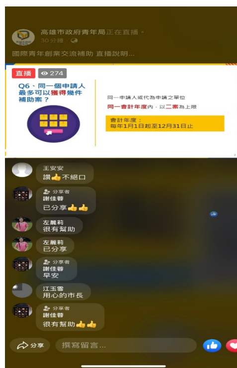
2 國際交流補助直播說明會