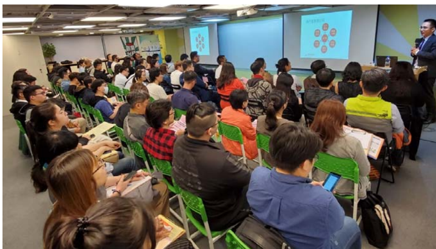
圖 6 開辦青創講堂針對創業必修議題提供快速入門捷徑

為健全高雄青年創業環境，促進創新創業發展，青年局開辦創新創業主題相關之課程、講座、工作坊等各項育成活動，預計辦理 15 堂創業課程、10 場次大師論壇、講座活動，以創造青年分享、激盪與成長之創新創業環境，並達知能、職能整備與人力資源交流的實質效益，培育青年具備創新創業的能力及創業家精神之養成，形塑高雄創新創業之氛圍，活絡本市產業發展。