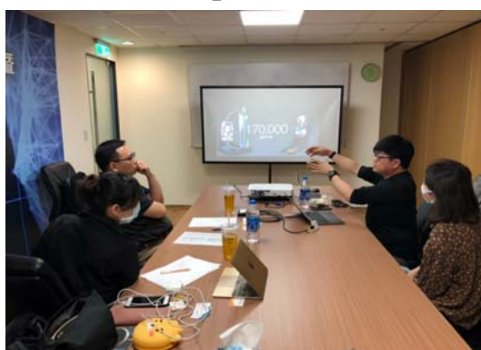
圖 12 「高雄創世代」培訓課程簡報實戰演練