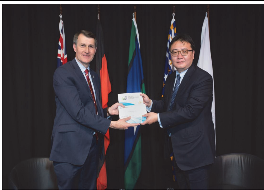
照片 5：許立明副市長率團參加 2015 亞太城市高峰會，並邀請布里斯本市參加「2016 全球港灣城市論壇」