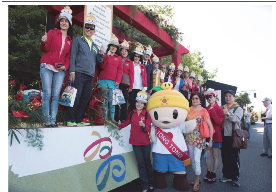
照片 7：高雄市訪問團參加美國奧勒崗州波特蘭姊妹市第 108 屆玫瑰節慶活動，並偕高通通參加花車遊行