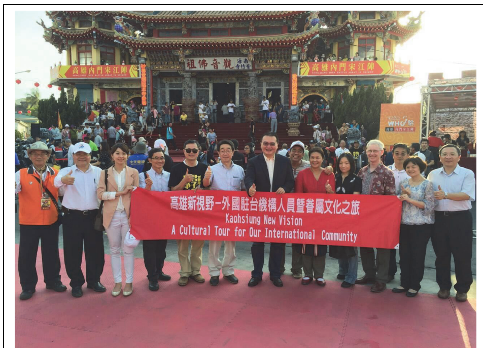
照片 8：外國駐高機構人員暨眷屬文化之旅：2015 高雄內門宋江陣