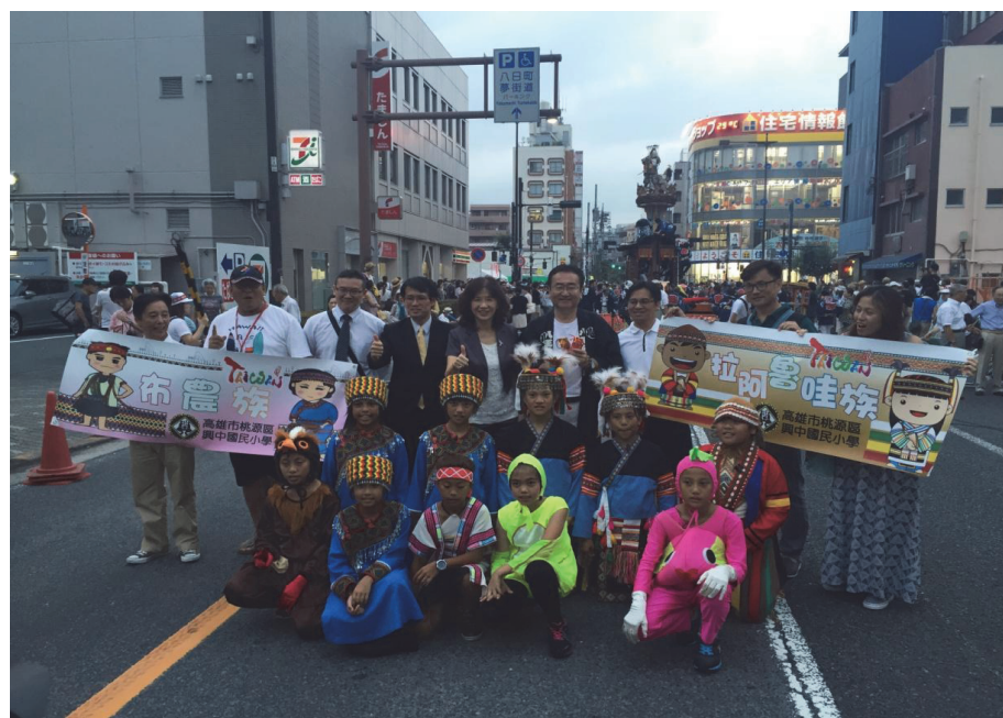
照片 6：高雄市訪問團參加日本東京都八王子市「八王子祭」慶典活動，並偕本市桃源區興中國小表演團赴日演出