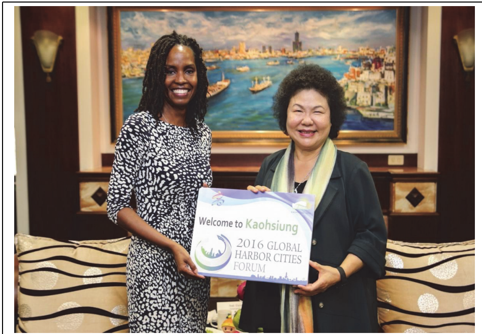
照片 1：美國洛杉磯副市長凱莉·波娜參加本市 2015 國際港灣城市研討會，並拜會陳菊市長