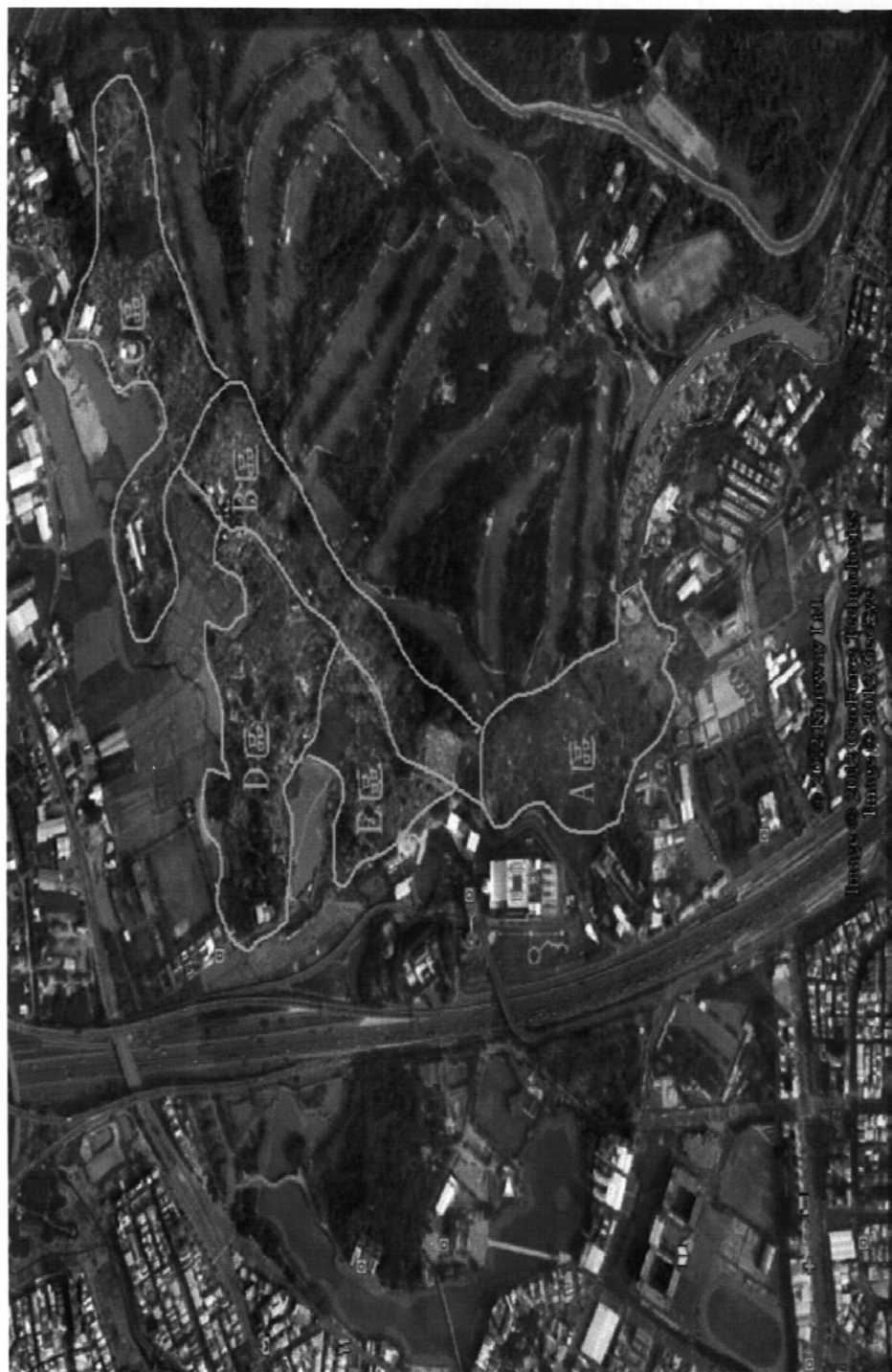
覆鼎基金區遷葬案區域位置分配圖