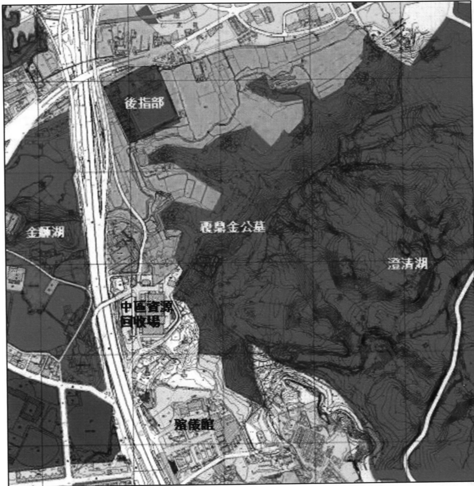
圖 3 覆鼎金地區地形示意圖