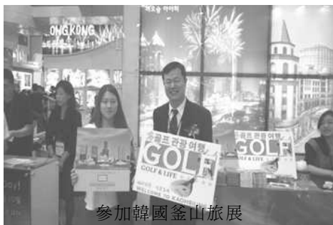
參加韓國釜山旅展