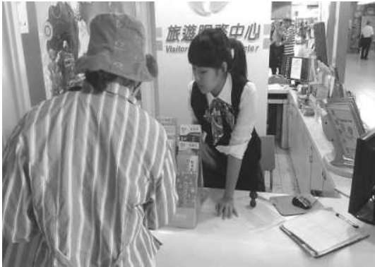
旅服中心提供友善的諮詢服務