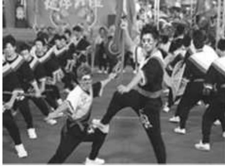
大專院校學生創意宋江陣