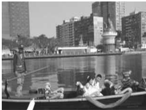
結婚新人搭貢多拉船拍婚紗照

高雄是擁有山海河港美景之海洋城市，為提供多元遊憩體驗，自 102 年 11 月份起引入廠商營運貢多拉船浪漫游愛河，促進愛河水域遊憩載具更生動活潑及多元化，並透過異業聯盟，結合黃金愛河咖啡香等優惠方案，吸引更多民衆嗜美食、品咖啡及乘船遊河，體驗永浴愛河之旅。