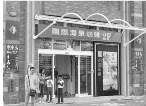
旗津輪渡站「i 問路旅遊資訊站」