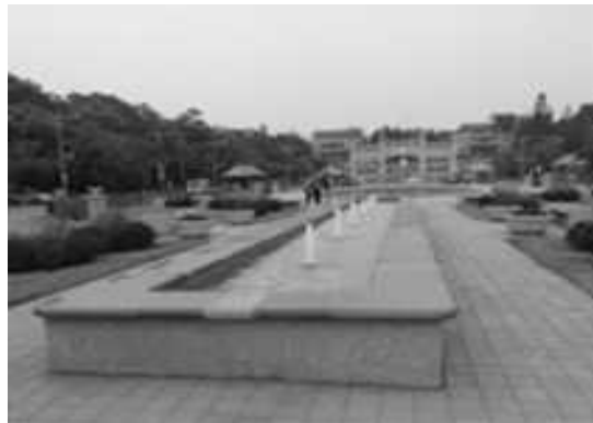
澄清湖風景區入口整建

為改善澄清湖入口凌亂門面，以營造澄清湖優質入口意象，增加周邊商機，由交通部觀光局補助本局辦理入口區地坪整建、中央廣場景觀設施改善、停車場整建、環境綠美化等工程，預期改造完成後可增加澄清湖觀光旅遊多樣式人潮，進而帶動周邊產業商機，已於 103 年 2 月完工。