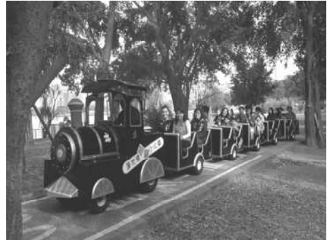
遊客搭乘小火車環繞蓮池潭欣賞美景