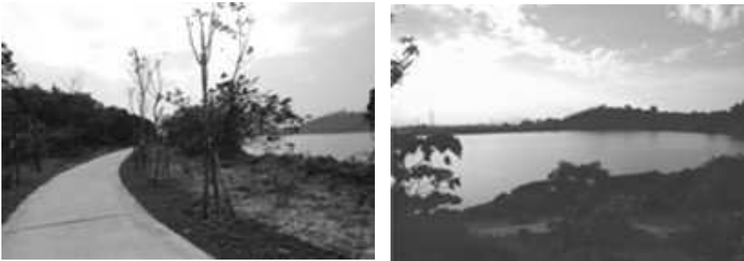
觀音湖環湖步道暨周邊景觀改善