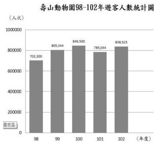
98-102 年入園人數統計圖

持續加強壽山動物園軟硬體設施改善及動物生活環境改造與景觀營造維護以提昇整體品質，並加強主題動物（如白老虎、台灣黑熊等）之推廣行銷，以及辦理各類親子與社教推廣活動，更加強推出暑期動物園夜間遊園服務及多元的夜間展演活動，成效卓著，總計 102 年度到園參觀人數為 838,525 人次，較 101 年（785,044 人次）成長約 6.8%，其中暑期夜間遊園人數為 27,222 人，較 101 年度成長約 40%（101 年同期累積人數為 19,428 人次），亦是歷年來的高峰，顯示動物園在本局全體同仁之用心經營下，成果已獲民衆之認同與肯定。