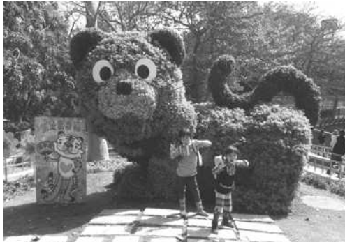
壽山動物園-小朋友與「愛幸虎」合照

為慶祝耶誕、跨年及農曆春節等節慶，特別於美麗島捷運站及壽山動物園設置大型藝術造景「愛心天鵝」、「快樂頌」與「愛幸虎」。利用立體綠雕、植栽立體創作及燈飾的設計，結合美麗島祈禱與愛情意象，包括鑽石、禮物及愛心天鵝營造幸福城市氛圍，更適合即將步入禮堂的準新人，來到這個地方拍攝婚紗照，成為婚紗攝影新亮點。另動物園大型綠雕「愛幸虎」，巧妙地以生動表情及動作，呈現觀光客開心旅遊的心情，成功勾勒出高雄幸福城市的氛圍。