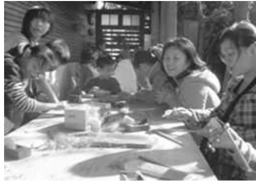
以三和瓦窯生產之清水磚所造的瓦窯燒烤麵包 遊客可製作屬於自己的檜木筷子帶回家

(2)包裝行銷特色套裝遊程：於年度節慶或特色觀光活動，如「內門宋江陣」、「黃色小鴨遊高雄」或甲仙「拔一條河」、「總鋪師」等電影上映熱潮，結合旅行業界推出主題套裝遊程並宣傳行銷，使更多遊客深入本市各區，探訪不同的觀光文化及產業體驗之旅。