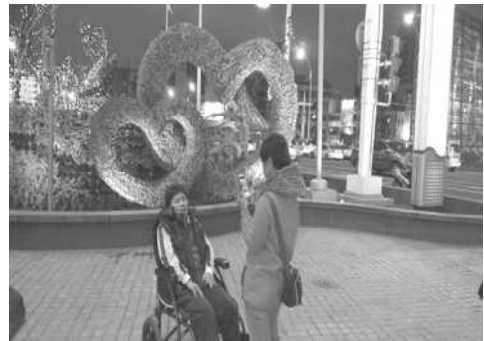
美麗島捷運站-心型立體植栽吸引遊客拍照