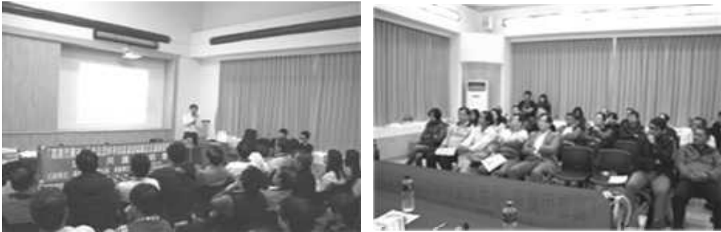
溫泉區管理計畫地方說明會