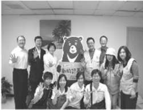
壽山動物園推行動物認養活動