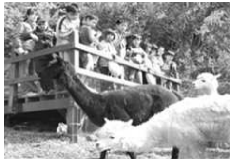
動物園設施關建－羊駝區