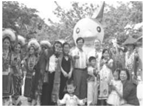
壽山動物園辦理園區教育推廣活動