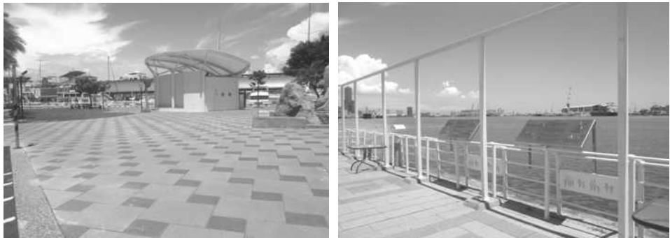
西子灣風景區整建工程

交通部觀光局補助 500 萬元，本府編列經費 500 萬元，辦理麗雄街周邊動線照明改善、哨船頭公園照明改善、欄杆光雕造型鋼板、座椅、車阻及解說設施、公廁整修、洗手台美化、西子灣動線景觀改善等，可提供哨船頭公園周邊環境完善觀光遊憩設施，已於 102 年 12 月完工。