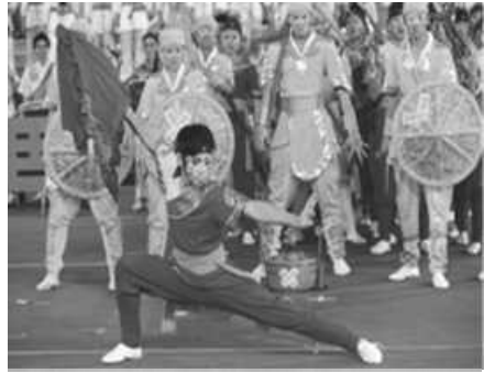
大專院校學生創意宋江陣