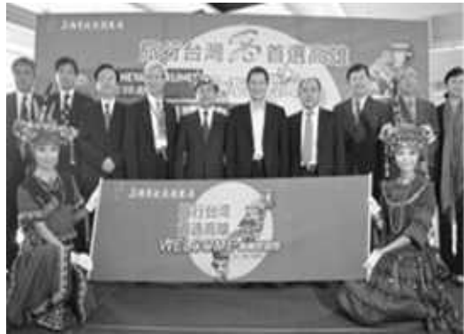
吉祥航空上海直飛高雄首航迎賓活動