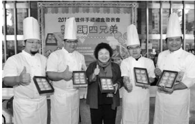
高雄伴手禮－甲仙芋頭四兄弟禮盒發表會

為推廣甲仙地區獨特的文化與飲食特質，特以甲仙芋頭酥餅作為計畫標的，藉由專業包裝設計提升芋頭酥餅產品質感，同時配合行銷推廣活動與通路的建置，進而增加銷售量；除積極輔導風災過後的甲仙地區產業重生外，也為遊客提供多樣化之伴手禮選擇，更強化高雄特色伴手禮的觀光行銷能量。