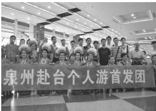
辦理泉州赴台自由行首發團迎賓活動