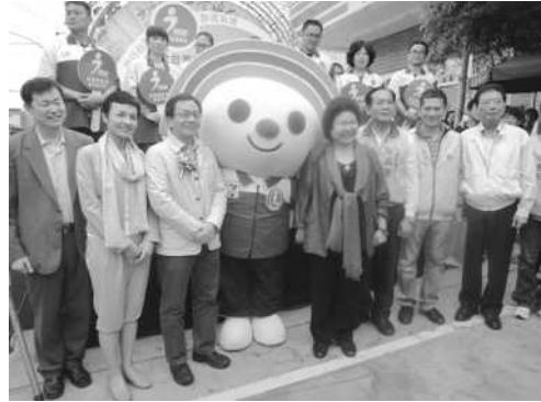
類 I-center 美濃啓用記者會