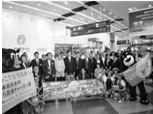
接待日本熊本縣包機迎賓活動