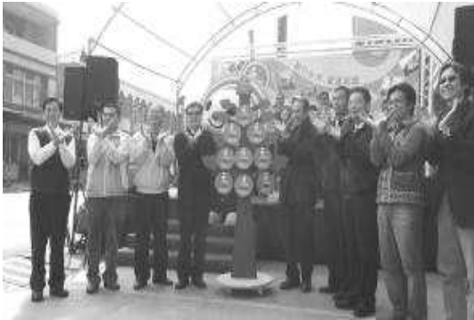
類 I-center 旗美 9 區啓用記者會