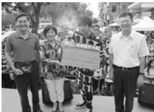
活動民衆反應熱絡

102年7月至9月連續7週於美麗島大道舉辦「藝遊·星光·美麗城」活動，活動期間邀請知名藝人小鬼黃鴻升及 Bi 畢書盡至美麗島大道舉辦簽唱會；並有街頭藝人展演和 COSPLAY 角色扮演，成功吸引約3萬人次至美麗島大道漫步、遊憩、嚐小吃、看表演。此次活動不僅民衆反應熱絡，在地商家亦表示活動效果良好，為美麗島大道注入新活力，帶來新契機，更為本市增添特色新景點。