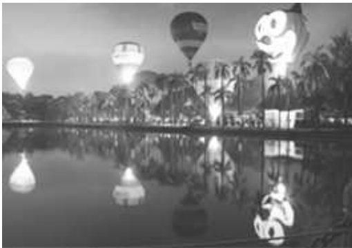
澄清湖熱氣球活動