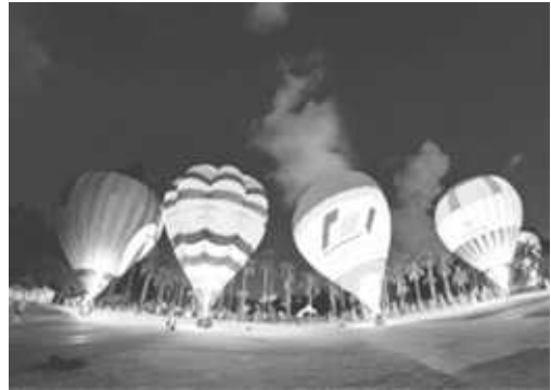
澄清湖熱氣球光雕音樂會