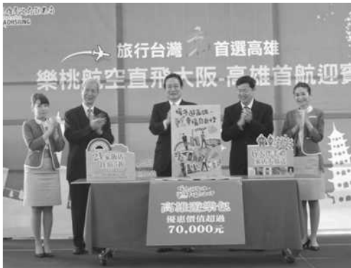
樂桃航空大阪直飛高雄首航迎賓活動