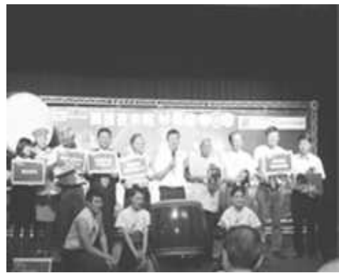
與觀光產業合作推廣夜間表演活動