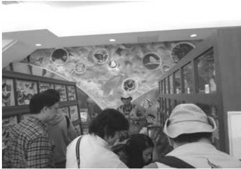
金獅湖蝴蝶園-「蝴蝶標本館」