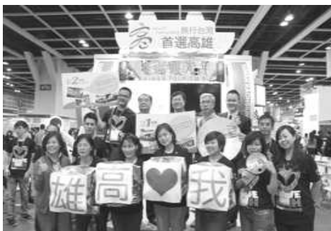
率團參加 2013 香港國際旅展