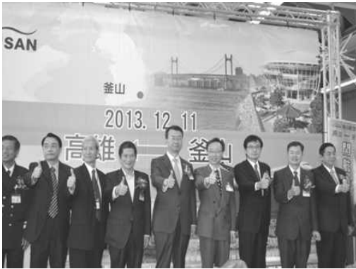
釜山航空釜山直飛高雄首航儀式