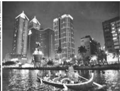
愛河貢多拉船賞遊夜間美景