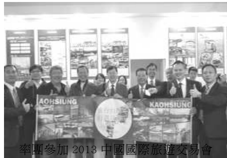
率團參加 2013 中國國際旅遊交易會