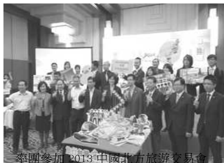
率團參加 2013 中國北方旅遊交易會