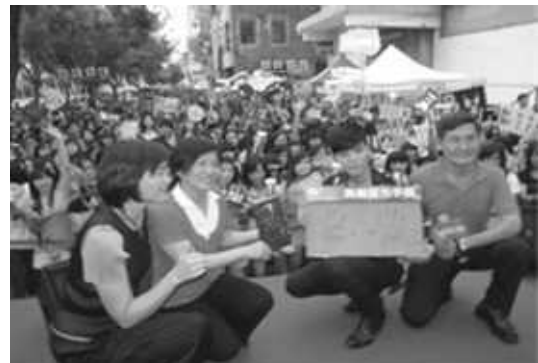
在地商家亦表示活動效果良好