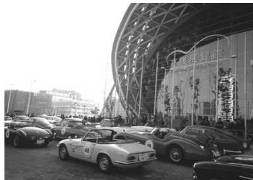
接待日本古董車感恩環台之旅