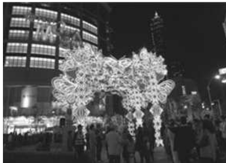
戀戀愛河璀璨煙火秀

高雄燈會為本市重要的指標性觀光節慶活動，每年均吸引大批參觀人潮。2014 高雄燈會藝術節活動於 103 年 1 月 28 日至 2 月 23 日舉行，為期 27 天，以不同風貌、現代、時尚、科技，繽紛亮麗的燈飾，炫麗展現在高雄鬧區街道上，使參與者享受高雄的便利交通、品嚐高雄的地方美食。今年燈會煙火重返愛河水岸施放，吸引國內外遊客前來觀賞，另今年元宵節適逢西洋情人節，特別舉辦萬人提燈大遊行，多項創意活動，讓遊客及市民共享歡樂時光、共創美好記憶。