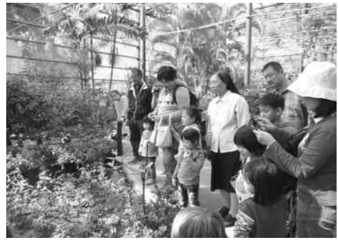
男女老少、攜家帶眷參觀金獅湖蝴蝶園