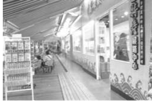
愛河河東路-高雄特產展銷中心