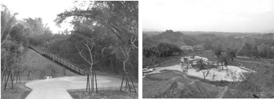
月世界風景區整建工程