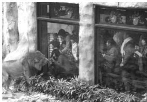
壽山動物園設施整建－獅園

為積極展現環境與生物多樣性之動物園主流教育展示價值，並提供縣市合併後之大高雄市民眾以及廣大南台灣地區民眾遊客更優質的生態保育教育與觀光遊憩園區，遂進行整建本市壽山動物園之園區動物生活及教育展示場所空間與相關服務設施，工程涵蓋新關鹿園及羊駝展示區、現有展示區（獅園、兒童牧場、鳥園及猩猩區）整建、公共設施改善、水電照明系統及設備管線改善、解說設施、植栽工程、雜項工程、假設工程（含工程告示牌、紐澤西護欄、甲種圍籬、臨時水電等）等，已於 103 年 1 月 3 日完工。