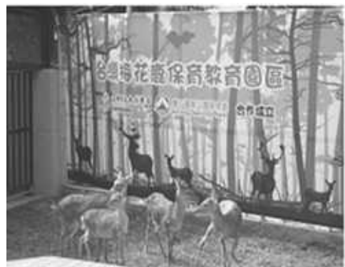
改造園區參觀介面，持續增加園區設施新亮點