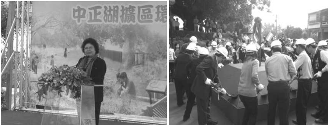
圖 24、25.美濃中正湖擴區環湖環境設施工程動土典禮