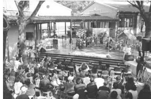
圖 8.《白馬、金團、黃仙人》有聲書 圖 9.《白馬、金團、黃仙人》新書發表會