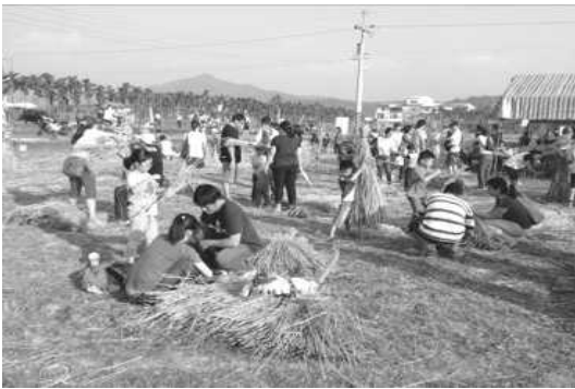
圖 14. 美濃田園音樂節-親子紮稻草人