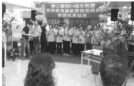
圖 6.旗山醫院客語成果發表

輔導衛生福利部旗山醫院開辦客語話劇、歌謠研習課程，並提供本會編製之客語教材、歌謠、宣傳用品等，加強民眾就醫服務，讓醫療洽公順利、溝通無礙，並落實母語傳承。（如圖6）