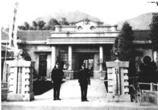
圖 26.日治時代美濃警察官吏派出所

針對美濃警察分駐所、日式木構宿舍歷史建築及週邊景觀整體規劃再利用，促成歷史建築文化空間再生，並建構成觀光旅遊諮詢、藝文中心，結合市民廣場形成景觀聚落。計畫總經費 4,500 萬元，目前美濃警察分駐所已完成民國 69 年增建部份拆除作業，重現原有日式和洋建築風貌；日式宿舍刻正進行拆卸木造建築體工程調查比對資料中。2 棟歷史建築修復工程預計 104 年 4 月完工。(如圖 26、27)