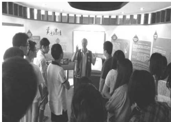
圖 31、志工解說客家文物館之文物

為有效運用社會人力資源，型塑客語無障礙環境，於高雄醫學大學附設中和紀念醫院、火車站、榮民總醫院、國立科工館、三民區公所、美濃文物館、新客家文化園區文物館等重要公共場所，設置「客語服務窗口」，提供客語之專業服務解說及導覽客家文化，102年計123名志工投入志願服務工作，102年9月至103年2月服務達12萬人次。(如圖31)