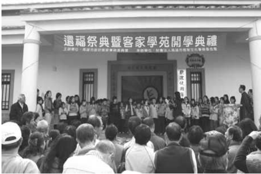
圖 16. 客家完福（還福）祭典