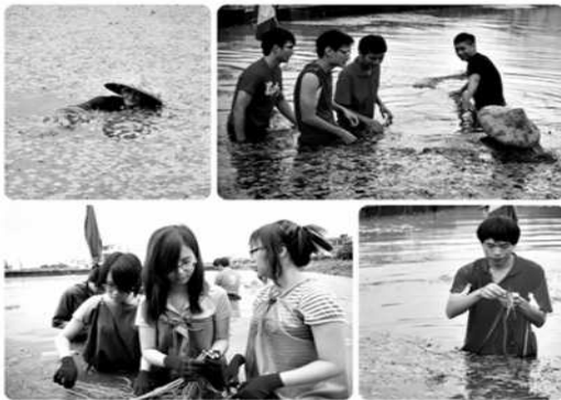
圖 10.臺灣青年文化營-農事體驗

鼓勵青年學子以多元、深度旅遊方式認識美濃客庄，透過生態保育、聚落文化、農村發展、勞動實作等培訓課程及深入參與社區服務方式，挖掘青年對客庄歷史的記憶，開拓社會視野，建立城鄉良性互動的社會關係，活動於 102 年 8 月 30 日至 9 月 2 日舉辦，計 40 位來自全台大專院校青年參加。（如圖 10、11）