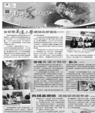
圖 33、第 47 期南方客觀