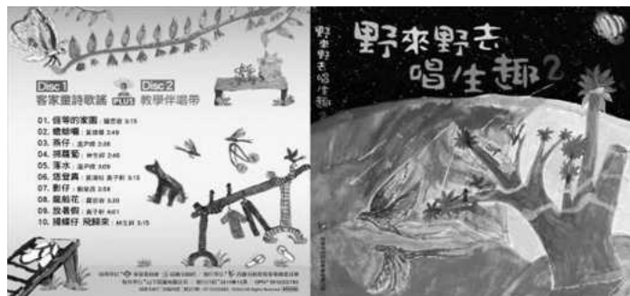
圖 7.《野來野去唱生趣2》客家童詩歌謠專輯

(1)邀請客籍優秀詞曲創作者創作生動、活潑、符合生活題材的趣味客家童詩歌謠，於102年12月出版《野來野去唱生趣2》專輯，藉由優美、琅琅上口的歌詞與旋律，提升學童及民眾學習客語興趣，除分送本市各級學校客語教學或民眾使用外，並於各大書局販售。（如圖7）