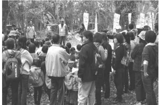
圖 17. 103 年全國客家日活動