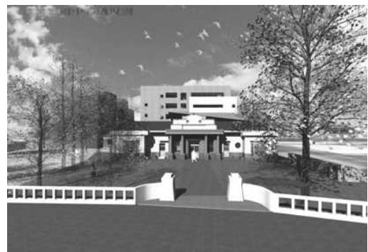
圖 27.遊客旅遊服務中心示意圖