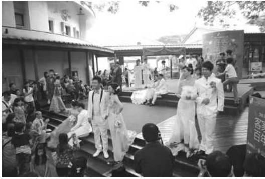
圖 12. 客家花香婚禮-時尚婚紗走秀