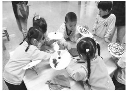
圖 19. 活化園區於文物館提供 DIY 活動