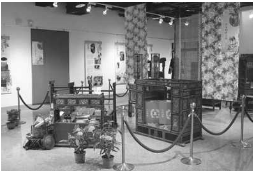
圖 20. 客憶·婚嫁－客家婚禮習俗文物展

為增進客家文化能見度，活化新客家文化園區，102 年 12 月至 103 年 2 月於文物館辦理「客憶·婚嫁－客家婚禮習俗文物展」、「油畫藝術創作展」及「客家學苑成果展」3 場展覽，逾 1 萬人次參觀。（如圖 20、21）