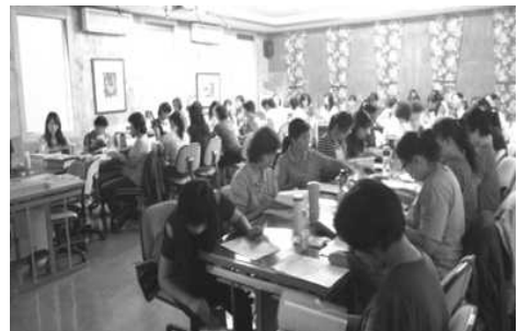
圖 3. 幼教全客語沉浸教學師培課程