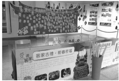
圖 21. 客家學苑成果展