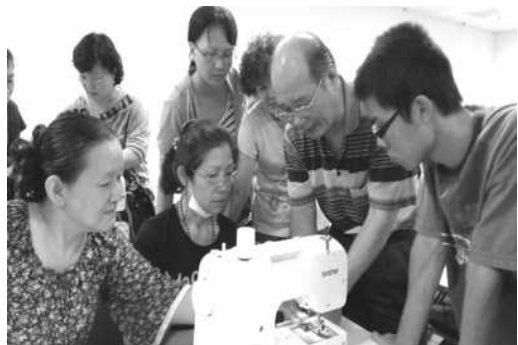
圖 30.服飾裁縫基礎訓練班上課情形