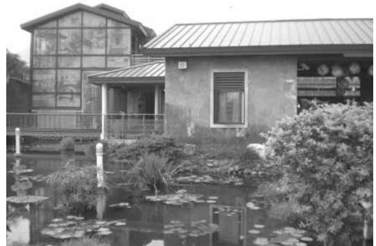
圖 22. 美濃客家文物館

1. 美濃客家文物館係以門票收費為營運基礎，102 年進行整體風貌改善工程，更新館內外軟硬體設備及設施，帶動 102 年營收總計 1,914,340 元，參訪人數計 102,235 人，同時積極配合各學校辦理戶外教學，透過導覽讓學生認識客家文化，不僅增加市庫經費，更有效傳承與宣揚客家文化，提升客家能見度。（如圖 22）