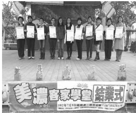
圖 5.美濃客家學堂結業式

展」、「我庄-林生祥的音樂與農村」3場文化講座及2場具在地精神的樂活美濃遊「南隆庄：水圳與農村生活、農式體驗」和「竹頭庄：鍾理和文學地景、農事體驗」，共計372人參與。透過不同主題讓民眾以寓教於樂的方式認識客家文化，並於102年12月21日假美濃客家文物館前廣場舉行盛大之成果發表與結業式。（如圖5）