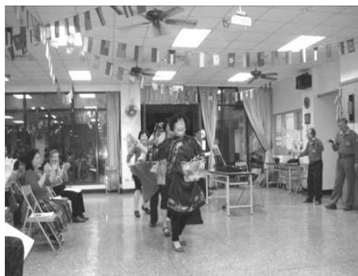
圖 23. 客家社團開辦客家技藝培訓課程

38 個客家社團開辦客家歌謠、舞蹈及技藝班等培訓課程，參與鄉親計 7,150 人；社區公演逾 6 場次，參與鄉親及民眾達 1,100 人次。另輔導 1 個客家社團辦理「滿年福秋報夜祭」活動，參與鄉親及民眾達 1,200 人次，公私齊力推廣客家文化，共同參與客家事務的發展。(如圖 23)