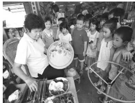
圖 1. 國小客語教學上課情形