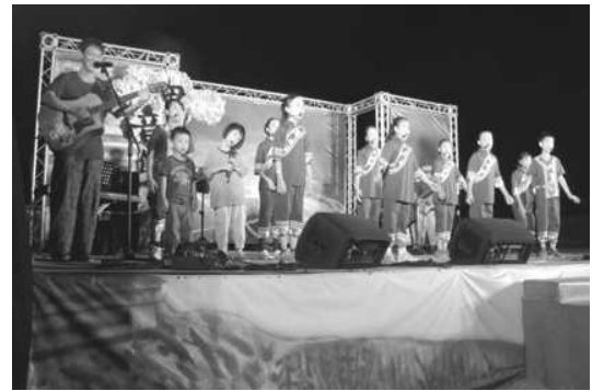
圖 15. 美濃田園音樂節-客語童謠發表