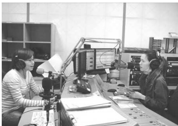
圖 32.「最佳時客」現場直播節目