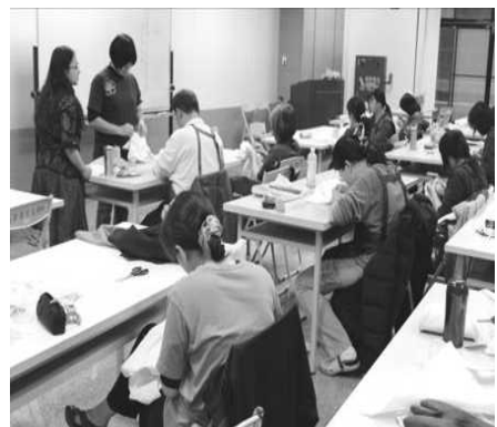
圖 4. 高雄市客家學苑-植物染/藍染

開辦「四縣腔客語中級暨中高級班」、「故事媽媽培訓班」、「客家古禮」、「客家拼布藝術」、「植物染/藍染」等 7 門課程與 3 場「族群電影系列講座」，計 306 人參與。提供民眾學習多元豐富的客家文化與技藝培訓課程，並於新客家文化園區文物館展出客家學苑成果展。（如圖 4）