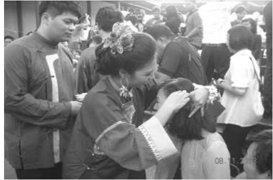
圖 13. 客家花香婚禮-新人為長輩插頭花