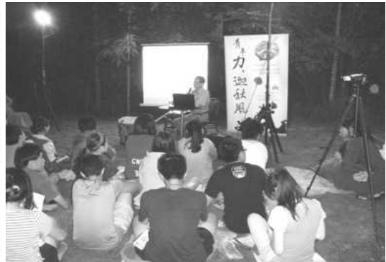
圖 11.臺灣青年文化營活動