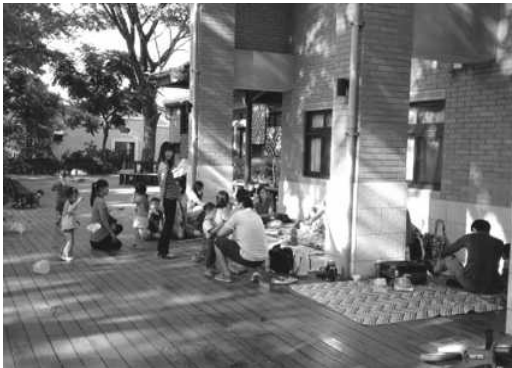
圖 18. 親子共學團體來新客家文化園區共學