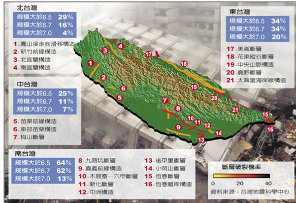
圖片截自中時電子報台灣的「地震危害潛勢圖」

從台灣地震科學中心依據國內斷層，計算出未來 30 年，所繪製孕震構造發生地震機率圖看出，南部發生規模 6.5 以上震度機率 64% 全國最高，發生規模 6.7 級以上的機率亦為最高 62%，且較其他地區高出 1 倍甚多。4/28 中央大學地球科學系教授李錫堤，更對近期發生的頻繁地震提出「台灣恐進入地震活躍期」的警告。此揭警訊，不禁讓人為逾 4000 棟未受檢老宅建物安全感到憂慮。