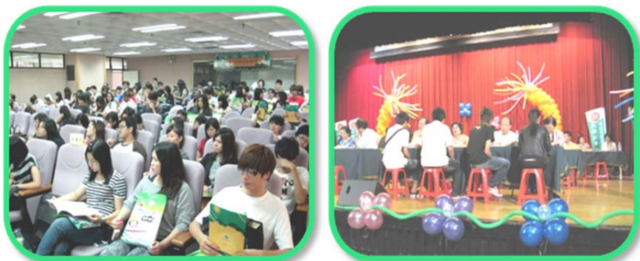
暑期青年職場體驗計畫聯合面試及教育訓練活動