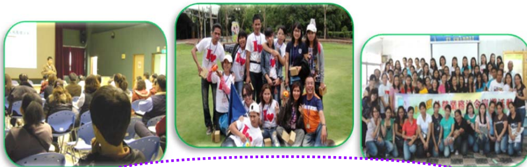
外籍勞工法令宣導及休閒活動集錦

(5)委由社團法人台灣勞工權益關懷協會辦理 100 年度家庭看護工關懷服務計畫，於本市家庭看護工聚集地，預訂 30 場次，至 7 月底已辦理 20 場次。