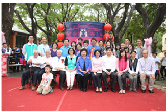
圖 13. 客家有囍婚禮

104 年 11 月 14、21 日於高雄新客家文化園區及美濃文創中心分別辦理客家有囍婚禮、田園音樂節、客家文創及農特產品展、客家美食節、客家童玩 DIY、慢遊音樂地景旅遊、拔蘿蔔體驗等活動，計 1 萬 4,290 人次參加，帶動千萬產值，有效達成振興客家產業、帶動高雄觀光旅遊、活絡都會客庄的目標。(如圖 13～圖 15)