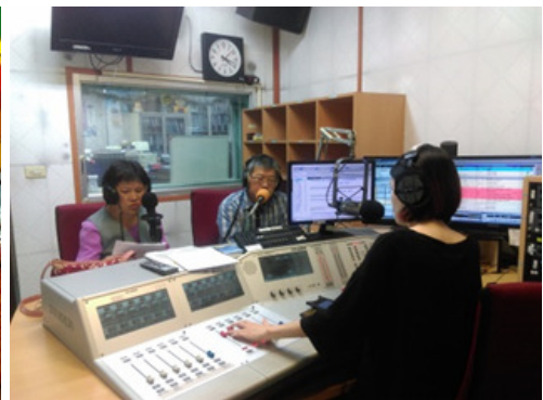
圖 22.「最佳時客」廣播節目