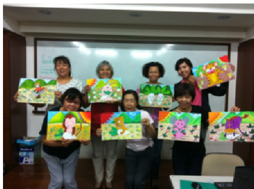
圖 5.客庄繪本故事創作班