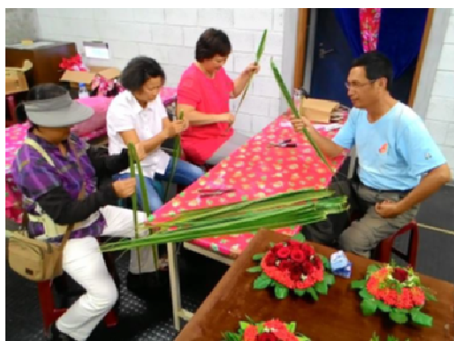
圖 6.從植物看客家人的智慧進階班