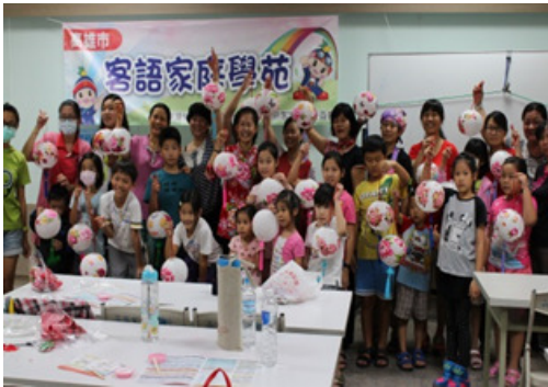
圖 2. 客語家庭學苑-花布燈籠班