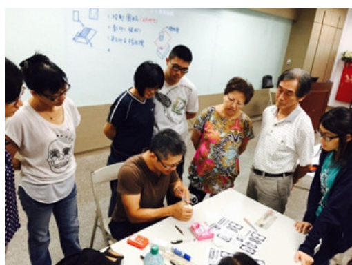
圖 7.客家學苑-客家文創設計