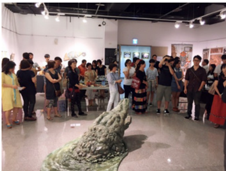
圖 23. 「跨限與連結」聯展