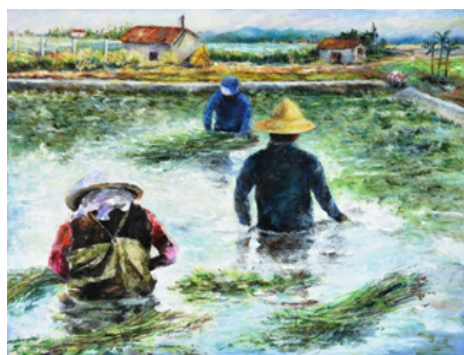
圖 26.張美蓮油畫藝術展

(5) 園區文物館舉辦搗麻糬、彩繪客家紙傘體驗活動，吸引親子及團體報名參加，104 年 9 月至 105 年 2 月止共計 27 場次，895 人次參與。(如圖 27、圖 28)