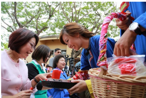
圖 15. 客家傳統婚禮習俗-食新娘茶