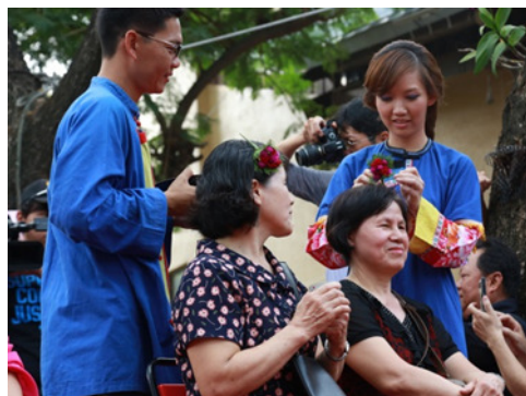
圖 14. 客家傳統婚禮習俗-插頭花