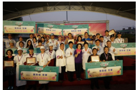
圖 37.南區客家美食料理比賽

104 年 11 月 28 日與客家委員會假高雄蓮池潭物產館廣場合辦，以南區六縣市在地客庄食材進行競賽，計有 16 隊料理好手參與競賽、25 攤客家特色商品參與展售，現場並有客家藝文表演，吸引 4,230 名民衆到場觀摩。(如圖 37)