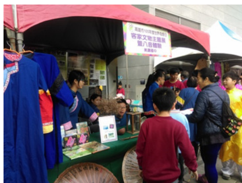
圖 18. 客家文物展示及出版品展售