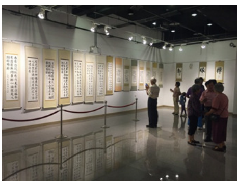
圖 25.客家諺語書法班師生成果展