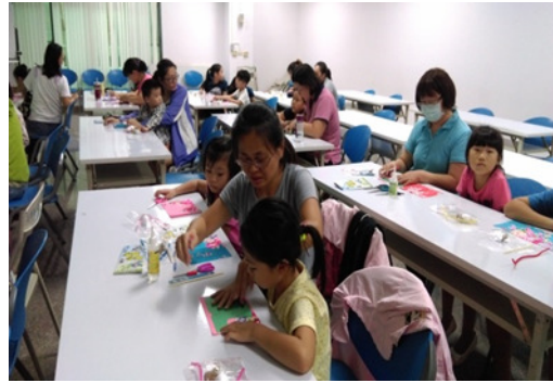
圖 3. 客語家庭學苑-手作坊