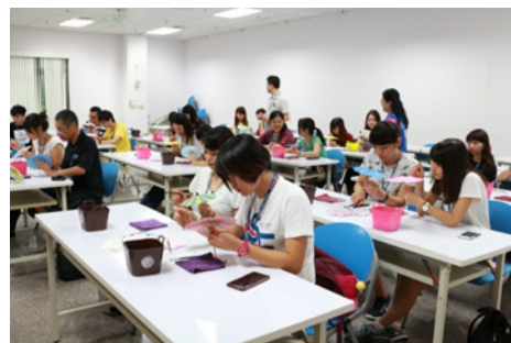
圖 28.民眾體驗彩繪客家紙傘