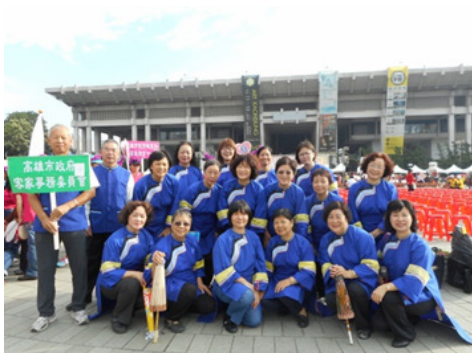
圖 9.本會志工參加國際志工日