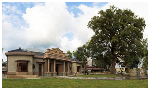
圖 33.美濃文創中心-舊警察分駐所