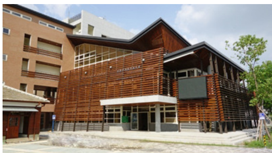
圖 32.美濃文創中心-教育藝文館

1.「美濃文創中心」104年11月6日正式開幕，慶祝系列活動自6日起至8日盛大舉辦，共邀請十多組藝文、音樂團體參與，同時舉辦「戀戀美濃河展」、「創意市集」以及「文創工作坊」等活動，吸引1萬1,000人次參觀，有效達成宣傳行銷效益，並帶動在地觀光產業發展。(如圖32~圖35)