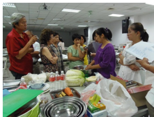
圖 8.客家學苑-客家醃漬美食