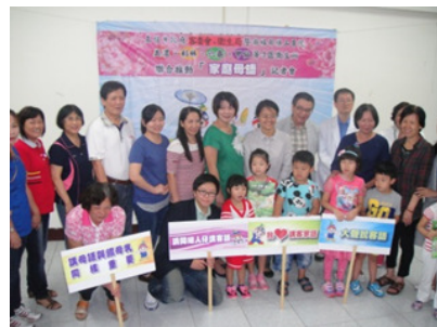
圖 4. 家庭母語記者會

與旗山醫院及美濃、杉林、六龜、甲仙等 4 區衛生所聯合推廣「家庭母語」，104 年 9 月 1 日辦理宣傳記者會，廣邀各區母語家庭共襄盛舉，鼓勵父母跟孩子多以母語交談，並提供本會製作的客語童謠專輯、出版品及嬰兒用品，落實母語扎根政策。(如圖 4)