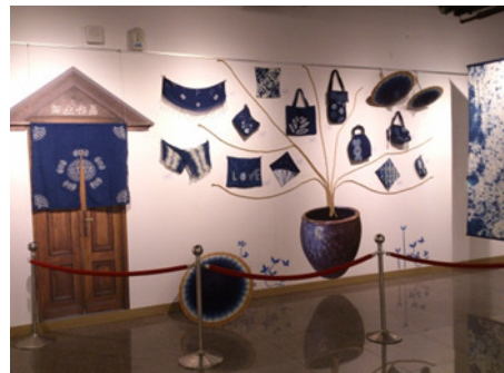
圖 24. 客家藍染創藝展