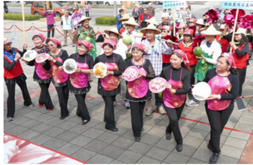
圖 20.環保創意踩街遊行