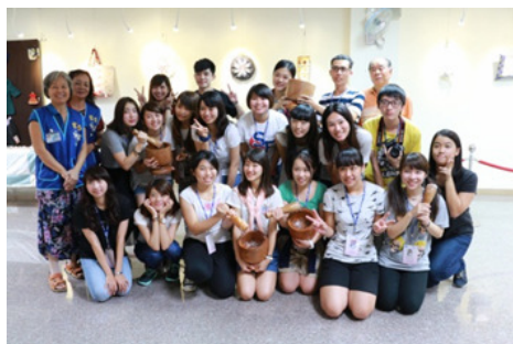
圖 27.日本遊客體驗搗麻糬

(5) 園區文物館舉辦搗麻糬、彩繪客家紙傘體驗活動，吸引親子及團體報名參加，104 年 9 月至 105 年 2 月止共計 27 場次，895 人次參與。(如圖 27、圖 28)