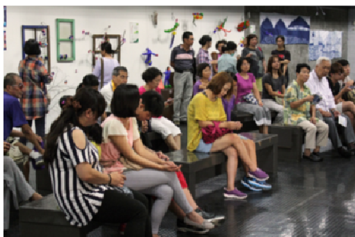
圖 29.環境藝術創作展成果發表