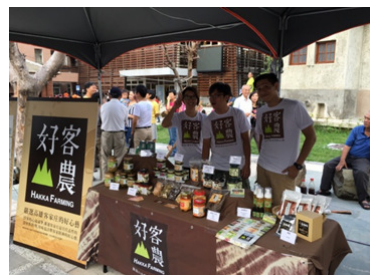
圖 36.「好客山農」設攤行銷

延續 103 年「高雄市客家文化重點發展區特色產品遴選、設計包裝及通路發展計畫」型塑「好客山農」品牌成效，持續協助美濃、杉林、甲仙、六龜區農特手工、