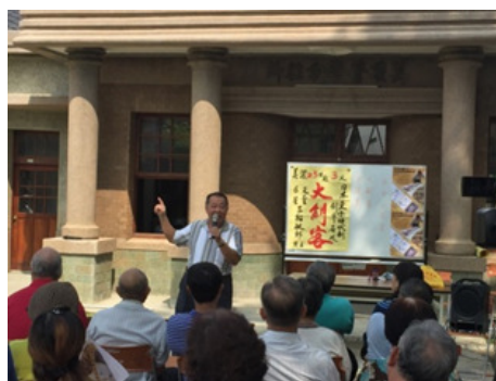
圖 12.美濃地區戲院風華座談