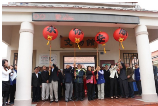
圖 16. 市長與議長等貴賓上燈祈福