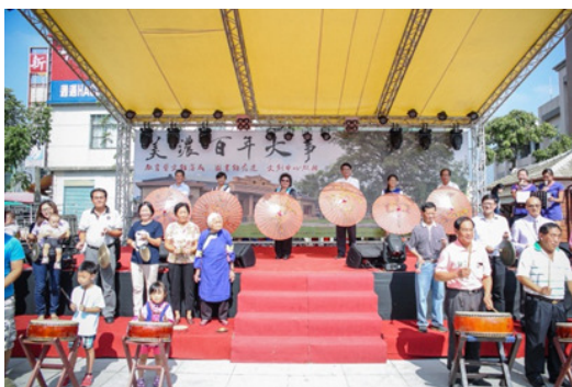
圖 34.美濃文創中心開幕