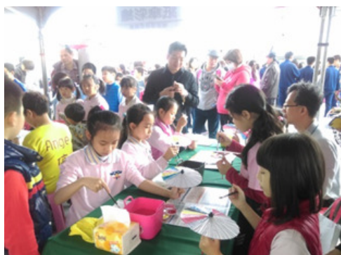
圖 17. 世界母語日-紙傘彩繪 DIY

105 年 2 月 20 日與教育局、原民會假鳳山行政中心共同辦理，以客家、原住民、新住民及閩南等四族群文化為主軸，規劃歌舞動態演出及靜態展示，展現各族群的精采多元文化，並提供多種闖關遊戲，讓參與者藉由闖關活動，體驗和認識不同族群的文化，鼓勵孩子多說母語，落實語言札根政策。（如圖 17、圖 18）