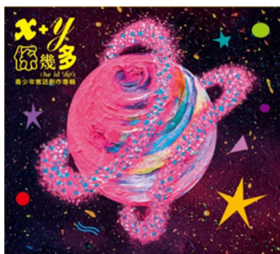
圖 11.《x+y 係幾多》專輯

104 年 11 月出版青少年客語創作專輯《x+y 係幾多》，以其中一首青少年創作歌曲作為專輯名稱，歌詞均由美濃在地青少年合力撰寫，樂曲則由客籍音樂人聯手創作，可說是結合兩個世代同心協力完成的作品，集合搖滾、流行、嘻哈、民謠、龐克、後搖等多元曲風，搭上青少年的純真心情寫照及日常生活點滴，打破以往傳統的客家樂曲框架，帶來創新的感受，深獲民衆喜愛與好評。(如圖 11)