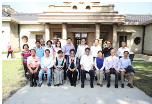
圖 35.美濃文創中心開幕留影