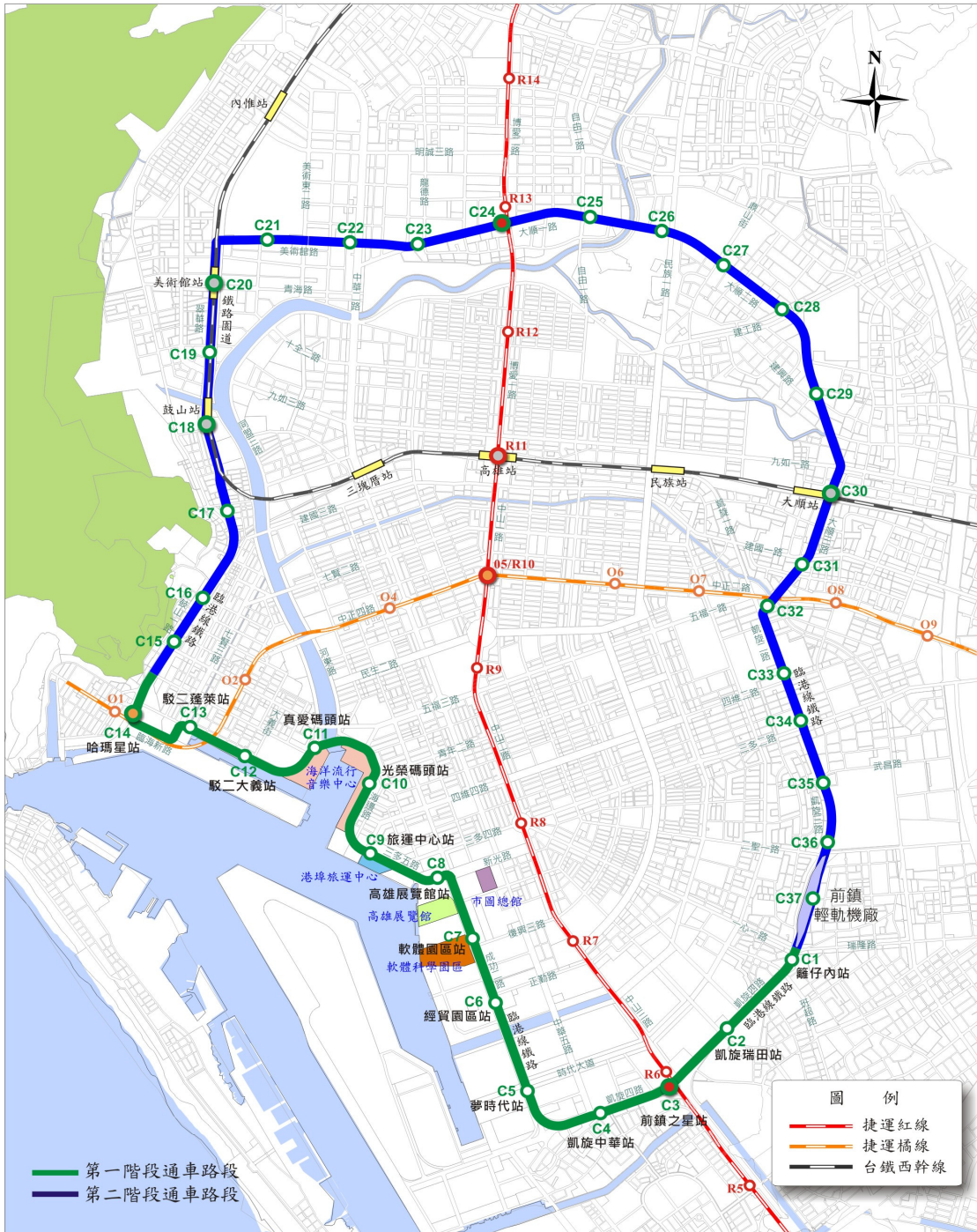
高雄環狀輕軌捷運建設路網示意圖