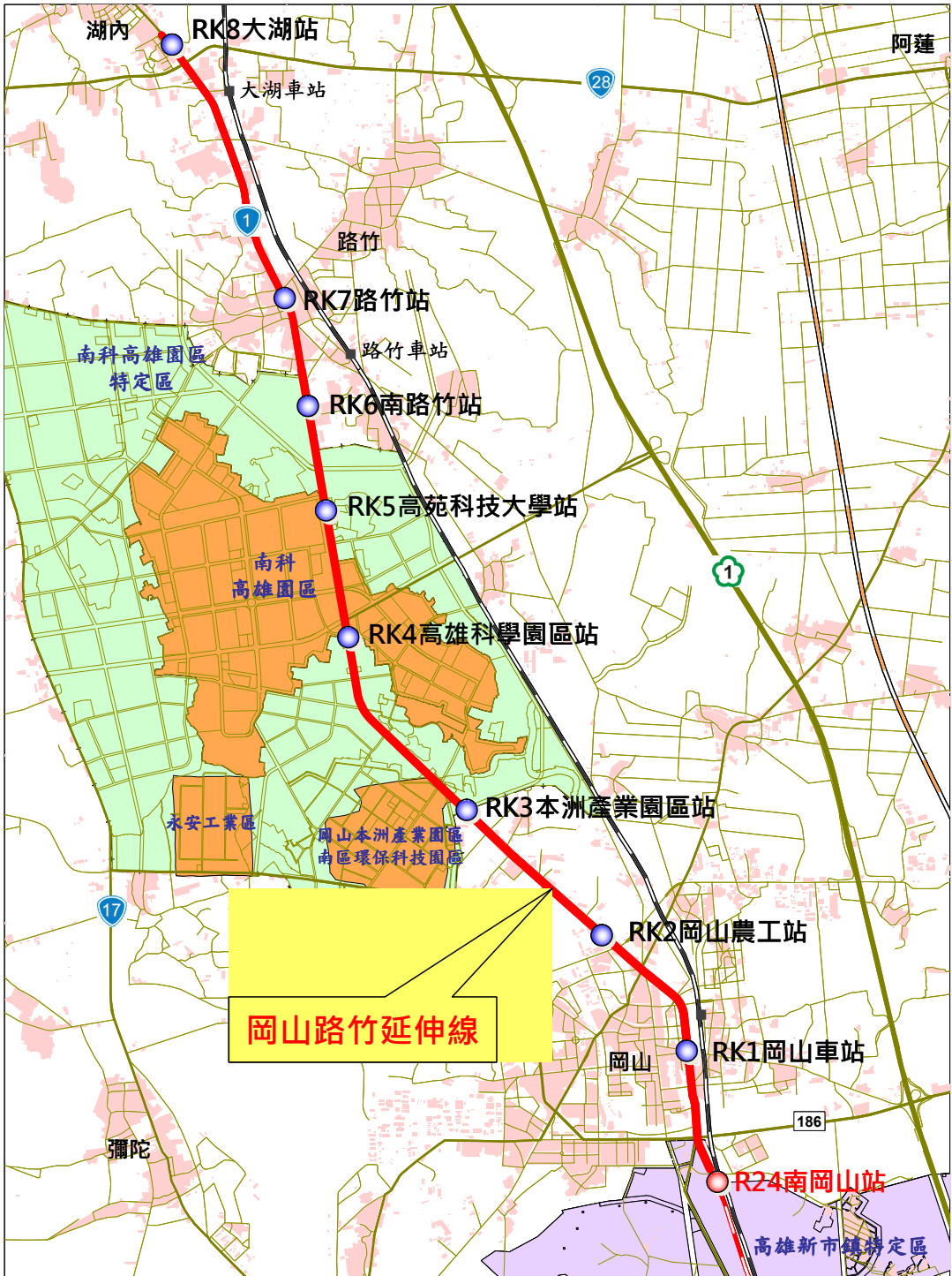
高雄捷運岡山路竹延伸線建議路線圖