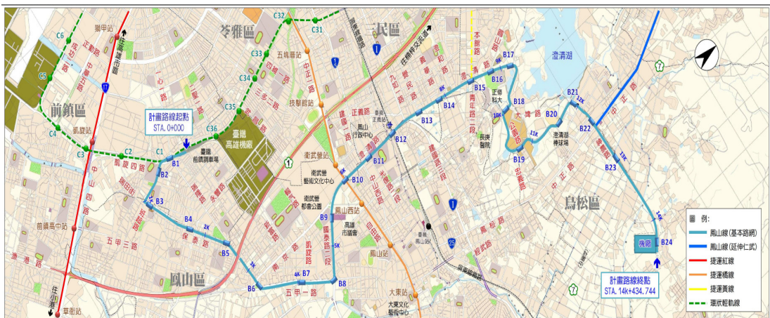
高雄捷運鳳山線建議路線圖

目前鳳山線正進行可行性研究，可行性研究委託技術服務案於 102 年 5 月 15 日與得標廠商完成簽約，103 年 8 月 6 日期中報告審定，現正進行期末報告審查作業。另依 104 年 12 月 23 日高雄捷運整體路網規劃期末報告審定結果，鳳山本館線將併入都會延伸環線（一環及二連結）可行性研究辦理。