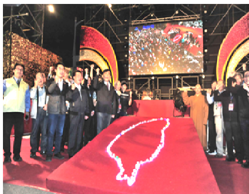
高雄燈會開幕祈福活動