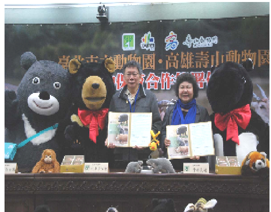
與臺北市立動物園簽署保育合作協議