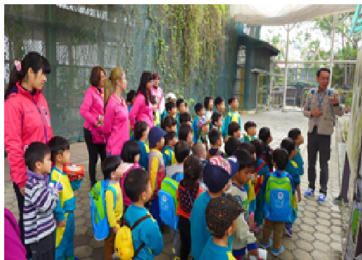
學童至蝴蝶園戶外教學