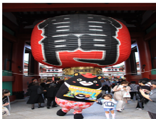
高雄熊東京行銷高雄