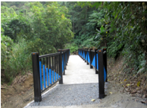
觀音山登山步道及邊坡整建