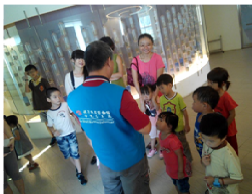
貝殼館志工提供遊客導覽服務