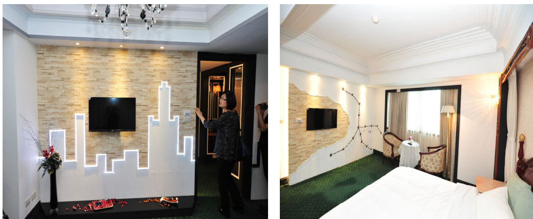
創意房型設計競賽成果