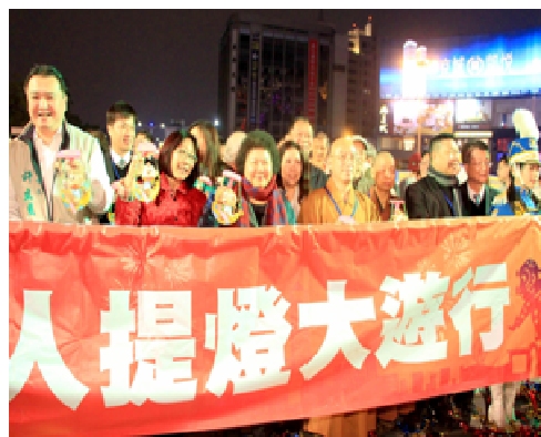
高雄燈會提燈大遊行