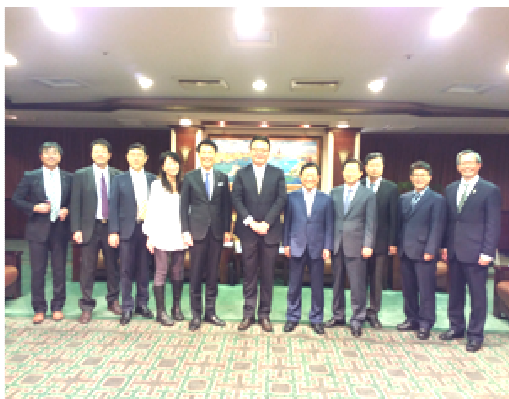
日本福岡及韓國釜山兩位副市長來訪