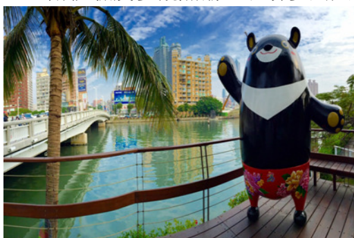
愛河水岸璀璨星帶整建

104 年 8 至 10 月於愛河、蓮池潭、金獅湖等水域舉辦水域遊憩體驗活動，包含獨木舟、風浪板、立式划槳等無動力浮具，結合水上嘉年華、闖關競賽水域遊憩體驗、研習營、鐵人競賽、認證等活動，帶動水上運動體驗及參觀熱潮，吸引參與人潮約 6 萬人次。