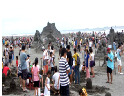
旗津黑沙玩藝節遊客人潮