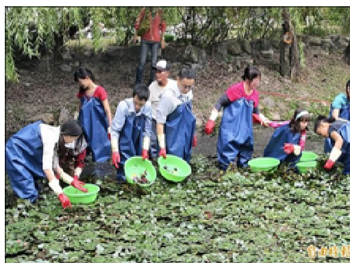
採菱角體驗遊程活動