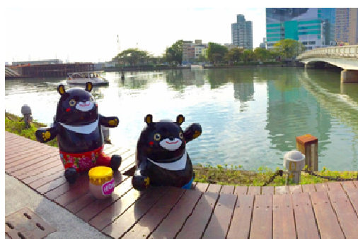
高雄橋周邊環境美化