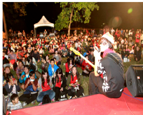
左營舊城音樂會活動