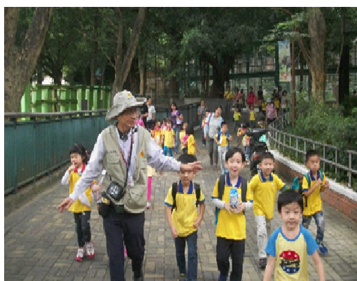
動物園志工導覽解說

104 年於暑假期間每周五、六、日延長開放時間至晚上 8 點，配合規劃辦理多元類型之夜間展演，搭配主題性之特色表演，並安排志工導覽解說，帶領民衆於夏季夜間欣賞動物生態之美，暑期夜間遊園新奇體驗已成為壽山動物園獨具之特色。