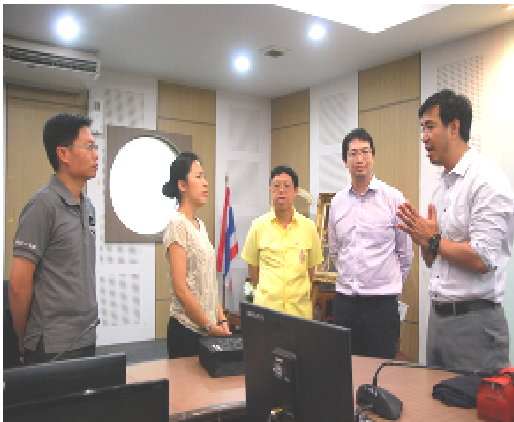
拜訪泰國國家動物園管理局