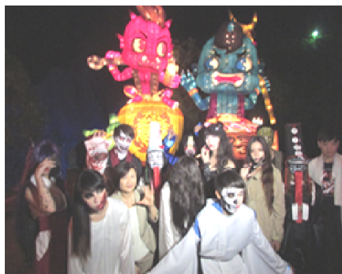
田寮奇幻月世界活動