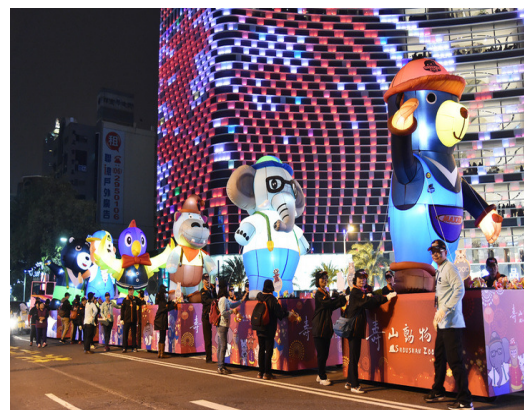
「壽 Q 家族」裝置藝術展出及參與燈會遊行