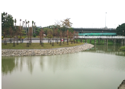
金獅湖園區邊坡護岸修復