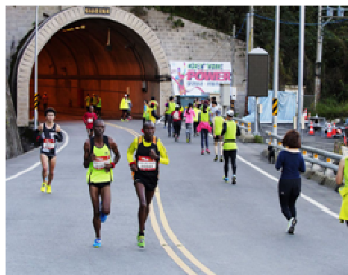
南橫馬拉松路跑活動