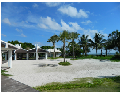
旗津海岸公園整建風貌

延續 104 年旗津黑沙玩藝節吸引遊客達 40 萬人次之熱潮，105 年將持續積極爭取中央經費補助辦理「2016 旗津黑沙玩藝節」，期打造旗津夏日品牌活動，預計規劃沙雕主題系列活動，同時配合交通部觀光局主題活動創造話題，成為高雄夏日最大型活動，帶動地方產業發展。