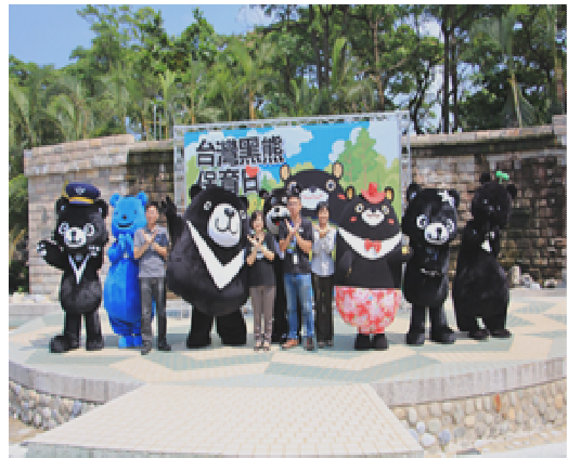
動物園教育推廣活動