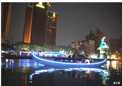
貢多拉船浪漫遊愛河