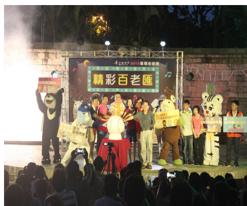
動物園暑期夜間開放