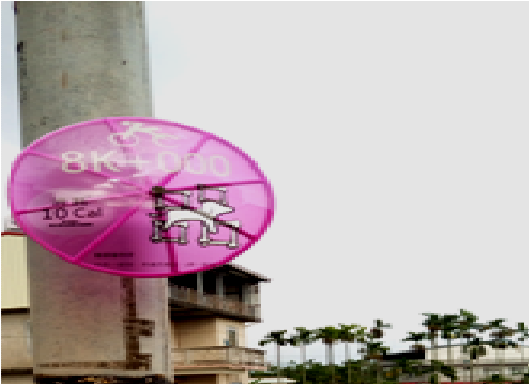
觀光導覽指示標誌整建