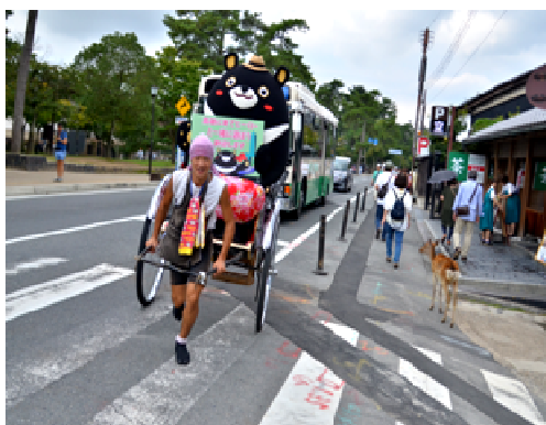
高雄熊日本奈良行銷高雄