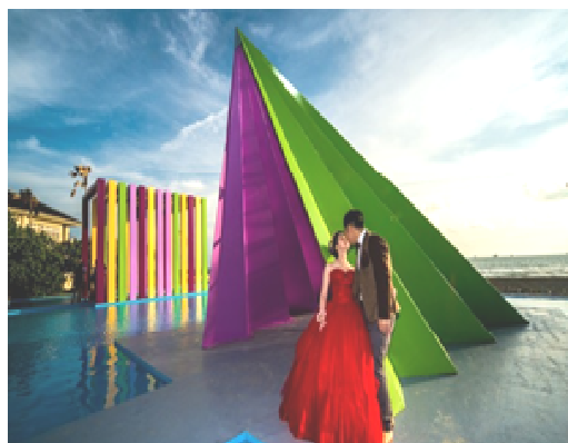
旗津「彩虹教堂」婚攝主題園區