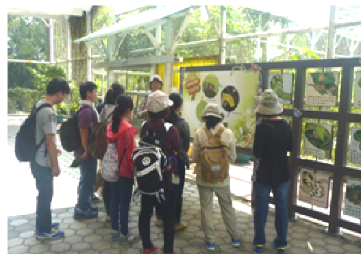
蝴蝶園志工提供專業導覽解說