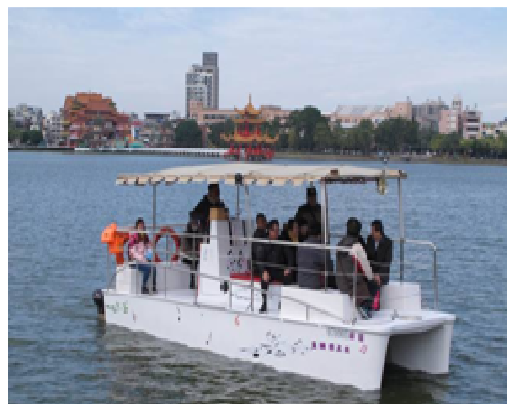
蓮池潭觀光電動遊潭船