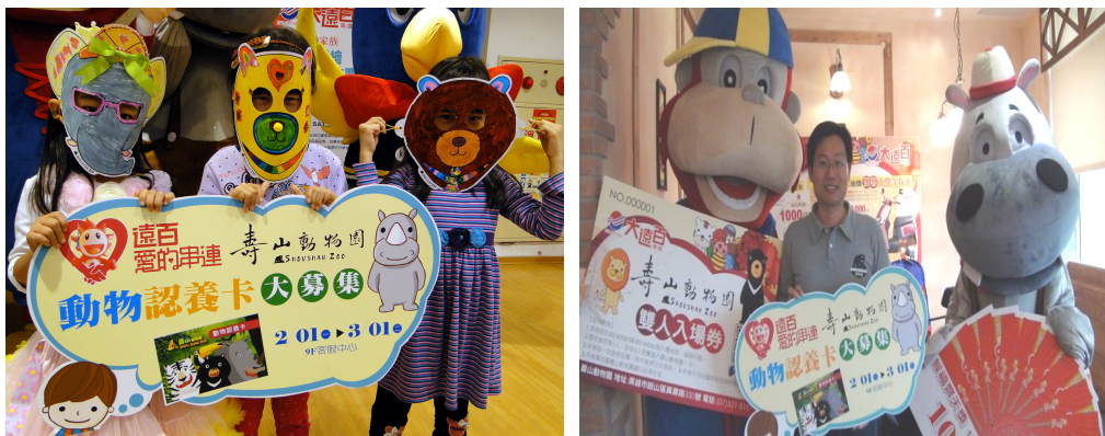
與企業合作動物認養推廣活動

司、好市多、正新輪胎等 7 家企業及 785 位民衆參與動物認養行列。另義大犀牛職棒、大遠百等企業亦與本局合作舉辦活動，共同推廣動物認養，增加動物園曝光率。