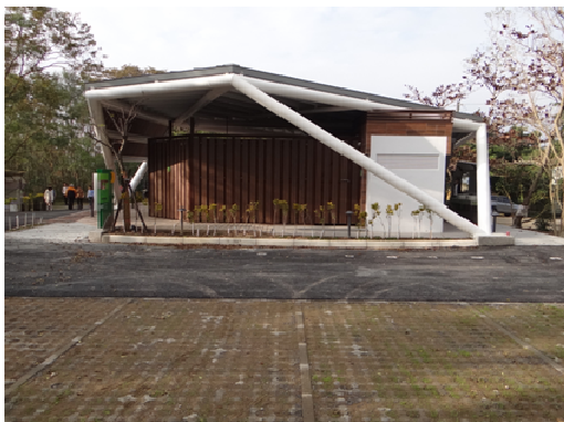
燕巢泥火山多功能服務中心

本府編列 900 萬元，辦理月世界風景區服務設施整建改善，現規劃設計作業中，預定 105 年 11 月完工。