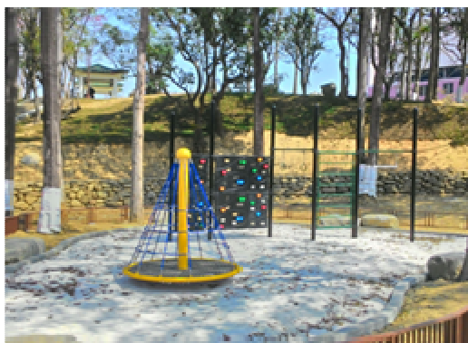
金獅湖風景區設施整建

105 年 1 月分 2 梯次舉行，活動內容結合蝴蝶與自然生態教育及剪紙藝術創作，受到家長及學童熱烈迴響。