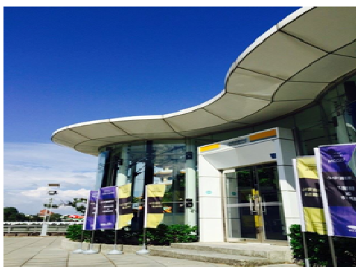
蓮池潭遊客紀念品服務中心