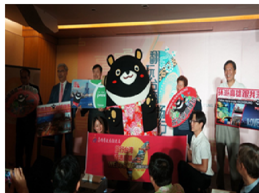
好玩卡國際旅展推廣