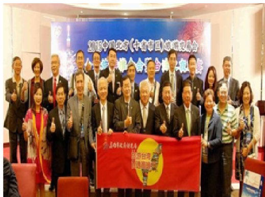
天津北方十省旅展