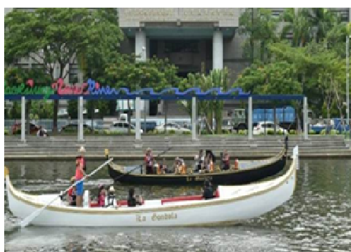
愛河水上市計程車