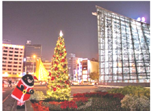
捷運美麗島站植栽景觀創作