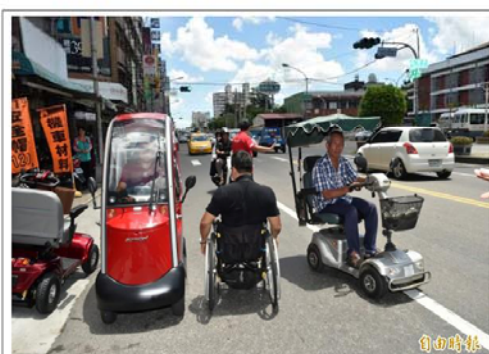
台灣人口結構愈加高齡化，路旁老人代步車隨處可見，惟「交通事故調查報告表」中卻不見此選項。影響事故分析結果。正本清源之道，建議將資訊更完整的「肇事調查筆錄」納入電子化項目，併入交通事故資訊大數據資料庫範圍。

目前，高市交大已完整將「事故調查報告表」及「事故碰撞圖」電子化，惟尚缺詳實記錄肇事過程的調查筆錄。為因應愈加複雜的車禍類型與研究需求，建議交通局、交大，應盡速開發能便利員警，以語音辨識輸入的程式，將車禍事故「肇事調查筆錄」、「交通事故談話紀錄表」電子化，併入肇事分析的大數據資料庫中。