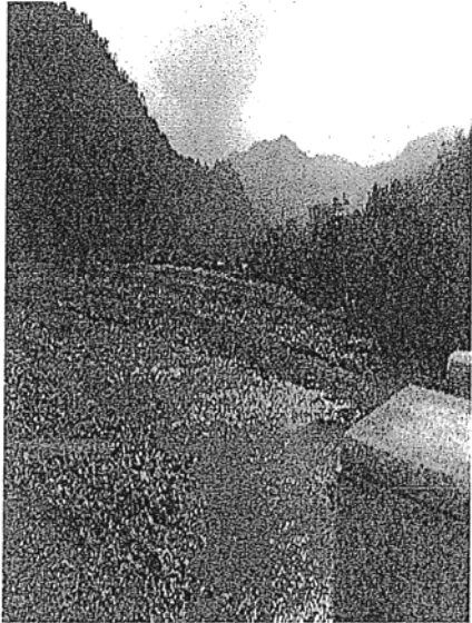
民生大橋設水泥護岸