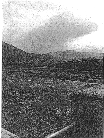
民生大橋設水泥護岸