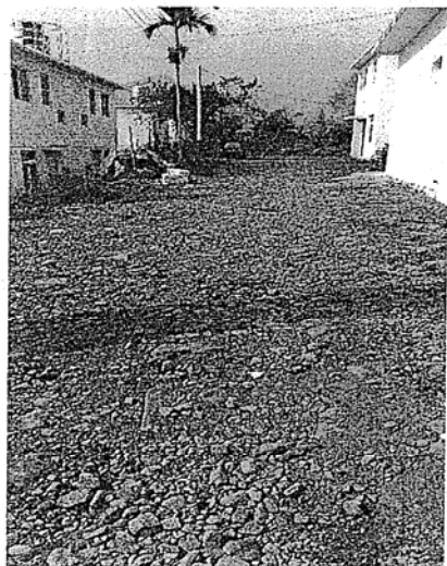
自力造屋無設水溝