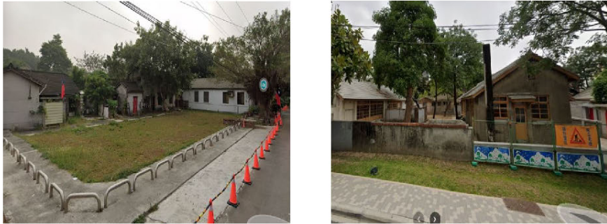
圖 5 黃埔新村照