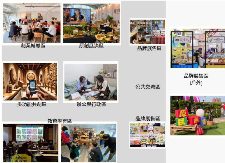
圖 4 空間規劃示意圖