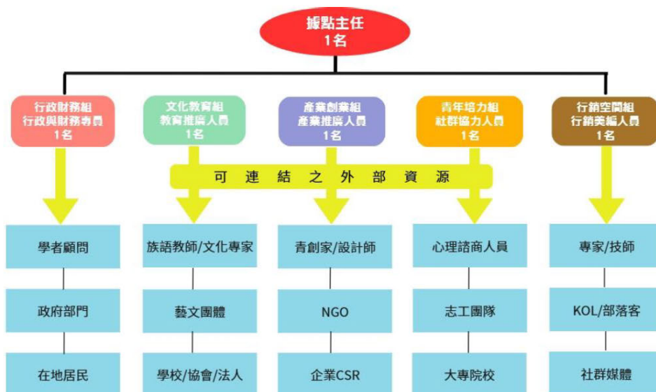
圖 5 人力資源規劃