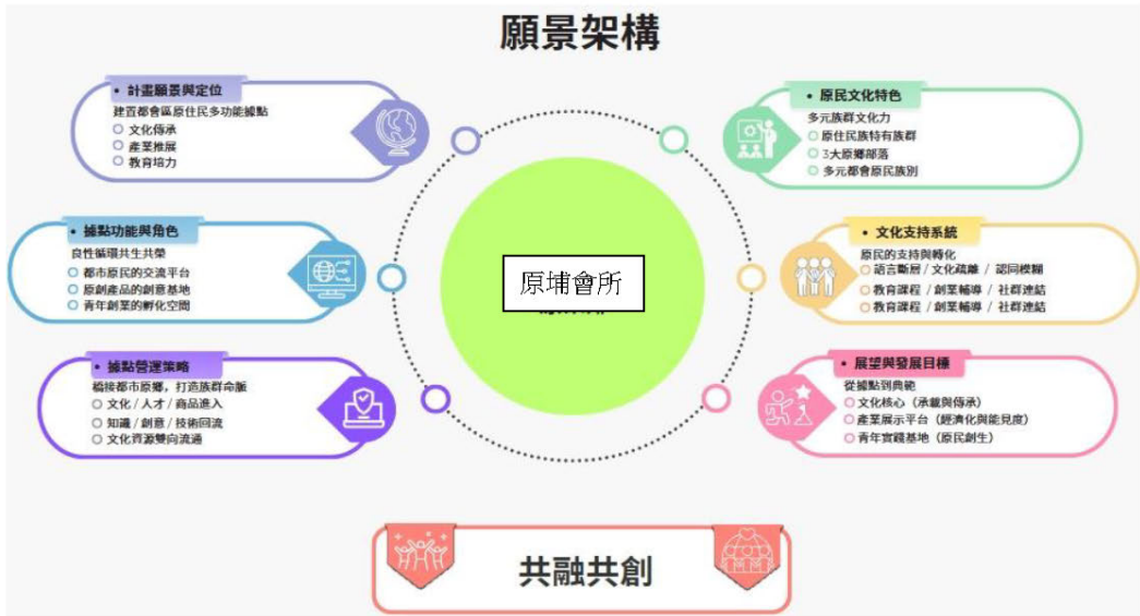
圖 1 願景架構