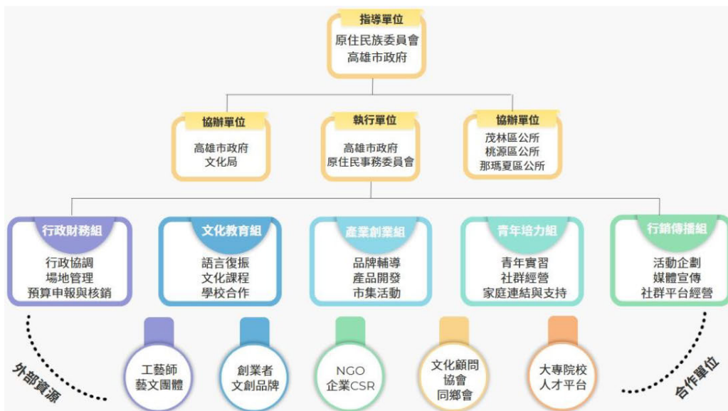
圖 2 系統架構