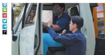
警上大型車駕駛視野盲區，請「萬事小心」。

https://www.chinatimes.com/realtimenews/20240301003742-260402