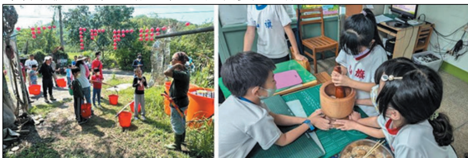
圖 6、客家語言文化推廣活動（左：客庄風土人文活動、右：傳統技藝文化活動）

113 年於客庄區辦理 8 場探訪客庄風土人文活動，於都會區辦理 12 場客家傳統技藝文化活動，計 487 人次參與。(圖 6)