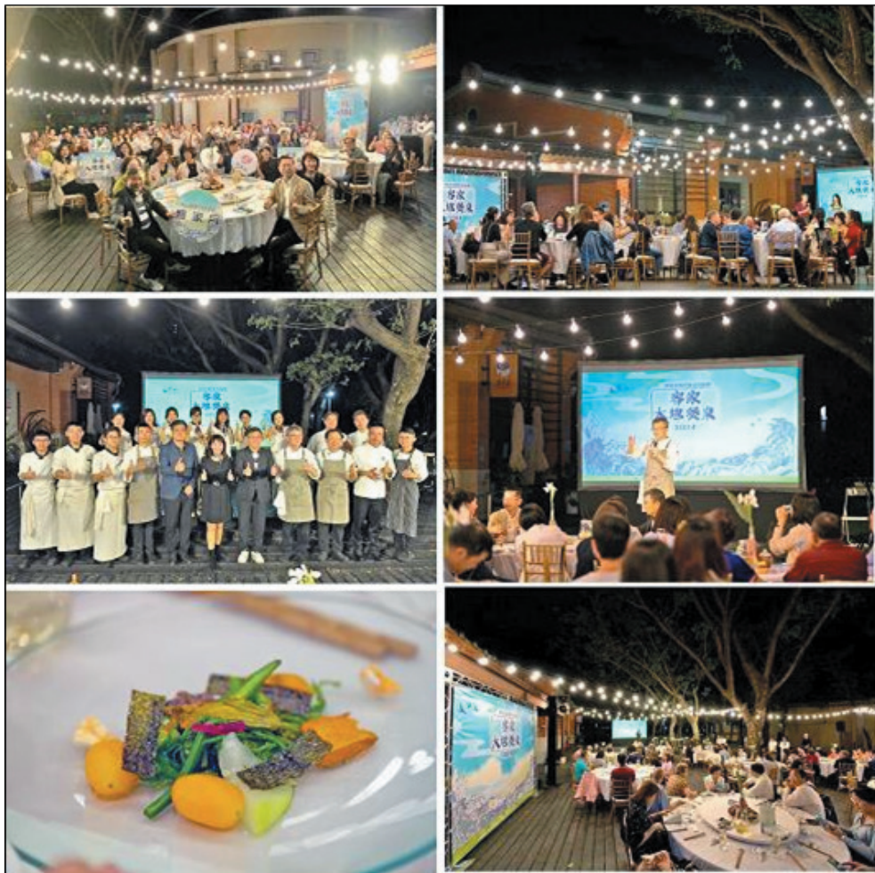
圖 23、2024 客家大地餐桌

調紀錄，研發出創新客家風土料理。活動開放民眾網路報名參加餐宴，113年11月23日於新客家文化園區辦理，共計66席次。為擴大推廣範圍與時間，進一步促進高雄客庄農產經濟發展，提升在地小農的能見度，並為客家文化的傳承注入新的活力，於11月起至12月推出全新「2024高雄客家月」活動，廣邀高雄市都會區及客家重點發展區的餐飲業者共17家餐廳與小農合作，打造一條「產地到餐桌」的在地美食連結，為市民朋友和外地遊客呈現一場充滿客家風情的美食之旅，一起來推動高雄市客家美食的觀光版圖。（圖23）