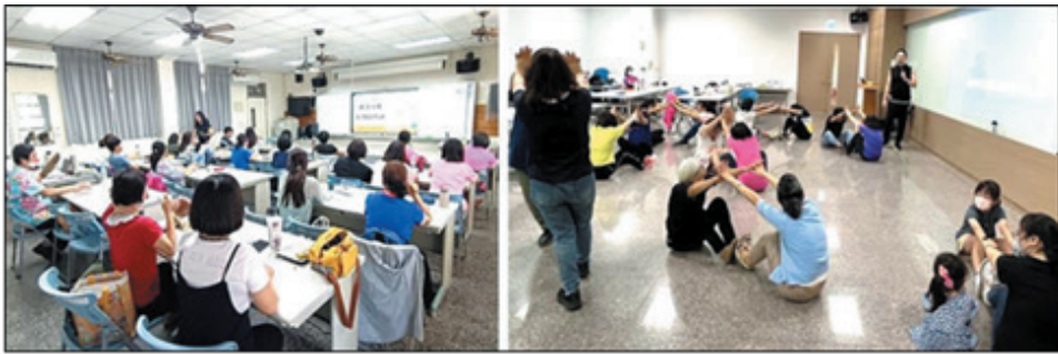
圖 2、客語師資專業知能研習

(1)為加強本市客語教學人員專業知能，113 年辦理「讀者劇場指導技巧」、「動植物客語教學」、「客家諺語故事教學」及「幼兒園客語童謠律動」等 19 場課程，計 641 人次參與。(圖 2)