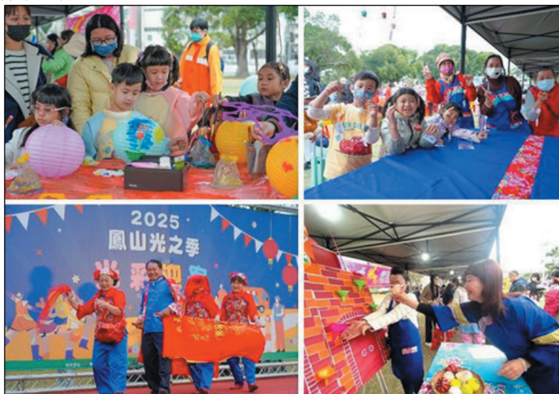
圖16、「鳳山光之季~光彩迎客」有客家舞蹈、客家元素DIY及有趣的客語遊戲

結合鳳山燈會盛事，114年2月8日於鳳山大東公園辦理，多組表演團體輪番上場，還有具客家特色的花布天燈與彩繪燈籠、趣味客語闖關遊戲與特色市集，邀民眾共同感受燈會與客家文化交織的節慶氛圍，計500人次參與。（圖16）