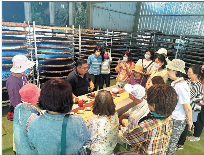
圖 33、客庄遊程帶民眾至「欣園製茶」體驗茶席

(四)結合中央機關辦理「客庄特色遊程聯合推廣計畫」與經濟部中小及新創企業署跨部會合作，於「城鄉島遊」網站上架本市客庄景點及店家，推薦三條遊程，並配合該署「集客出發，共下遊 Hakka」集點換好禮活動，集結中央、地方力量共同推廣，提升遊程與店家知名度及聚客力。