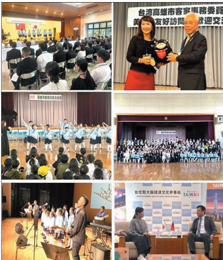
圖 22、高雄市客家兒童合唱團 2024 台日交流活動

為行銷客家音樂及推廣本市客家文化，113 年 10 月 22 日至 26 日前往日本美濃市文化會館（音樂廳）演出，並拜會日本美濃市役所、美濃小學校、臺北駐大阪經濟文化辦事處等，藉由純淨優美的童聲，傳唱音樂的力量與客家文化藝術美學，為臺灣音樂文化紮根，促進國際交流。出訪人員含團長、指揮、伴奏老師、團員、隨行工作人員與家長共 33 人。（圖 22）