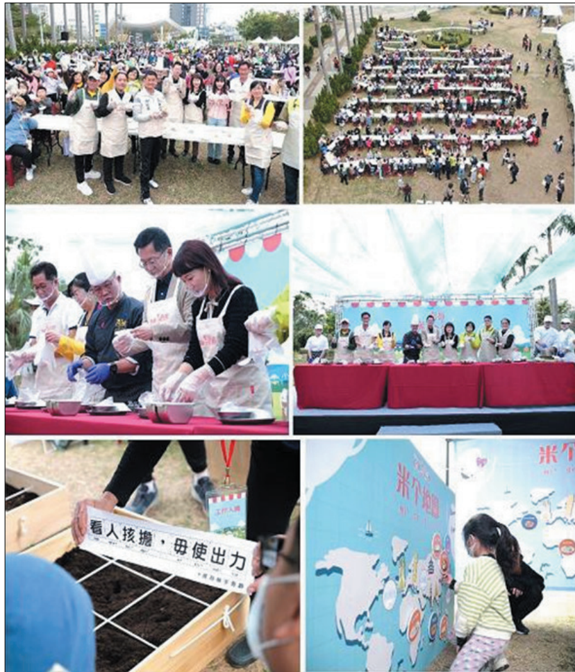
圖 25、高雄市米食節&客家米香迎新年一千人『蛇』飯糰活動