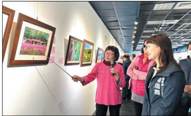
圖 26、高雄客屬美濃同鄉會-美濃鄉親書畫藝文展