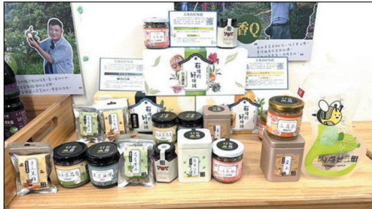
圖 32、「右堆的好味緒」三金禮盒