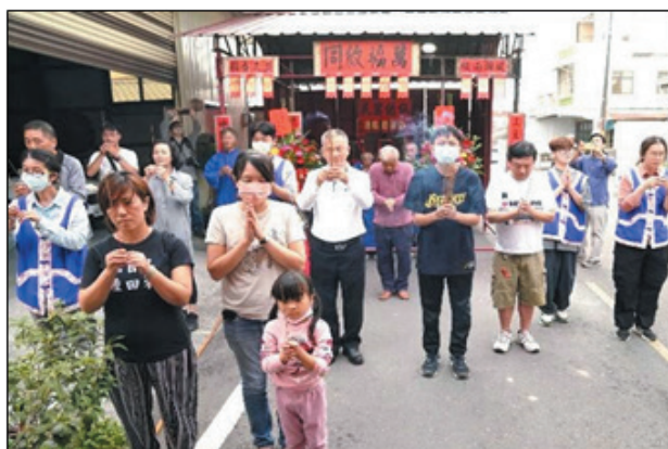
圖 19、2025 瀾濃永安庄伯公入年駕