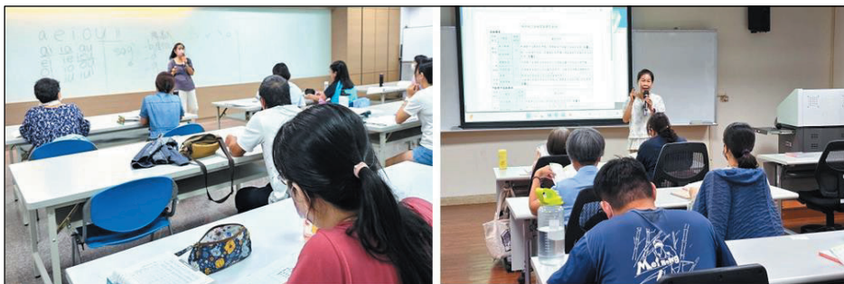
圖 5、客語能力認證班（左：中高級班、右：初級班）

為強化公教人員及民眾客語會話能力，提升客語流通及使用率，113 年於客家文化重點發展區（美濃、杉林、六龜、甲仙）及市區（苓雅、小港、大寮、三民、左營、新興）共辦理 28 班客語能力認證班及 5 班客語文化推廣班，計 710 人參與。（圖 5）