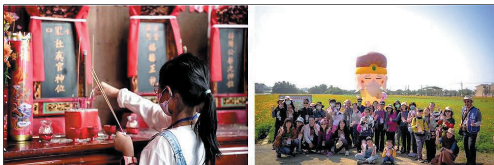
圖 34、小旅行帶民眾到伯公福廠祭拜及欣賞美濃花海