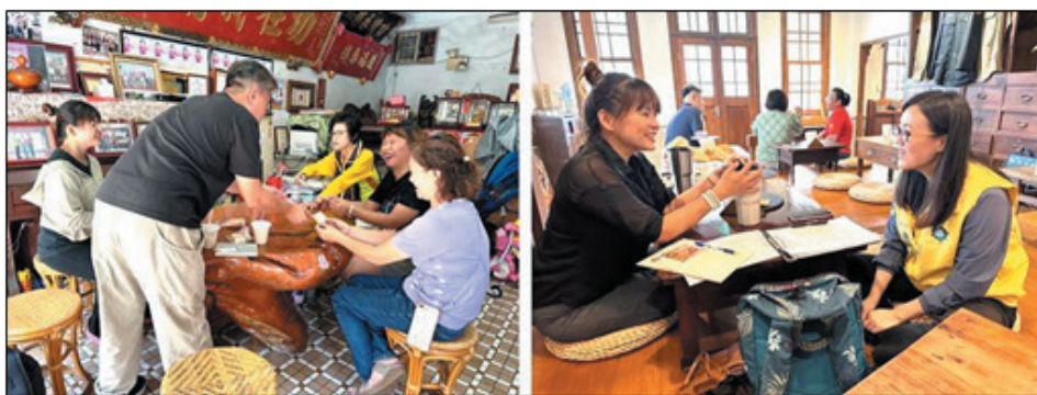
圖 7、客語社區營造提案輔導

為推廣及協助對客語社區營造有熱情之社區組織、民間團體或個人，撰寫以客語溝通結合在地特色資源或議題之相關推廣計畫申請經費，吸引社區居民參與，共同傳承發展客家語言，營造客語社區環境，促進客語成為社區通行語言，提升客語社群活力，113 年共辦理 2 場說明會、2 場技能學堂及 11 次社區輔導訪視，計 139 人次參與，並完成 2 件客語社區營造提案送中央客家委員會申請經費。(圖 7)