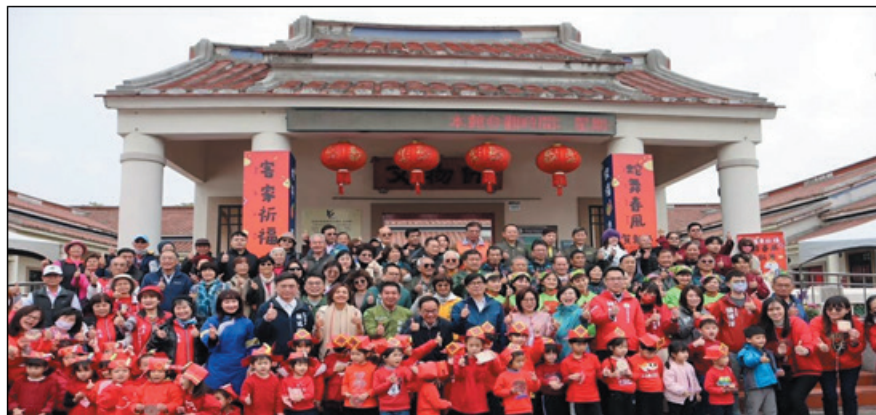
圖15、「蛇舞春風賀新年」新春祈福活動

114年2月8日於新客家文化園區文物館舉行客家傳統祭儀「新春祈福」，以客語誦讀祭文，搭配無形文化資產美濃客家八音演奏，由陳其邁市長引領客家鄉親遵循古禮行「三獻禮」祭拜儀式，祈求天地諸神保佑新的一年平安順遂，並由火焰蟲非營利幼兒園及歡樂客家成長團帶來充滿年節喜氣的歌舞表演，讓現場民眾感受蛇年喜慶繽紛，現場吸引500多位民眾參與。（圖15）