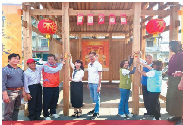
圖 14、貴賓張貼門前紙，感謝門神庇佑