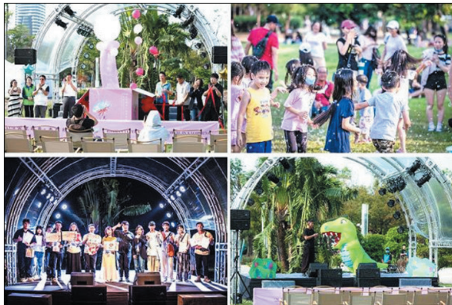
圖 21、2024 客家尋青x高雄秋藝節

客家文化是台灣多元文化的重要組成部分，然而，隨著現代化和社會變遷，客家語言及許多傳統文化已面臨後繼無人的危機。為鼓勵和傳承客家文化，113年10月19、20日於中央公園辦理，旨在激勵青年傳承與創新，讓對於客家文化有興趣的青年在創意、夢想實現和藝術的舞台上展現才華，二日活動參與人次計約12,000人次。（圖21）