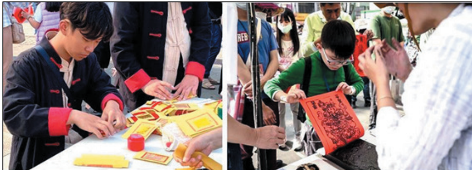
圖 13、充滿年味的體驗活動-摺門前紙、版畫拓印

114 年 1 月 25 日於美濃文創中心辦理，透過摺門前紙、版畫拓印、搭建福廠模型、說舊時美濃故事、客家八音及藝文表演等，推廣客家文化與傳統年節習俗，讓民眾認識與體驗客庄過年風俗，計 1,000 人次參與。(圖 13、14)