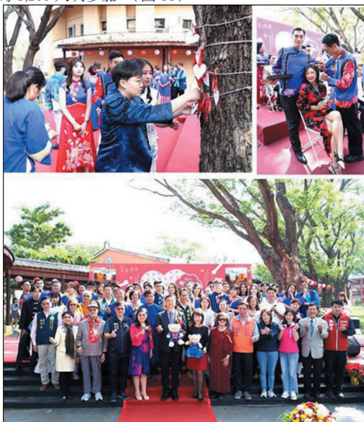
圖 11、兩豆樹下的約定～Hakka 婚禮

為推廣客家婚俗文化，招募 21 對新人（含 4 對同性伴侶）參加 113 年 12 月 7 日於新客家文化園區舉辦的客家婚禮，體驗「上燈」、「插頭花」、「食新娘茶」等客家婚俗古禮儀式，搭配客家喜宴、特色市集、DIY 體驗、闖關遊戲，約 1,200 人次參加。（圖 11）