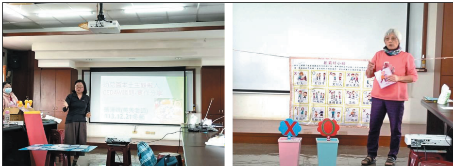
圖 3、客語融入主題課程設計研習

(2)為提升本市雙語沉浸式教育學校教學能量並及時了解現場教學狀況，113 學年度上學期（113 年 8 月至 114 年 1 月）針對參與計畫幼教教師辦理 7 次入班觀課諮詢，總共 12 小時之師培課程，計 32 人次教師參加；國中、國小各 1 次入校諮詢，總共 12 小時之師培課程，計 62 人次教師參加。(圖 3)。