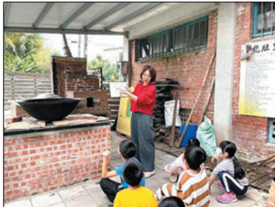
圖 1、以客語為教學語言的沉浸式教學，設計貼近生活情境的課程

幼兒園推行「沉浸式客語教學」，113 學年度有美濃區龍肚國小附幼、廣興國小附幼、美濃國小附幼、吉東國小附幼、中壇國小附幼、杉林區上平國小附幼、私立美濃親親幼兒園等 7 所幼兒園申辦參與計畫；107-113 學年度合計有教師 107 人次、學生 1,047 人次參與。(圖 1)