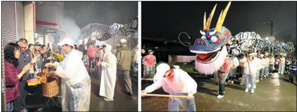
圖 17、竹頭背元宵舞神龍遊庄慶典

美濃竹頭背（廣興地區）中斷近一甲子的舞龍遊庄繞境活動，在本會引導及促成下，經過田野調查、地區說明協調、製作組裝等先期作業，在 114 年 2 月 12 日元宵節當晚隆重登場，長達 39 公尺的藍染神龍、30 多位來自不同國家與族群組成的國際龍隊，在庄頭鄉親、年輕後生的見證下，與國王宮、善化堂、石母宮、慈聖宮等四大宮廟的神轎一起重現遊庄祈福的盛典。（圖 17）