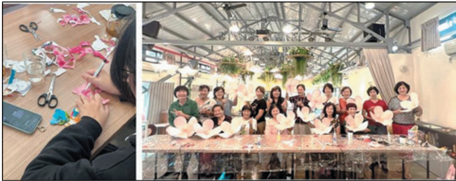
圖 29、牛埔庄生活文化館（左：客家影偶、右：客家圓花）