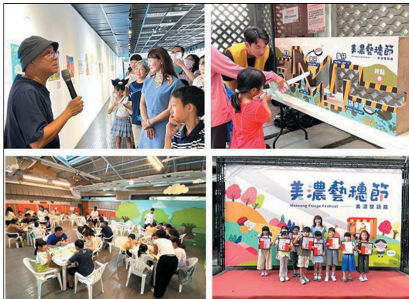
圖 27、美濃藝穗節—美濃雙語趣