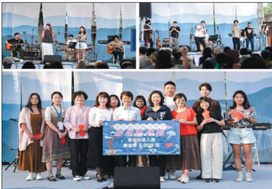
圖 31、《客庄搞寮場》專輯發表會

館辦理素人歌手徵選，入選之歌手與音樂人共同錄製專輯，11月24日於美濃文創中心舉辦音樂專輯發表，並將歌曲上架 Spotify、YouTube、KKbox、LINE MUSIC、Apple Music 等音樂串流平台，並拍攝 2 支音樂 MV 發布於 Facebook 與 YouTube。（圖 31）