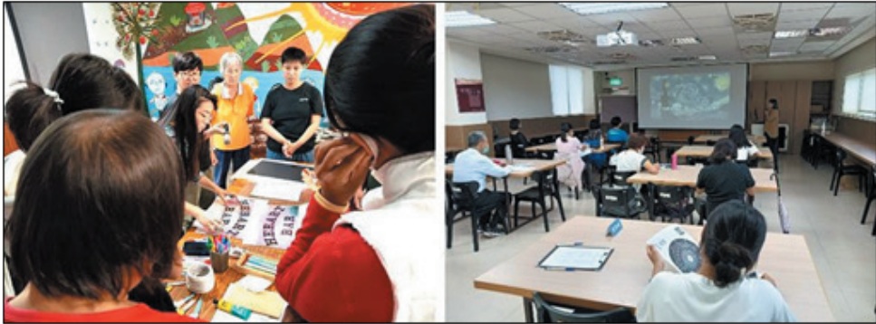
圖 8、客庄文藝復興培力工作坊（左：六龜場、右：美濃場）