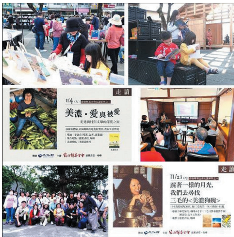
圖 28、「搖籃咖啡」辦理之美濃走讀系列活動

(2)鼓勵公私團體利用美濃文創中心「開庄廣場」舉辦各項藝文活動，有效發揮資源共享場地多元使用功能，更藉由舉辦多元活動，建構美濃文創中心成為美濃地區的文化據點及核心。113 年 9 月至 114 年 2 月計有「庄頭藝穗節」、「113 年全國客家日~愛講客嘉年華」、「跕等伯公尋年味」、「搖籃閱讀市集-積木裡的繪本世界」等活動。