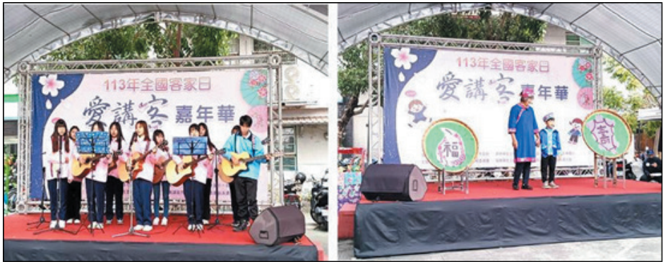
圖 12、113 年全國客家日-愛講客嘉年華