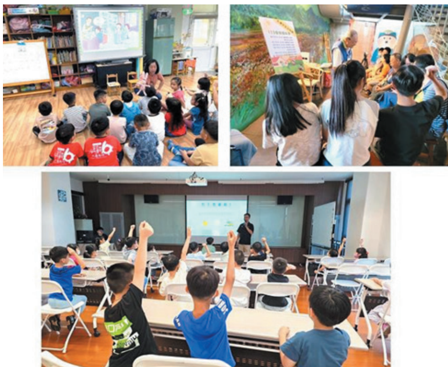
圖 9、客話講故事活動