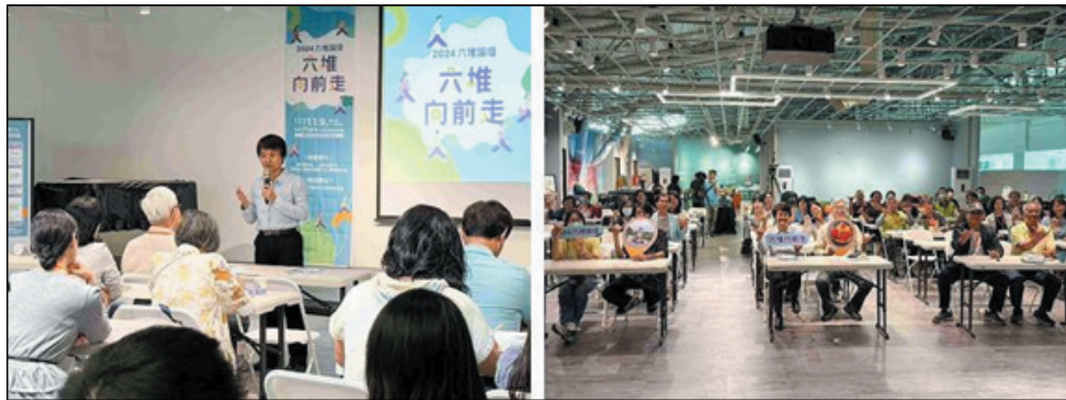
圖 24、2024 六堆論壇-六堆向前走

論壇分享面對逆境時，在地團隊與青年如何持續追求目標，順應環境變化調整自身狀態，計 120 人次參與。(圖 24)