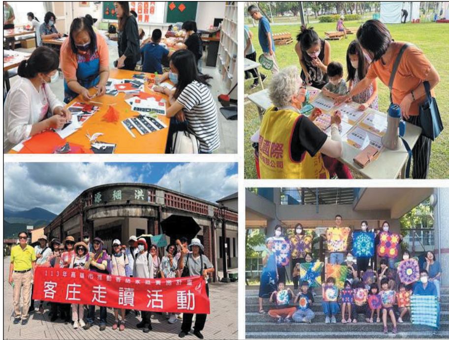
圖 4、推動客語家庭實施計畫-文化體驗、大地闖關、客庄走讀

113 年辦理增進親子客語互動的課程、講座與活動共 81 場，計 13,457 人次參與，包含親職教育研習、說故事、文化體驗、大地闖關、客庄走讀及分齡暑期育樂營等。（圖 4）