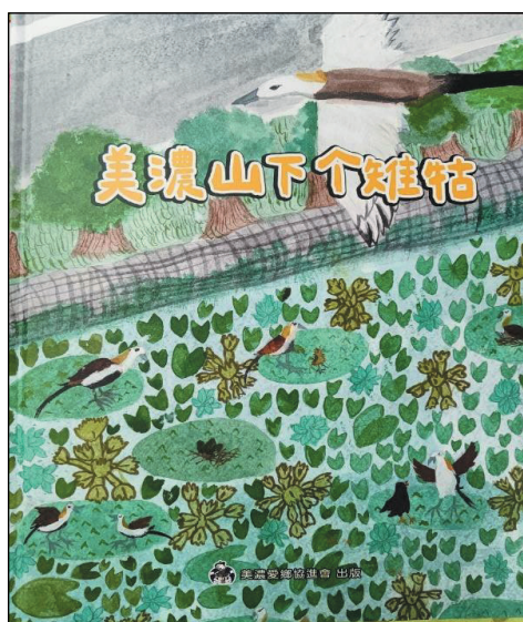
圖 18、客語鳥名繪本—《美濃山下个雉牯》