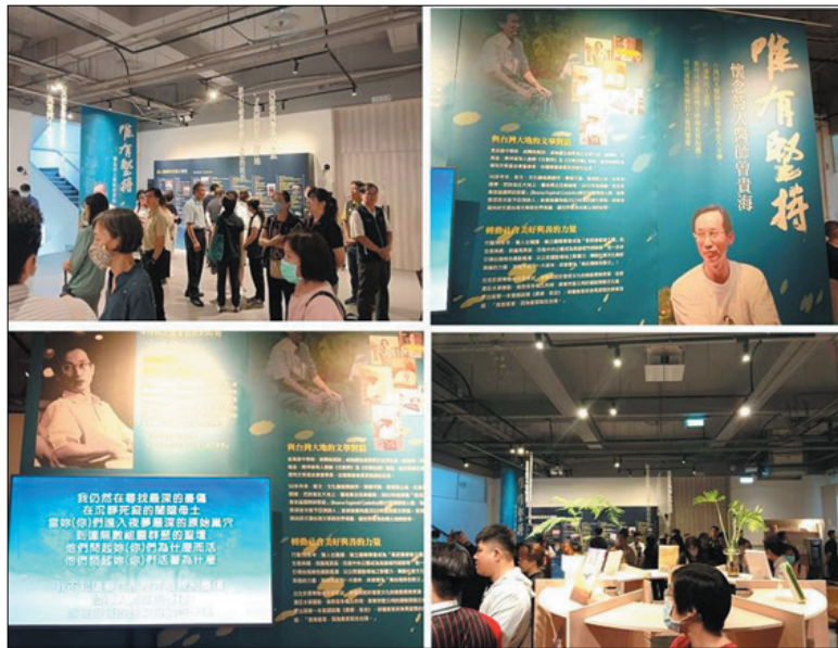
圖 20、唯有堅持：懷念詩人醫師曾貴海文字影音創作展