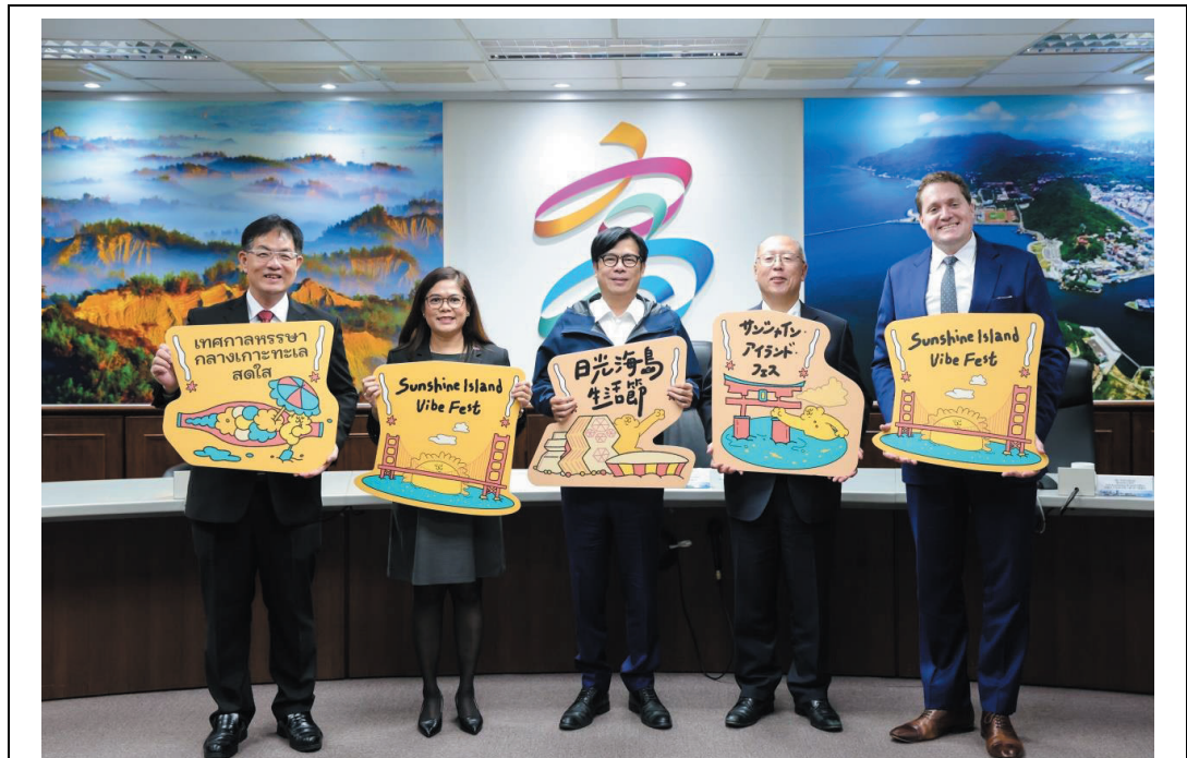
照片 25：高雄市政府宣布 2025 年首度攜手菲律賓、美國、日本、泰國等駐台機構打造「日光海島生活節」活動