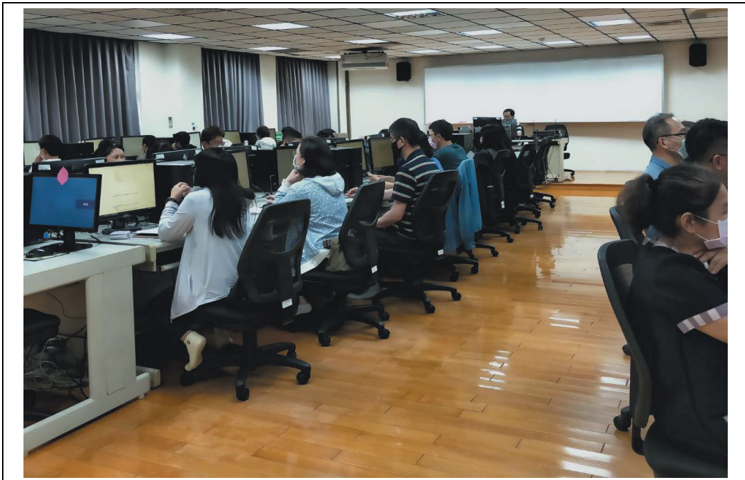
照片 31：職工人事系統功能說明與實機操作研習班上課情形