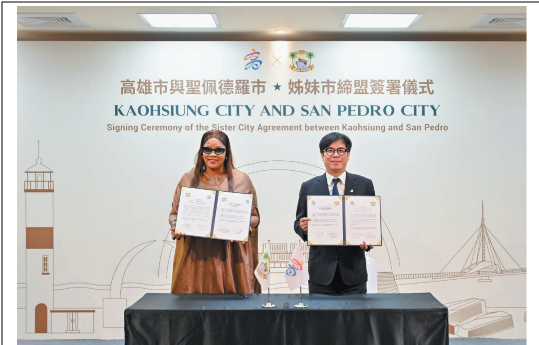
照片 3：高雄市與象牙海岸第二大海港城市聖佩德羅市締結姊妹市，未來兩市將在青年教育、文化等領域開啟交流合作