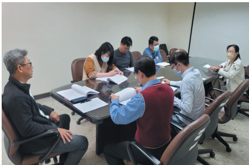
照片 30：市府所屬各機關臨時人員審核小組審議情形