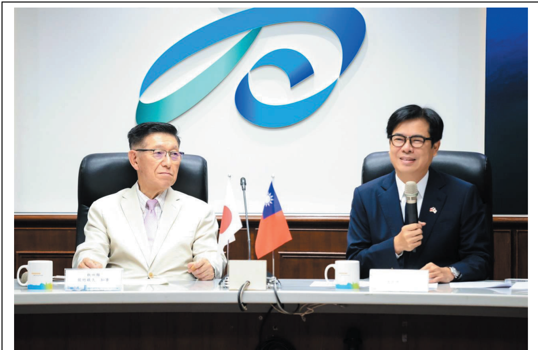
照片 8：日本秋田縣佐竹敬久知事拜會陳其邁市長，雙方就物產觀光、產業轉型等議題進行交流