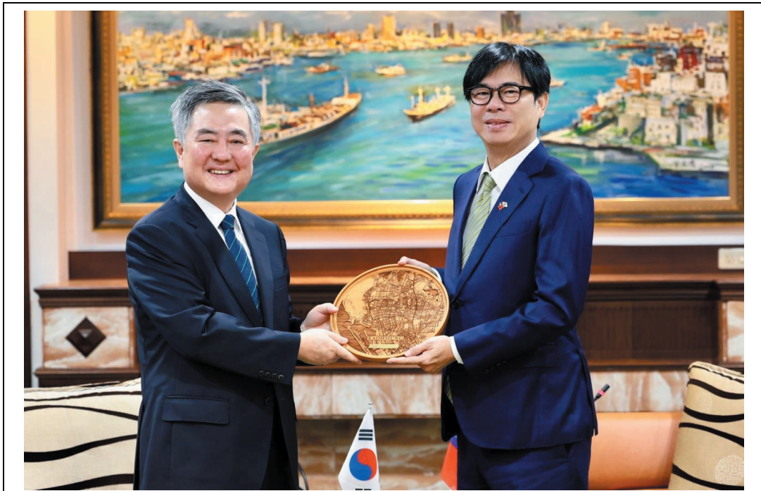
照片 26：駐台北韓國代表部李殷鎬代表拜會陳其邁市長，暢談雙邊半導體、高科技及汽車產業等多元領域合作