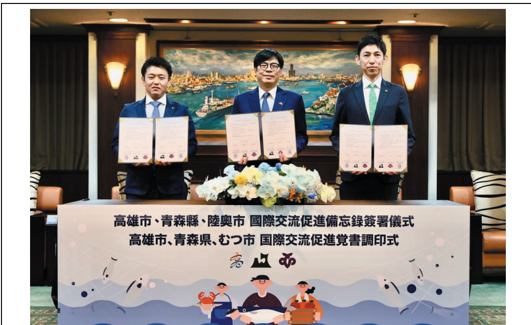
照片 23：日本青森縣宮下宗一郎知事（左一）、陸奧市山本知也市長（右一）與陳其邁市長簽署國際交流促進備忘錄，推動農漁物產、台日觀光及教育、產業等領域交流合作