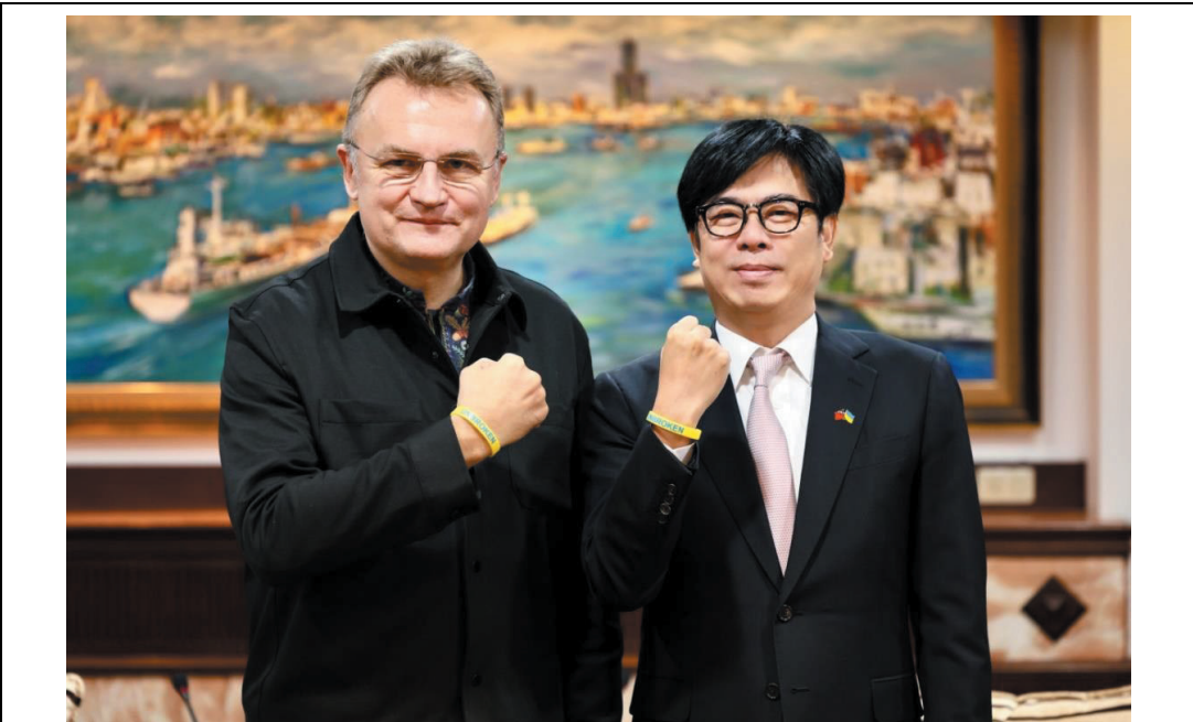
照片 27：陳其邁市長與烏克蘭利沃夫市薩多維市長共同簽署完整城市網絡意向書，高雄成為亞洲第一個成員城市，象徵國際社會互助與發揚城市韌性的堅毅，宣揚民主和平價值