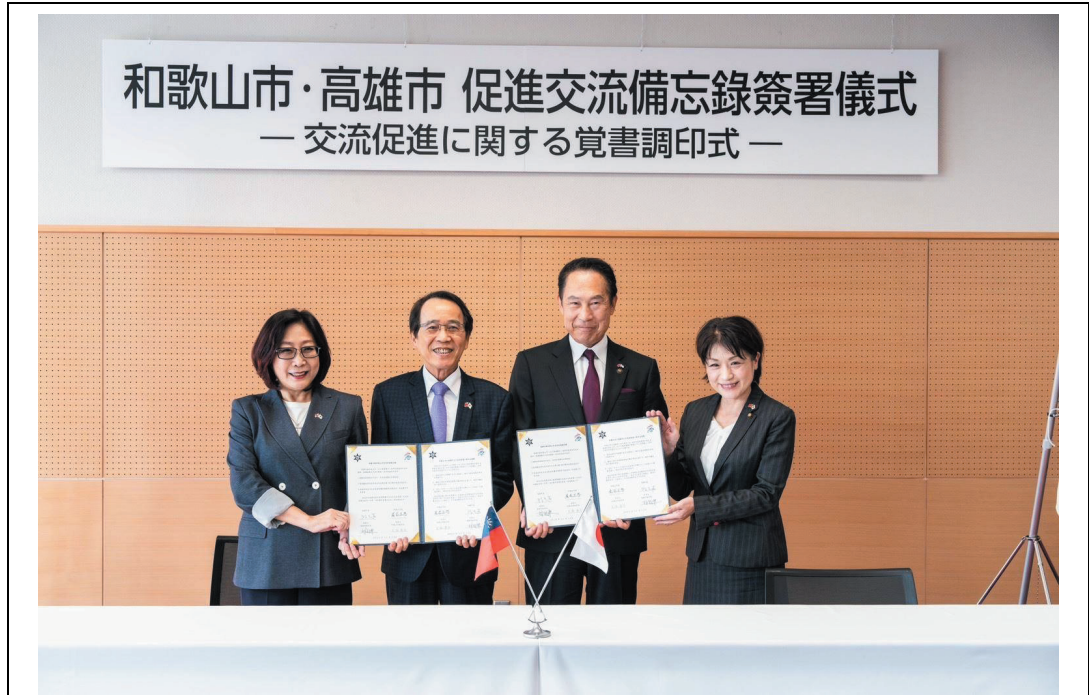
照片 21：高雄市與和歌山市簽署交流促進備忘錄，雙方將攜手推動未來更多在經貿、教育、體育及觀光等領域的實質合作