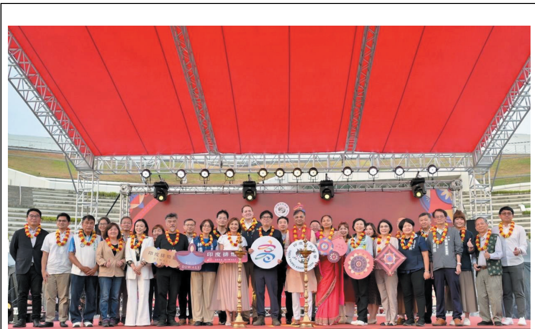
照片 19：陳其邁市長、印度台北協會葉達夫會長（右 13）共同出席印度排燈節開幕式