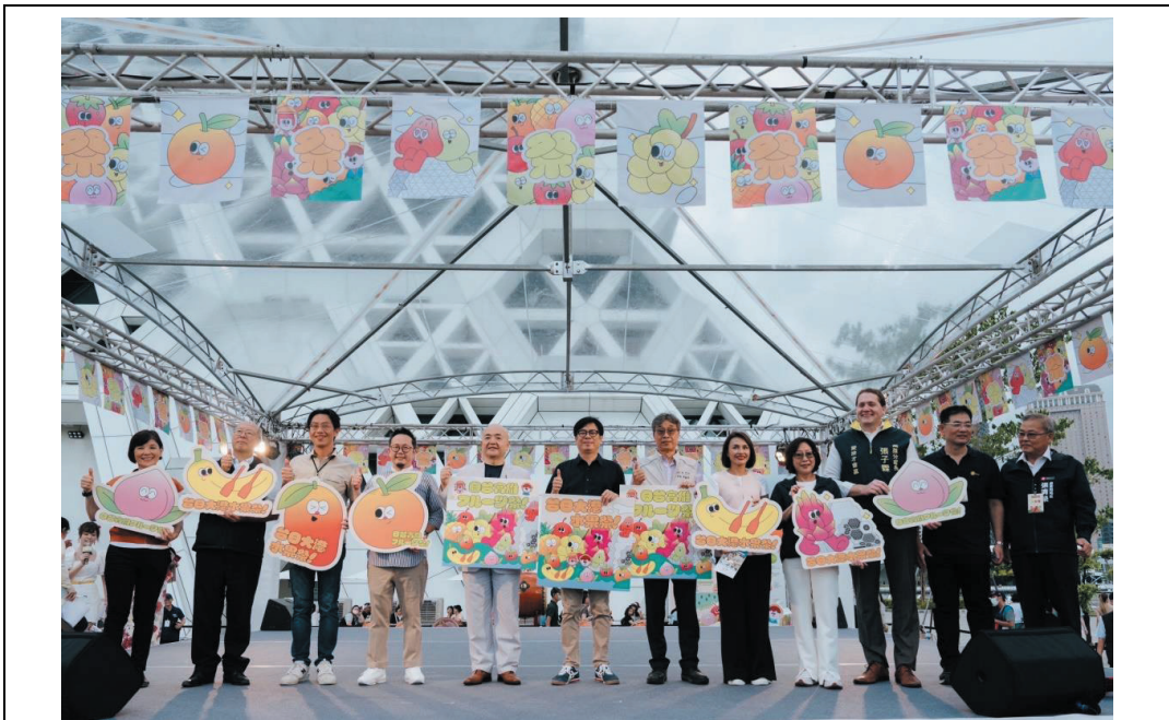
照片 9：陳其邁市長、康裕成議長、日本台灣交流協會片山和之代表及高雄事務所奧正史所長、農業部長陳駿季、文化總會秘書長李厚慶等人為台日大港水果祭揭幕