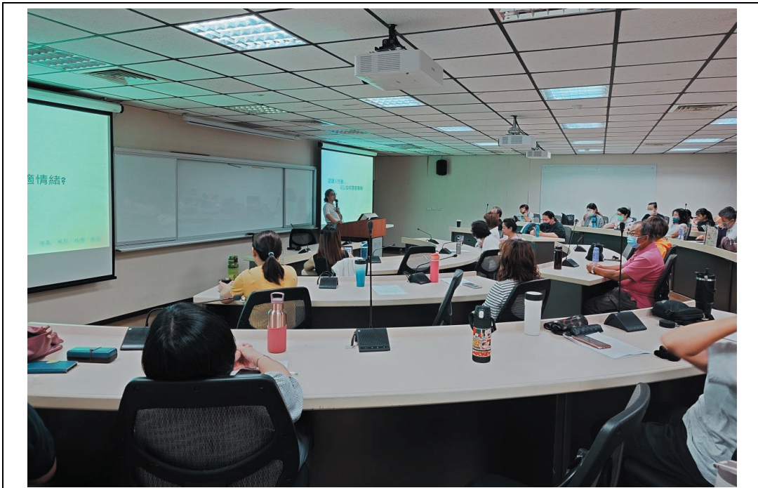
照片 32：培養職場情緒傷害防護力研習班上課情形