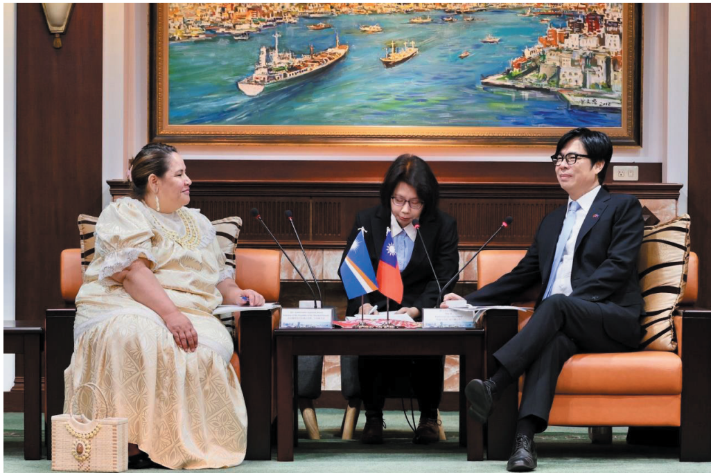
照片 29：馬紹爾群島共和國大使卡蒂爾拜會陳其邁市長，雙方交流氣候變遷、淨零減碳等議題，盼推展未來各項實質合作