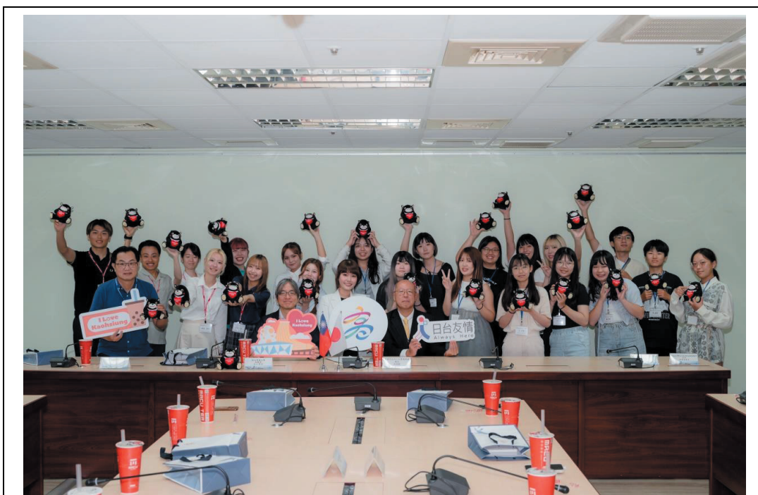
照片 10：熊本學園大學師生拜會市府，盼藉由年輕世代延續友誼，透過青年互動深化友好城市情誼