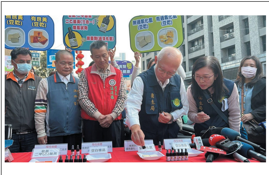
照片 34：本處消保官會同主管機關進行春節食品安全衛生查核