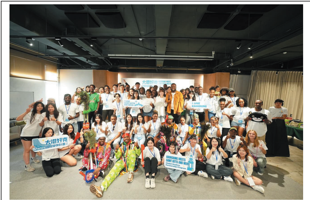
照片 4：國際學伴活動結業式上，克國學生以傳統面具舞演出象徵台克青年在高雄締結深遠的友誼