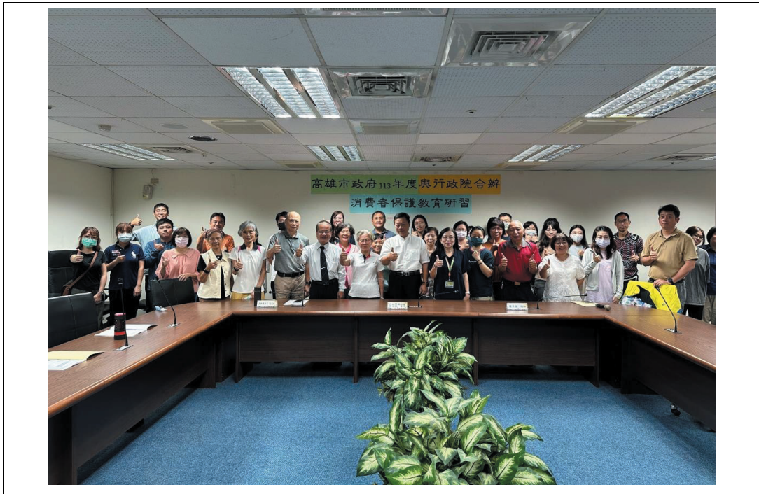
照片 33：本處與行政院合辦消費者保護教育訓練