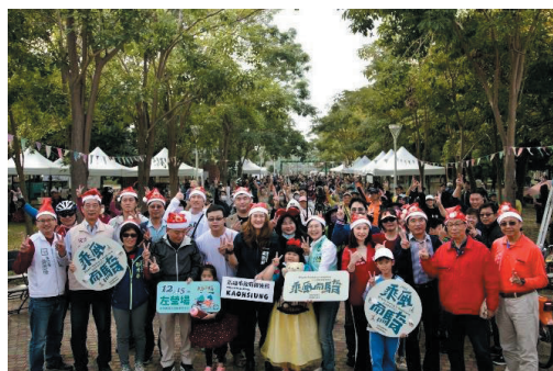
2024 乘風而騎-左營場聖誕變裝派對