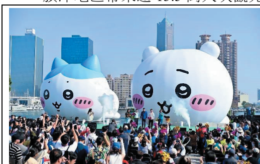
2025 高雄冬日遊樂園-開幕式

113 年 7 月 20、21 日及 8 月 10、11 日於旗津海水浴場辦理主題風箏展演，以「高雄熊的海洋派對」為主題，集結各式各樣海洋與陸地系列風箏一同在空中飛揚，首週邀請佛光山寺祥龍燈演出，增添活動新鮮感與獨特性。另 7 月 20、21 日及 8 月 3、4、10、11 日辦理氣墊水樂園活動，並首度延長開放至晚上 8 點，搭配每日夜光風箏、週日火舞表演，將整個旗津打成大人小孩都喜歡的遊樂園，讓民眾在旗津從早玩到晚，合計 6 天活動為旗津地區帶來逾 13.5 萬人次觀光人潮。