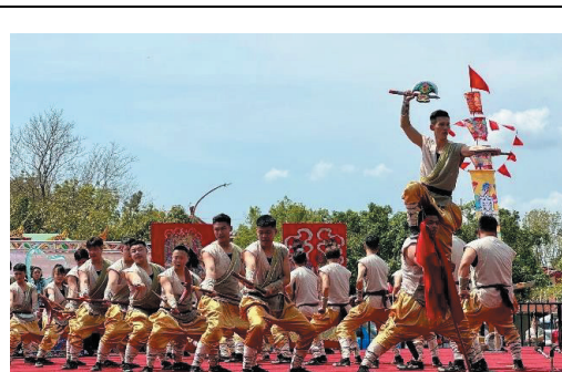
2024 高雄內門宋江陣成果照