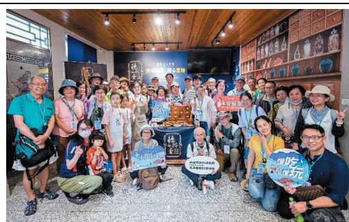
2024 海線潮旅行-參訪德興堂中藥房