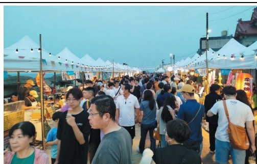
2024 海線潮旅行-音樂市集