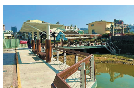
壽山風景區-龍巖冽泉涼亭及平台修繕