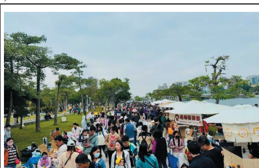
小樹市集-愛河畔舉辦