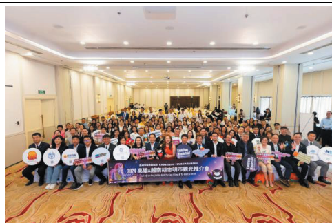
前往越南辦理推介會