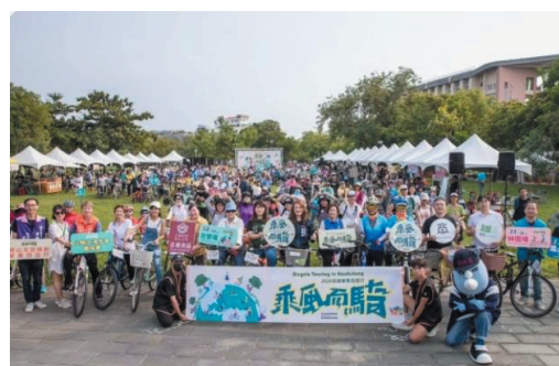
2024 乘風而騎-林園場萌寵共騎