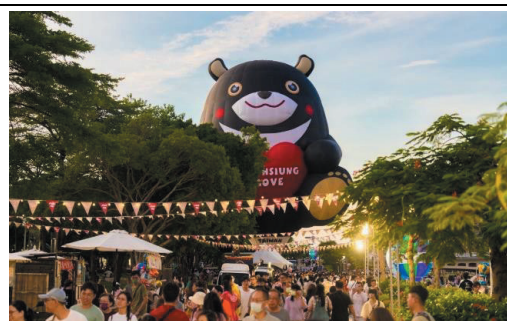
2024 高雄愛·月熱氣球-愛河市集