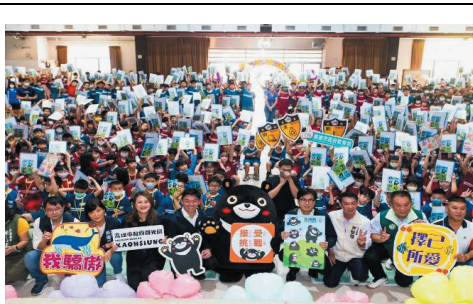
高雄熊走跳校園巡迴活動-茄萣國小