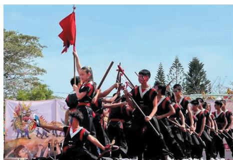
2024 高雄內門宋江陣成果照