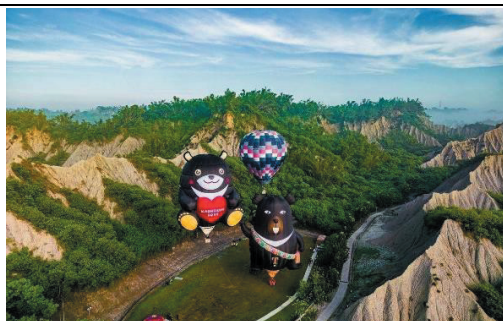
2024 高雄愛·月熱氣球-雙熊相見歡