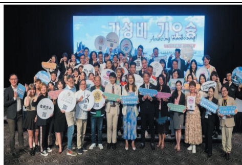
前往韓國辦理推介會