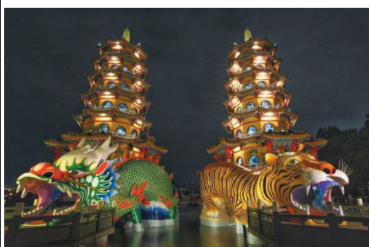
114 年龍虎塔全新亮相