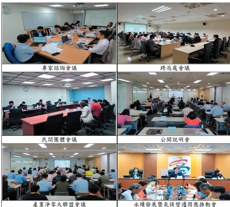
圖1、碳預算會議辦理成果