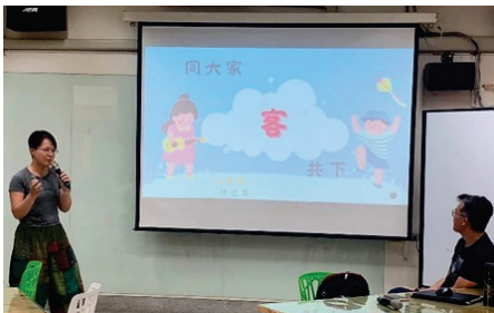
圖 4、客華雙語師培課程

本會 112 學年度針對參與計畫幼教教師辦理 14 次入班觀課諮詢、6 次期末入班輔導訪視、2 次跨縣市標竿學習交流，總共 54 小時之師培課程、31 小時諮詢輔導，計 134 人次教師參加；以及國中、小部分 8 次入班觀課諮詢，1 次跨縣市標竿學習交流，總共 31 小時之師培課程、7 小時諮詢輔導，計 190 人次教師參加，藉以擴展雙語教學視野，並提升教師客語教學專業知能。（圖 4、5）