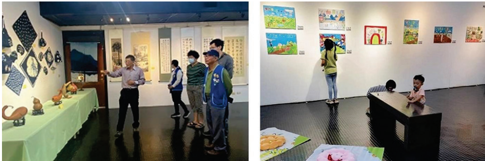
圖 30、美濃客家文物館特展室展覽 （左：美濃風情聯展、右：客加英雄戰校園創意海報展）