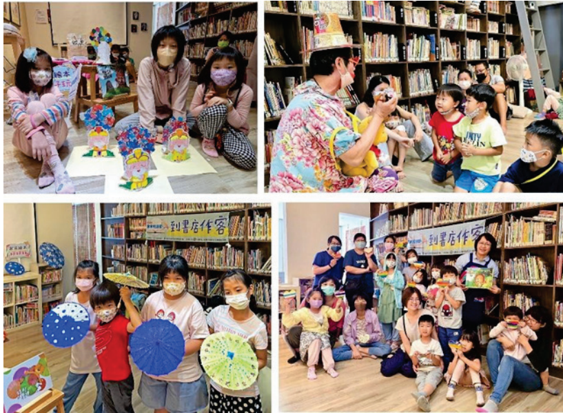
圖 25、2024 客家悅讀節--「到書店作客」