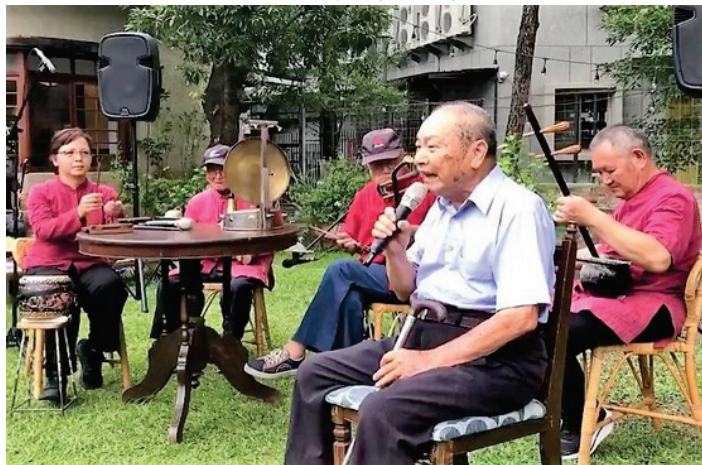
圖 36、美濃八音傳習 18 載後生庄頭尋寮計畫一庄頭巡演

(2)鼓勵公私團體利用美濃文創中心「開庄廣場」舉辦各項藝文活動，有效發揮資源共享場地多元使用功能，更藉由舉辦多元活動，建構美濃文創中心成為美濃地區的文化據點及核心。113 年 1 月至 8 月計有財團法人伊甸社會福利基金會旗山區早期療育兒童發展中心辦理「兒童發展篩檢暨早期療育社區宣導活動」、本市美濃區公所辦理「2024 美濃送聖蹟文化節」、神威天台山慈善功德會辦理「淨化人心講座」、本府經濟發展局與美濃商圈促進會及瀾濃社區發展協會合作辦理 2 場「愛美市集」等。