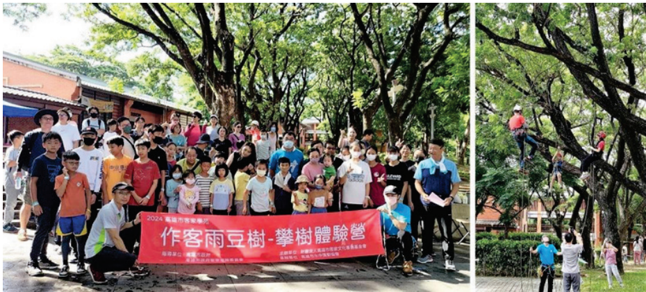
圖 26、作客雨豆樹 攀樹體驗營活動