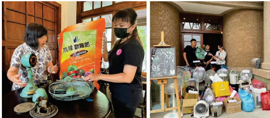
圖 35、免費小家電維修活動