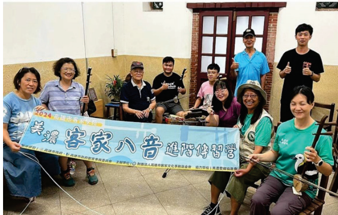
圖 27、美濃客家八音進階傳習營