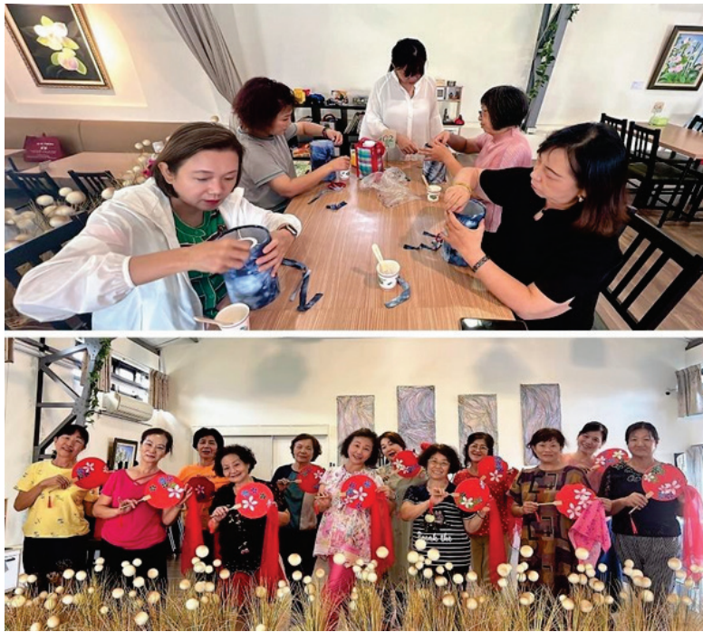
圖 37、牛埔庄生活文化館（上：藍染小夜燈、下：客家團扇）