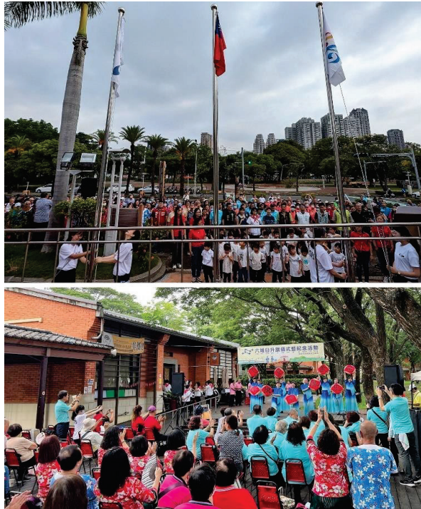
圖 18、六堆日升旗儀式暨紀念活動

(二)辦理「2024 原客青少年三對三籃球賽南區預、複賽」鼓勵青少年以球會友，113 年 7 月 4 日於高雄市青少年運動園區籃球場辦理預、複賽，計 90 隊國中小男女學生分組競賽，每組錄取前 4 名參加 8 月 24 日中央客家委員會於新竹市舉辦的全國總決賽，期透過跨族群交流活動，分享與理解族群間的文化特色及差異，總計 792 人參與。(圖 19)