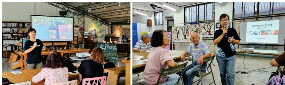
圖 13、客語社區營造提案輔導