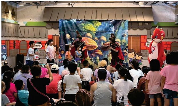
圖 34、庄頭說故事劇場《山洞裡的大怪獸》

7.為促進代間理解及青銀共榮，於兒童節連假期間，由銀髮族志工客華雙語教學自製古早趣味童玩，搭配客家童謠音樂、客話講述繪本故事及客庄傳說，在輕鬆、自然、趣味的客語沉浸式情境中推廣客家語言及文化，參與民眾約 150 人次。另於 8 月 4 日邀請麻咕麻酷創作劇團演出庄頭說故事劇場《山洞裡的大怪獸》，計約 200 人參與。(圖 34)