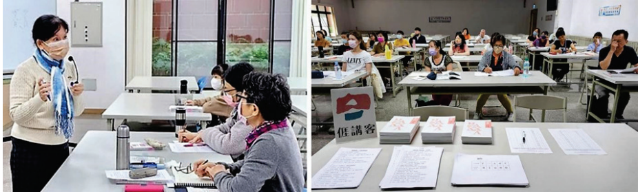
圖 11、客語能力認證班（左：中級暨中高級班、右：初級班）

1 月至 7 月於客家文化重點發展區（美濃、杉林、六龜、甲仙）及市區（苓雅、小港、大寮、三民、左營、新興）共辦理 18 班客語能力認證班及 3 班客語文化推廣班，計 420 人參與。（圖 11）