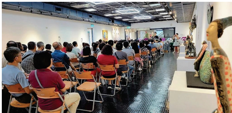
圖 32、陶緣結藝陶藝聯展

6.館內「兒童探索區」以「客家文化情境」、「客語沉浸」為主軸，運用「積木」素材，將美濃的自然、人文地景特色融入設計，設置豐富多元的遊戲角落，更特別引進全台獨有國外大型軟積木學習教具，可啟發孩童在數理、身體平衡、空間結構、戲劇、社交等能力，吸引眾多親子及戶外教學幼兒入場共樂，113 年 3 月至 8 月止逾 7,570 人次使用。(圖 33)