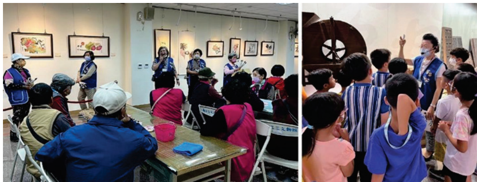
圖 16、營造客語無障礙環境

為有效運用社會人力資源，型塑客語無障礙環境，於本市三民區公所、美濃客家文物館、新客家文化園區文物館等重要公共場所，設置「客語服務窗口」，提供客語之專業服務解說及導覽，113年3月至113年8月計89名志工投入志願服務工作，總服務時數6,576小時、共服務67,291人次。（圖16）