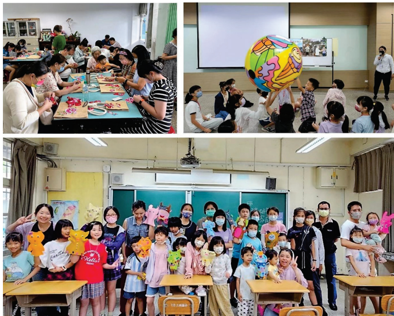
圖 9、推動客語家庭實施計畫--文化體驗、說故事、暑期育樂營

113 年 1 至 8 月辦理增進親子客語互動的課程、講座與活動共 55 場，計 1,179 人次參與，包含親職教育研習、說故事、文化體驗、大地闖關、客庄走讀及分齡暑期育樂營等。（圖 9）