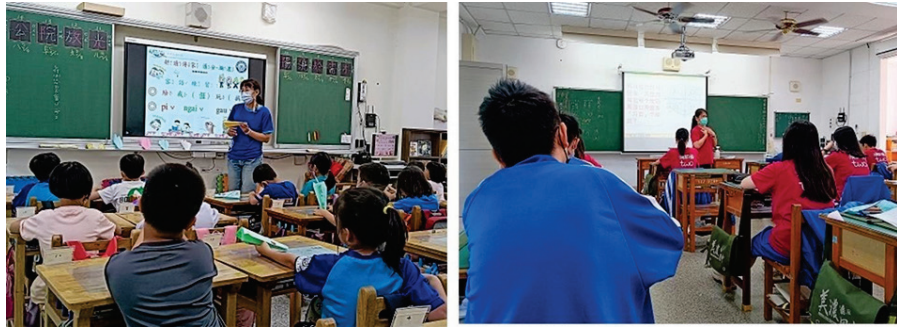
圖 2、落實於日常課堂中的國中小客華雙語教學（左：國小、右：國中）