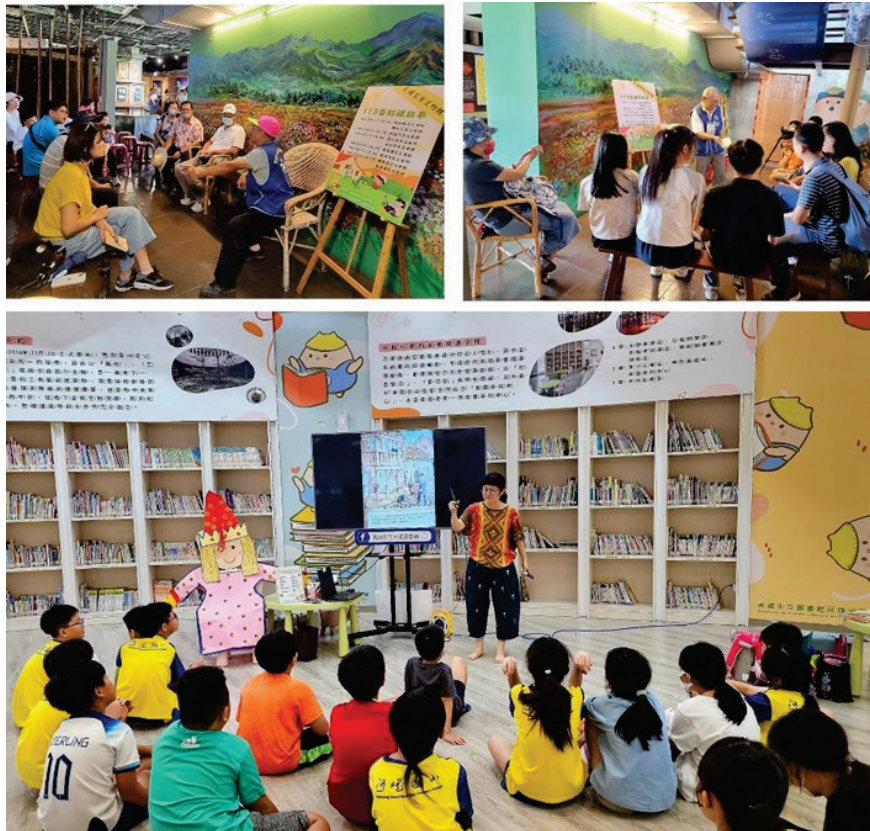
圖 15、客話講故事活動

為落實社區營造客語沉浸環境，並長期持續性促進客語在社區流通與扎根，本會串聯六龜及杉林區公所辦理客話講故事，113 年 1 月至 9 月於美濃客家文物館、大東藝術圖書館、河堤圖書館、六龜國小、杉林圖書館等地辦理 3 場志工說故事增能、19 場志工說故事、14 場特色場次，約 810 人次參與，透過活動開啟社區推動客語復振的契機。(圖 15)