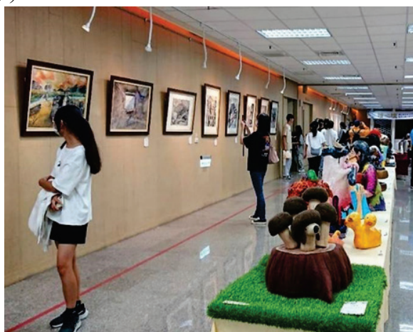
圖 29、繪心瞳-高雄市壽山國中美術班畢業美展暨屏山國小美術班邀請展