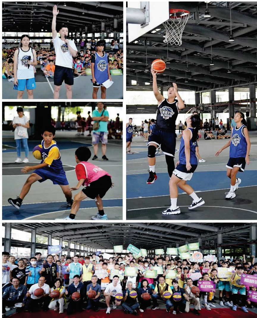
圖 19、2024 原客青少年三對三籃球賽南區預、複賽