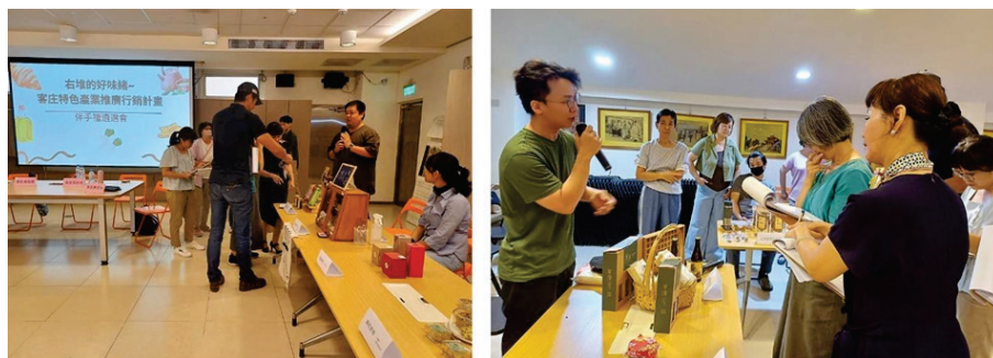
圖 41、右堆的好味緒-伴手禮遴選會