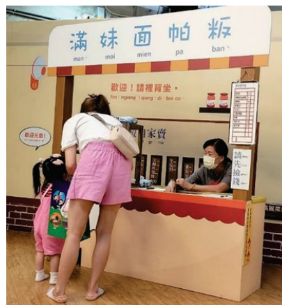
圖 33、兒童探索區--「滿妹面帕板」

6.館內「兒童探索區」以「客家文化情境」、「客語沉浸」為主軸，運用「積木」素材，將美濃的自然、人文地景特色融入設計，設置豐富多元的遊戲角落，更特別引進全台獨有國外大型軟積木學習教具，可啟發孩童在數理、身體平衡、空間結構、戲劇、社交等能力，吸引眾多親子及戶外教學幼兒入場共樂，113 年 3 月至 8 月止逾 7,570 人次使用。(圖 33)