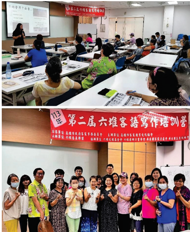
圖 21、113 年第二屆六堆客語寫作培訓營