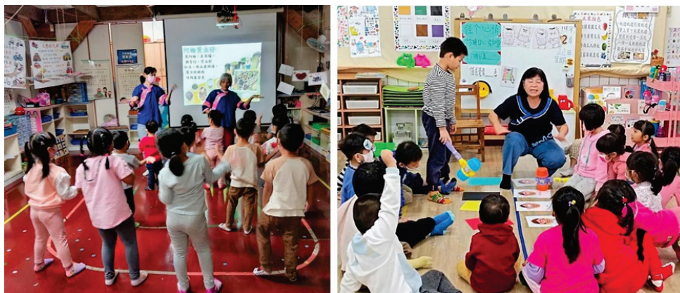
圖 1、充滿創意的幼教沉浸式客語教學活動

幼兒園推行「沉浸式客語教學」部分，107-112 學年度計有教師 87 人次、學生 896 人次參與；113 學年度有美濃區龍肚國小附幼、廣興國小附幼、美濃國小附幼、吉東國小附幼、中壇國小附幼、杉林區上平國小附幼、私立美濃親親幼兒園等 7 所幼兒園提出申請計畫，刻正提案送客家委員會審核中。（圖 1）