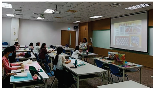
圖 5、幼教客語教學實作師培課程