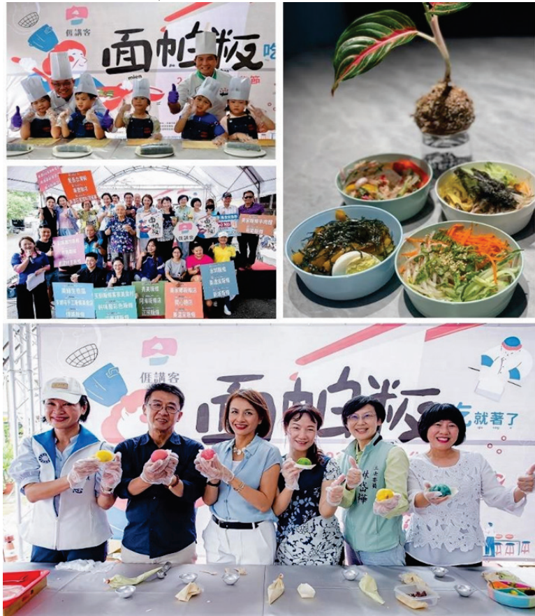
圖 40、2024 客家板條節~面帕板，吃，就著了

113 年 6 月 26 日於美濃區博愛街辦理，現場有 6 種異國風味的板條免費品嚐、面帕板料理秀、藝文展演、4 場米食 DIY 體驗及 40 攤板條樂市集等，並結合 26 家美濃在地店家，推出為期 2 個月活動限定優惠或特色風味套餐，吸引民眾消費，計 1,200 人次參與。(圖 40)