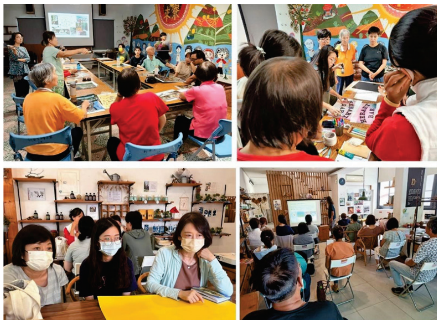
圖 14、客庄文藝復興培力工作坊（上：六龜場、下：甲仙場）

為完整保存及推展客家文化，發掘更多的客家資源，組成客庄文藝復興運動推動輔導團，提供美濃、六龜及甲仙區公所與在地社區、民間團體諮詢輔導，並舉辦績優客語社區與文化力特色案例經驗分享，提升整體客語社群活力及客家文化力。113 年 8 月於美濃、六龜、甲仙辦理 4 場培力工作坊，約 51 人參與。(圖 14)