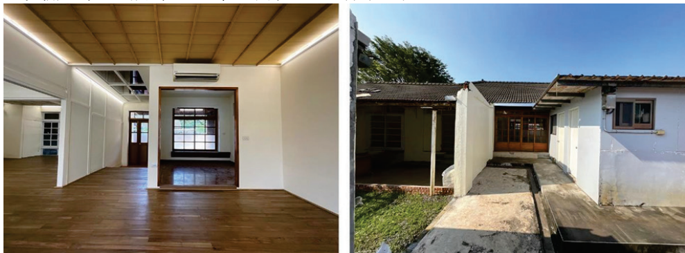
圖 38、鳳山客家文化據點「黃埔客站」