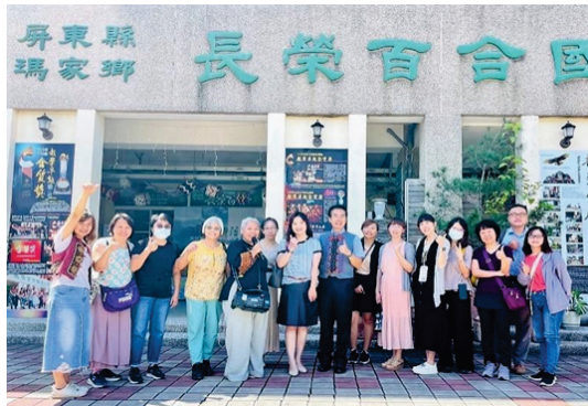
圖 7、幼教標竿學習參訪長榮百合附幼族語教學

(2)為瞭解其他縣市推動雙語沉浸式教學實施現況，以評估本市 112 學年度幼教及國中小客語沉浸教學執行情形並發掘問題，113 年 1 月 5 日前往臺南市安平區西門實驗小學、6 月 21 日前往屏東縣瑪家鄉長榮百合國小附幼、6 月 25 日前往屏東縣私立立群全客語沉浸幼兒園進行校外實務參訪及觀、議課交流，藉由標竿學習精進教師教學實施能力，提升本市推動效益。(圖 7)