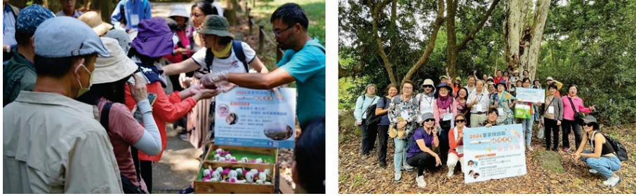
圖 24、2024 客家悅讀節—