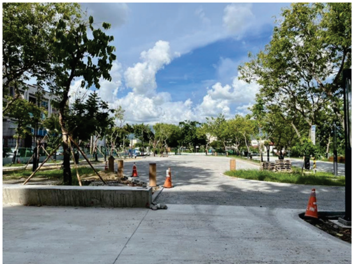
圖 39、美濃文化生態散步策--雙峰公園停車場空間再造

12月工程發包，113年2月15日開工，施作範圍包含：農會超市小農市集廣場、雙峰公園停車場空間再造、美濃國小停車棚、美濃客運站及菸葉輔導站等三座湧泉造景、書香小徑等，預計113年12月底完工。（圖39）