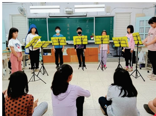
圖 3、客華雙語教學-讀者劇場

本會 112 學年度針對參與計畫幼教教師辦理 14 次入班觀課諮詢、6 次期末入班輔導訪視、2 次跨縣市標竿學習交流，總共 54 小時之師培課程、31 小時諮詢輔導，計 134 人次教師參加；以及國中、小部分 8 次入班觀課諮詢，1 次跨縣市標竿學習交流，總共 31 小時之師培課程、7 小時諮詢輔導，計 190 人次教師參加，藉以擴展雙語教學視野，並提升教師客語教學專業知能。（圖 4、5）