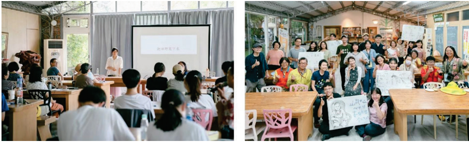
圖 20、右堆好聲音--音樂創作工作坊