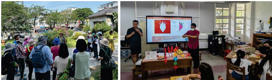
圖 12、客家語言文化推廣活動（左：客庄風土人文活動、右：傳統技藝文化活動）

113 年 4 月至 7 月於客庄區辦理 5 場探訪客庄風土人文活動，於都會區辦理 12 場客家傳統技藝文化活動，計 455 人次參與。（圖 12）