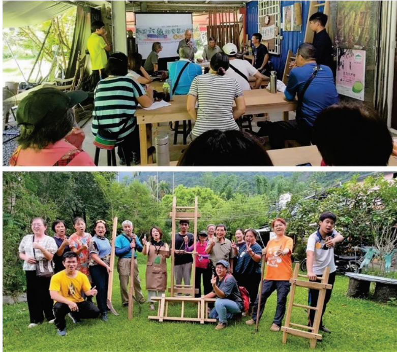
圖 28、尋回六龜的客家山林記憶--木工手作工作坊