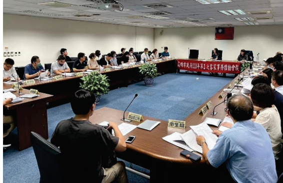
圖 17、113 年客家事務推動會報第 1 次會議