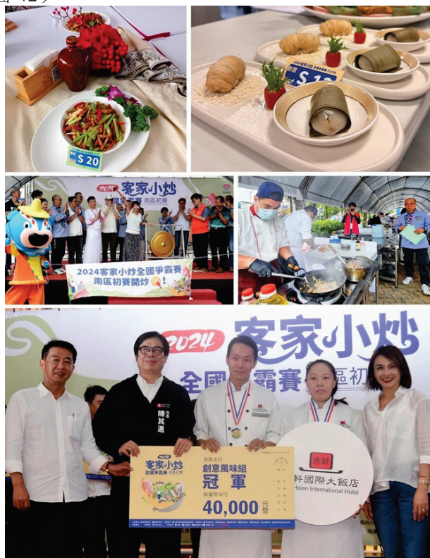
圖 42、2024 客家小炒全國爭霸賽南區初賽

為振興客庄產業，推廣客家美食文化，本府與客家委員會共同辦理「2024 客家小炒全國爭霸賽南區初賽」，113 年 7 月 23 日於高雄巨蛋體育館戶外廣場熱鬧開炒，競賽以「客家小炒」為主題，傳統組與創意組共 26 隊同場大展廚藝，冠軍晉級 9 月全國總決賽，現場還有創意料理上菜秀、花式調酒、藝文及魔術表演、展售市集、文化體驗 DIY 等精彩活動，期藉此吸引民眾持續關注客家美食與認識客家文化，並帶動客庄觀光人潮，計 1,000 人次參加。(圖 42)