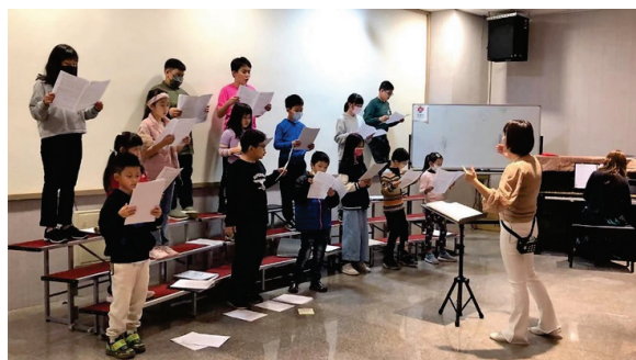
圖 22、客家兒童合唱團團練情形