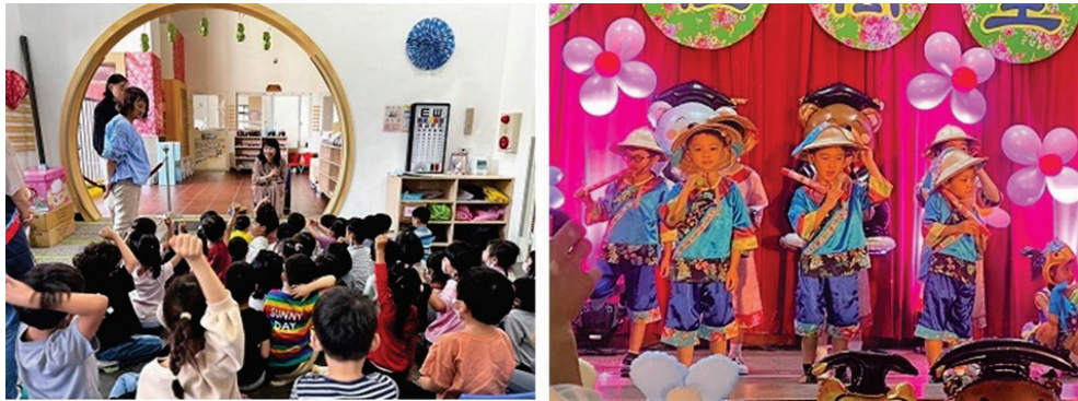
圖 8、客語沉浸非營利幼兒園（左：主委媽咪說故事、右：畢業典禮）