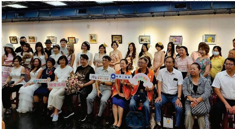
圖 31、龍來美濃漸凍症公益永生花展