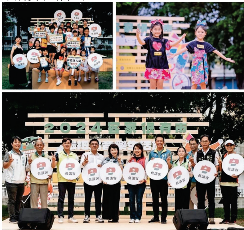
圖 23、2024 客家很有市--撮把戲音樂生活節

113 年 5 月 25、26 日於大東濕地公園舉辦，「撮把戲」(四縣腔客語：cod`ba`hi)，即表演把戲，是傳統百戲雜技的表演形式之一，以詼諧逗趣的對話形式逗樂觀眾。「撮把戲音樂生活節」透過一系列活動的串聯，包含馬戲雜耍與音樂表演、童玩體驗工作坊，還有「搖身一變~萌童來搞撮把戲」兒童走秀活動、「好客玩食專區」限量推出結合經典與創意的客家美食，讓參加的民眾以日常生活的方式了解客家文化，也改變過往對於客家活動較保守傳統的印象，吸引不同年齡層的參與者，計約 15,000 人次參與。(圖 23)