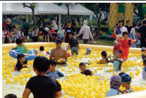
2024 旗津風箏節-氣墊水樂園