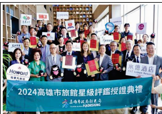
本市旅館星級評鑑授證典禮