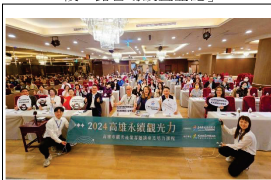
2024 本市觀光產業專題講座及培力課程

3.截至 113 年 8 月底，目前本市有已有 6 家業者取得露營場設置登記（東九道露營區、遠山望月露營區、露營樂 2 號店旗津旗艦店、梅園野營秘境露營區、山中水手露營區及美濃美真園）。另已輔導 69 家申請第 1 階段「非都市土地容許使用」，其中 36 家已取得土地許可使用，4 家位於環境敏感區不得申設露營場，餘均在審核中；輔導 7 家業者申請第 2 階段「露營場設置登記」。