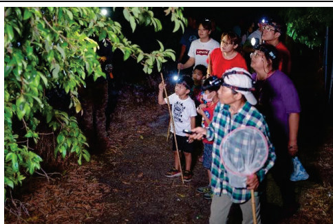
六龜溫泉推廣活動-生態秘境導覽