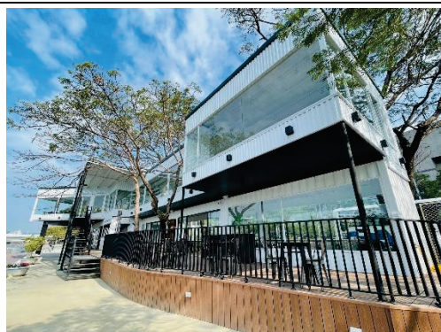
白色戀人貨櫃屋（二期）