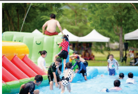
六龜溫泉推廣活動-山城水樂園