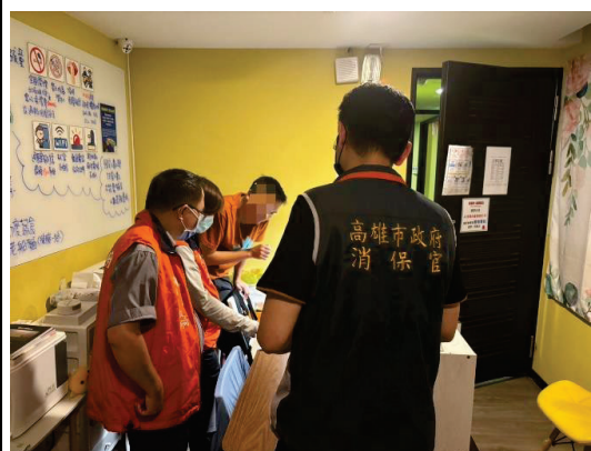
聯合消保官辦理住宿業房價專案稽查