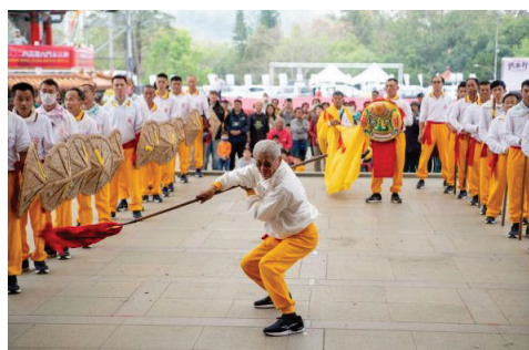
2024 高雄內門宋江陣-文武陣頭拜觀音