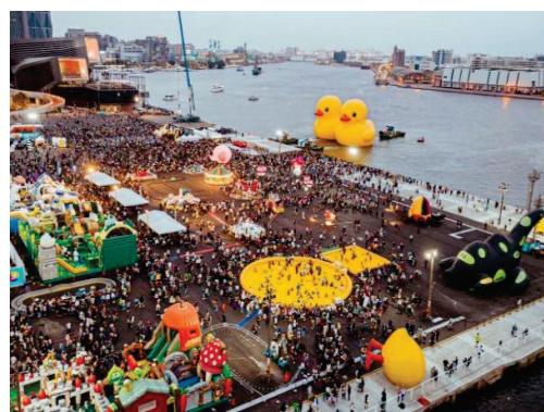
2024 冬日遊樂園-打造碼頭樂園