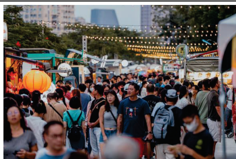
高雄雄嗨調酒節-帶動夜間觀光