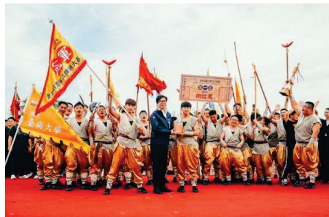
2024 高雄內門宋江陣-宋江陣頭大賽頒獎