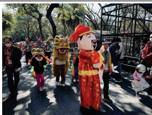
壽山動物園喜迎春-年春節大遊行活動