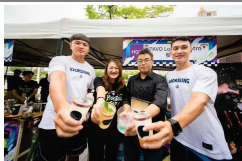
高雄雄嗨調酒節-推廣餐酒文化