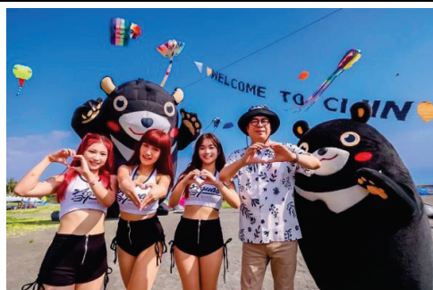
2024 旗津風箏節-風箏展演