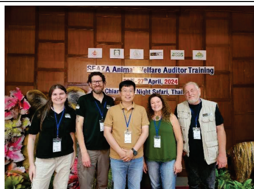
參加動物福利評鑑人員訓練課程