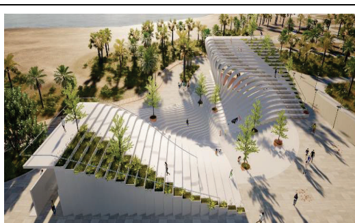
Sunsetbar 與四號公廁規劃構想圖