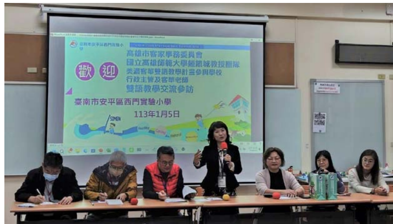
圖 8、跨縣市雙語教學參訪交流－台南市西門實小

為瞭解其他縣市推動國中小客語沉浸式教學實施現況，以評估本市 112 學年度國中小客語沉浸教學執行情形並發掘問題，113 年 1 月 5 日前往臺南市安平區西門實驗小學進行校外實務參訪及觀、議課交流，藉由標竿學習精進教師教學實施能力，提升本市推動效益。(圖 8)