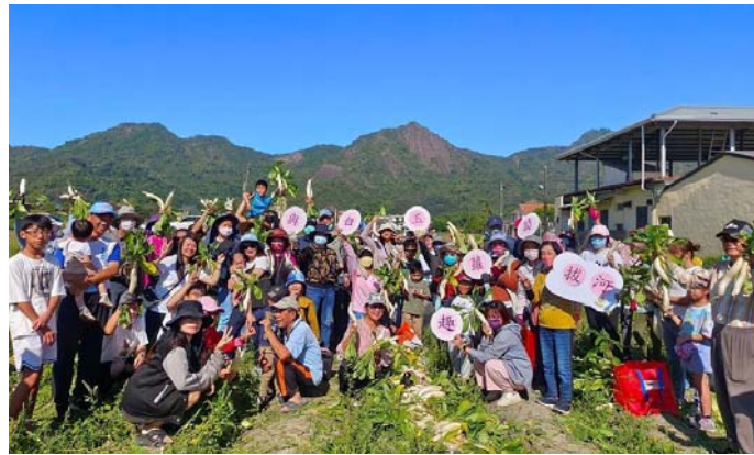
圖50、「與白玉蘿蔔拔河比賽」活動

每年11月至12月是美濃白玉蘿蔔盛產期，為行銷高雄客庄優良農特產及帶動客庄經濟發展，112年12月10日邀集本會員工、委員、志工、財團法人高雄市客家文化事務基金會員工、董監事及家屬參與，藉由食農教育家庭體驗活動，深入了解白玉蘿蔔的栽種、採收方式及當地的飲食文化等，寓教於樂，進而激發更多人對客庄旅遊及客庄農特產之興趣，計126人參與。（圖50）