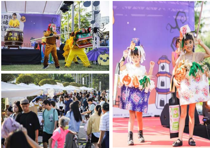
圖 35、2023 月光光－尤犴尤犴萬聖嘉年華

(5)辦理「2023 客家很有市－貓與貓頭鷹音樂市集」：112 年 11 月 4-5 日於鳳山大東公園舉辦，活動包含客語新生代歌手、小丑氣球、馬戲雜耍表演，更有「Hakka 玩食專區」的「meu meu 市集」，除了音樂派對、野餐與美食，現場還設計童玩體驗、闖關遊戲及 DIY 活動。「2023 客家很有市」以「貓」與「貓頭鷹」作為活動主題，在客家語中，貓的發音是「貓仔 meu e \」，而貓頭鷹的發音是「貓頭鳥 meu teu \ diau /」，透過客語中共同的「meu」發音，傳播客語的生活化應用，打造出最 CHILL 和 RELAX，不同以往的客家活動，串連起眾多喜愛「貓」與「貓頭鷹」的朋友，走進客家文化領域。兩天的活動吸引至少 20,000 人次的親子及民眾參與。(圖 36)