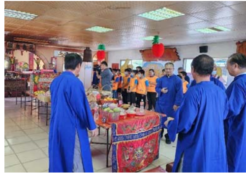
圖 46、祭孔產業嘉年華－祭孔儀式