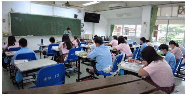
圖 5、國中客華雙語教學－教師以客華雙語進行授課