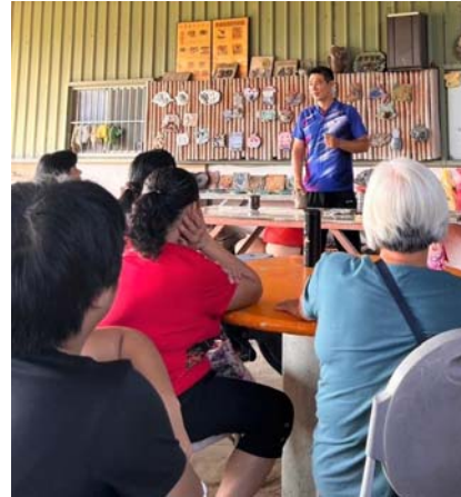
圖 6、客華雙語教學師培課程－客語文本授 課之客語發話量分析