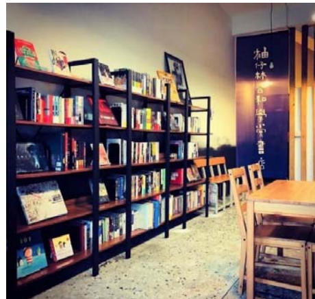
圖 48、柚仔林合和學堂書店