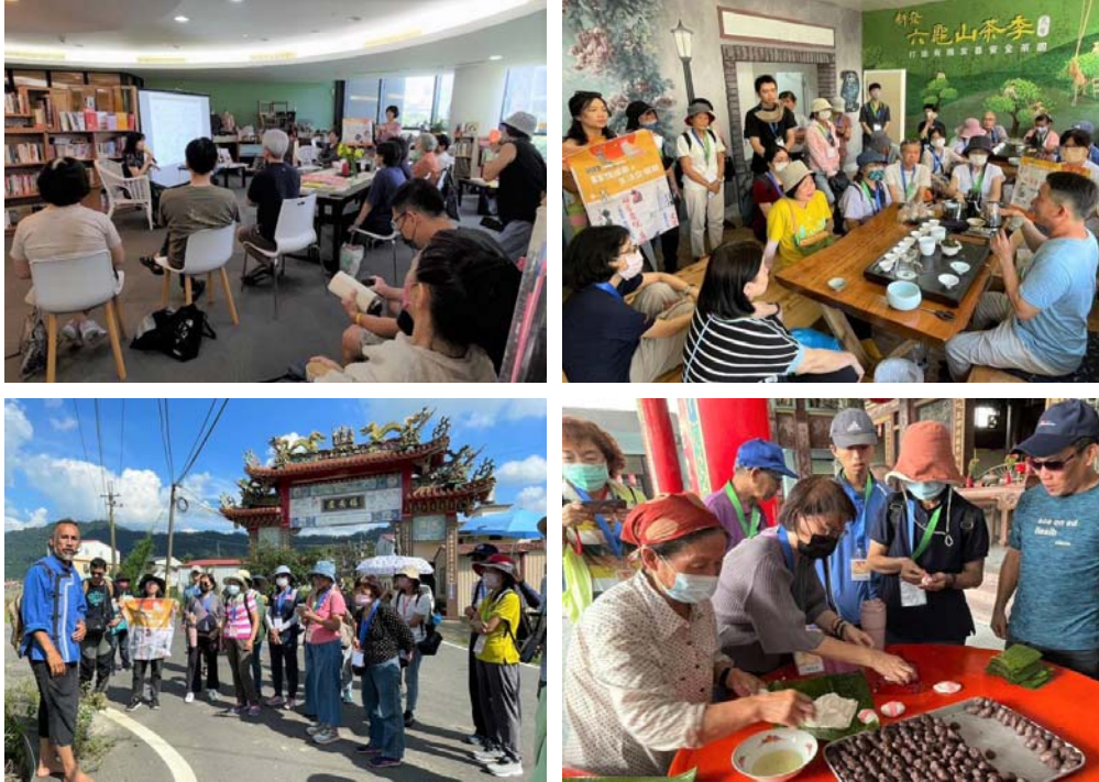
圖 34、走·讀客庄的多重宇宙

(4)辦理「2023 月光光—ㄣ牯ㄣ牯萬聖嘉年華」：112 年 10 月 28 日於中央公園舉辦，活動包含「客家童玩蓋生趣」、「百變萌童伸展台」、「ㄣ牯ㄣ牯討糖趣」、「月光光野餐音樂會」、「荷包很想瘦市集」等，是一場適合親子同樂又充滿童趣的萬聖嘉年華。活動共吸引至少 5,000 人次參與，讓民眾透過萬聖節活動，以現代視野認識客家語言及多元文化樣態，進而使客家文化融入常民生活，不僅促進族群主流化，也讓高雄呈現族群多元共融。(圖 35)