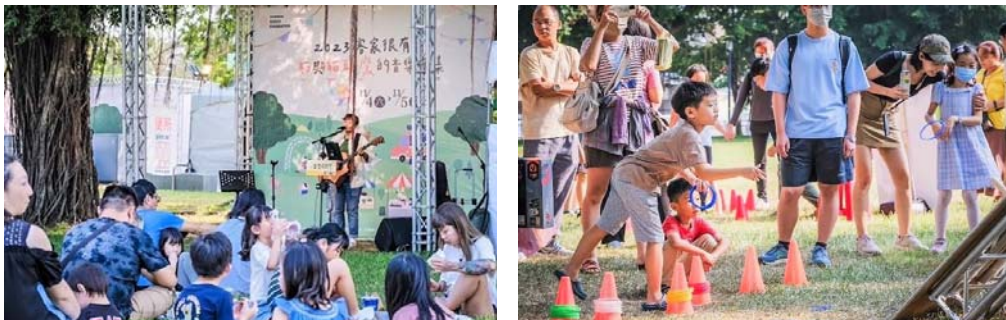
圖 36、2023 客家很有市－貓與貓頭鷹音樂市集

(5)辦理「2023 客家很有市－貓與貓頭鷹音樂市集」：112 年 11 月 4-5 日於鳳山大東公園舉辦，活動包含客語新生代歌手、小丑氣球、馬戲雜耍表演，更有「Hakka 玩食專區」的「meu meu 市集」，除了音樂派對、野餐與美食，現場還設計童玩體驗、闖關遊戲及 DIY 活動。「2023 客家很有市」以「貓」與「貓頭鷹」作為活動主題，在客家語中，貓的發音是「貓仔 meu e \」，而貓頭鷹的發音是「貓頭鳥 meu teu \ diau /」，透過客語中共同的「meu」發音，傳播客語的生活化應用，打造出最 CHILL 和 RELAX，不同以往的客家活動，串連起眾多喜愛「貓」與「貓頭鷹」的朋友，走進客家文化領域。兩天的活動吸引至少 20,000 人次的親子及民眾參與。(圖 36)