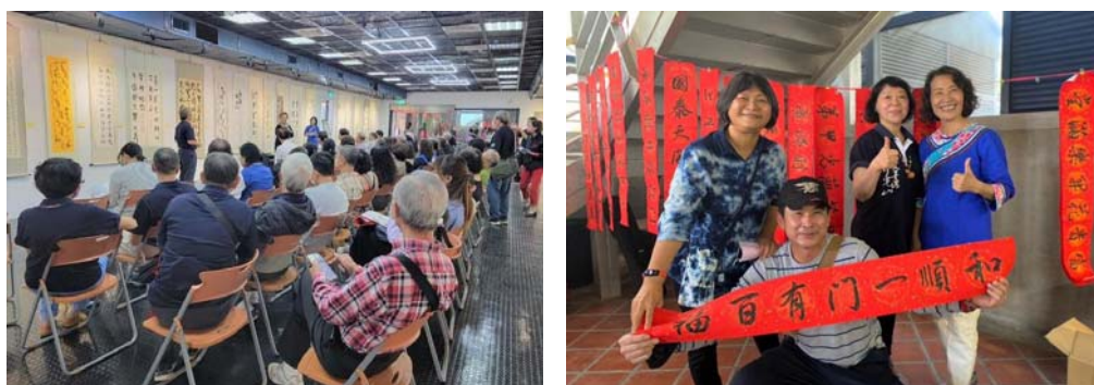
圖 38、月光山書畫藝術學會美濃風情展開幕及贈春聯活動