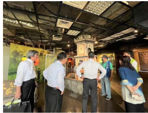
圖 16、志工為日本來訪貴賓解說

為有效運用社會人力資源，型塑客語無障礙環境，於本市三民區公所、美濃客家文物館、新客家文化園區文物館等重要公共場所，設置「客語服務窗口」，提供客語之專業服務解說及導覽，112 年 9 月至 113 年 2 月計 89 名志工投入志願服務工作，總服務時數 6,738 小時、共服務 61,526 人次。（圖 16）