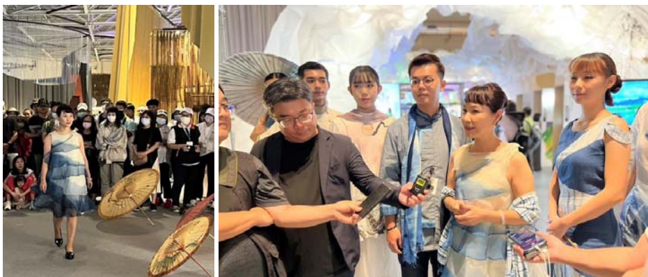
圖 20、藍衫 Show