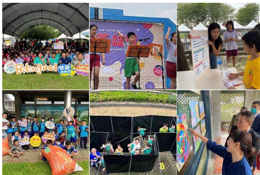
圖10、「客加英雄讚－藝起遊館」校園客英雙語系列活動

112年10月至11月與國家發展委員會合作，動員杉林區及美濃區14所學校及13家客英雙語友善商店，執行「E=M*Cdouble」雙語活力生態動能轉換計畫。包含募集20支英語小尖兵視頻，徵集「學校生活蓋生趣」創意海報279件，辦理1場次「布客思藝」原客雙語融入課程活動，13場次「客加英雄戰」校園雙語日、藝起遊館校園雙語闖關市集、1場次客英雙語劇團演出、1場次「超級濃夫」桌遊比賽等，合計約2,678人次參與，英語小尖兵視頻線上觀看次數約1萬6,548次。（圖10）