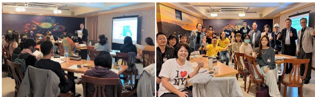
圖 31、2023 客家跨世代高雄創業牽成計畫