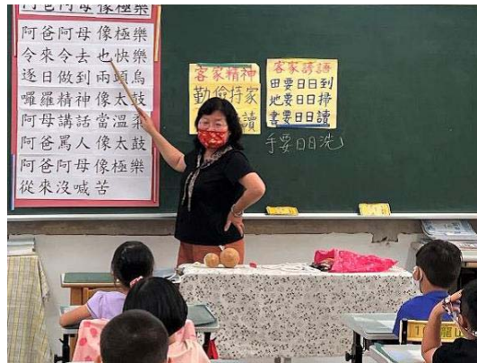
圖 3、國小客華雙語教學－教師以客華雙語進行引導

國小、國中推動「客華雙語教學模式發展計畫」部分，107-111 學年度計有教師 140 人次、學生 2,370 人次參與；112 學年度有美濃國小、杉林國小等 10 所國小及南隆國中等 3 所國中提出申請計畫，計國小 28 班、29 位教師、483 位學生；國中 8 班、6 位教師、129 位學生參與。（圖 3-5）