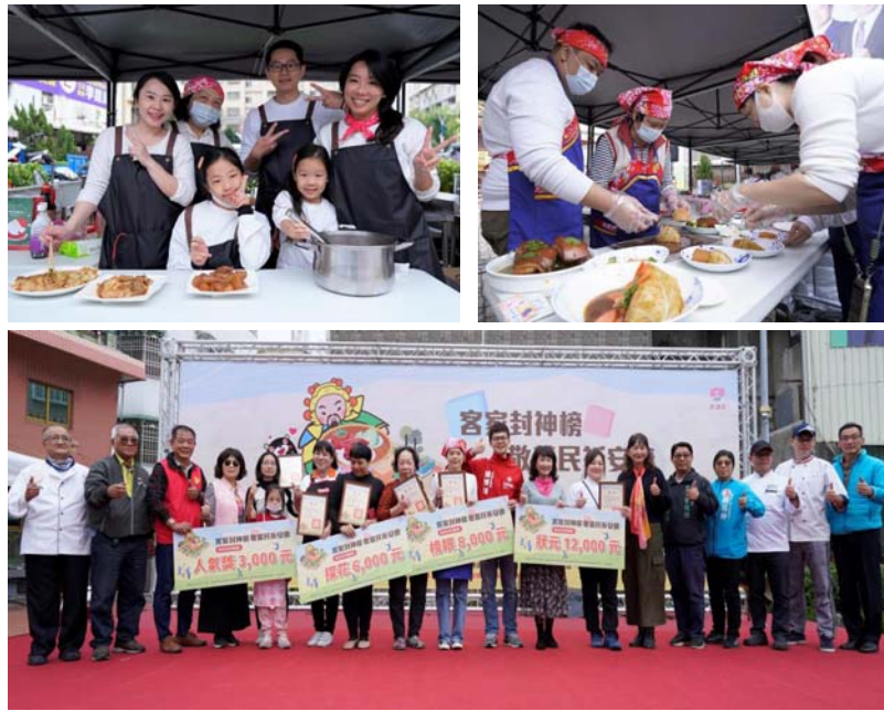
圖 26、客家封料理比賽