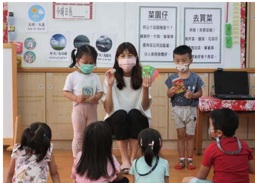
圖 1、幼兒園進行主題式客語沉浸教學－句型與生活情境

幼兒園推行「沉浸式客語教學」部分，107-111 學年度計有教師 71 人次、學生 752 人次參與；112 學年度有美濃區龍肚國小附幼、廣興國小附幼、美濃國小附幼、吉東國小附幼、中壇國小附幼，與杉林區上平國小附幼等 6 所幼兒園提出申請計畫，計 8 班、16 位教師、144 位學童參與。（圖 1、2）