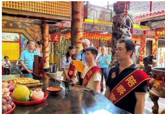
圖 27、客家祭祀禮儀傳承研習