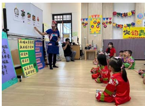
圖9、火焰蟲非營利幼兒園

幼兒園」，委託社團法人高雄市婦幼同心會經營，112年7月21日正式開園，招收兩班3歲以上至國小入學前的幼童，112學年度第二學期招生結果滿招48人。（圖9）