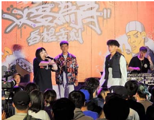
圖 22、Rap Battle—難得一見的男女 battle

112 年 10 月 28 日於新客家文化園區戶外廣場辦理，活動內容有 Rap Battle、表演及特色市集等，將時下年輕族群喜歡的嘻哈和客家八音結合，吸引年輕族群接觸並融入客家文化，計 500 人次參與。（圖 22、23）