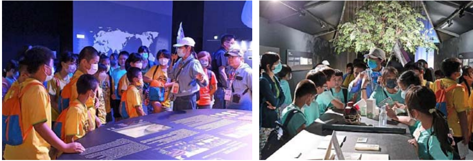
圖 21、2023 世界客家博覽會文化教育體驗遊程

3.桃園市政府補助本府 80 萬元經費辦理「2023 世界客家博覽會文化教育體驗遊程」，於 8 月 11-12 日、9 月 18-19 日及 21-22 日帶領三梯次計 11 所偏遠地區學校共 210 名學童參觀，以輕鬆有趣的遊程體驗走訪世界客家博覽會場館及桃園具文化教育意義觀光景點，提供偏遠地區孩童文化教育體驗及弱勢族群人文關懷。（圖 21）