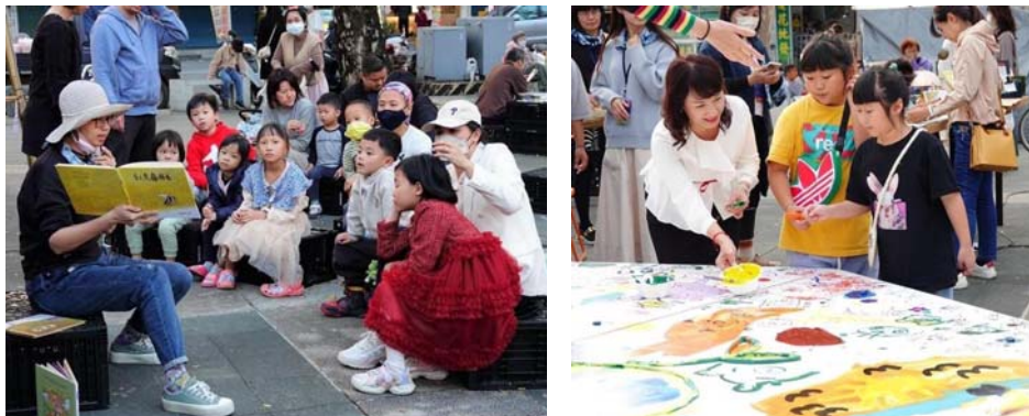
圖 41、搖籃閱讀市集－想想繪本世界

(2)鼓勵公私團體利用美濃文創中心「開庄廣場」舉辦各項藝文活動，112 年 9 月至 113 年 2 月止提供場地租借服務計 5 場次，有效發揮資源共享場地多元使用功能，更藉由各項多元活動，建構美濃文創中心成為美濃地區的文化據點及核心。