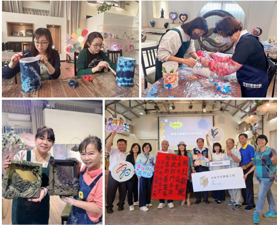
圖 42、帕蒂斯夢想烘焙屋藝術體驗活動

音樂及產業交流中心，定名「牛埔庄生活文化館」，出租「帕蒂斯夢想烘焙屋」進駐營運，並配合市府太陽能屋頂計畫，招商建置發展綠能。 2.除提供餐飲服務，112年辦理藍染DIY、客家八角宮燈、鬱金香染布燈、油桐花裝飾燈、布雕藝術體驗等各項藝文活動計40場次。（圖42）