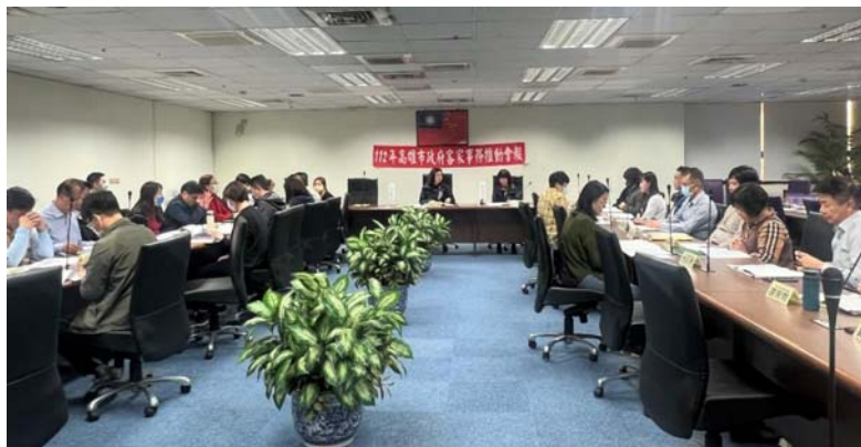
圖 18、客家事務推動會報

112 年 10 月訂頒「高雄市政府客家事務推動會報設置要點」，由市長擔任會報召集人，副秘書長擔任副召集人，建立客家事務治理平台，以族群主流化思維，整合跨局處之職權及資源，共同推動客家語言文化發展，於 112 年 12 月 26 日召開 112 年第 1 次會議。（圖 18）