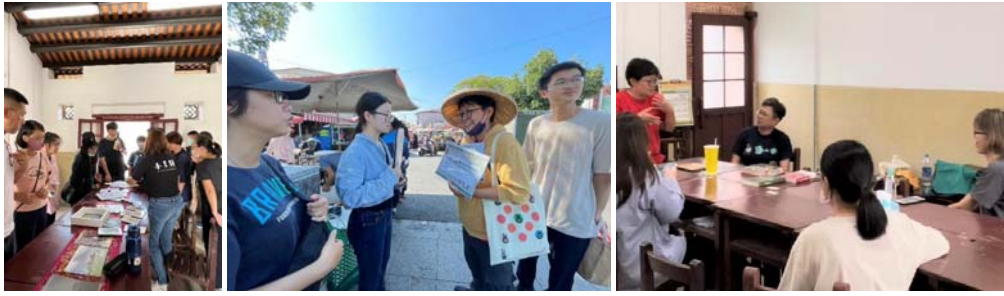
圖 33、行讀光影美濃：庄頭散策