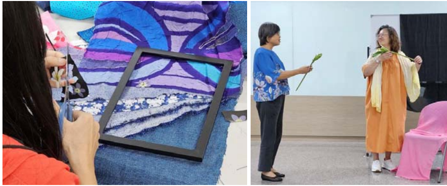
圖 11、客語師資專業知能研習