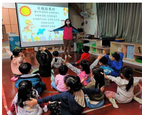
圖 2、幼兒園進行主題式客語沉浸教學－唸謠活動