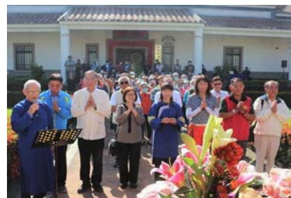
圖 28、「客家完福（還福）」祭儀

112 年 12 月 18 日假新客家文化園區文物館辦理「客家完福（還福）」祭儀，逾 100 名客家鄉親遵循客家傳統古禮儀式祭拜，傳承客家禮俗文化。（圖 28）