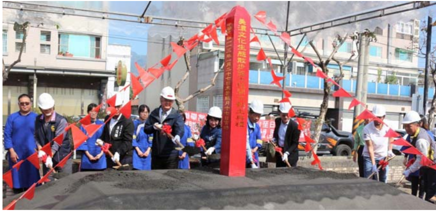
圖 44、美濃文化生態散步策工程動土典禮