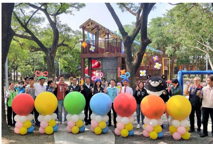
圖 43、愛河童盟新禾埕啟用典禮

化元素，打造戶外共融式兒童遊戲區域，提供多元、適性、探索的親子共享遊憩場域，總經費 1,203 萬元，獲客家委員會補助 1,010 萬元，111 年 6 月發包，112 年 7 月完工，經票選命名為「愛河童盟新禾埕」並於 10 月 12 日啟用。（圖 43）