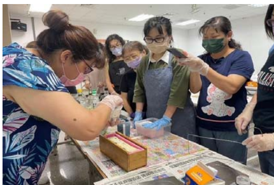
圖 32、客家花香創皂班