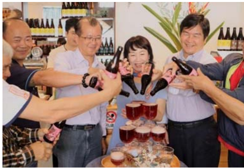
圖 47、花酵開幕品評會

延續計畫亮眼績效，112 年再次徵選文創人才駐地展店，並擴展範圍以舊美濃永安庄為發展基地，於 10 月遴選出「柚仔林合和學堂書店」及「花酵」2 家店家，每名最高補助 50 萬元經費營運，透過文化創意與觀光行銷帶動街區活化，發展產業契機，開拓文化與經濟雙重價值兼具之文創市場，打造南方客家小鎮美濃成為豐富多元的文創美學城鎮。其中「花酵」於 113 年 2 月 6 日舉辦開幕品評會，吸引眾多人潮駐足品嚐，感受美濃青年的文創力。(圖 47、48)