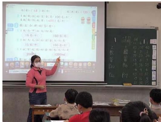
圖 4、國小客華雙語教學－學生利用客語表達