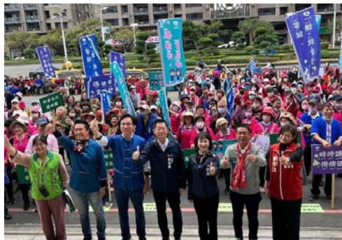
圖 17、1228 還我母語日－全臺共下講客遊行

配合 112 年全國客家日舉辦「1228 還我母語日－全臺共下講客遊行」，約 520 人繞行四維三路、復興二路、青年一路及民權一路人潮聚集地，以創意裝扮、揮舞旗幟、播放客家音樂、沿途發放「佢講客」貼紙並大聲呼喊講客宣言，共同宣誓守護與傳承母語。（圖 17）