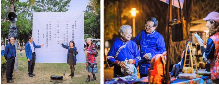
圖 37、2023 全國客家日－藝起來見客音樂生活節

「HAKKA 文化系列活動」以及「好客好市集」等，以走進客家的生活藝術為出發點，融合傳統客家文化與現代元素。此次活動共吸引至少 10,000 人次參與，打破民眾對於客家活動的既定印象，一同感受這場文化藝術的盛宴。（圖 37）