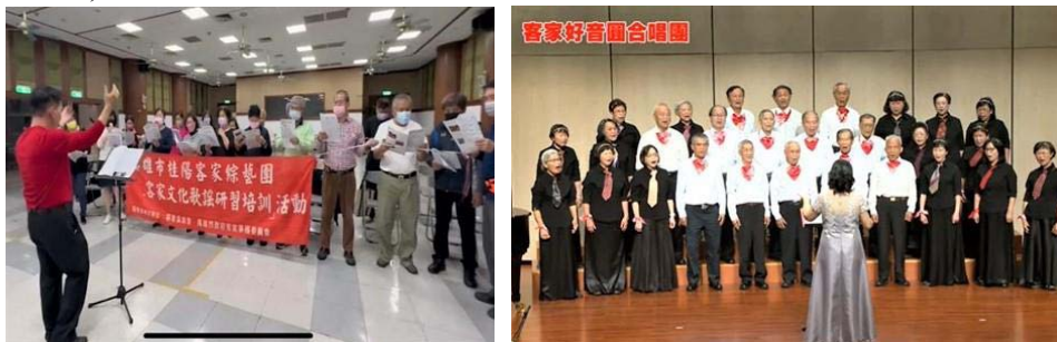
圖 30、客家社團辦理培訓課程及社區公演