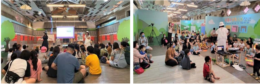
圖 15、客話講故事實況

為落實社區營造客語沉浸環境，並長期持續性促進客語在社區流通與扎根，本會串聯美濃及杉林區公所辦理客話講故事，於 112 年 5 月至 11 月在美濃客家文物館、美濃圖書館及杉林圖書館辦理志工說故事、遊戲手作活動、庄頭說故事劇場—山宛然客語布袋戲、客家風味萬聖節說故事成果發表等計 44 場活動，約 734 人次參加，線上影音平臺閱聽人次約 822 人次，合計約 1,556 人次參與活動，透過社區活動增加客語閱聽人口，開啟社區推動客語復振的契機。（圖 15）