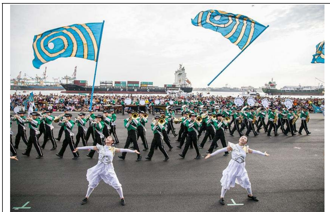
照片 16：日本東京農業大學第二高等學校吹奏樂部「翡翠騎士」抵達高雄進行首演，以 148 人編制於高雄港七號碼頭演出多首歌曲，廣獲好評