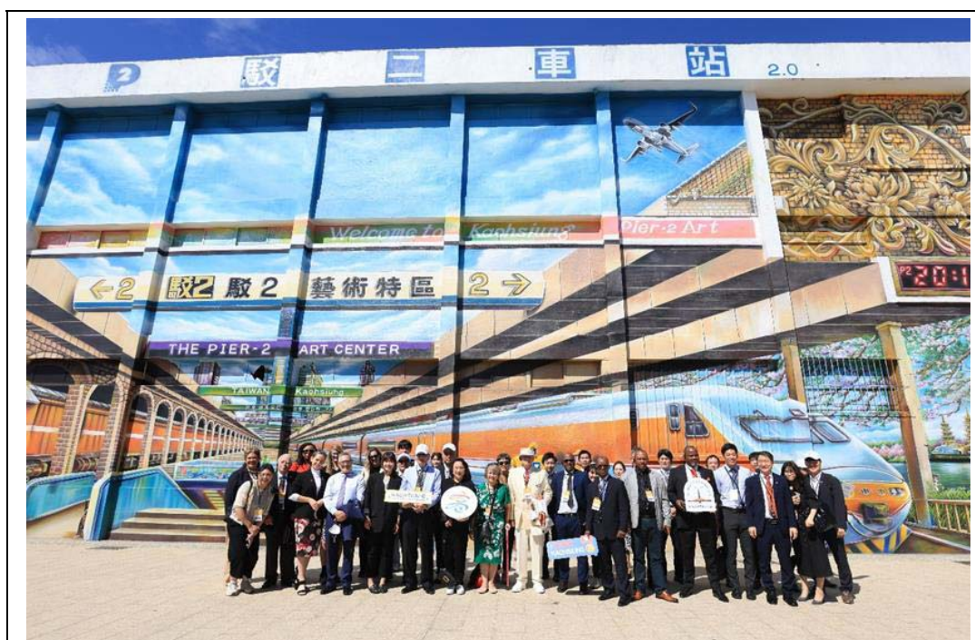
照片 37：訪團參與「2024 冬日遊樂園」接待活動，參訪駁二藝術特區合影