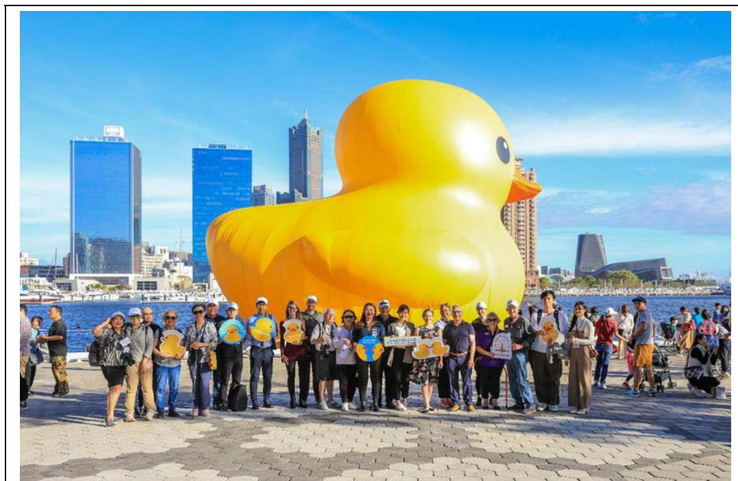
照片 36：姊妹市及友好夥伴城市訪團參與「2024 冬日遊樂園」活動，與黃色小鴨合影留念，並進行市政參訪