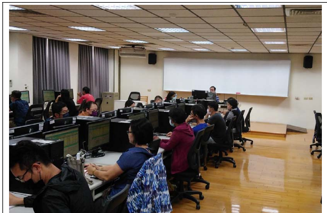
照片 39：職工人事系統功能說明與實機操作班上課情形