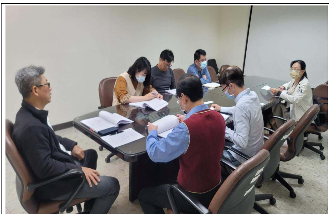
照片 38：市府所屬各機關臨時人員審核小組審議情形