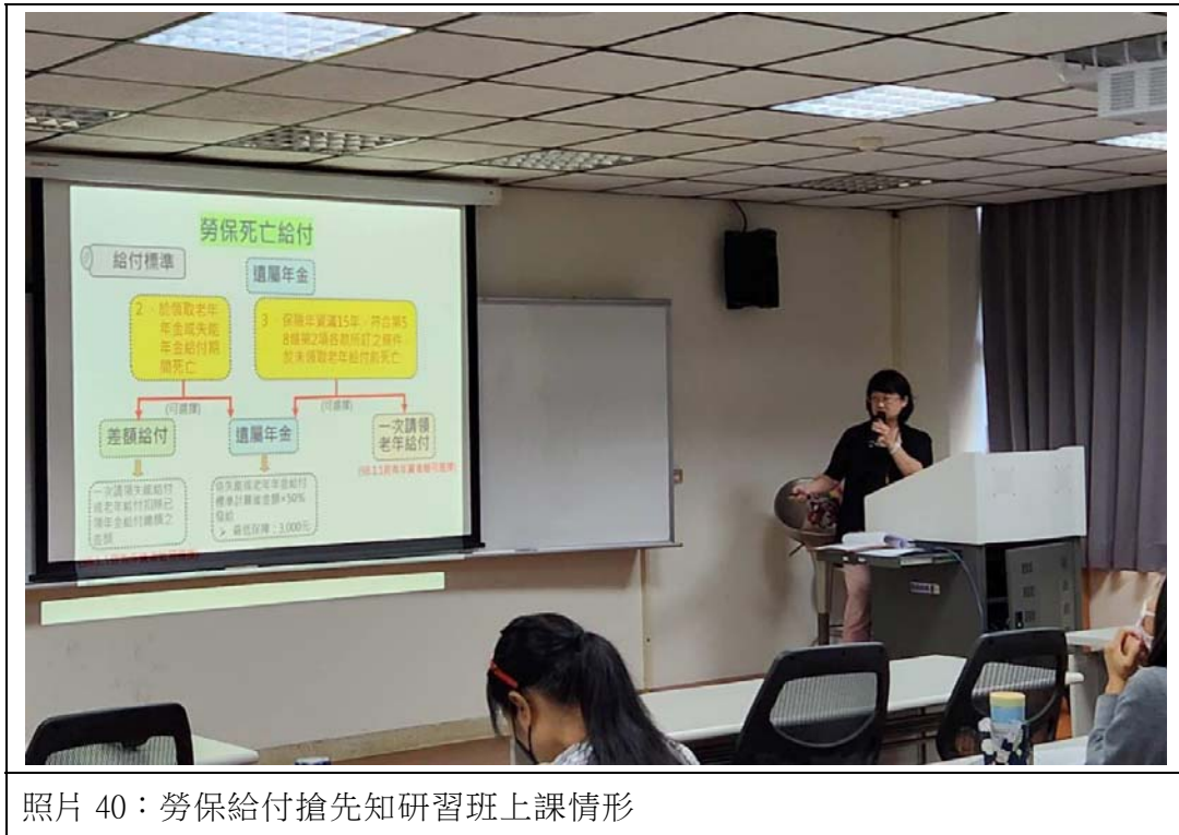
照片 40：勞保給付搶先知研習班上課情形