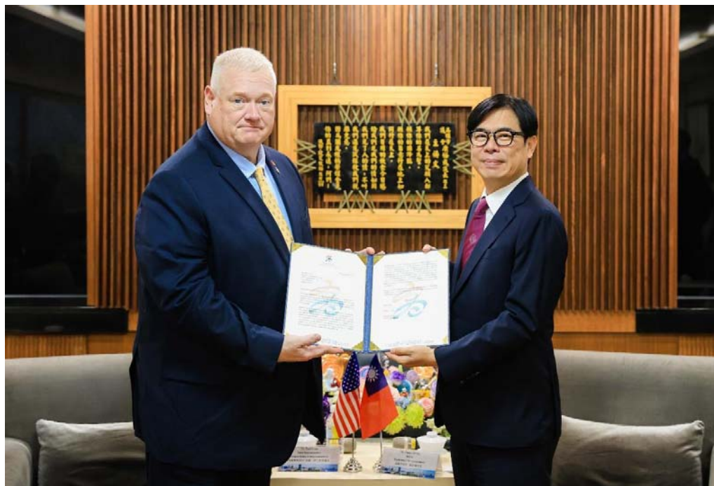
照片 26：美國奧勒岡州眾議員保羅·伊凡斯訪高拜會陳其邁市長，盼進一步推動雙邊城市交流關係