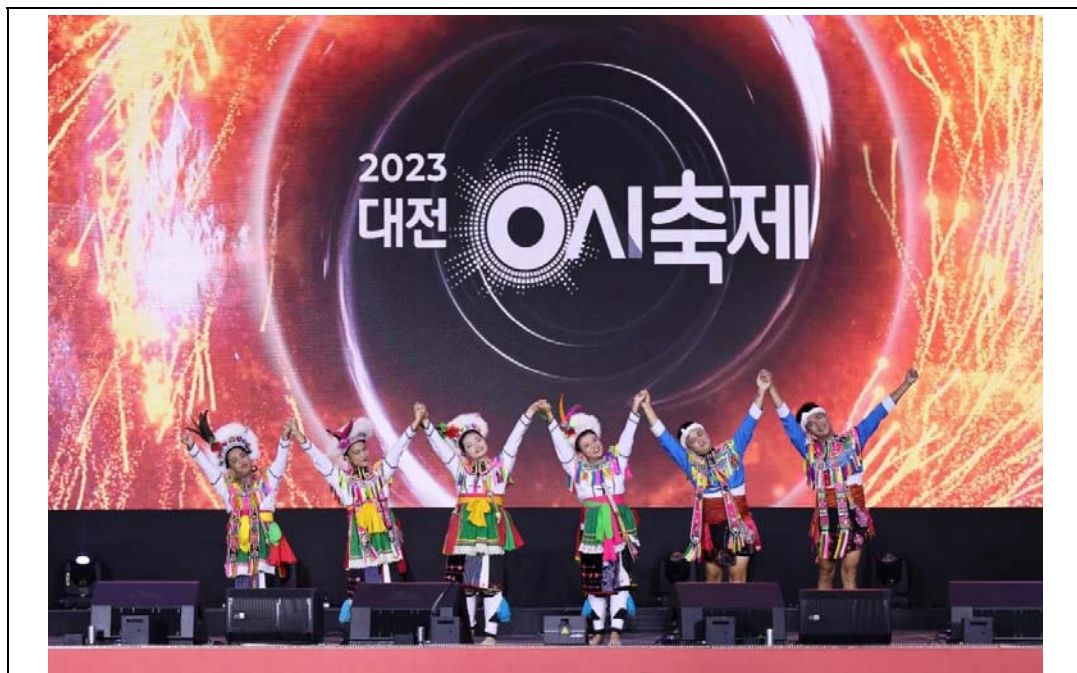
照片 4：本處推薦「麒麟原住民文化藝術團」參與友好城市韓國大田市「2023大田 0 時慶典」，行銷高雄豐富原住民文化並加深雙方友好情誼