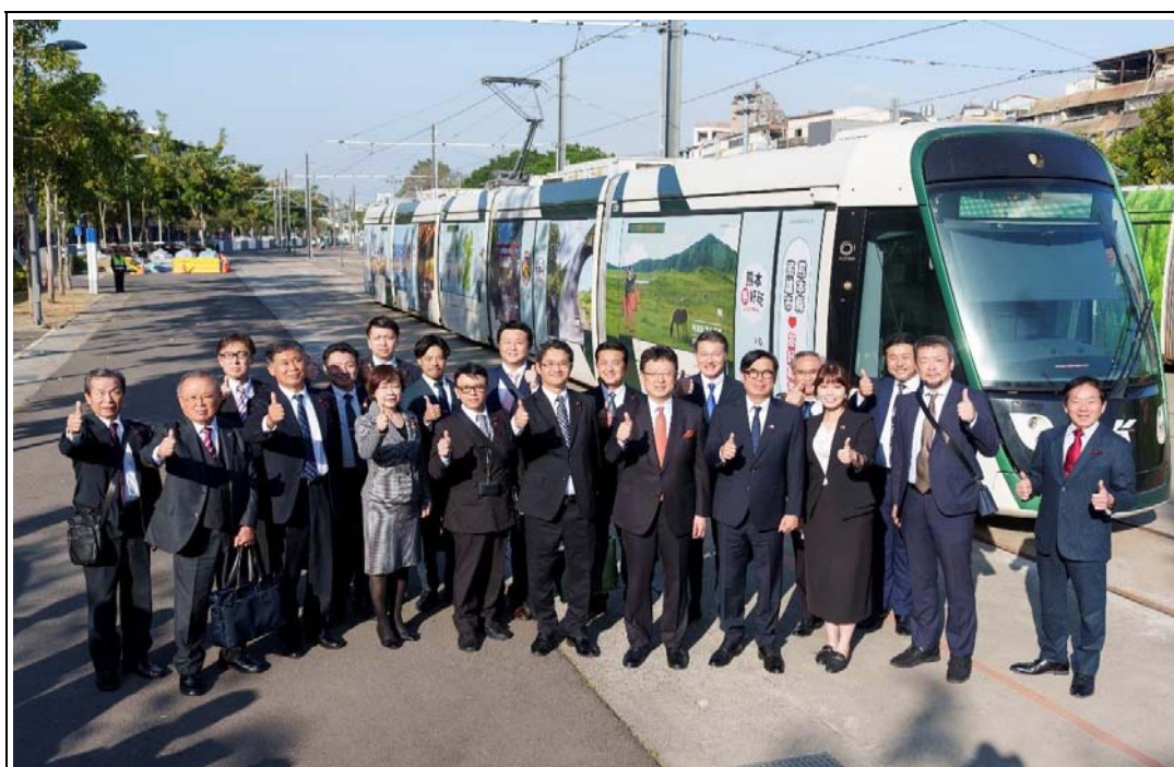
照片 11：陳其邁市長陪同熊本市大西一史市長（右 8）與田中敦朗議長（右 10）及訪團成員考察輕軌、捷運等市政建設，瞭解高雄城市發展規劃及成果