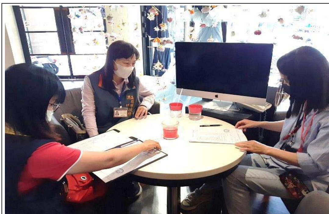
照片 41：本處消保官會同主管機關進行婚紗攝影業查核