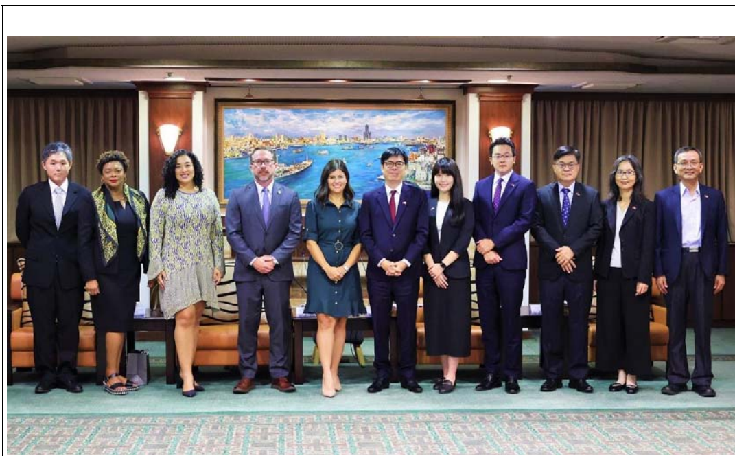
照片 13：美國佛羅里達州議會訪問團拜會陳其邁市長，討論高雄高科技產業、智慧城市應用、數位轉型及淨零轉型等議題