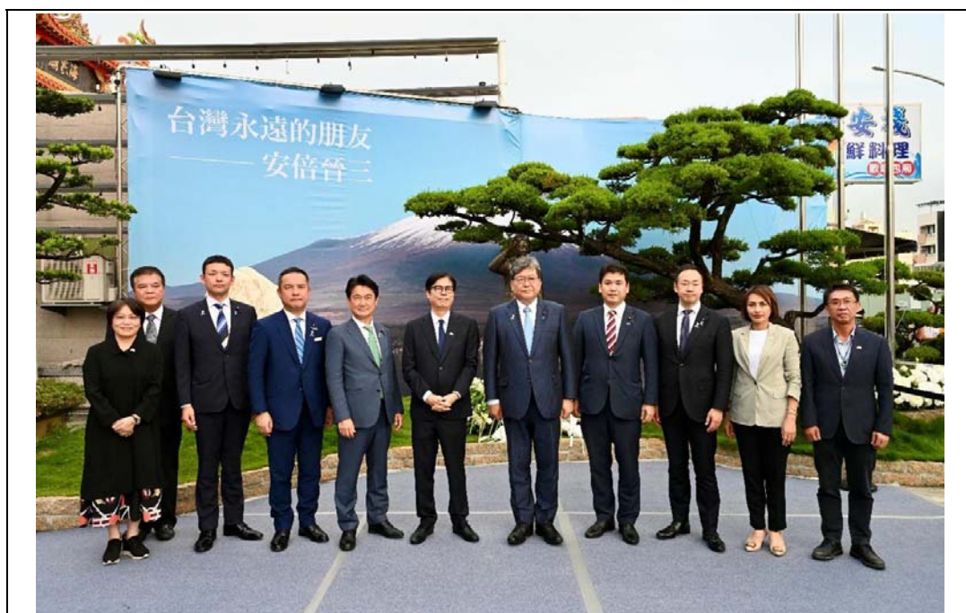
照片 17：陳其邁市長陪同日本日華議員懇談會幹事長、自民黨政務調查會會長萩生田光一眾議員（右 5）一行前往紅毛港保安堂向安倍晉三前首相銅像致意