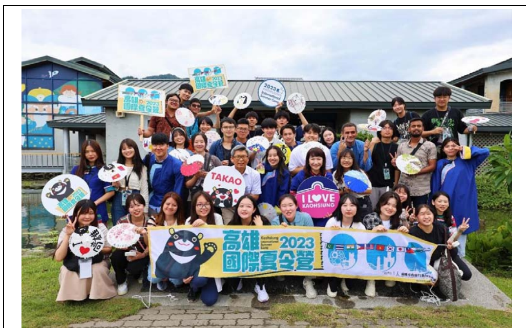
照片3：「2023高雄國際夏令營」共有來自美國、日本、韓國、越南、菲律賓、泰國、印度、巴基斯坦8國海外城市大學生與在地大學生互動交流並促進跨國青年友誼