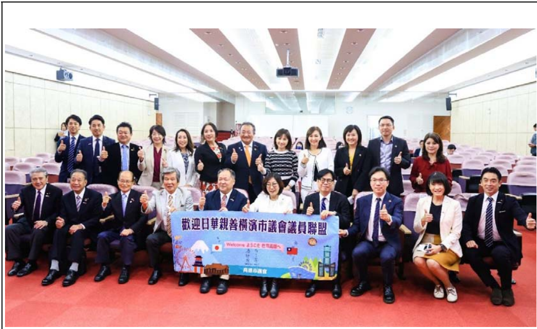
照片 25：日本橫濱市議會訪團訪高，與陳其邁市長及康裕成議長商議觀光、文化、教育等議題，盼持續增進台日友好情誼