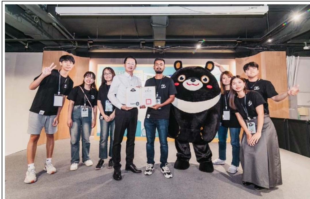
照片 2：「2023 高雄國際夏令營」邀請姊妹市及友好夥伴城市或海外城市大學生體驗高雄多元文化