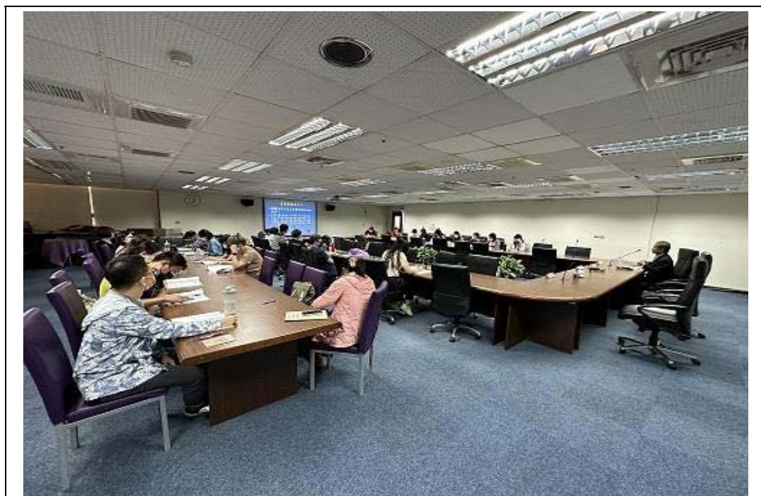
照片 42：本處消保官教育宣導消費者保護知識