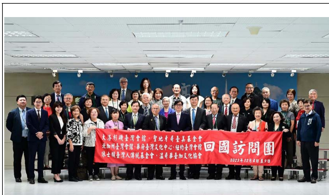
照片 27：2023 年北美各地台灣會館、台灣中心暨台灣協會回國訪問團拜會市府，陳其邁市長感謝所有北美僑界的好朋友，拓展台灣的外交空間，讓台灣持續走向世界