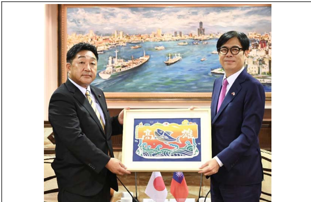
照片 6：日本八王子市議會福安徹議員一行拜會陳其邁市長