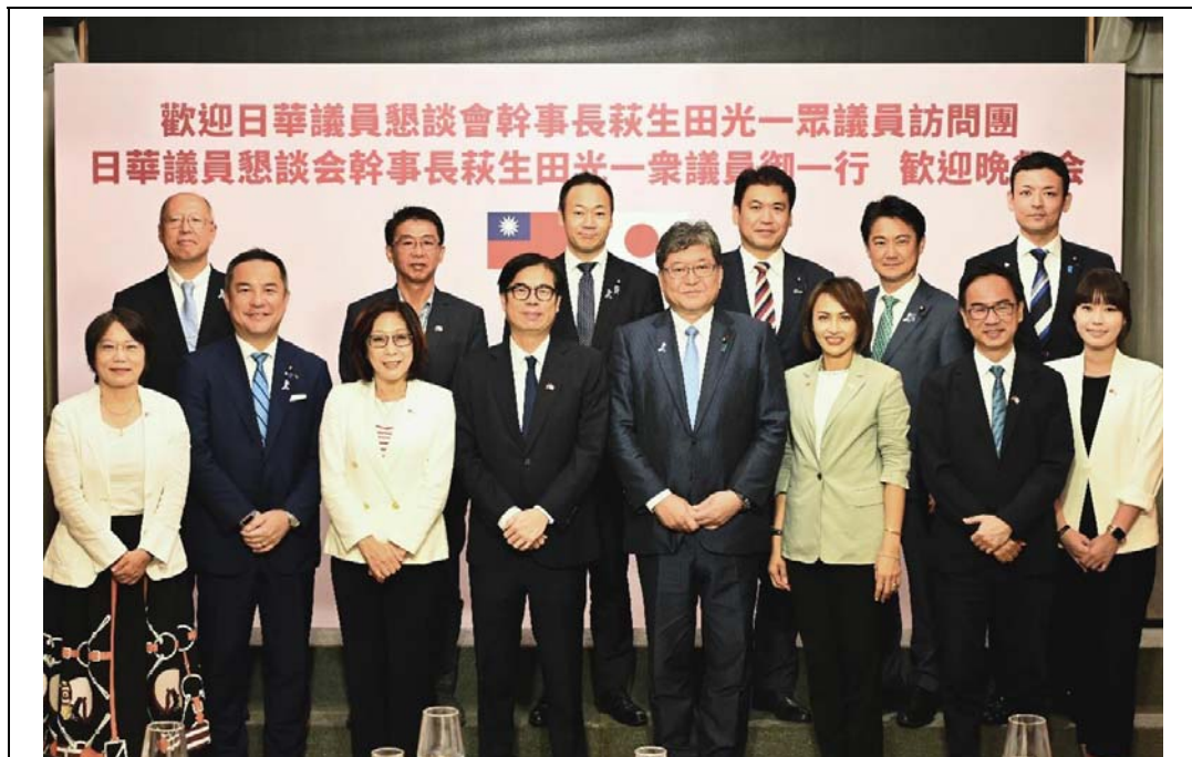
照片 18：市府舉辦歡迎晚宴接待萩生田光一眾議員（前排右 4）一行，康裕成議長及在地立委皆出席交流