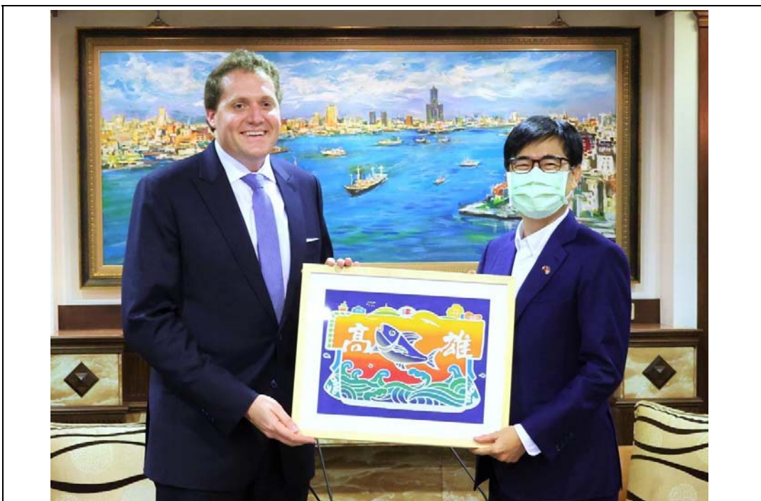
照片 14：美國在台協會高雄分處新任處長張子霖拜會陳其邁市長，雙方就產業、淨零減碳及多元文化議題交換意見