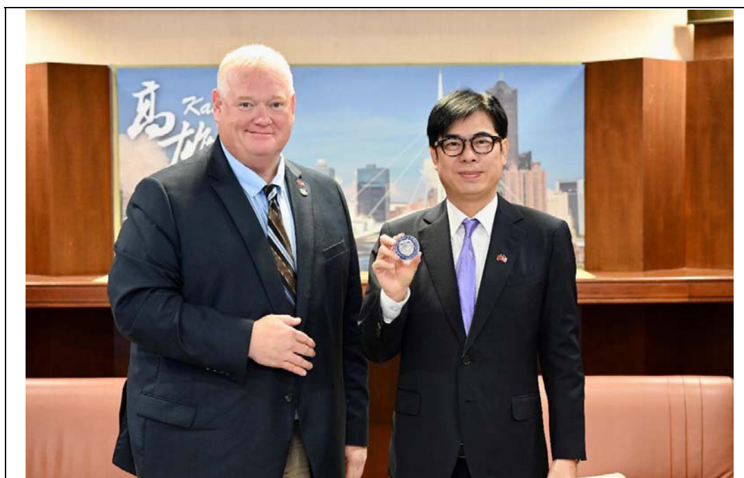
照片 15：美國奧勒岡州眾議員保羅·伊凡斯拜會陳其邁市長，商議高科技產業、急難救助及學術等面向之合作