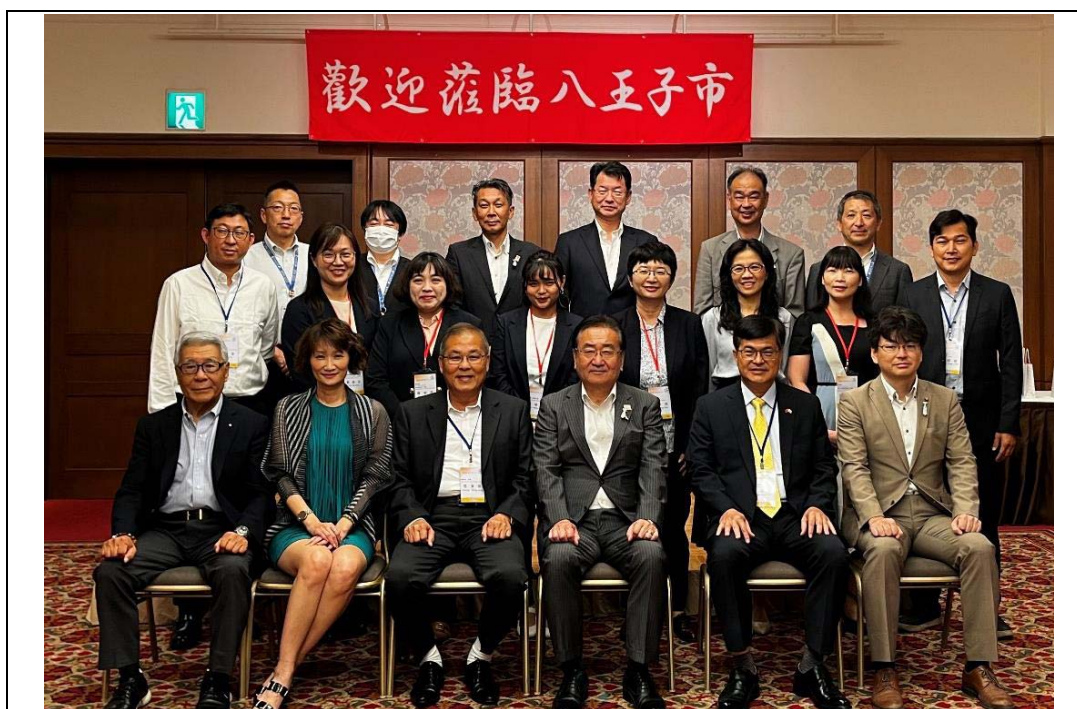
照片 1：市府教育局謝文斌局長率農業局、民政局及本處共同參與日本八王子友好城市盛典八王子祭，受到石森孝志市長（前排右三）熱烈歡迎