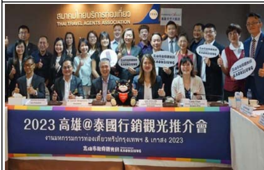
2023 泰國曼谷推介會暨拜訪考察活動