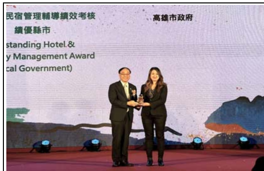
高雄第 6 度獲全國旅宿業管理績效特優