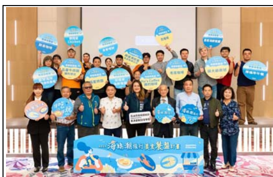
2023 海線潮旅行美食餐盤計畫