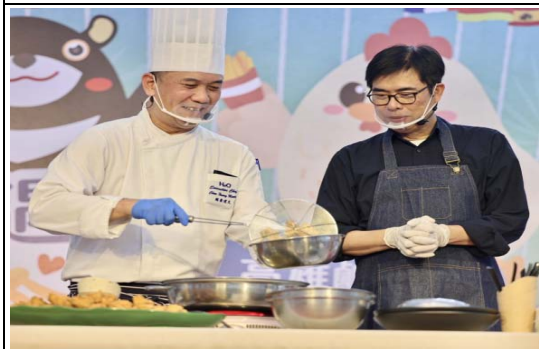
高雄鹹酥雞暨國際炸物嘉年華