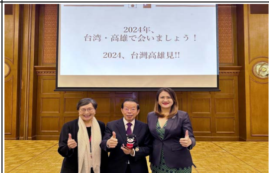
成功爭取第 15 屆台日觀光高峰論壇主