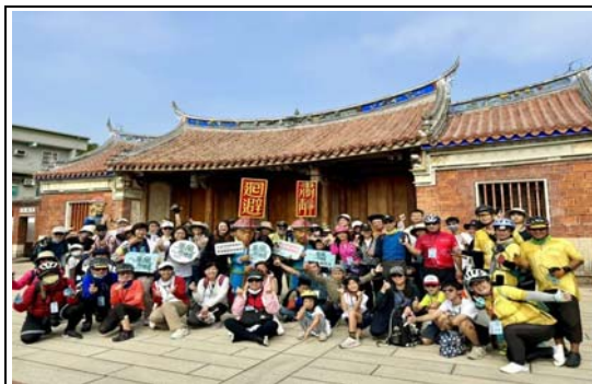
乘風而騎鳳山場－鳳儀書院合影

預計 113 年 3 月 9 日至 3 月 24 日假內門紫竹寺辦理，以「全國創意宋江陣頭大賽」吸引各地陣頭參與互相交流，並搭配在地信仰盛會、列為國家重要民俗的「羅漢門迎佛祖遶境」及陣頭拜觀音等系列活動，吸引民眾前往觀賞精湛的文武陣頭表演。另為展現傳統辦桌文化，特別邀請在地總舖師辦理「宋江大宴」，讓賓客體驗濃濃人情味。