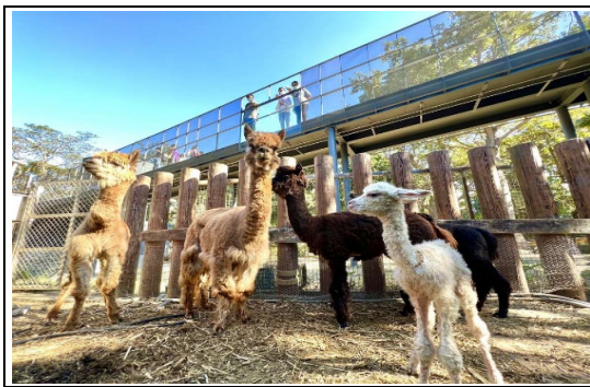
壽山動物園榮獲「台灣建築獎」首獎

3.內門觀光休閒園區採低度開發模式，維持現地自然生態景觀，規劃為親子、多元休憩及親近可愛溫馴動物之觀光休閒園區，除串連東高雄區域旅遊軸帶外，更將與內門在地組織，例如地方社區發展協會、馬頭山自然人文協會等，合作推出更深度探索、多元之遊程體驗，達到與地方共榮之觀光效益。