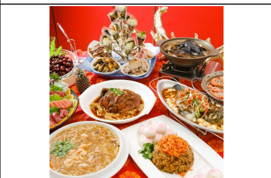
籌備 2024 高雄內門宋江陣