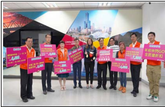
2023 高雄冬季國際旅展