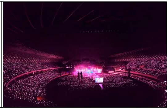
演唱會經濟帶動觀光效應