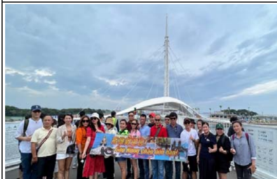
2022-23 國內旅遊團體補助計畫