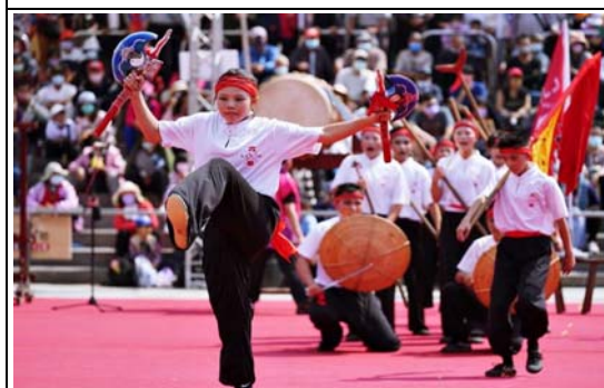
籌備 2024 高雄內門宋江陣