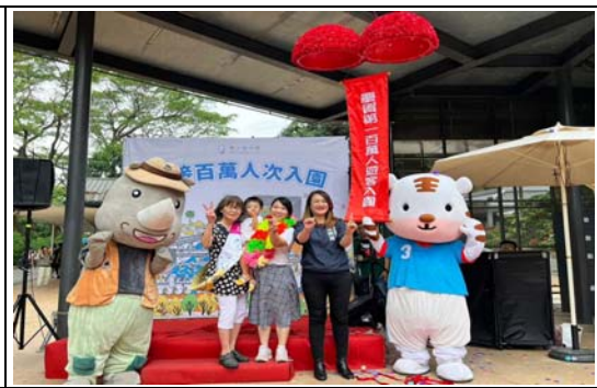
壽山動物園國慶假期喜迎第 100 萬位遊客