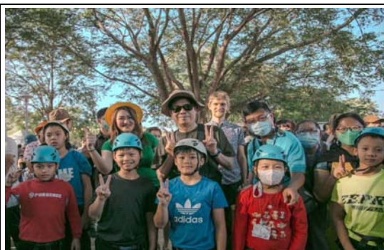
「Wild Wild 野生活」活動－溜索體驗