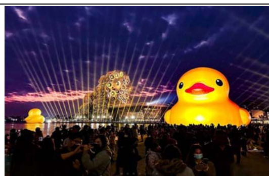
高雄燈會活動主題－2024 冬日遊樂園