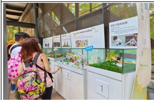
2023 設計未來式－壽山動物園商品投票