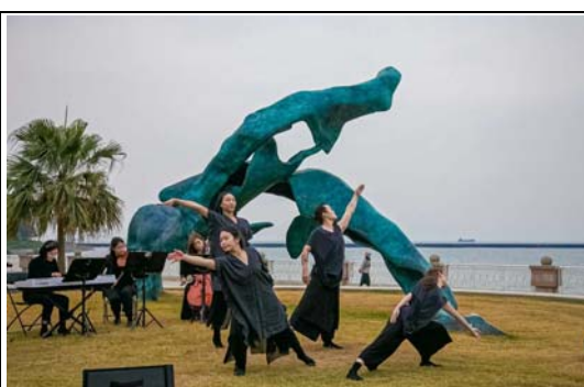
西子灣海洋之舞音樂會