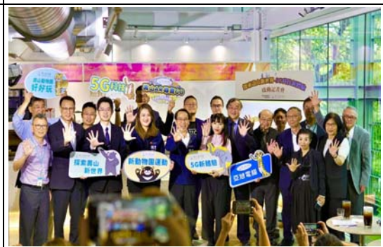
探索壽山新世界－5G 科技新體驗」發布記者會