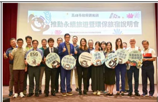
推動永續旅遊暨環保旅宿說明會