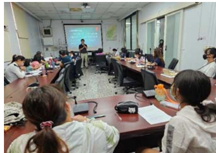
圖 10、客語能力認證班

為強化公教人員及民眾客語會話能力，提升客語流通及使用率，112 年 4 月至 9 月於客家文化重點發展區（美濃、甲仙、六龜、杉林）及市區（苓雅、三民、小港、鳳山）規劃辦理共 18 班客語能力認證班，計 424 人參與。(圖 10)