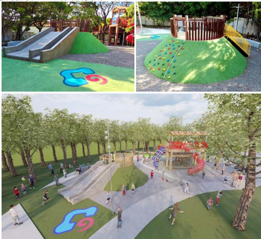
圖 27、新客家文化園區戶外遊樂設施工程

針對新客家文化園區戶外遊樂設施進行改善，汰換老舊遊具，融入客家文化元素，打造戶外共融式兒童遊戲區域，提供多元、適性、探索的親子共享遊憩場域，總經費 1,203 萬元，獲客家委員會補助 1,010 萬元，111 年 6 月發包，112 年 7 月完工，8 月取得遊具安全檢驗 TAF 認證合格，預計 9 月完成驗收，10 月開放使用。(圖 27)