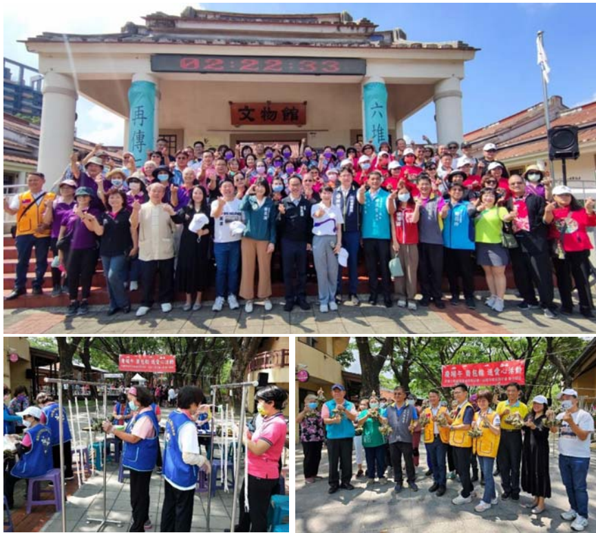
圖 13、六堆日升旗儀式暨紀念活動