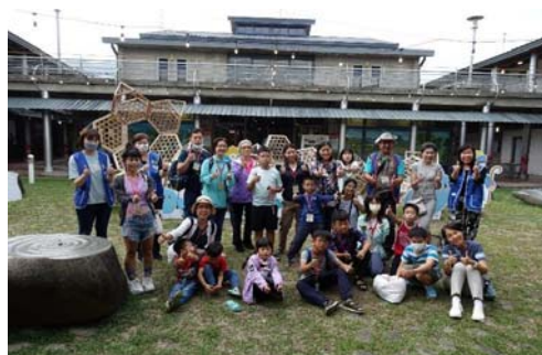
圖 24、夜宿美濃尋寶趣