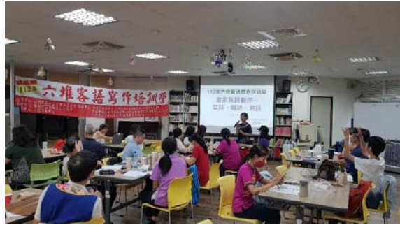
圖 19、客家社團培訓課程