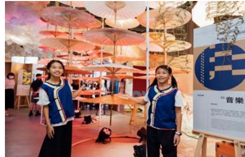
圖 17、世界客家博覽會開幕快閃活動

4.桃園市政府補助本府 80 萬元經費辦理「2023 世界客家博覽會文化教育體驗遊程」，業於 8 月 11-12 日帶領 4 所偏遠地區學校計 80 名學童參觀，預定 9 月 18-19 日及 21-22 日再帶領 2 梯次約 130 名學童觀展，以輕鬆有趣的遊程體驗走訪世界客家博覽會場館及桃園具文化教育意義觀光景點，提供偏遠地區孩童文化教育體驗及弱勢族群人文關懷。(圖 18)