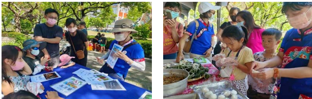
圖 14、「好客迎端午・包粽齊飄香」活動

為推廣客家文化及客庄產業，結合端午節慶，112年6月18日於鳳山婦幼青少年活動中心辦理，透過客家版粽DIY、手作香包、紙傘彩繪、粽夏市集及藝文表演，讓民眾了解客家文化及學習生活客語，約500人參與。(圖14)