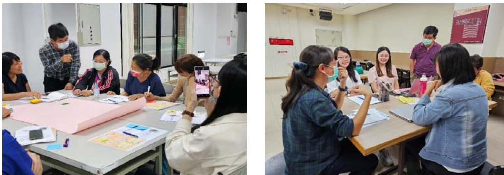
圖 11、客語社區營造計畫工作坊

各辦理 1 場說明會，計 49 人次參與。並於 6 月至 10 月，每月辦理 1 場工作坊（共 5 場）進行案例分享及小組輔導，循序從想法聚焦、資源盤點、社區動員，到提案討論及確認，輔導參與者寫出計畫，計客庄區 7 組與都會區 3 組（共 12 人）有意願申請計畫者報名參加。（圖 11）