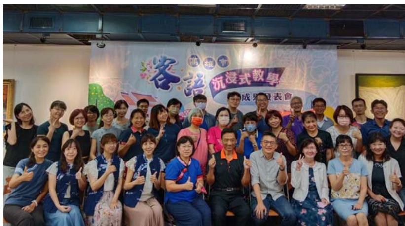
圖 7、客語沉浸式教學推動執行成果分享會議