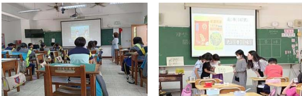
圖 2、國中小客華雙語教學

本會針對參與計畫教師辦理客語沉浸、客華雙語教學等專業知能培訓、訪視輔導暨成效評估，協助建立教學模式，以達到語言學習及母語保存之目的。111 學年國中、小客華雙語教學部分計辦理 43 小時師培及訪視課程，參訓教師 127 人次；幼教客語沉浸教學部分辦理 48 小時師培課程，參訓教師 140 人次。（圖 3）