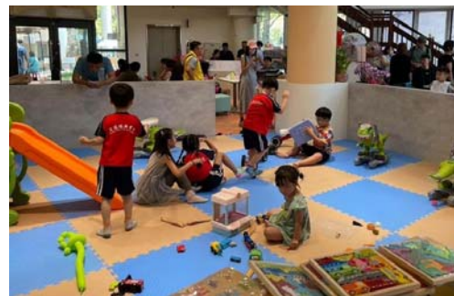
圖 21、波波耐吃親子餐廳

2.與高雄市微風志業協會合作，每週六於園區戶外廣場辦理「微風市集」，推廣在地小農自產自銷的農產品及加工品，讓消費者與生產小農面對面