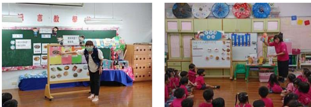
圖 1、幼教客語沉浸教學

幼兒園推行「沉浸式客語教學」部分，107-111 學年度計有教師 71 人次、學生 752 人次參與；112 學年度有美濃區龍肚國小附幼、廣興國小附幼、美濃國小附幼、吉東國小附幼、中壇國小附幼，與杉林區上平國小附幼等 6 所幼兒園提出申請計畫，預計將有 8 班、16 位教師、144 位學童參與。(圖 1)