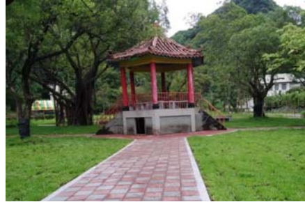
圖 26、旗美褒忠義民廟周邊環境改善工程

進行旗美褒忠義民廟周邊環境整理，融入客家意象，保存旗山區客家信仰，提升聚落居民使用品質，總經費 595 萬元，獲客家委員會補助 500 萬元，111 年 9 月發包，111 年 11 月開工，已於 112 年 7 月竣工，刻辦理驗收中，預計 9 月開放使用。(圖 26)