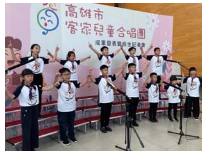
圖 20、客家兒童合唱團成軍發表暨招生記者會