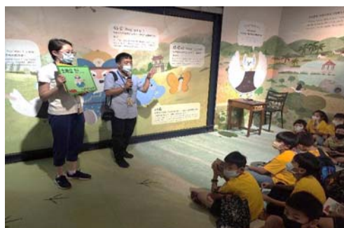
圖 23、「尋找美濃寶盒」科技想像特展