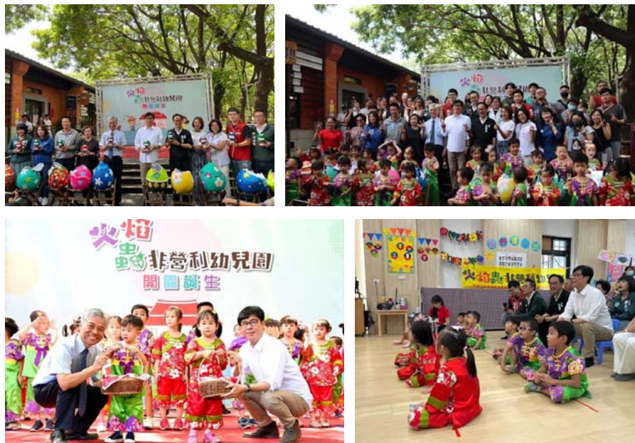
圖 6、火焰蟲非營利幼兒園開園誕生

原規劃招收 2 班 3 歲以上至國小入學前的幼童，共計 60 人（師生比 1：15），惟因教育部 112 年 3 月 30 日公布公立及非營利幼兒園 112 年 8 月起調降師生比為 1：12，爰該園最高上限僅能招收 48 人，112 學年第 1 學期招生結果滿招。