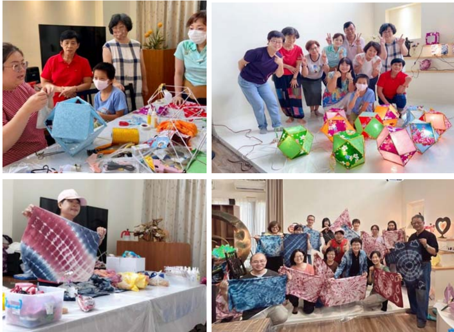
圖 25、牛埔庄生活文化館 DIY 體驗

音樂及產業交流中心，定名「牛埔庄生活文化館」，出租「帕蒂斯夢想烘焙屋」進駐營運，並配合市府太陽能屋頂計畫，招商建置發展綠能。 2.除提供餐飲服務，112年3月至8月辦理藍染DIY、創意小夜燈、客家八角宮燈、金繕示範講座與微體驗等各項藝文活動計15場次。（圖25）