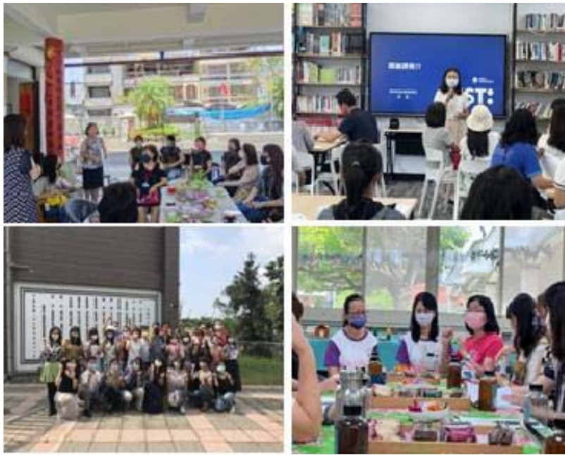
圖 4、跨縣市交流與標竿學習