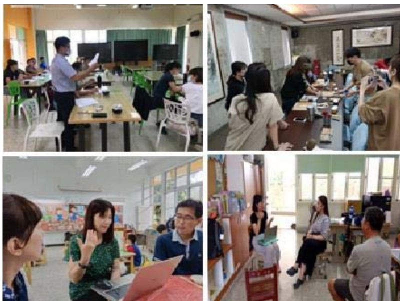
圖 3、客語沉浸式教學輔導訪視與師培

本會針對參與計畫教師辦理客語沉浸、客華雙語教學等專業知能培訓、訪視輔導暨成效評估，協助建立教學模式，以達到語言學習及母語保存之目的。111 學年國中、小客華雙語教學部分計辦理 43 小時師培及訪視課程，參訓教師 127 人次；幼教客語沉浸教學部分辦理 48 小時師培課程，參訓教師 140 人次。（圖 3）