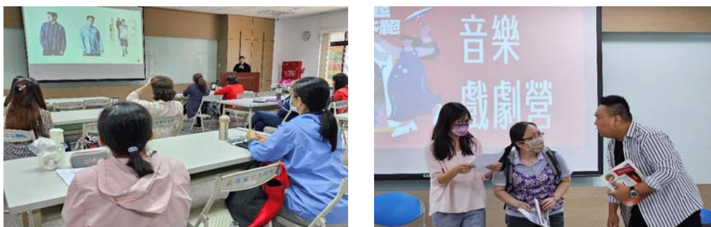
圖 8、客語師資專業知能研習課程

為加強本市客語教學人員專業知能，112年6月至8月辦理「工藝美學傳承」、「客家音樂戲劇營」及「客家文學創作營」三系列主題課程，共78小時，計165人次參與。(圖8)