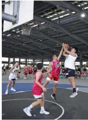
圖 15、原客青少年三對三籃球賽

國中小男女學生（共 750 人）分組比賽，每組錄取前 2 名參加客家委員會於 8 月 26 日在桃園市辦理的全國總決賽。（圖 15、16）