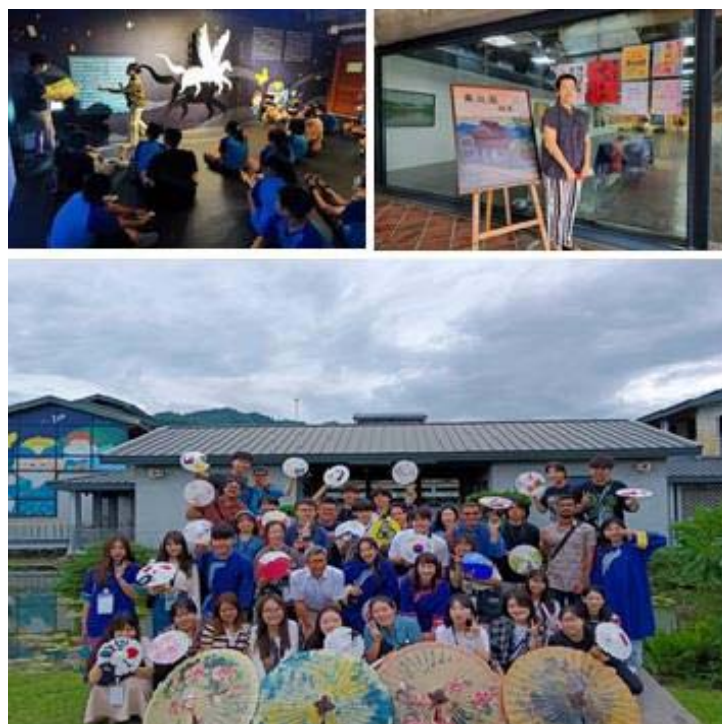
圖 22、美濃客家文物館