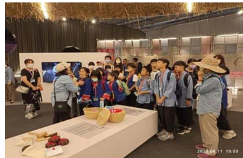
圖 18、世界客家博覽會文化教育體驗遊程