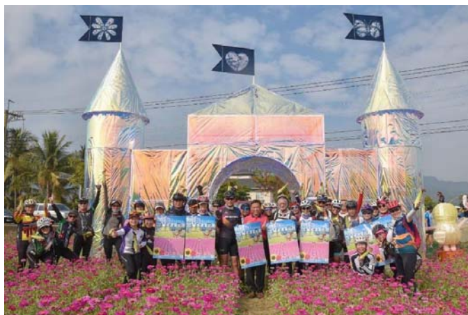
圖 28、美濃秋冬樂活嘉年華暨花海彩繪大地開園活動

為推廣行銷客庄產業及觀光，結合美濃、杉林、六龜3區文化節慶特色及景觀，以「美濃秋冬樂活嘉年華暨花海彩繪大地開園行銷活動」、「祭孔產業嘉年華」及「解憂懷舊嘉年華」等主題，於112年1月至10月分別規劃花海裝置藝術、祭河江（祭聖大典）、祭孔儀式、解憂文化祭等項目，並廣邀在地企業、店家、業者共同參與，以客庄粽創意DIY、客家歌舞展演、農特產展售、客庄微旅行等，吸引在地青年回鄉參與，深入了解在地文化特色和意涵，公私齊力創造更大的活動效益與經濟產值。（圖28）