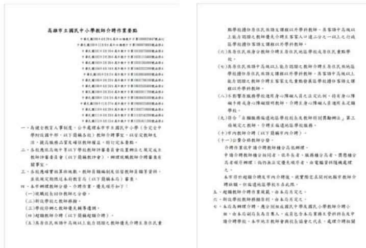
圖 5、高雄市立國民中小學教師介聘作業要點

111 年美濃地區客語教學推動與復振之座談會中，第一線教師反映客庄地區客語師資斷層以及返鄉服務不易等問題，在陳其邁市長指示下，本府教育局及本會協力合作，完成修訂「高雄市立國民中小學教師介聘作業要點」，新增具客語能力認證中高級以上之教師介聘至高雄市客庄地區之優先序條文，既回應有志介聘轉任客庄返鄉服務的教師需求，也同時提升客庄地區客語教學品質、維護客家新生代客語受教權，更為客庄區的客語復振注入一劑強心針。（圖 5）