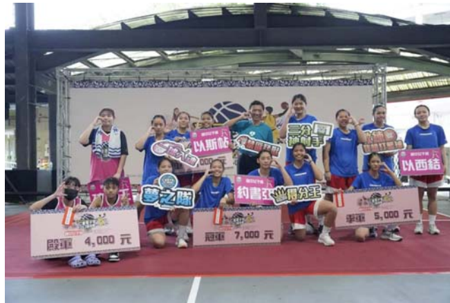
圖 16、原客青少年三對三籃球賽優勝隊伍