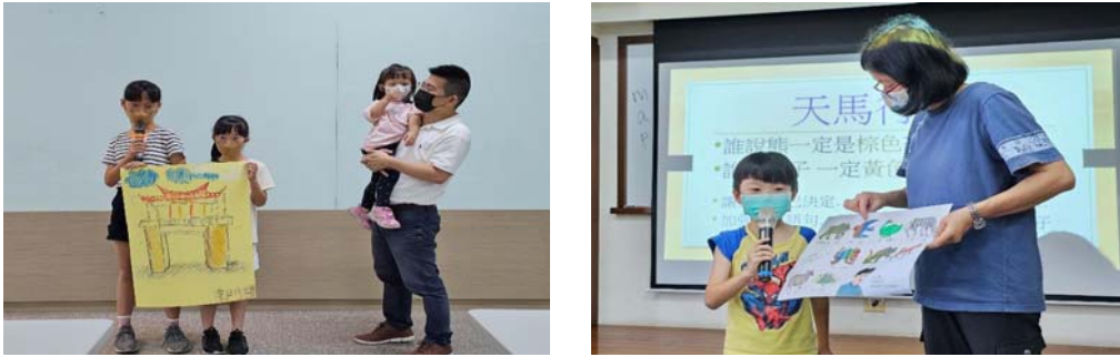
圖 9、客語家庭親子共學活動

規劃 112 年 5 月至 10 月分別於都會區及客庄區各辦理 10 場親子共學/共遊等活動。都會區以戲劇教育方式進行，活動內容有親子彩繪客家印象、手做客家符號鐵絲藝術及人偶操作演練等；客庄區採客語沉浸方式，活動內容有客語繪本說故事、動物蘿蔔蹲及藍染體驗等，5 月至 8 月已辦理共 15 場次親子活動，計 440 人次參與。(圖 9)