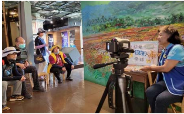
圖 12、美濃客家文物館志工說故事