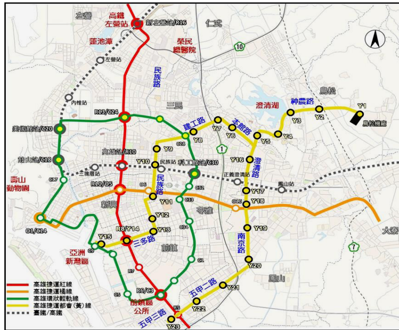
捷運都會線（黃線）路網示意圖