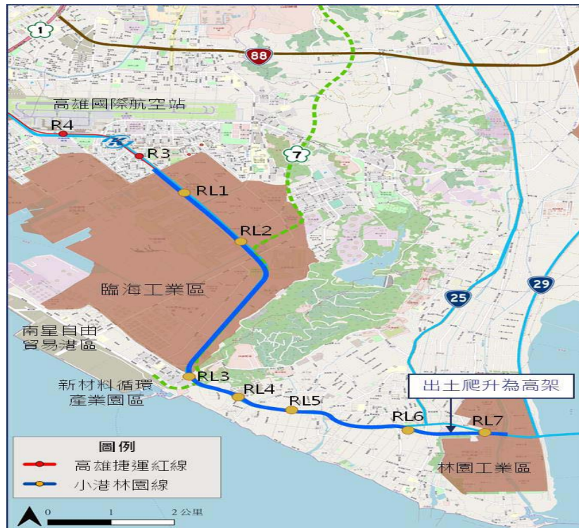
小港林園線路線方案示意圖

環境影響評估作業，依法令規定之調查作業已完成，110 年 11 月 30 日辦理環境影響說明書公開會議，110 年 12 月 21 日、111 年 1 月 25 日提送環境影響說明書至中央審查。環保署 111 年 6 月 29 日召開環評大會審議通過，8 月 16 日獲環保署備查。