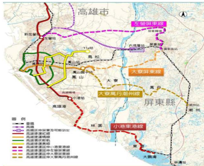
高雄捷運延伸屏東整體路網示意圖

後續依交通部頒布「大眾捷運系統建設及周邊土地開發計畫申請與審查作業要點」規定，依序辦理可行性研究、綜合規劃及施工前準備等三階段作業。