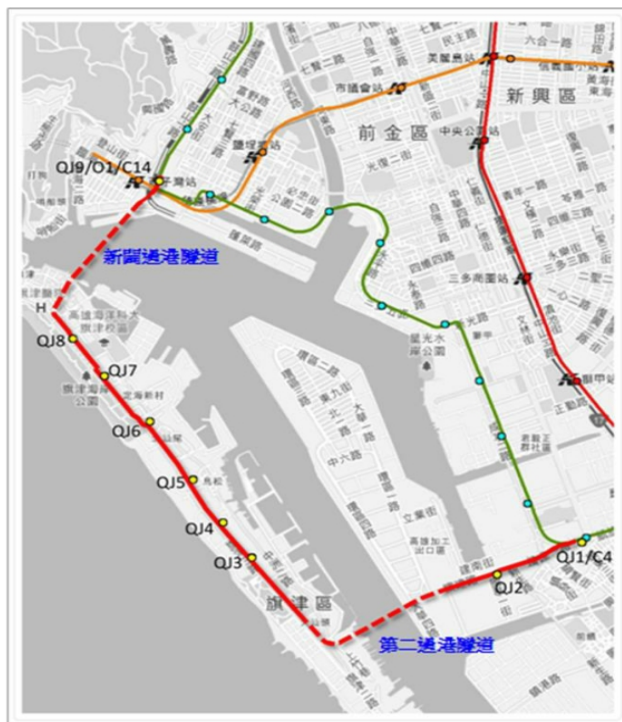
旗津線路線示意圖

108 年 5 月 2 日同意審定工作計畫書，經召開多次工作會議後，可行性研究期中報告於 109 年 3 月 16 日同意審定，期末報告於 111 年 12 月 5 日同意審定，本案配合本府交通局辦理第二過港隧道可研乙案，目前評估旗津線與第二過港隧道共構可行性低，且旗津線可行性研究規劃結果尚未符合審查作業要點門檻，後續俟地方民代及民眾輿情後，再行辦理後續計畫審議事宜。