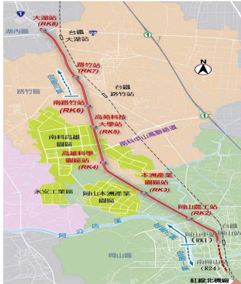
高雄捷運岡山路竹延伸線路線示意圖

高雄市東西向區域（包括茄萣、永安、湖內、阿蓮、田寮、旗山、美濃等）之互通皆需通過岡山、路竹，岡山路竹延伸線除可作為往北延伸之主要大眾運輸路廊外，更可作為東西向各區域轉乘據點，提昇大高雄大眾運輸「面」向服務空間。