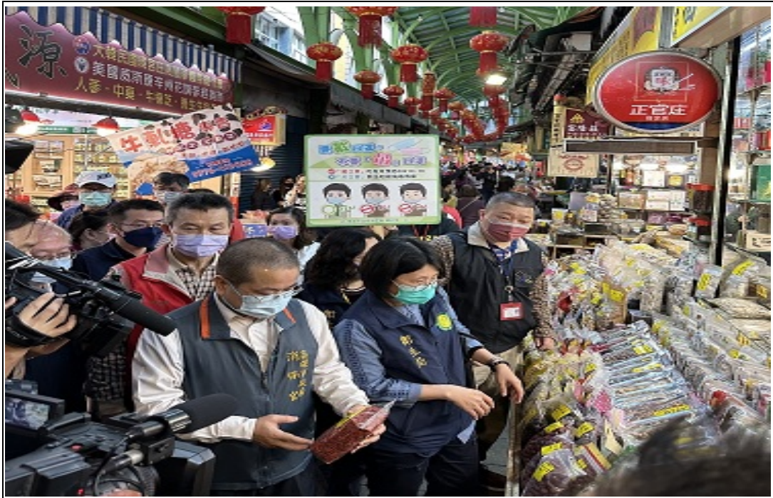
照片 25：本處消保官會同主管機關進行三鳳中街商品標示稽查