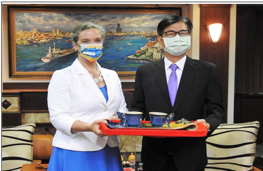
照片 14：美國在台協會孫曉雅處長訪高拜會陳其邁市長，討論經貿合作、城市產業轉型、民主與資訊安全等議題