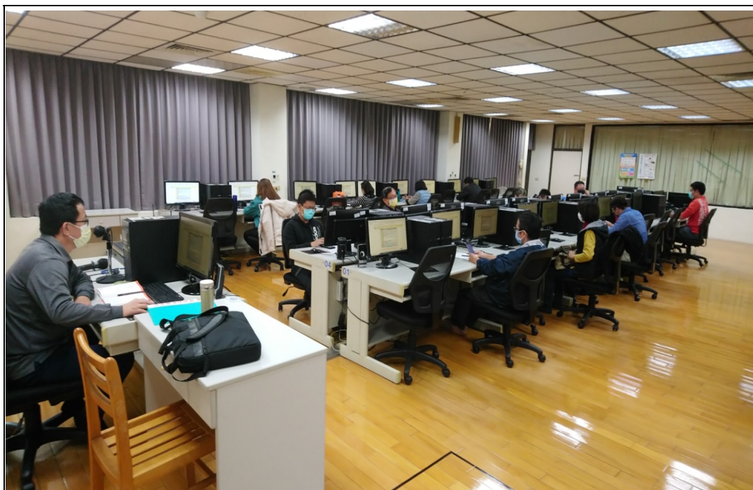
照片 23：職工人事系統功能說明與實機操作上課情形