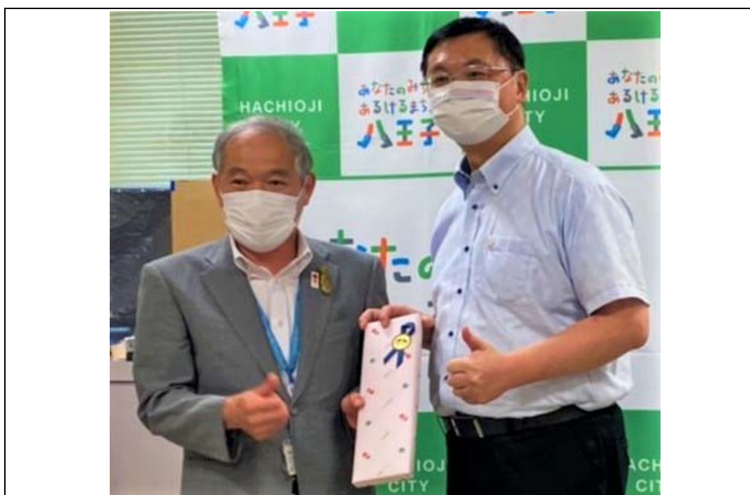
照片 1：羅達生副市長出訪日本拜會八王子友好城市駒澤廣行副市長

大使、聖文森及格瑞納丁柏安卓大使、吐瓦魯國潘恩紐大使、帛琉共和國歐儒侃大使、海地共和國潘恩大使、聖克里斯多福及尼維斯范東亞大使、日本東京都小池百合子知事、「日華議員懇談會」會長古屋圭司眾議員、美國聖安東尼市朗·尼倫伯格市長（視訊）、日本新潟縣佐渡市渡邊竜五市長、美國佛利蒙市黃潔宜副市長、日本三重縣一見勝之知事、聖克里斯多福及尼維斯青年暨兩性事務及社會發展部副部長菲莉普女士、日本富山縣冰見市林正之市長、芬蘭商務辦事處羅瑞代表等。