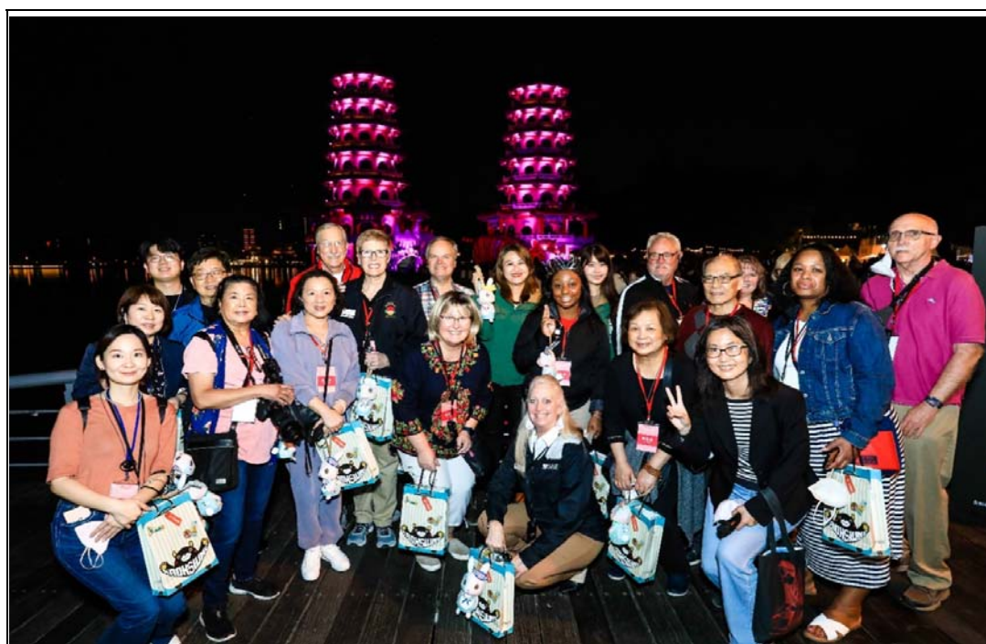
照片 8：本處邀請美國波特蘭市、日本熊本縣及熊本市、韓國水原市等 4 姊妹市及友好夥伴城市參與 2023 年高雄燈會