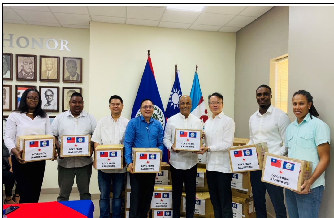
照片 6：駐貝里斯錢冠州大使（右三）代表陳其邁市長致贈貝市瓦格納市長（右四）高雄賑災物資（照片由駐貝里斯大使館提供）