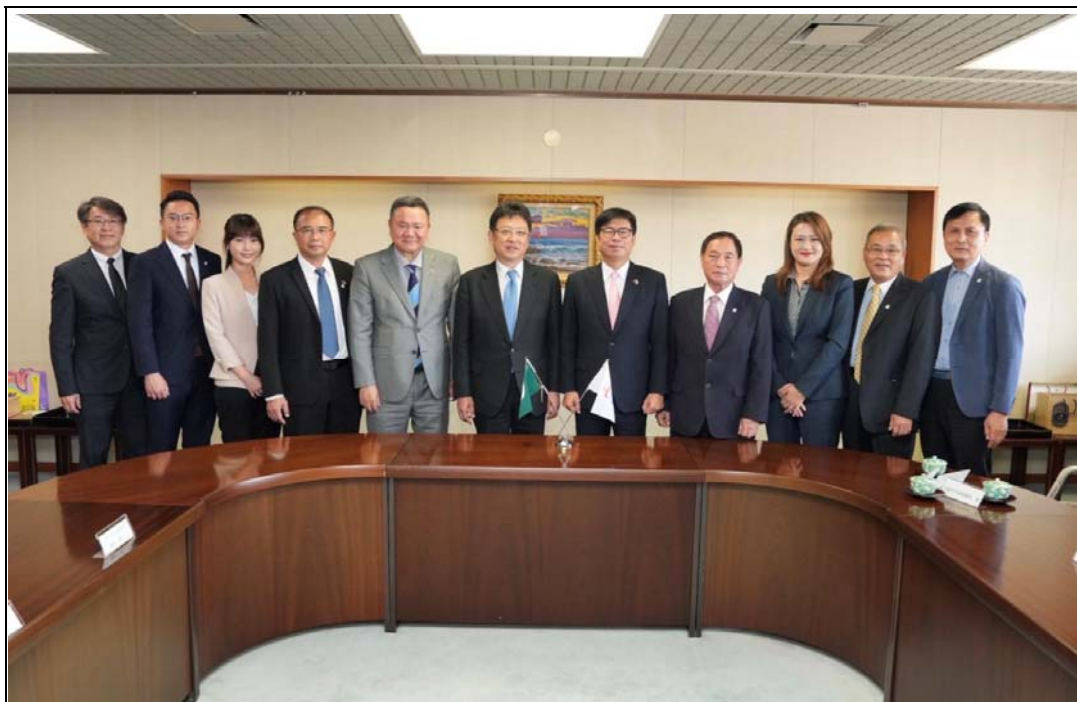
照片 10：陳其邁市長率團訪日拜會友好城市熊本市大西一史市長