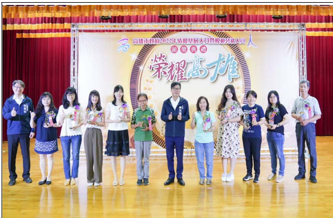
照片 24：2022 年績優基層人員表揚