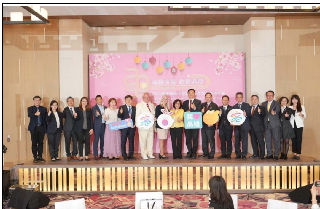
照片 9：舉辦歡迎午宴款待美國波特蘭市、日本熊本縣及熊本市、韓國水原市城市代表及在地貴賓