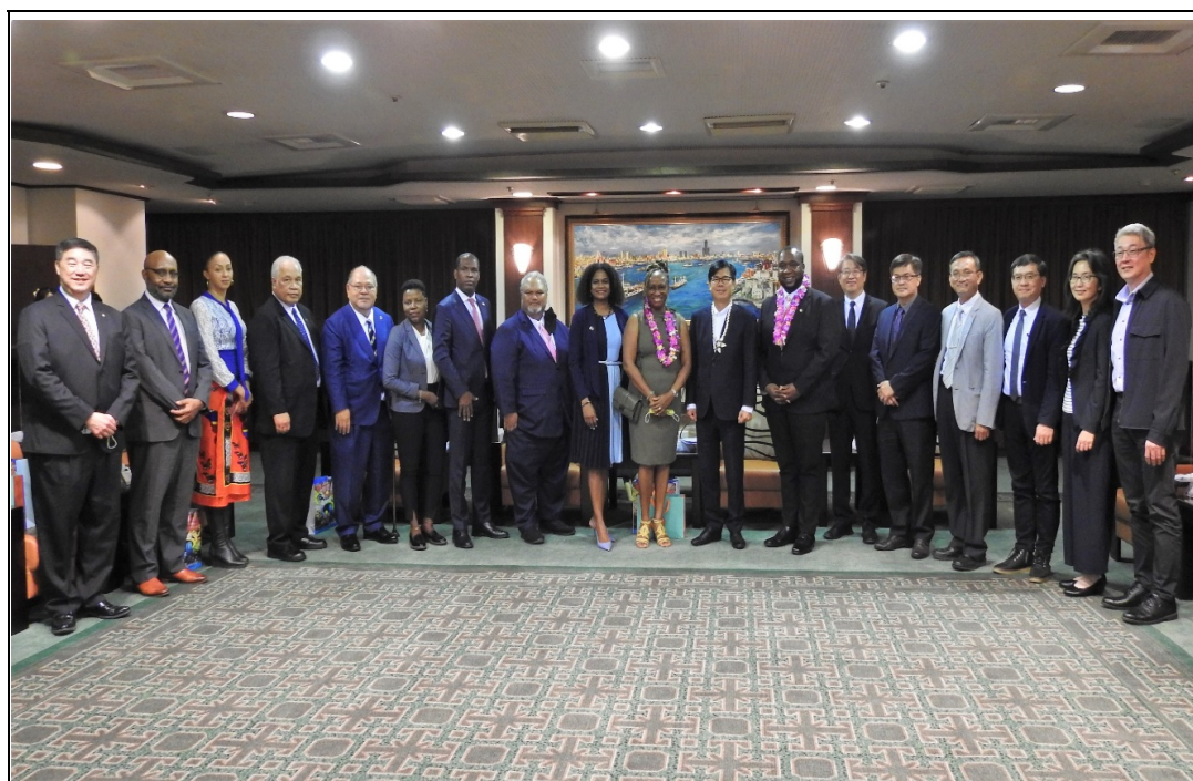
照片 17：9 國使節代表訪團拜會陳其邁市長，交換教育、農業、海洋產業等多元議題意見