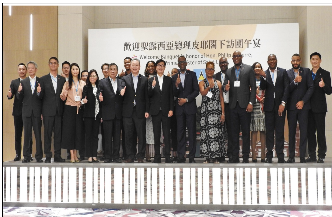
照片 16：友邦聖露西亞總理皮耶閣下（右八）訪高，與陳其邁市長就智慧城市、青年經濟、氣候變遷、農業發展等議題交換意見