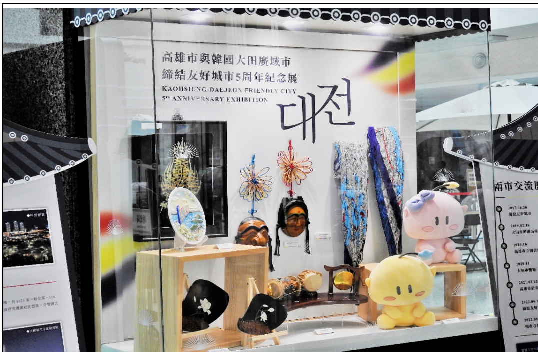
照片 5：本處舉辦「與韓國大田廣域市締結友好城市 5 周年紀念展」