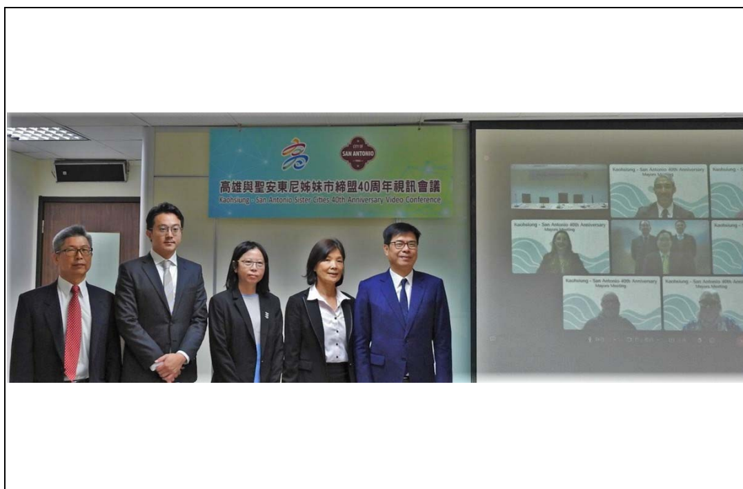
照片 3：陳其邁市長與美國聖安東尼市姊妹市朗·尼倫伯格市長進行視訊會議