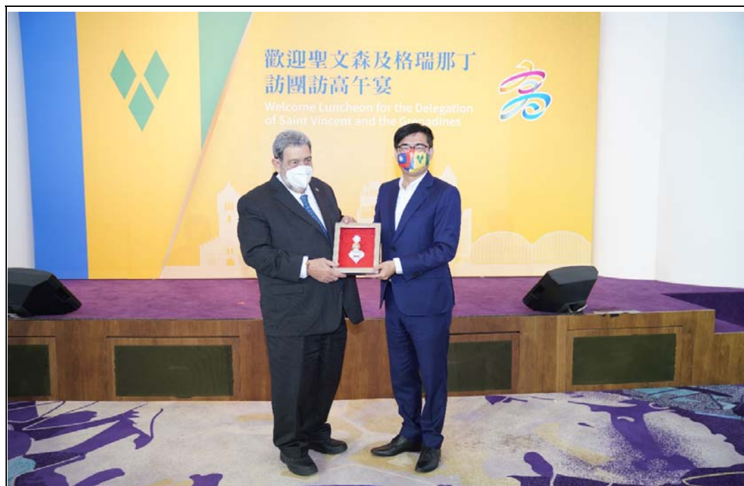
照片 13：陳其邁市長設宴歡迎聖文森及格瑞那丁龔薩福總理