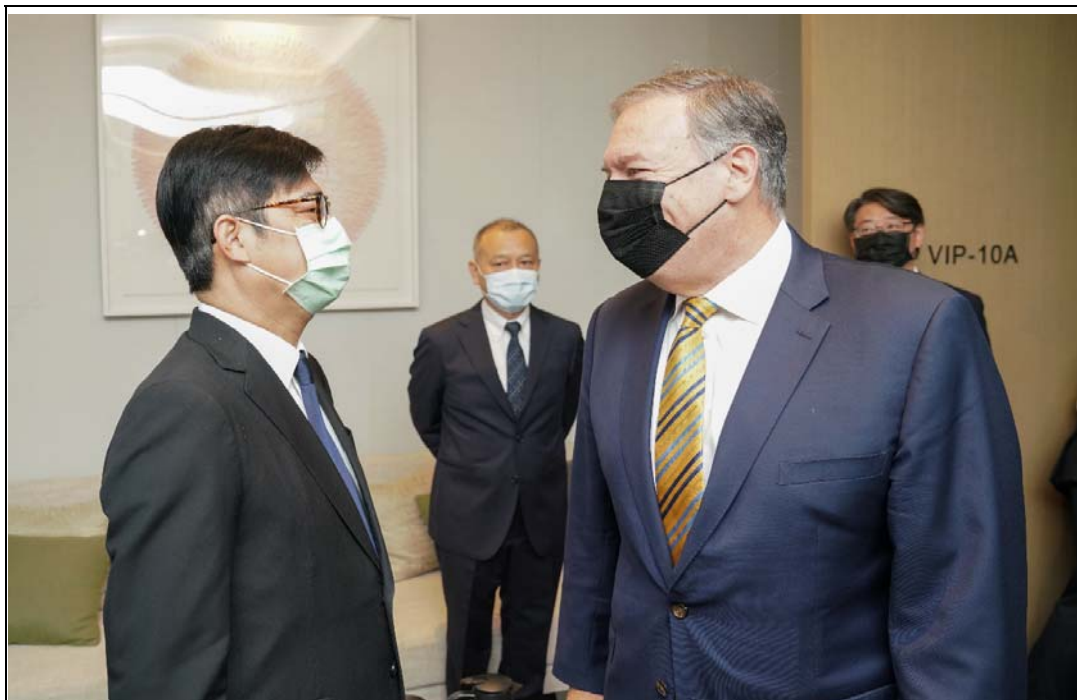
照片 15：美國前國務卿龐培歐訪高與陳其邁市長會面