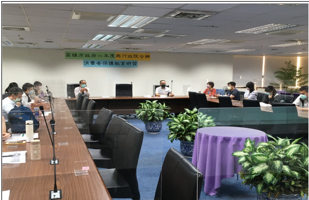
照片 26：本處與行政院合辦消費者保護教育研習