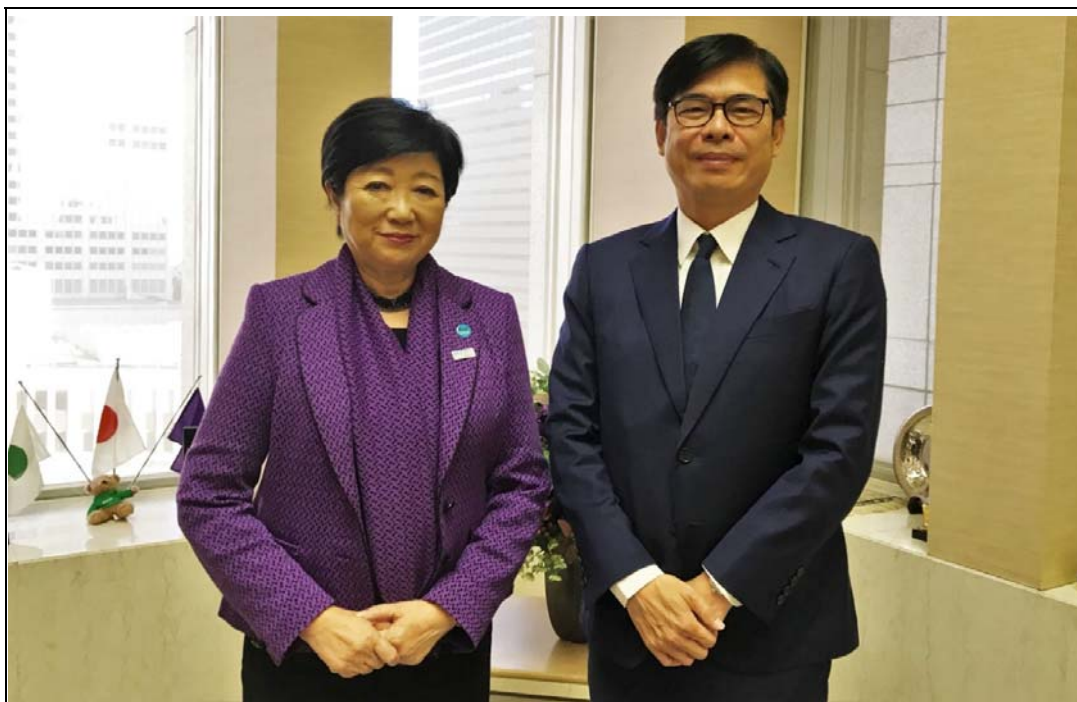
照片 18：陳其邁市長拜會東京都小池百合子知事，暢談城市交流與台海安全議題