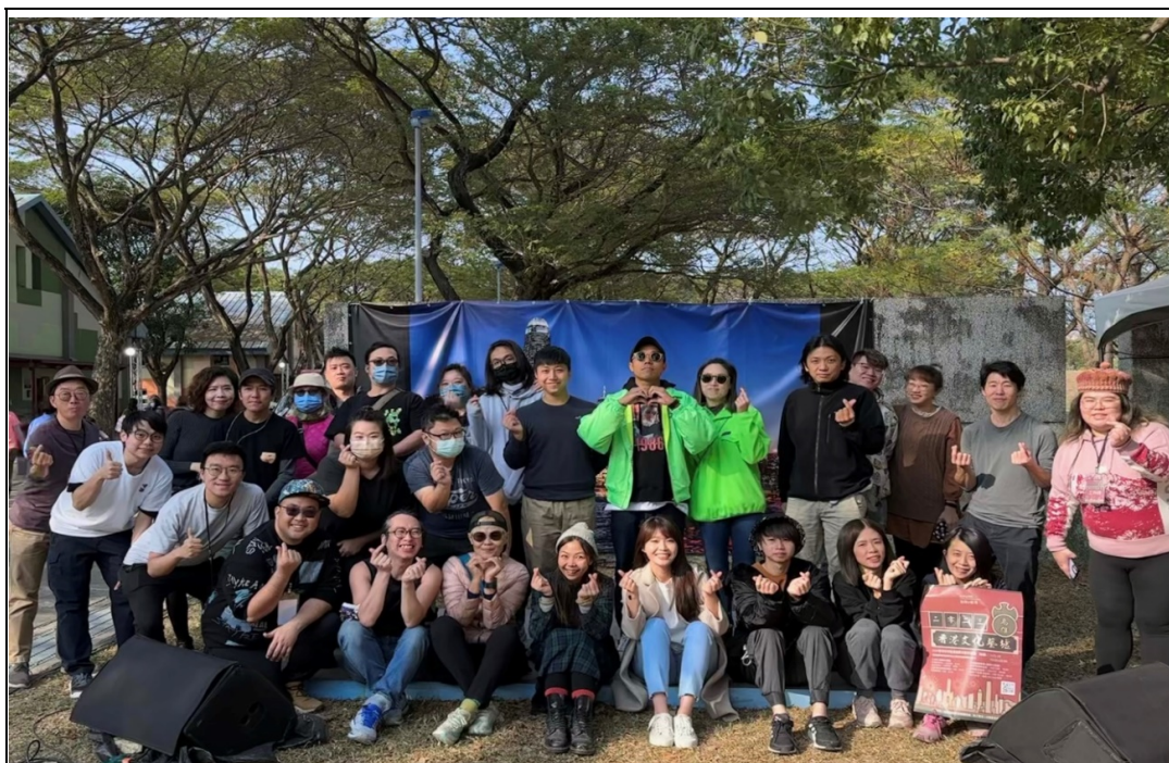
照片 20：本處首度與台灣香港協會合辦「2023 香港年宵在高雄藝文展演活動」，呈現道地香港過年氣氛，讓台灣民眾更認識香港文化