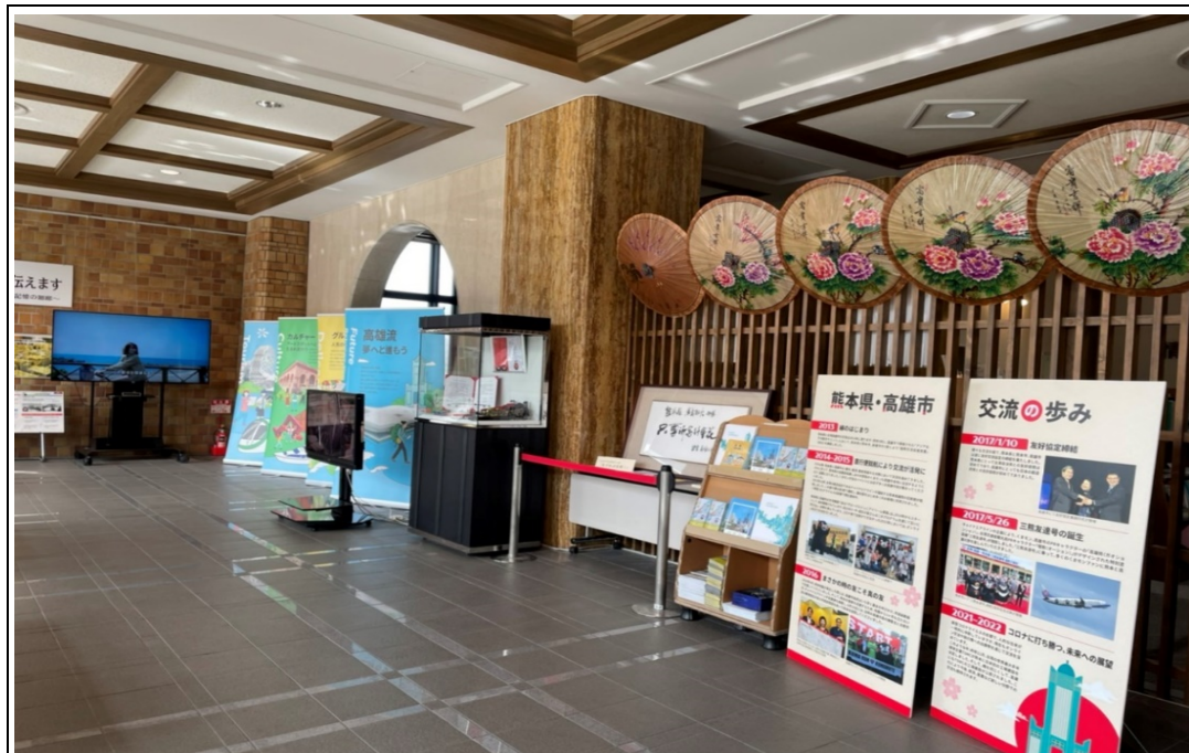
照片 5：日本熊本縣政府於縣府大廳展出高雄文化紀念品並播映本市行銷影片，慶祝高雄市與熊本縣、熊本市締結友好城市 5 週年