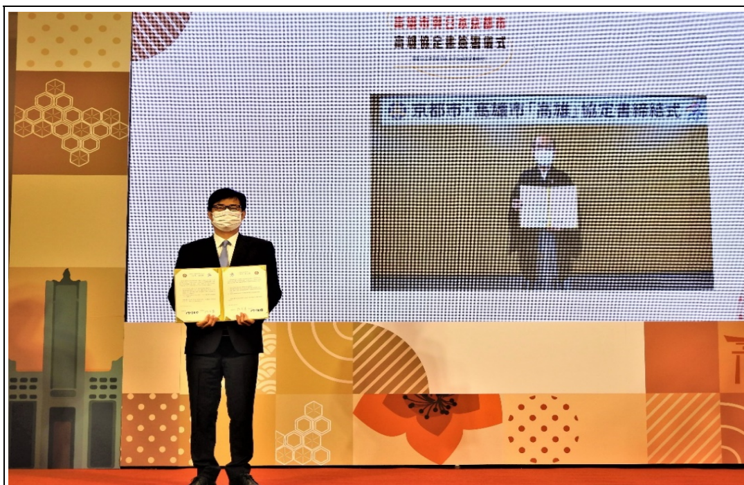
照片 7：陳其邁市長與日本京都市門川大作市長跨國連線簽署高雄協定書，推展運動、傳統藝能、文化、藝術、產業等領域友好交流