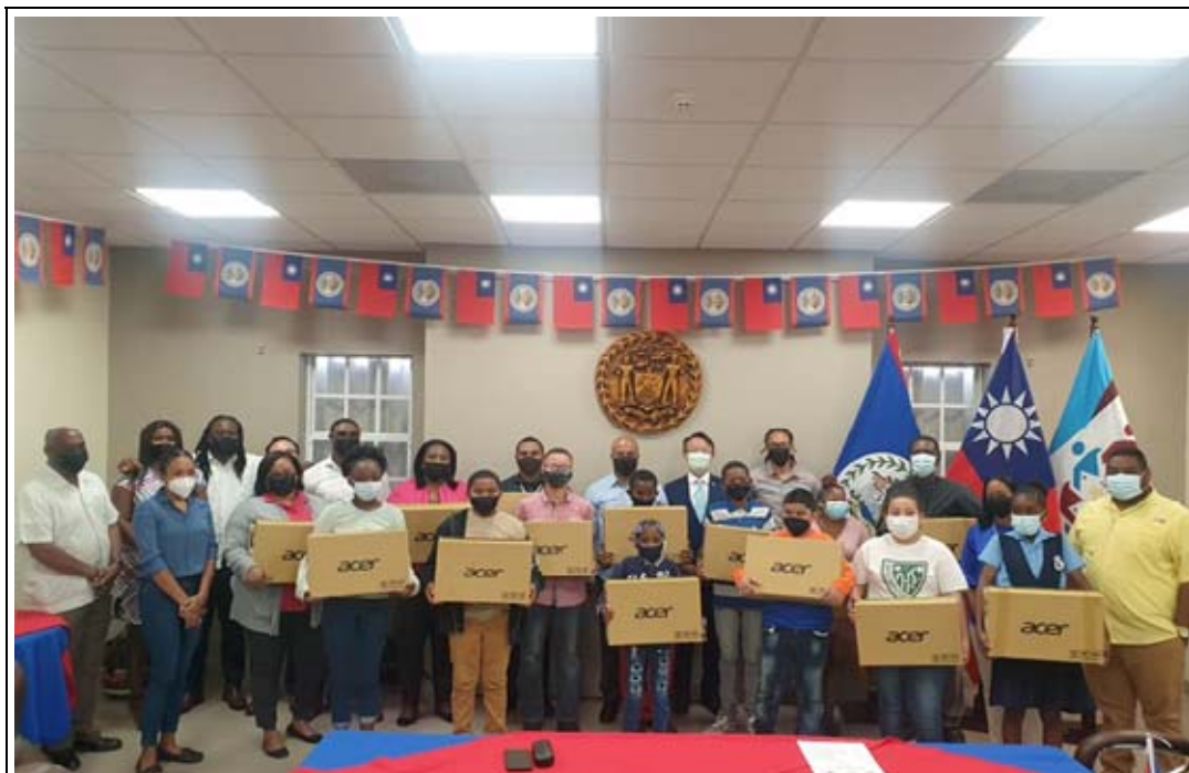
照片 6：本市致贈筆電予貝里斯市儀式合影