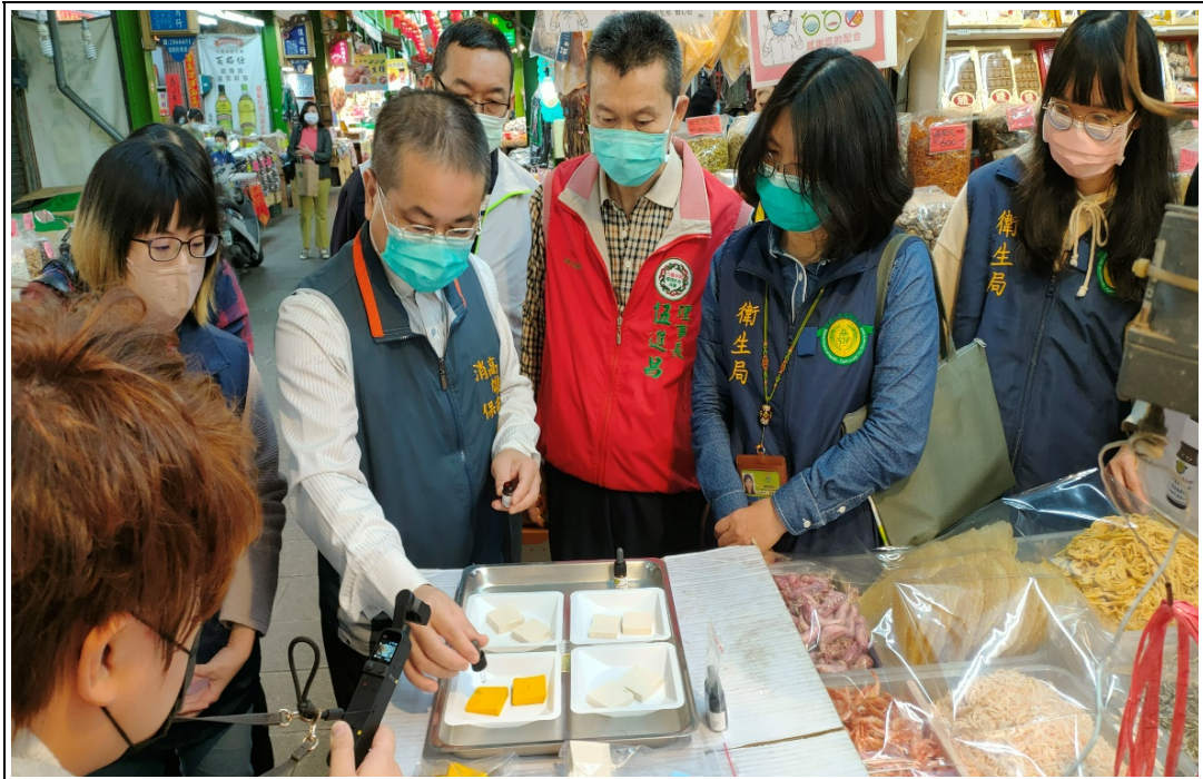
照片 17：會同相關主管機關聯合稽查年節民生消費食品安全及物價查訪