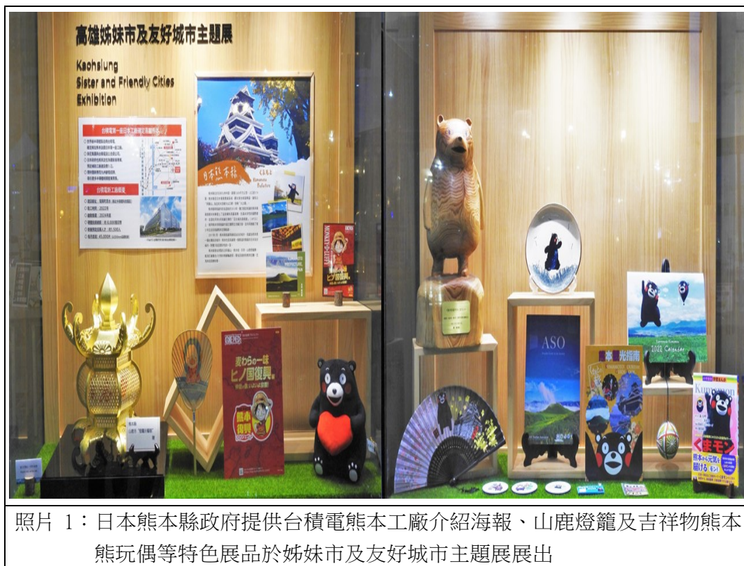
照片 1：日本熊本縣政府提供台積電熊本工廠介紹海報、山鹿燈籠及吉祥物熊本熊玩偶等特色展品於姊妹市及友好城市主題展展出

本市與長興材料工業股份有限公司聯手於110年12月22日跨國視訊捐贈COVID-19抗原及抗體快篩試劑計1萬劑，協助提升該國防疫能量，防止病毒傳播。（照片13）