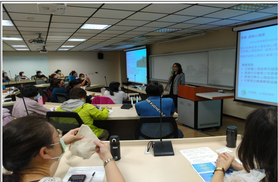
照片 15：職場人際關係與溝通技巧研習班上課情形