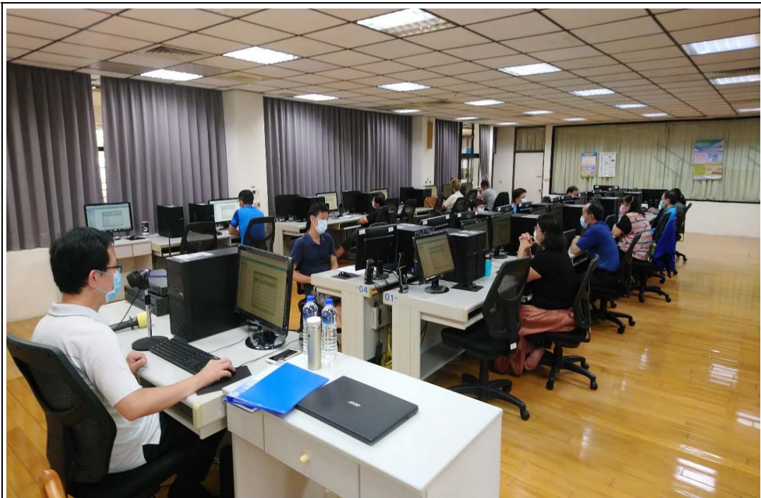
照片 14：職工人事系統功能說明與實機操作上課情形