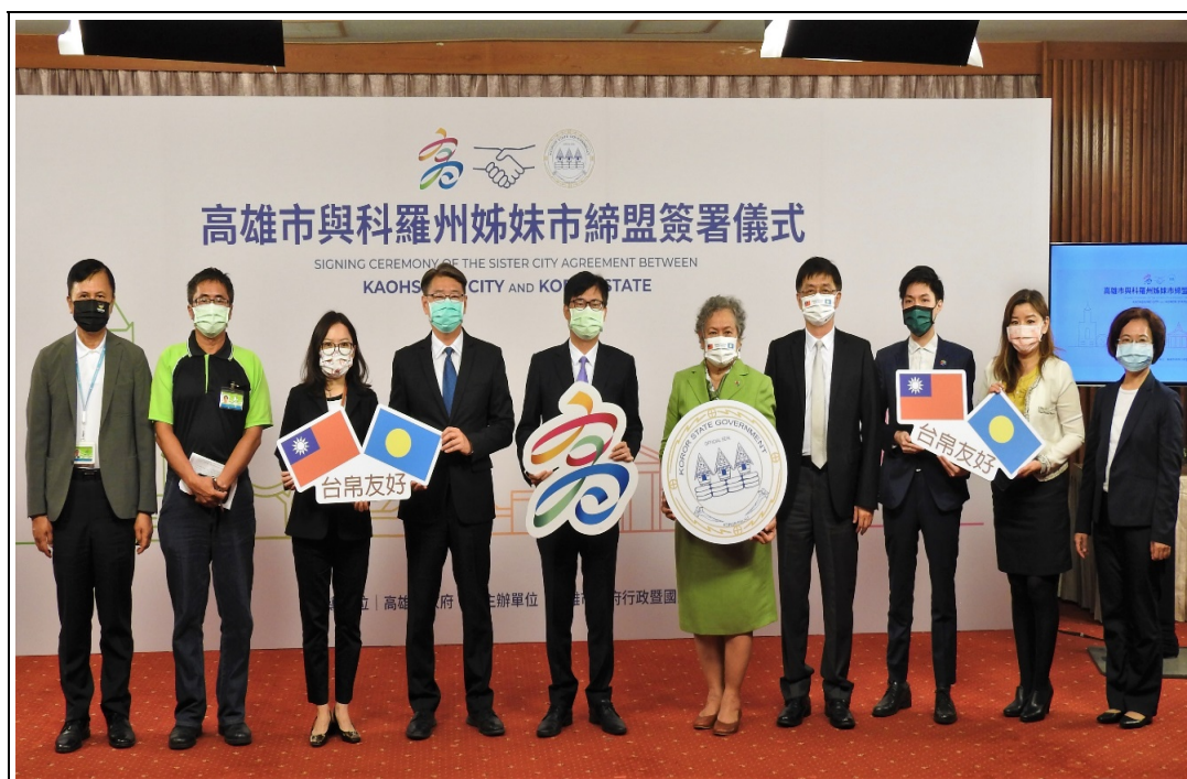
照片 8：本市在帛國駐台大使歐克麗（右五）見證下與帛琉共和國科羅州締結為姊妹市，展開觀光、文化、海洋、經貿等領域實質合作