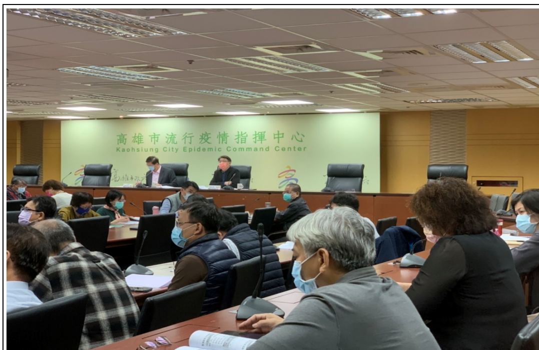
照片 16：召開 110 年第 2 次市府消費者保護委員會議

為積極協助消費者重建經濟生活，本處與財團法人法律扶助基金會高雄分會合辦債務清理法律諮詢駐點服務，本期共計辦理 21 場次，共有 141 人次前來市府消費者服務中心請求法律諮詢及協助。