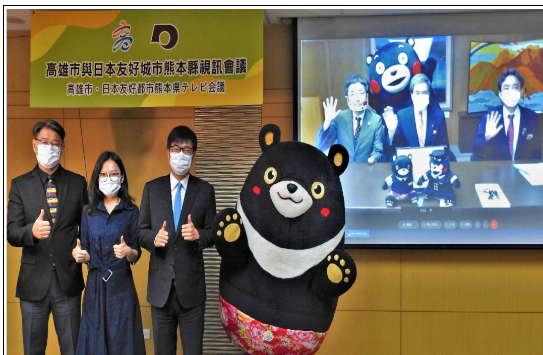
照片 2：日本熊本縣政府提供台積電熊本工廠介紹海報、山鹿燈籠及吉祥物熊本熊玩偶等特色展品於姊妹市及友好城市主題展展出