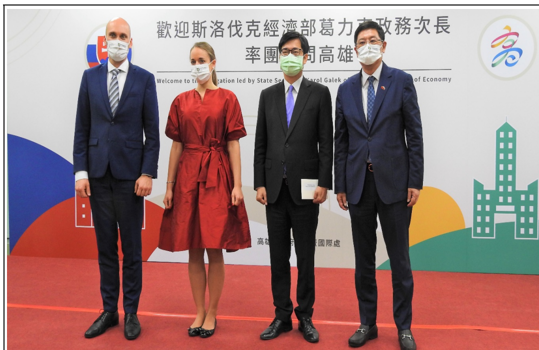
照片 9：斯洛伐克共和國經濟部葛力克政務次長（左一）率產官學代表團訪高，與本市就半導體產業、智慧城市等議題進行交流