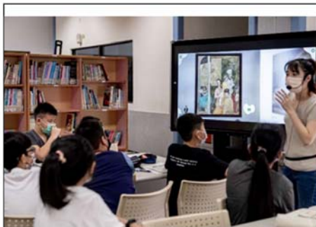
藝網情深:信義國小老師以書籍AR導賞開啟課程