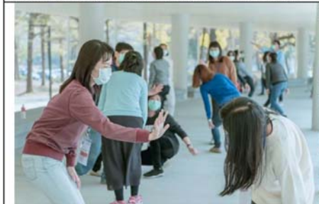
人才培力:五感 X 身體感—教師研習課程-肢體體驗課程