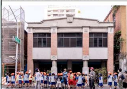
校園深耕:鼓山國小老師引導學生觀察建築外觀之特色