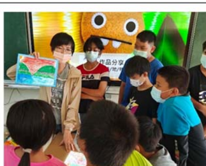
藝術家入校:小朋友好奇聽老師講解